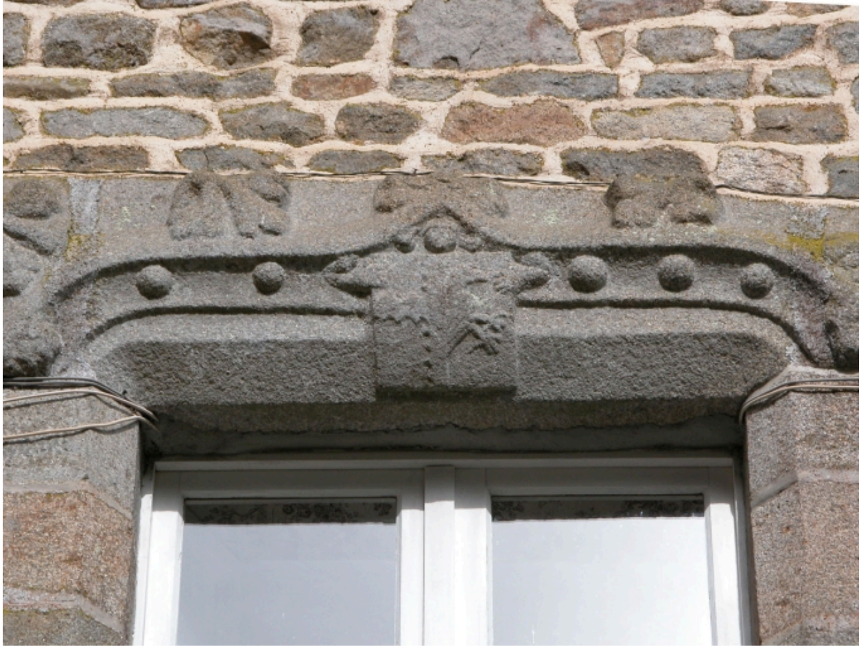
Détail : fenêtre, armoiries