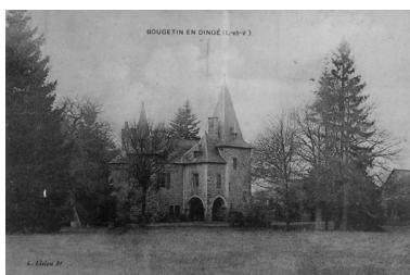
Carte postale IVR53_19883500199XB