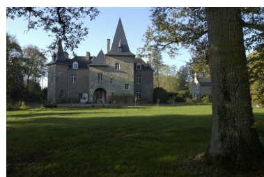
Vue générale est IVR53_20053503220NUCA