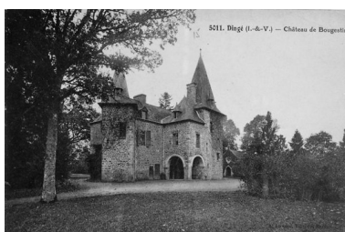
Carte postale IVR53_19883500198XB