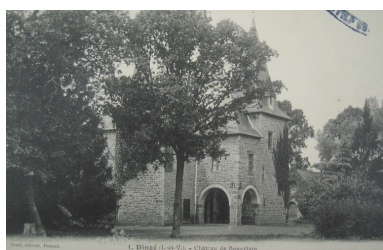
Carte postale IVR53_20053521714NUCA