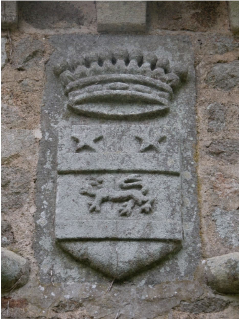
Chapelle, détail, armoiries