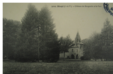
Carte postale IVR53_20053521713NUCA