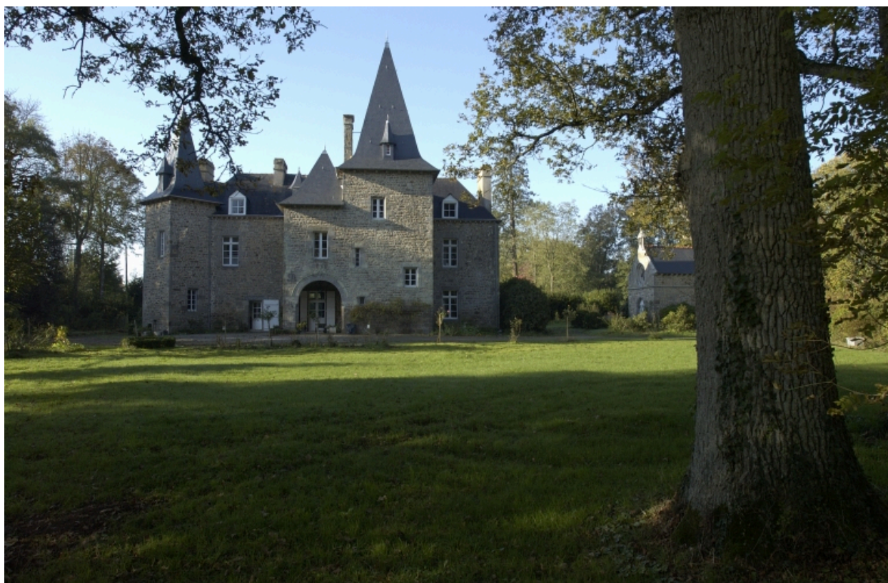
Vue générale est