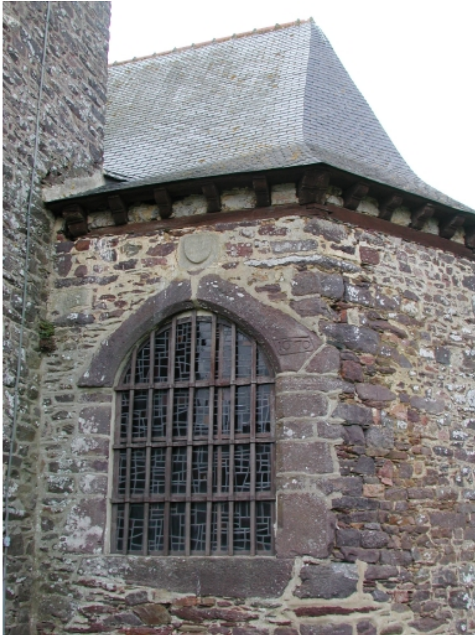
Chevet, vue extérieure