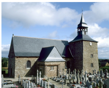
Elevation sud : vue générale IVR53_19923500749XA