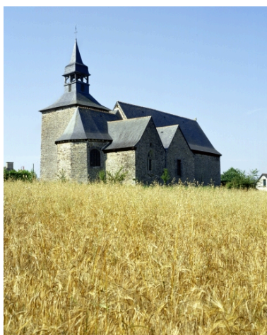
Vue générale du nord-est