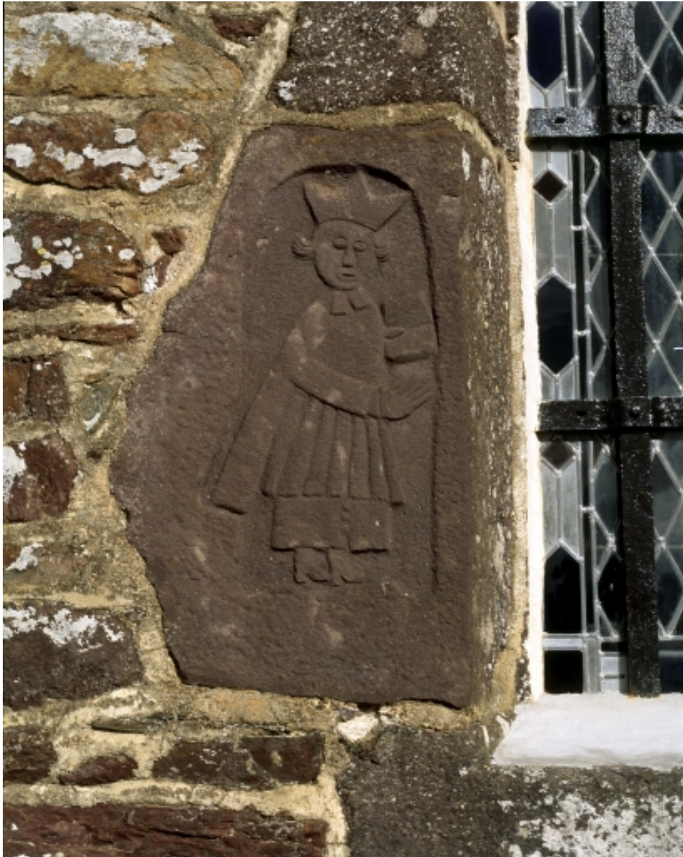
Bas-relief, prêtre bénissant