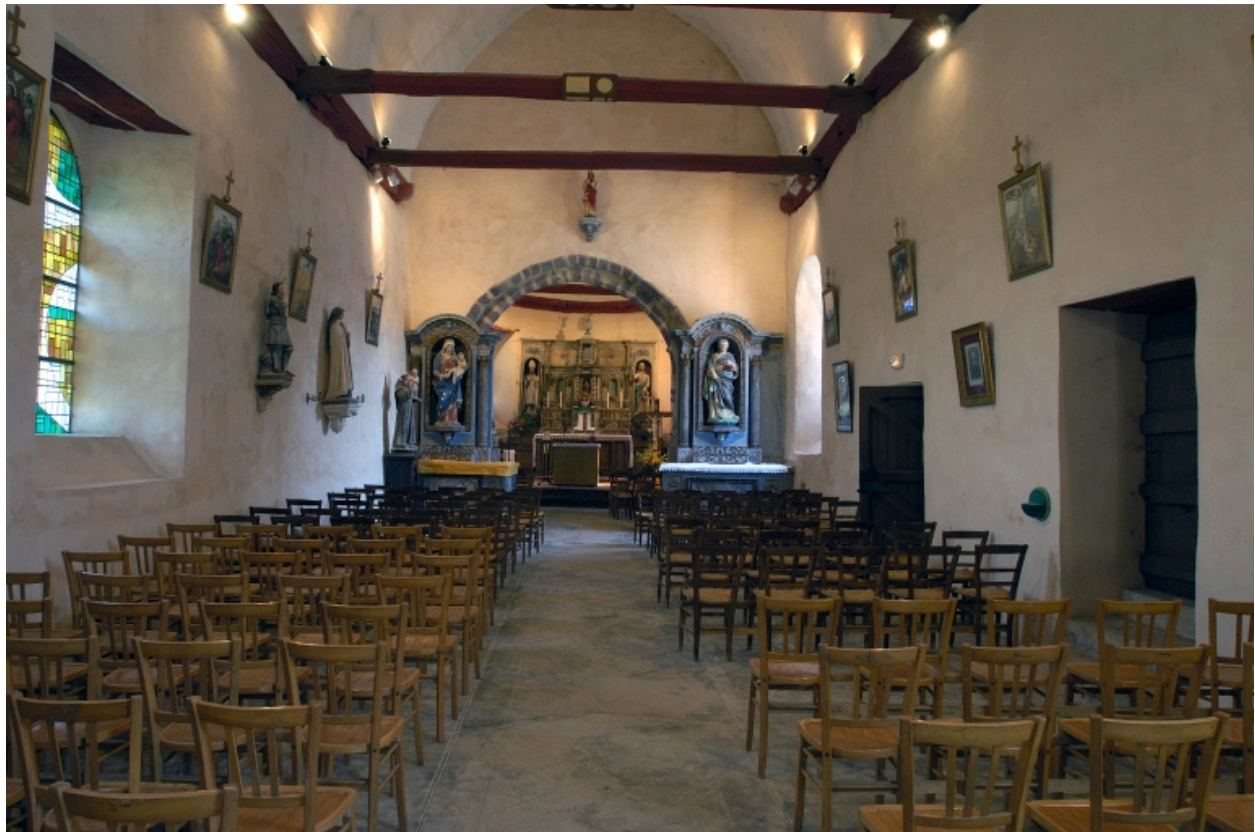
Vue intérieure, vue générale vers le chœur