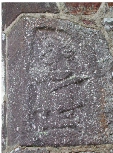
Bas relief, personnage pénitent à genoux.