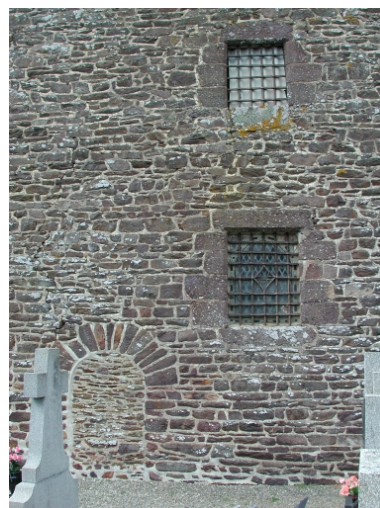
Tour-clocher, détail des baies