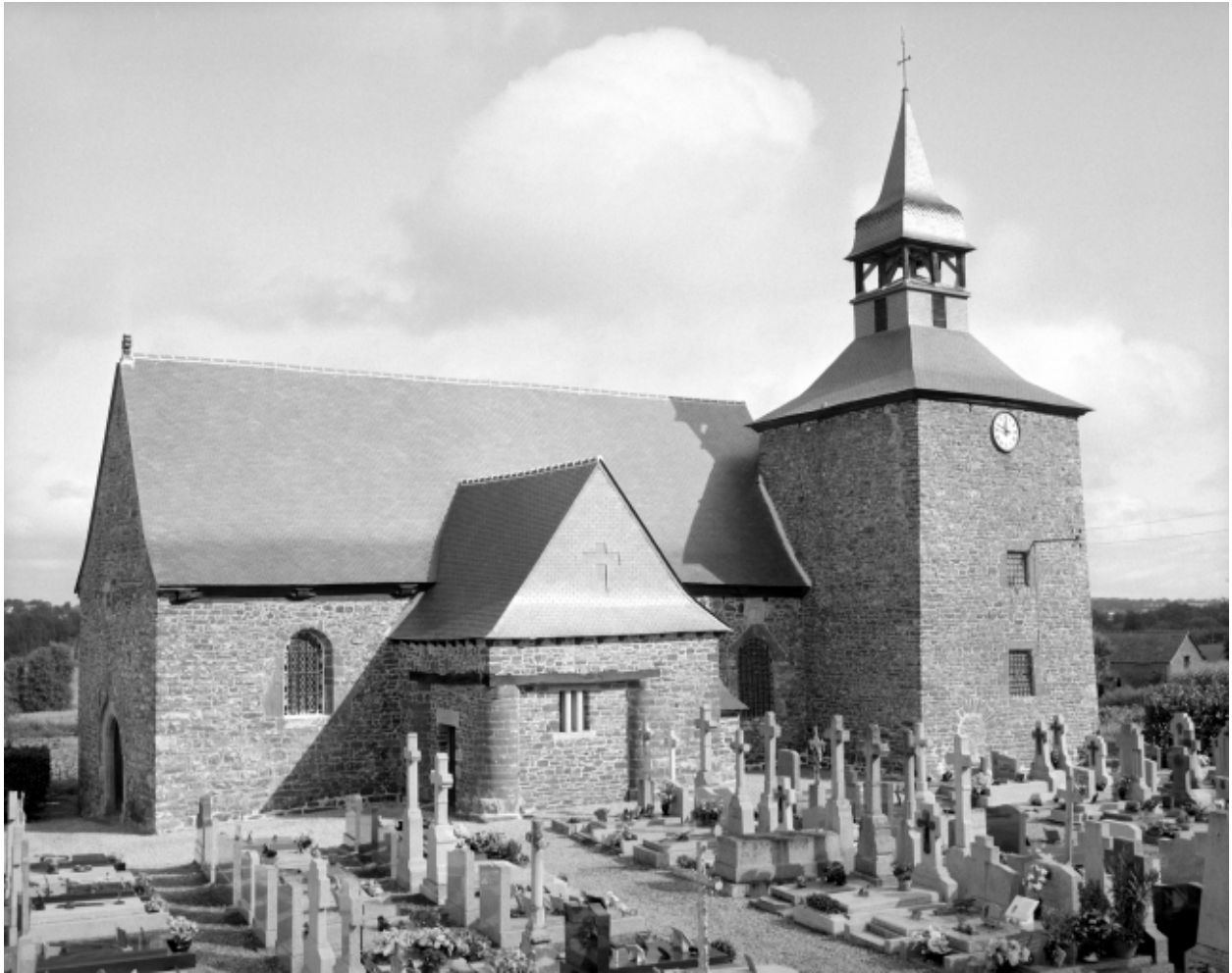
Elevation sud : vue générale