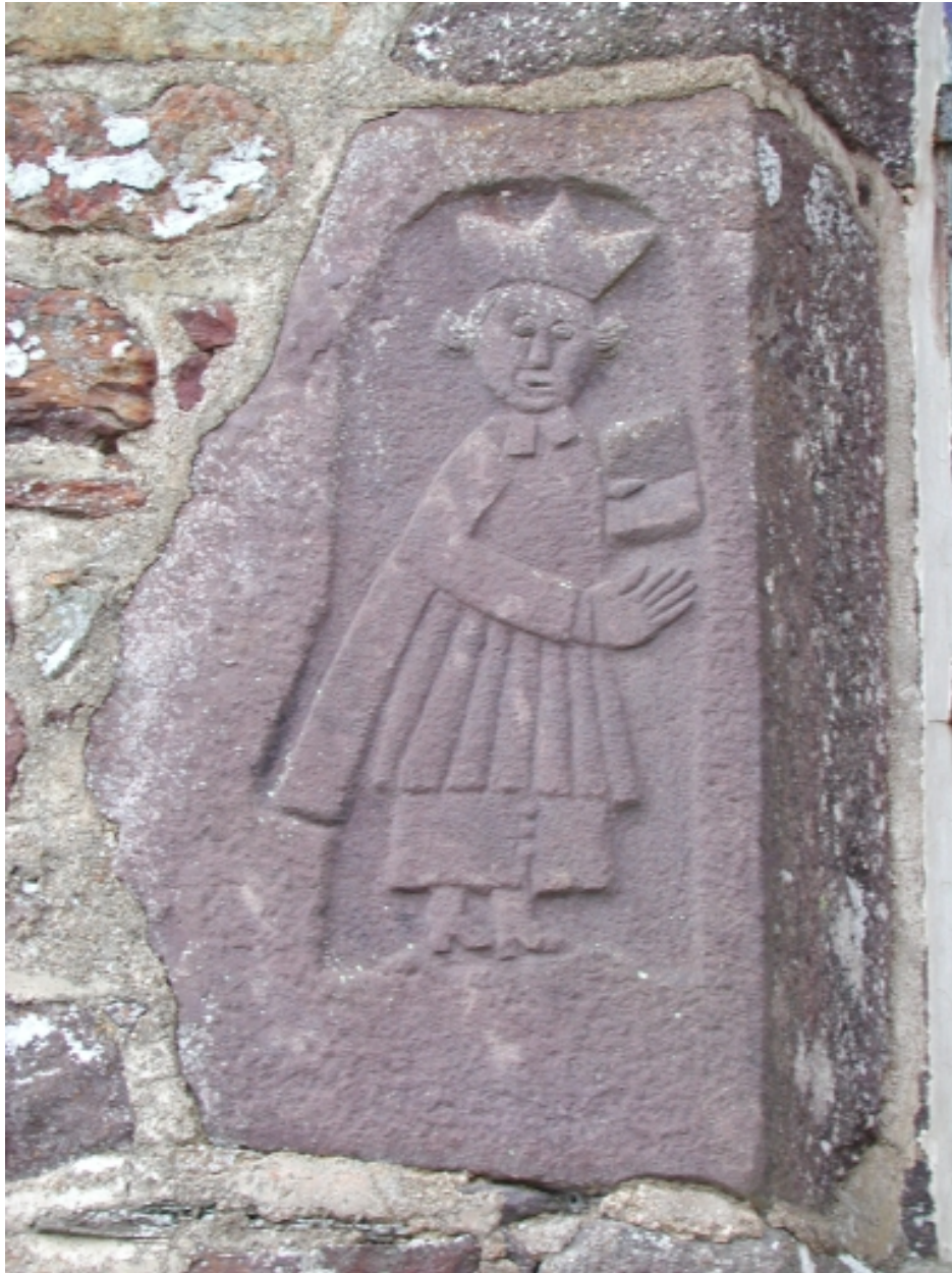
Bas-relief, prêtre bénissant