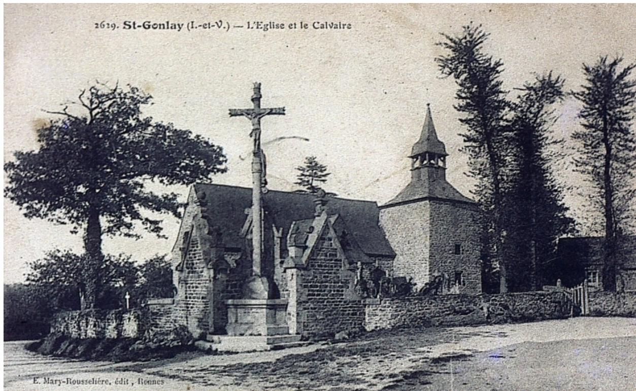
L'église et le cimetière sur une carte postale ancienne