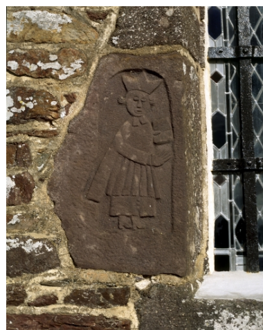
Bas-relief, prêtre bénissant IVR53_19923500750XA