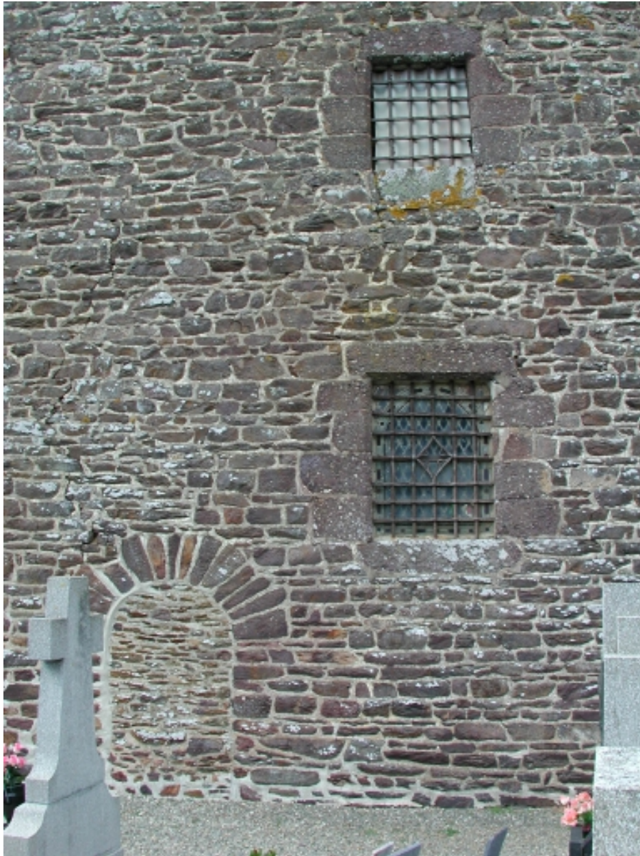
Tour-clocher, détail des baies