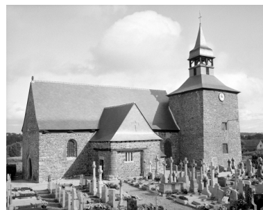
Elevation sud : vue générale IVR53_19923500747X