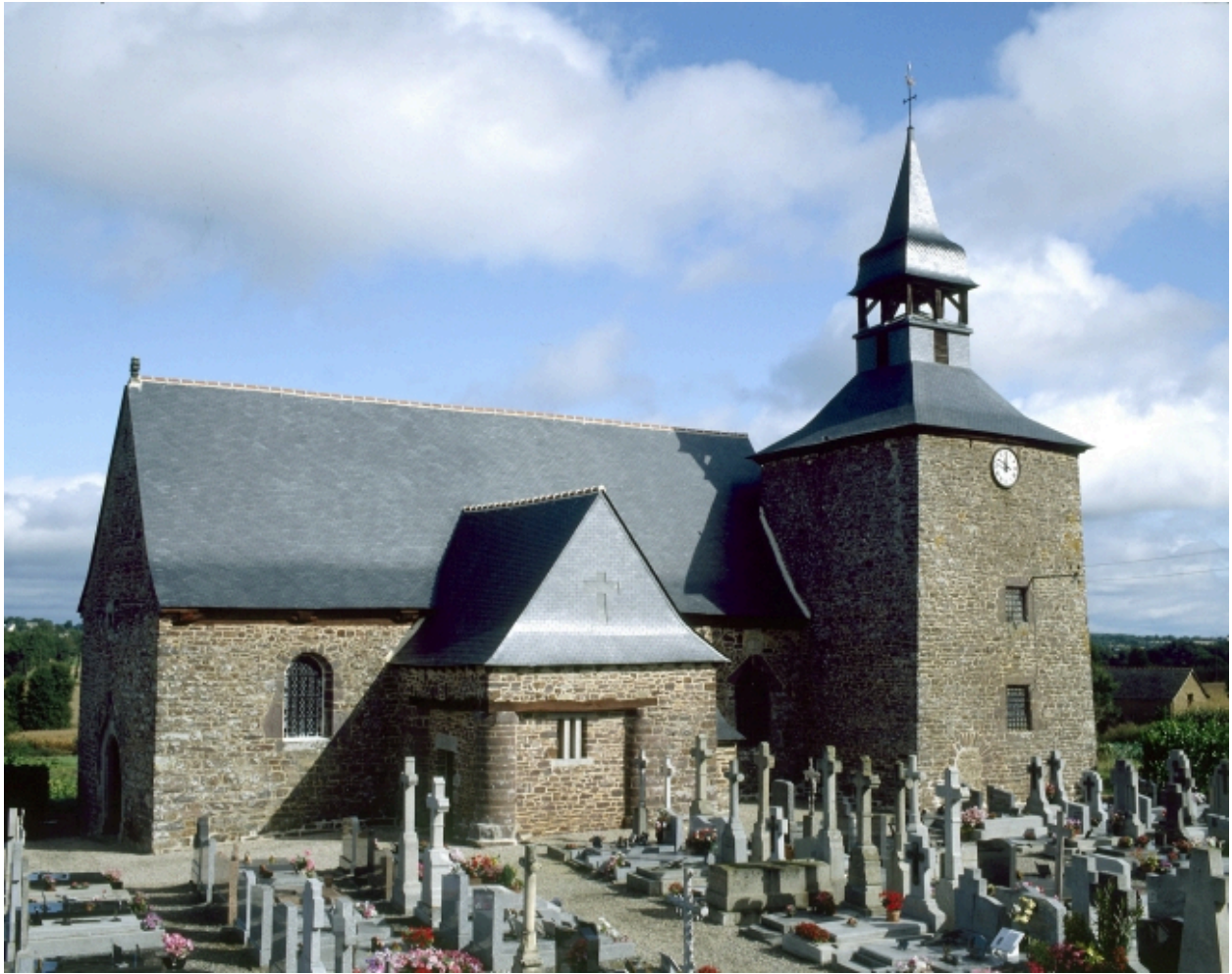
Elevation sud : vue générale