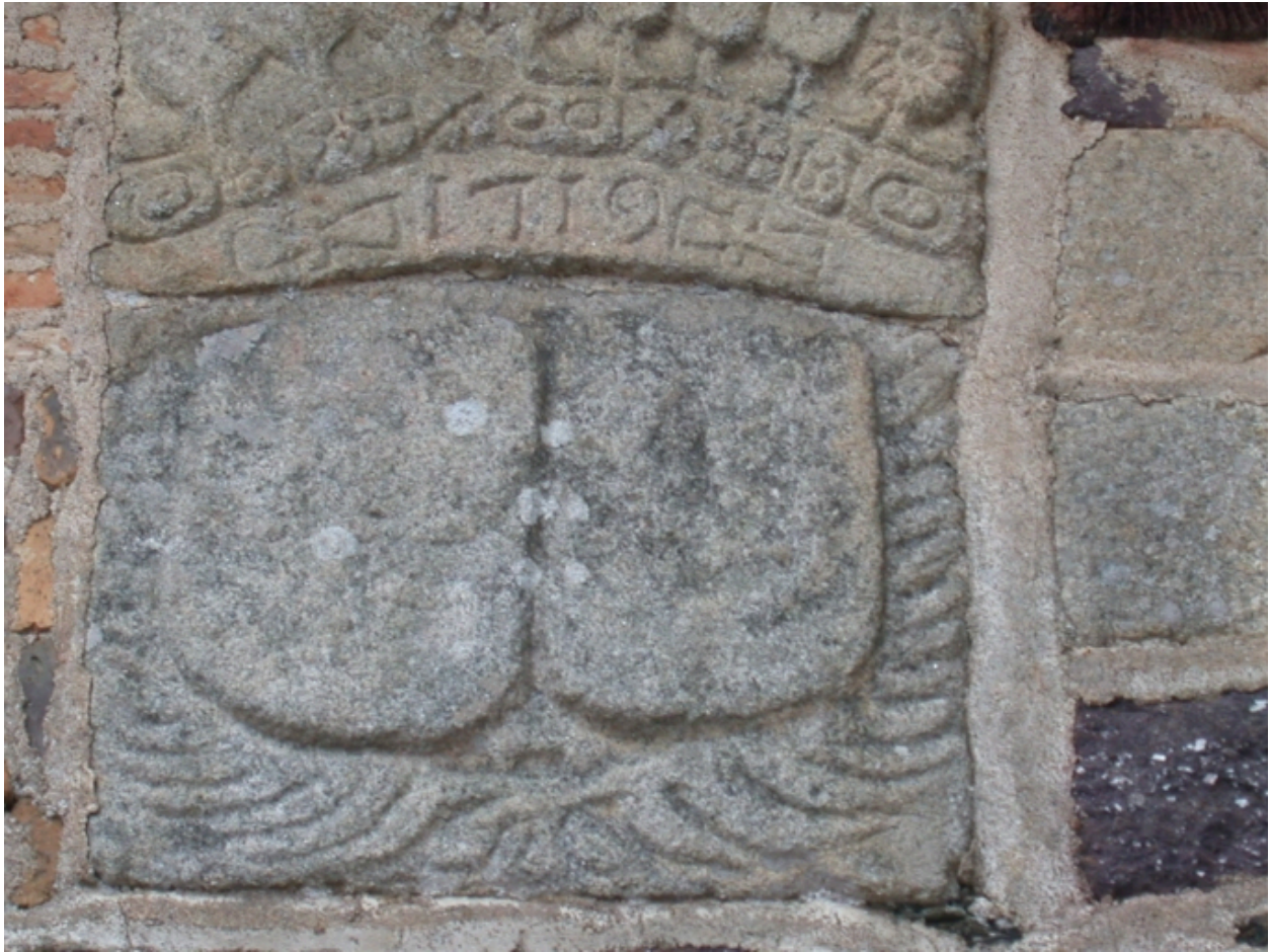
Détail, pierre sculptée au-dessus de la baie 6 : armes d'alliance illisibles sous une couronne comtale portant la date de 1719.