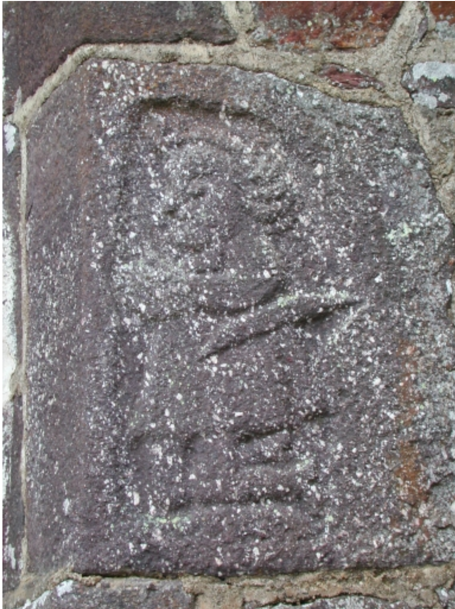
Bas relief, personnage pénitent à genoux.