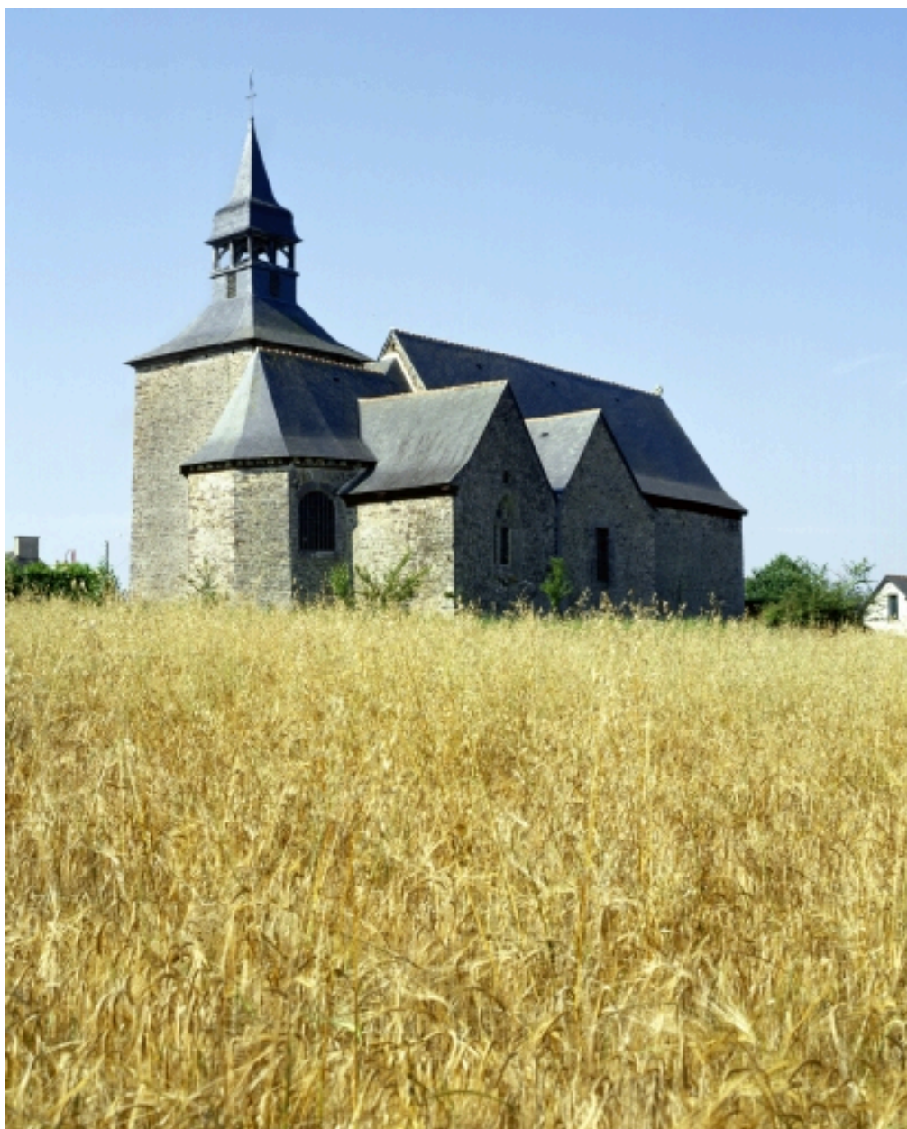
Vue générale du nord-est