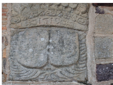
Détail, pierre sculptée au-dessus de la baie 6 : armes d'alliance illisibles sous une couronne comtale portant la date de 1719.