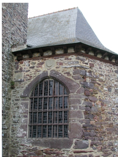
Chevet, vue extérieure IVR53_20033514189NUCA