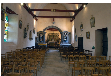
Vue intérieure, vue générale vers le chœur IVR53_20033501505NUCA