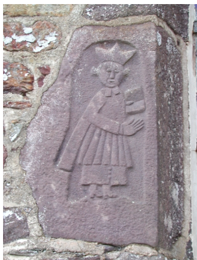
Bas-relief, prêtre bénissant IVR53_20033514187NUCA