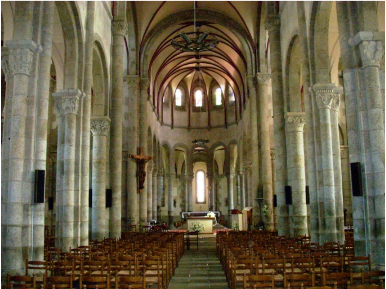
Lannilis, église paroissiale : vue axiale est