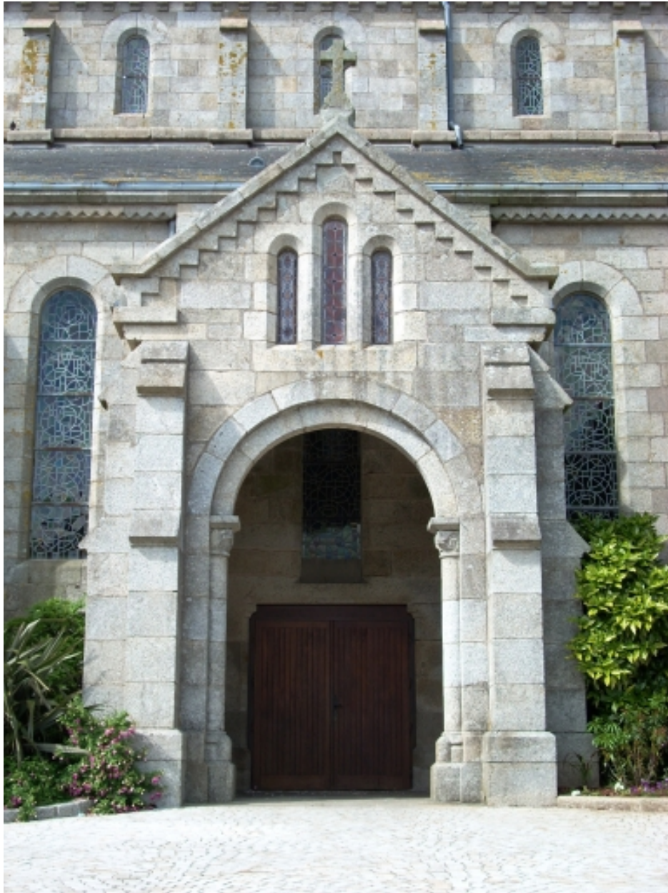
Lannilis, église paroissiale : vue du porche sud