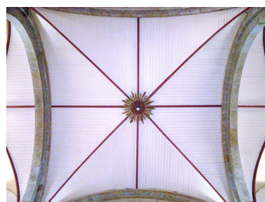
Lannilis, église paroissiale : détail du lambris à la croisée du transept IVR53_20082906133NUCA