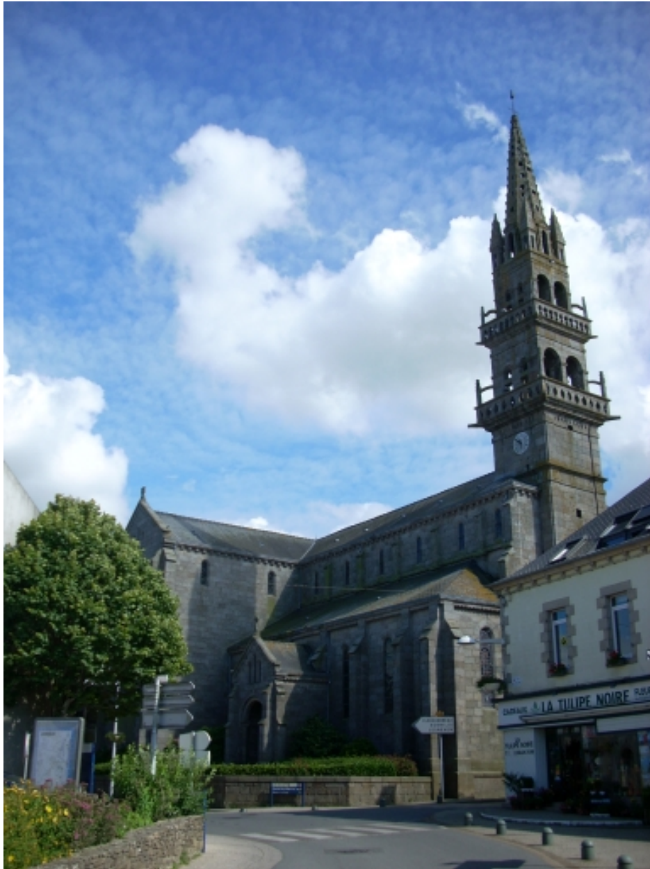
Lannilis, église paroissiale : vue générale nord-ouest