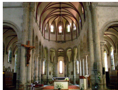
Lannilis, église paroissiale : vue du choeur depuis la croisée du transept