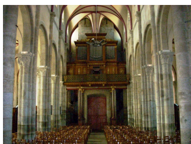
Lannilis, église paroissiale : vue axiale ouest