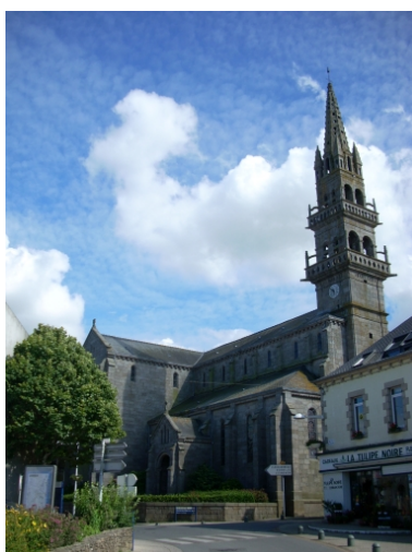
Lannilis, église paroissiale : vue générale nord-ouest IVR53_20082906126NUCA