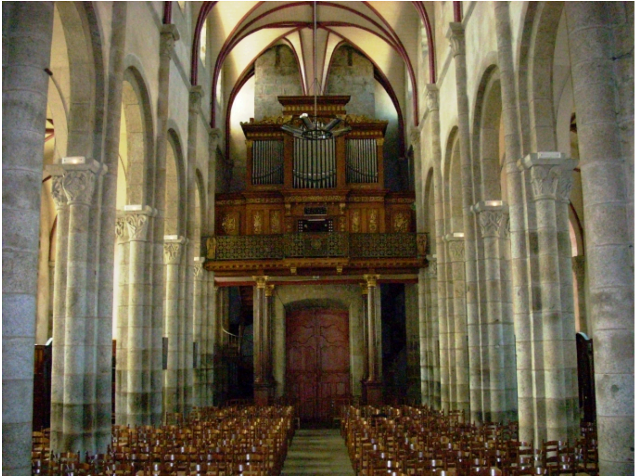
Lannilis, église paroissiale : vue axiale ouest