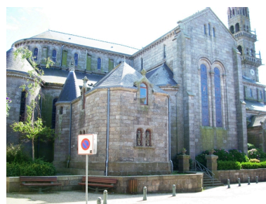
Lannilis, église paroissiale : vue générale nord-est