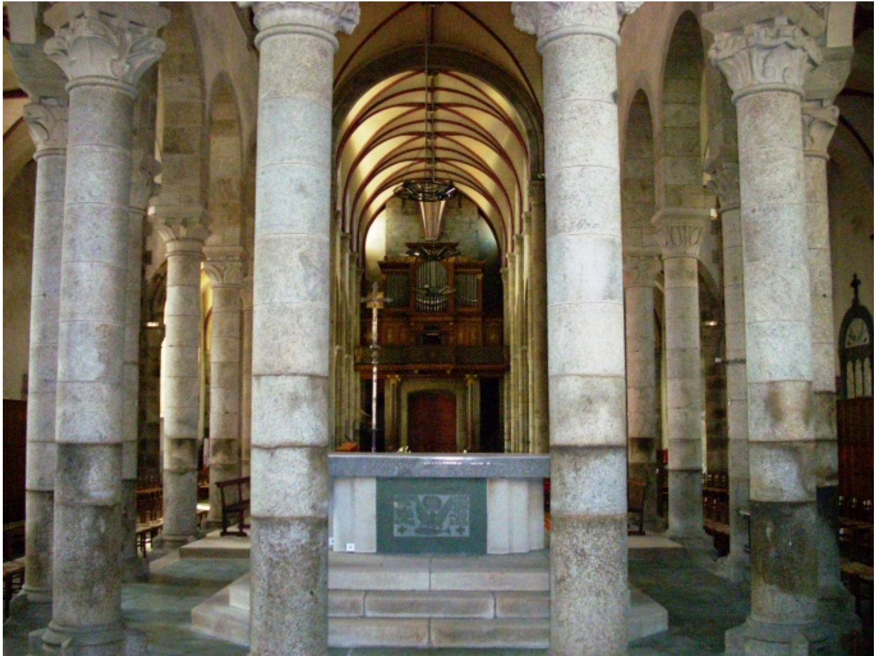
Lannilis, église paroissiale : vue du choeur vers l'ouest depuis la chapelle axiale