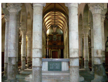
Lannilis, église paroissiale : vue du choeur vers l'ouest depuis la chapelle axiale IVR53_20082906132NUCA