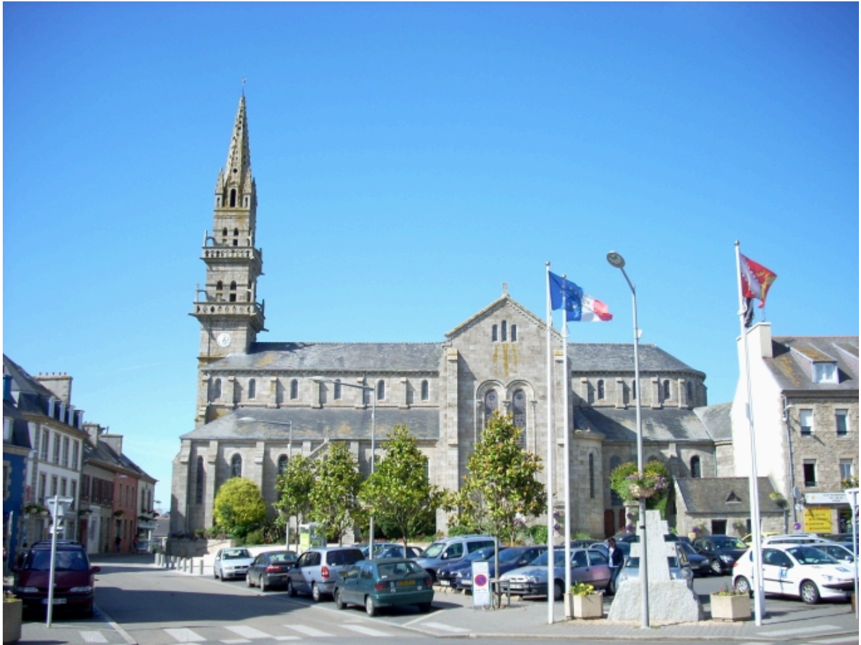
Lannilis, église paroissiale : vue générale sud