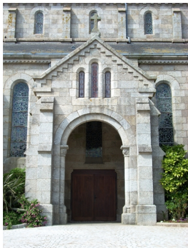
Lannilis, église paroissiale : vue du porche sud IVR53_20082906128NUCA