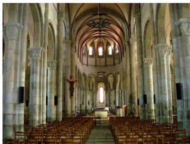
Lannilis, église paroissiale : vue axiale est IVR53_20082906129NUCA