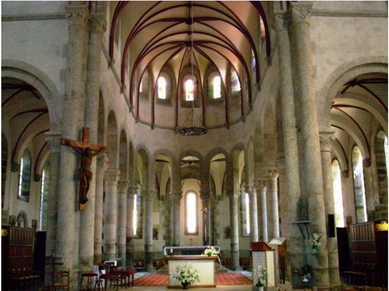
Lannilis, église paroissiale : vue du chœur depuis la croisée du transept