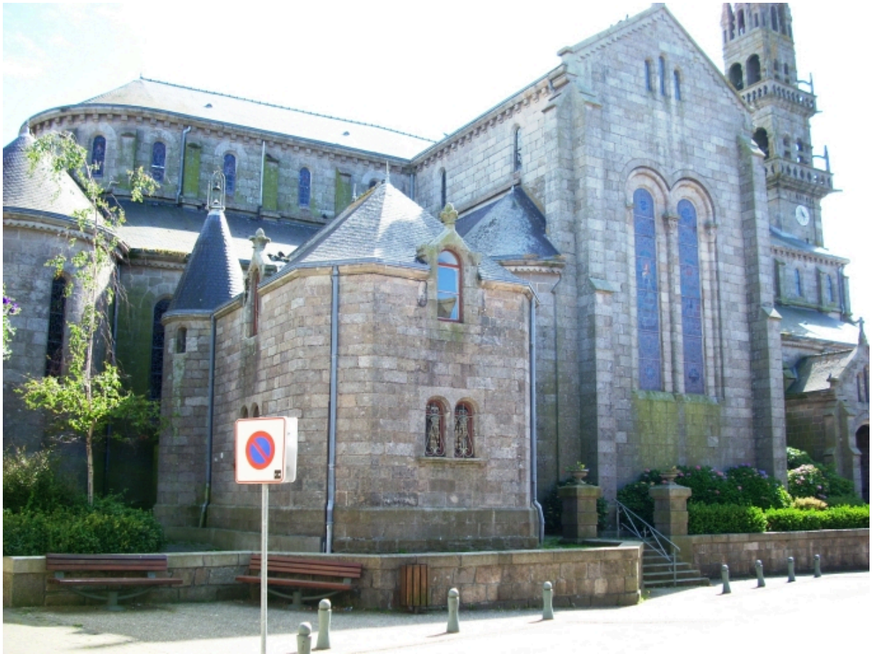
Lannilis, église paroissiale : vue générale nord-est