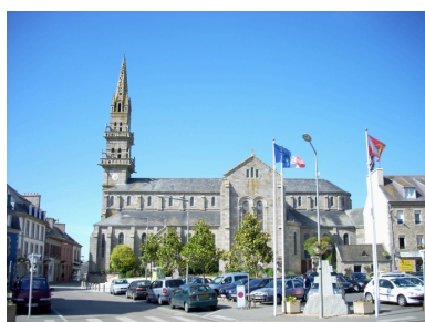
Lannilis, église paroissiale : vue générale sud