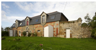
Ecuries