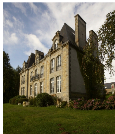
Élévation sud IVR53_20113503390NUCA