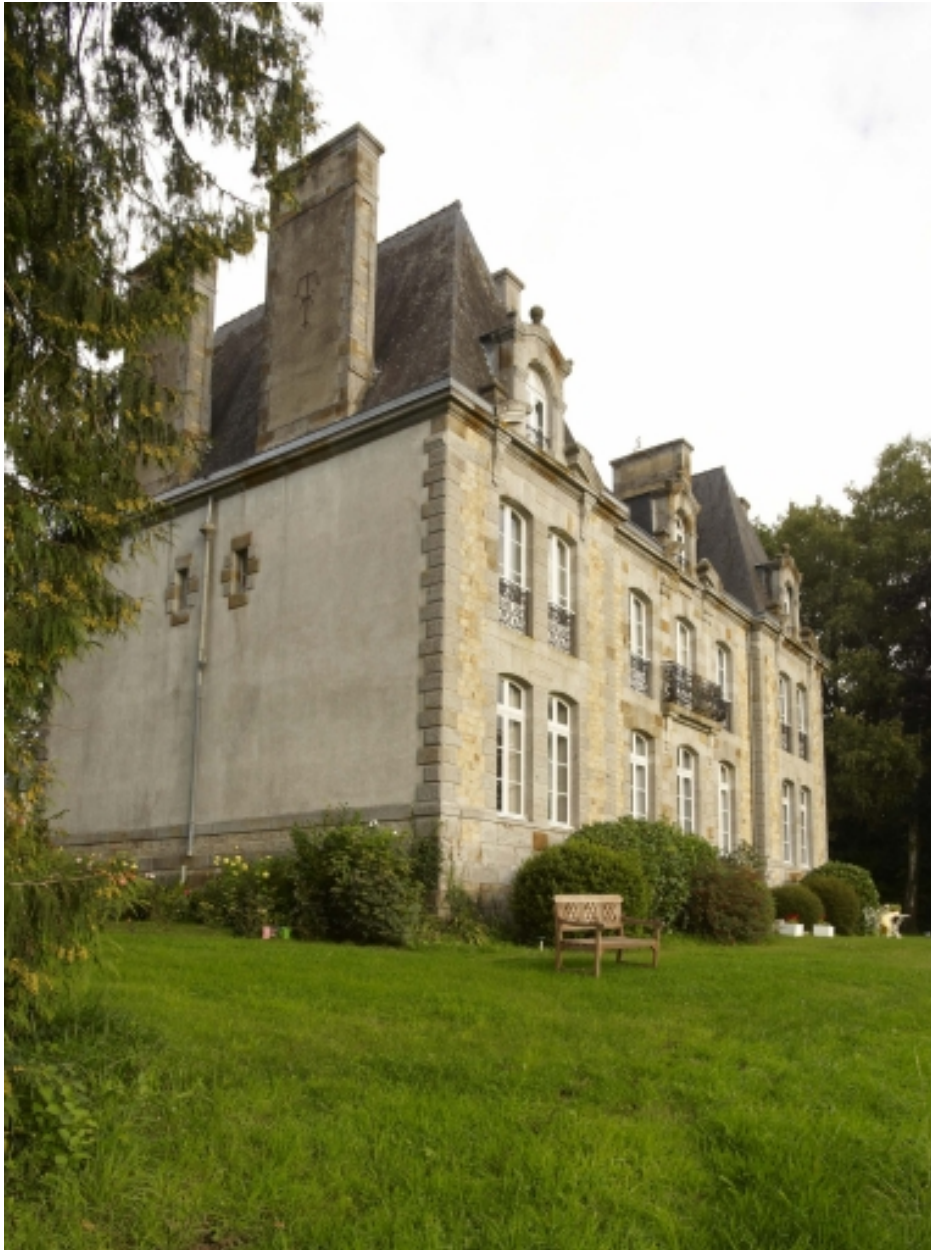
Elévation sud et pignon ouest