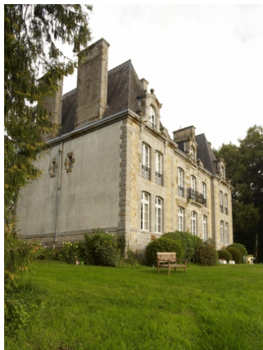
Elévation sud et pignon ouest IVR53_20113503391NUCA