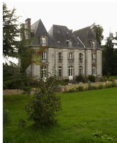
Elévation nord