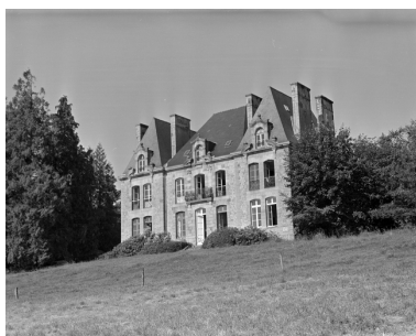
Élévation sud IVR53_19773500226X