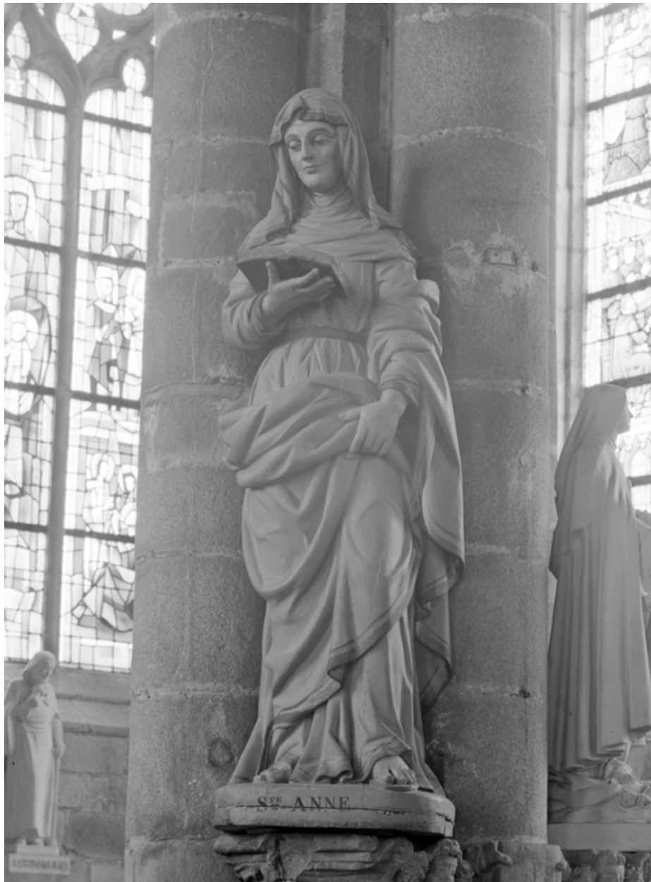
Statue : Saint Anne (état en 1984)