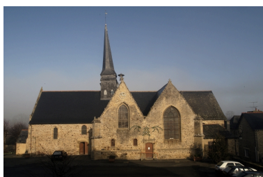
L'église côté sud (côté Place de l'Eglise)