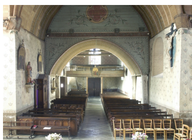
Vue intérieure prise du chœur vers la nef IVR53_20053500157NUCA