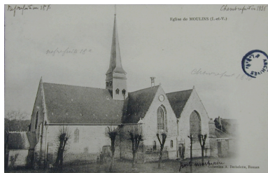
L'église (carte postale) IVR53_20043518854NUCA