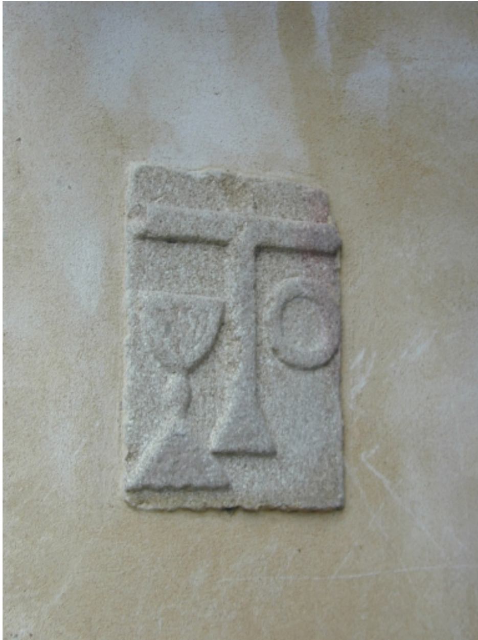
Croix avec couronne et calice (pierre à l'intérieur du porche)