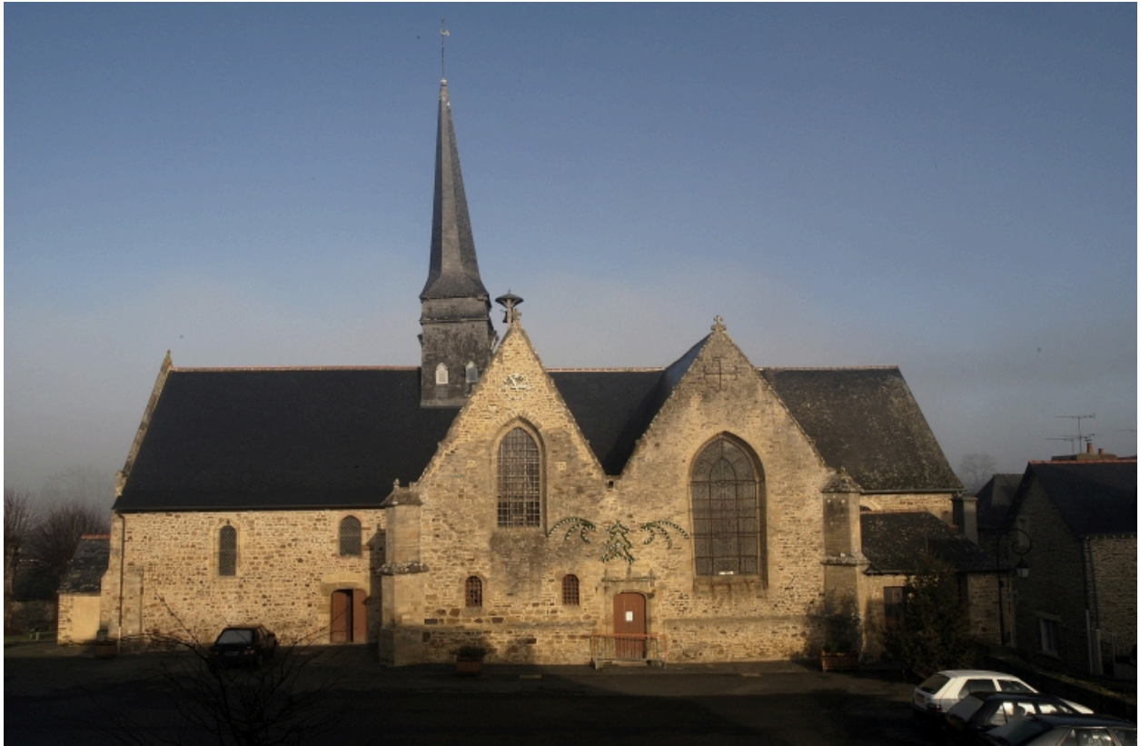
L'église côté sud (côté Place de l'Eglise)