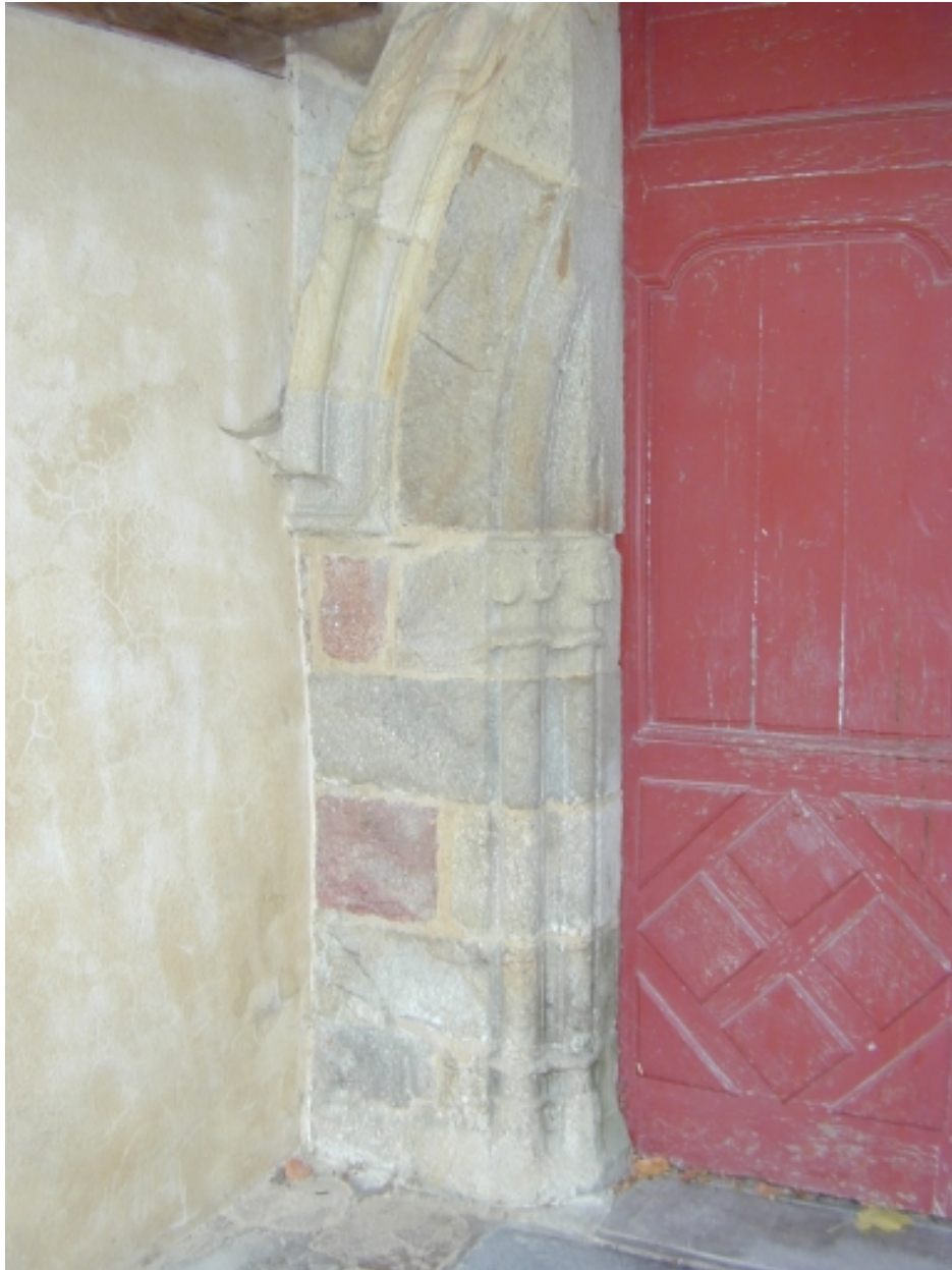
Détail des moulurations (porche)