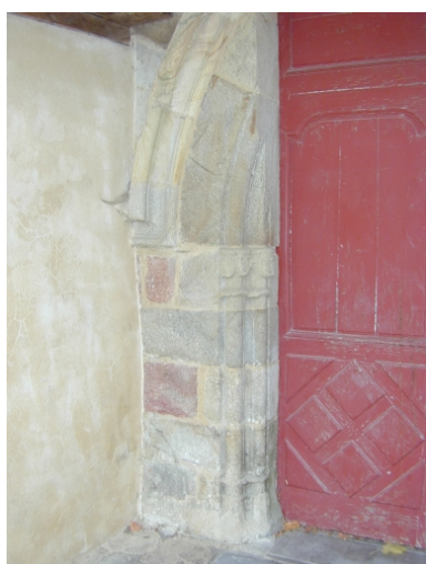
Détail des moulurations (porche)