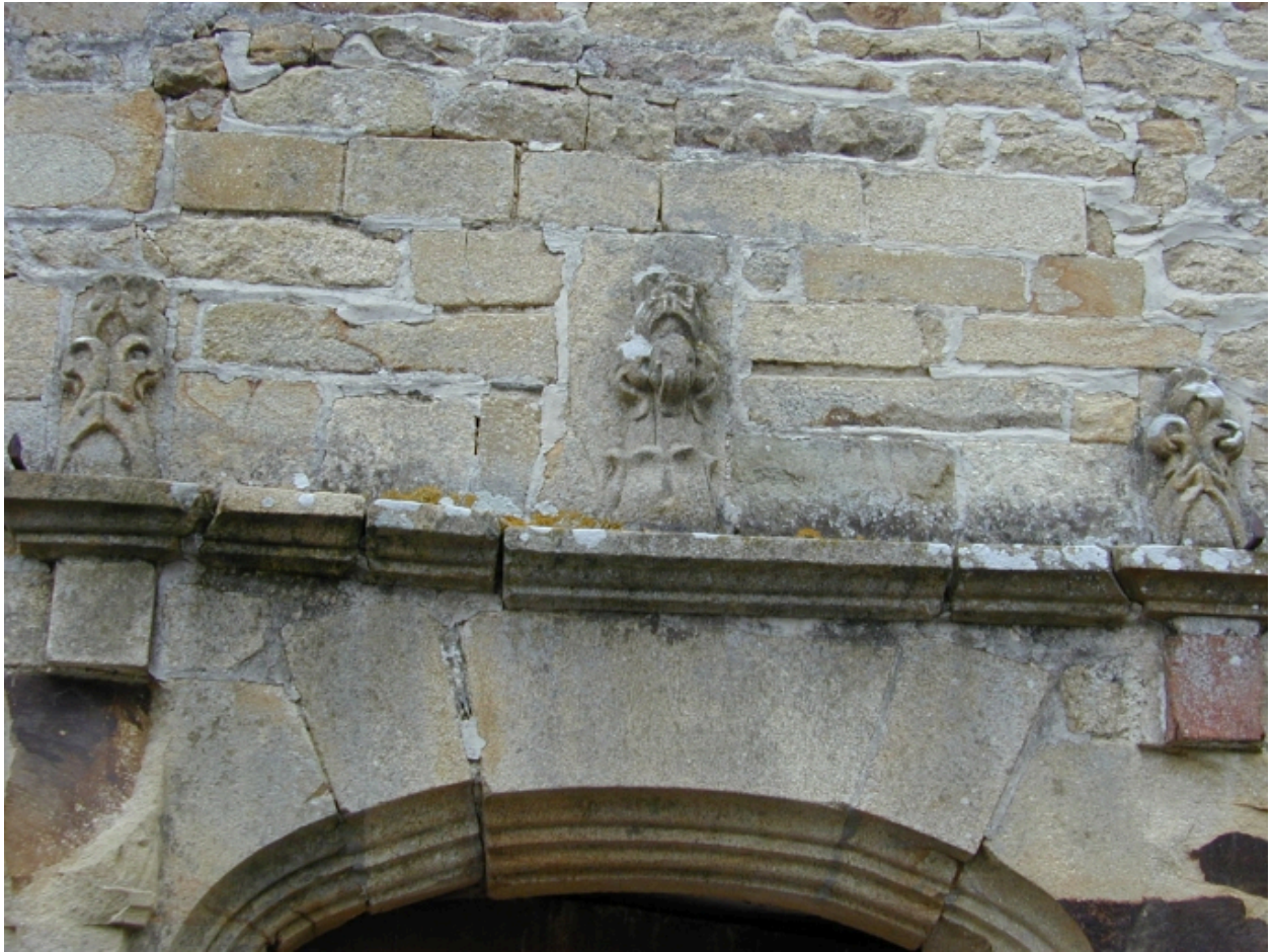
Détail des décors de la porte mortuaire