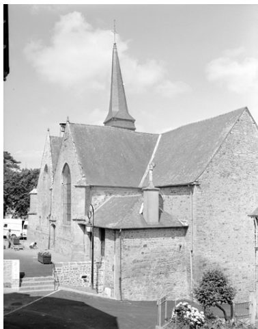
L'église (vue est)