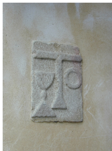
Croix avec couronne et calice (pierre à l'intérieur du porche)