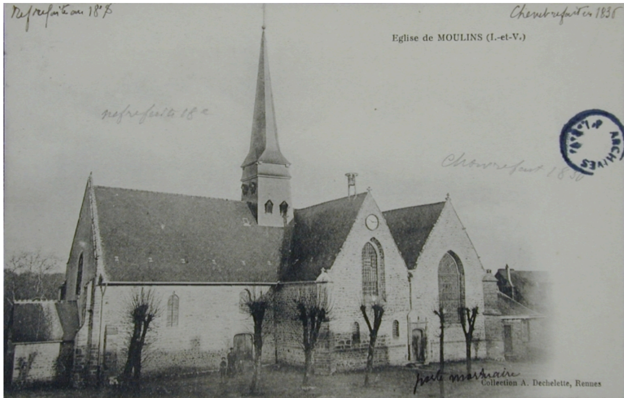
L'église (carte postale)