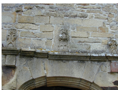
Détail des décors de la porte mortuaire IVR53_20043518841NUCA