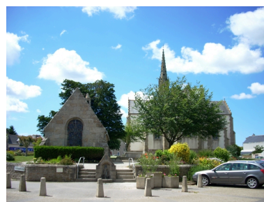
Plouguin, église paroissiale : vue générale est IVR53_20082906147NUCA