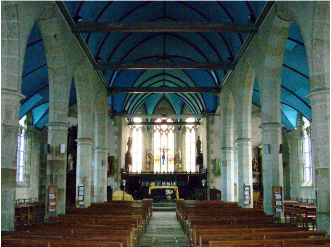
Plouguin, église paroissiale : vue axiale est