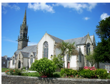
Plouguin, église paroissiale : vue générale sud-est