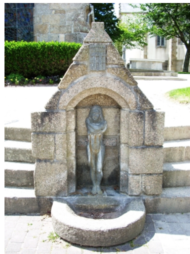
Plouguin, église paroissiale : vue de la fontaine Gwen IVR53_20082906150NUCA