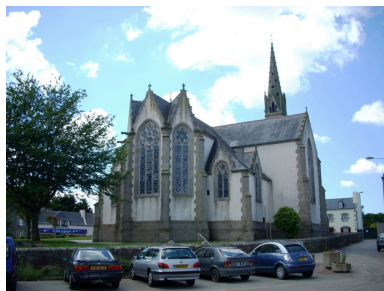
Plouguin, église paroissiale : vue générale nord-est IVR53_20082906148NUCA