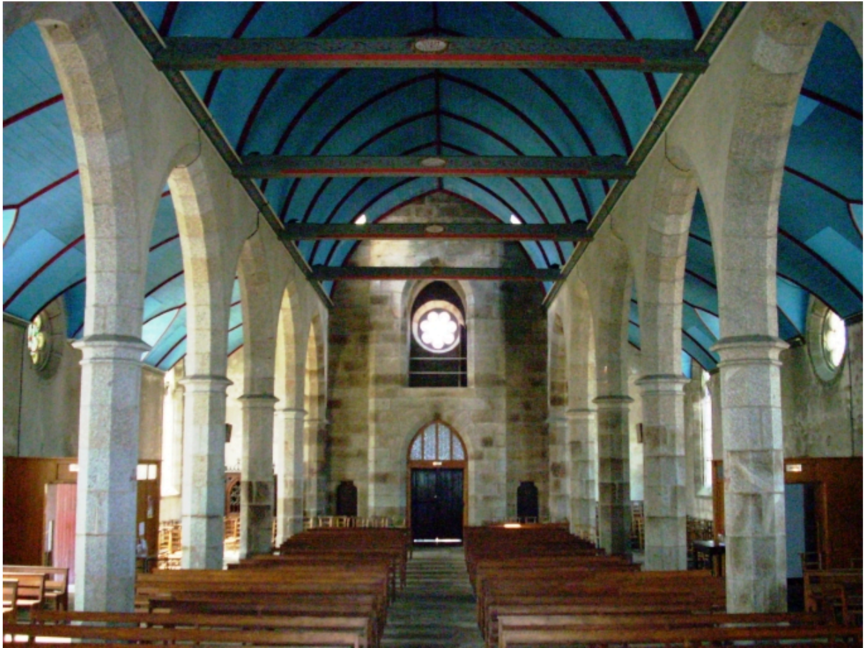
Plouguin, église paroissiale : vue axiale ouest