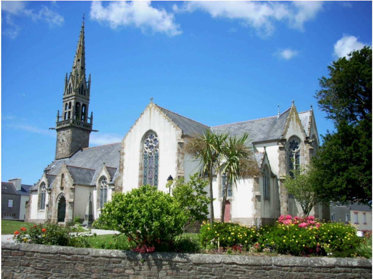
Plouguin, église paroissiale : vue générale sud-est