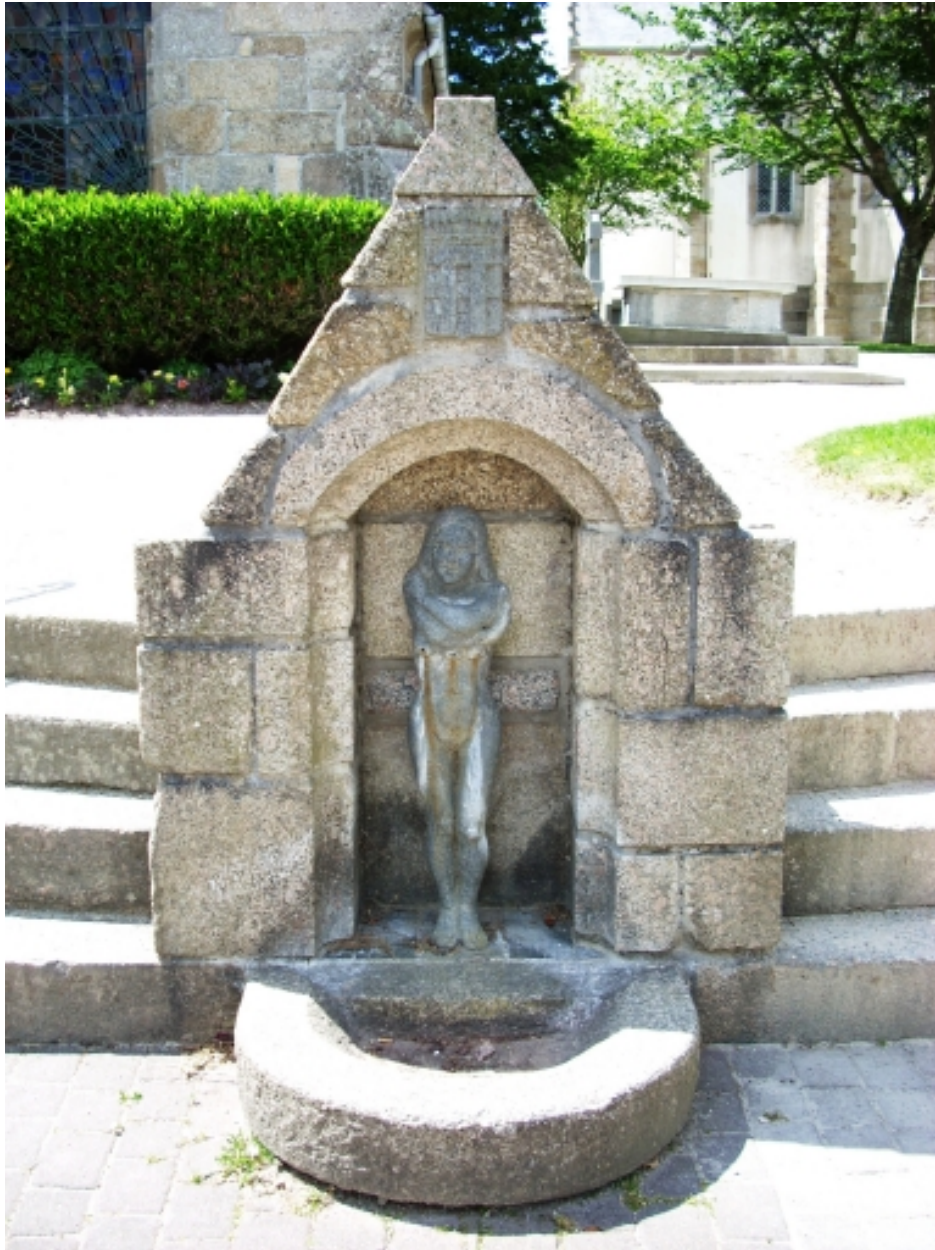
Plouguin, église paroissiale : vue de la fontaine Gwen