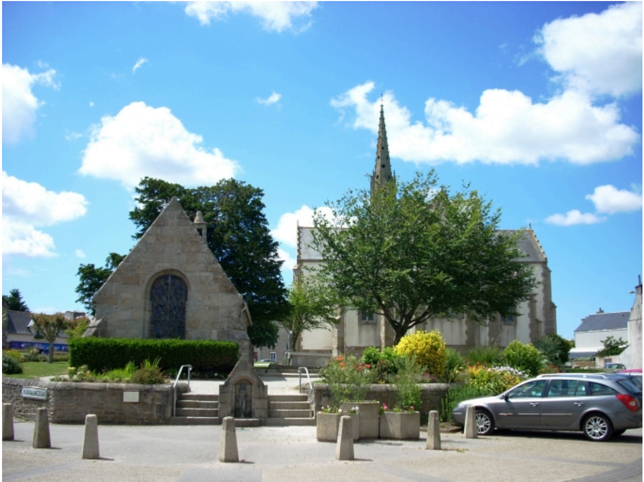
Plouguin, église paroissiale : vue générale est