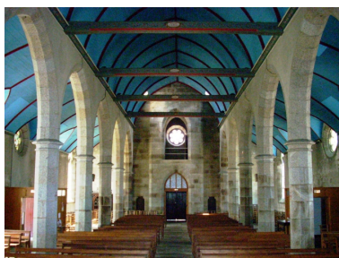
Plouguin, église paroissiale : vue axiale ouest IVR53_20082906152NUCA