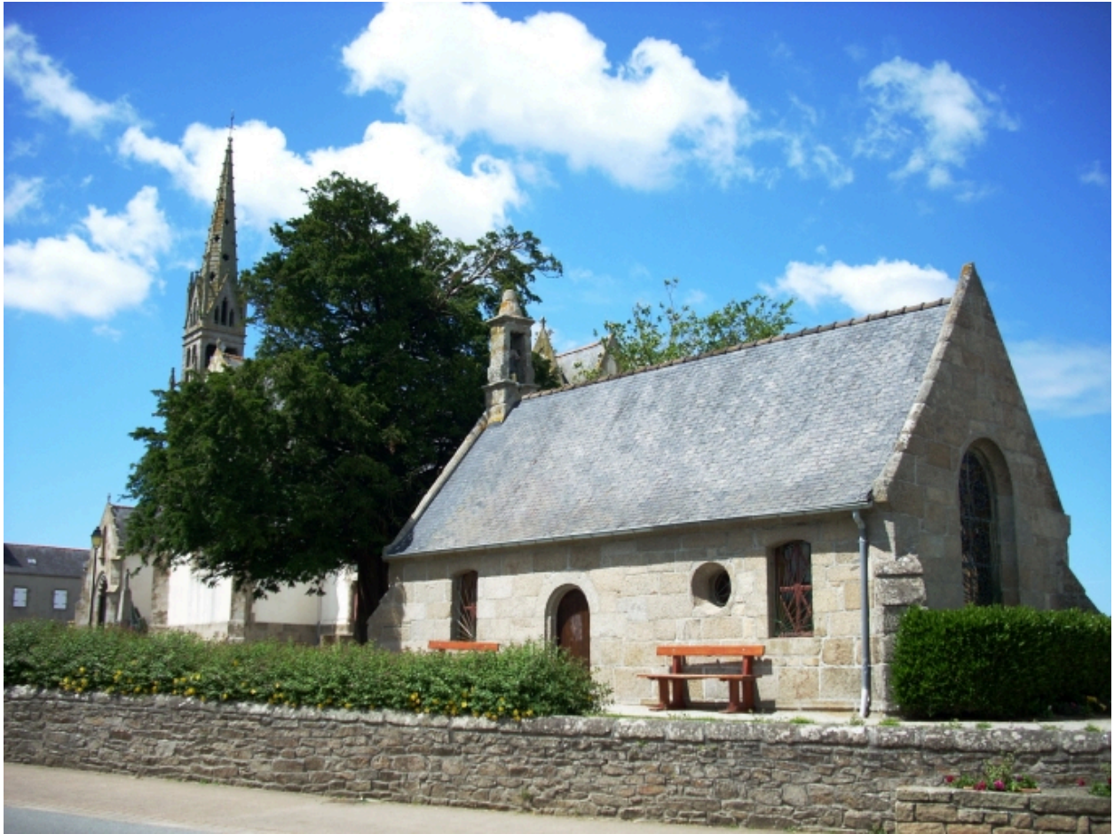
Plouguin, église paroissiale : vue générale sud-est de l'ossuaire