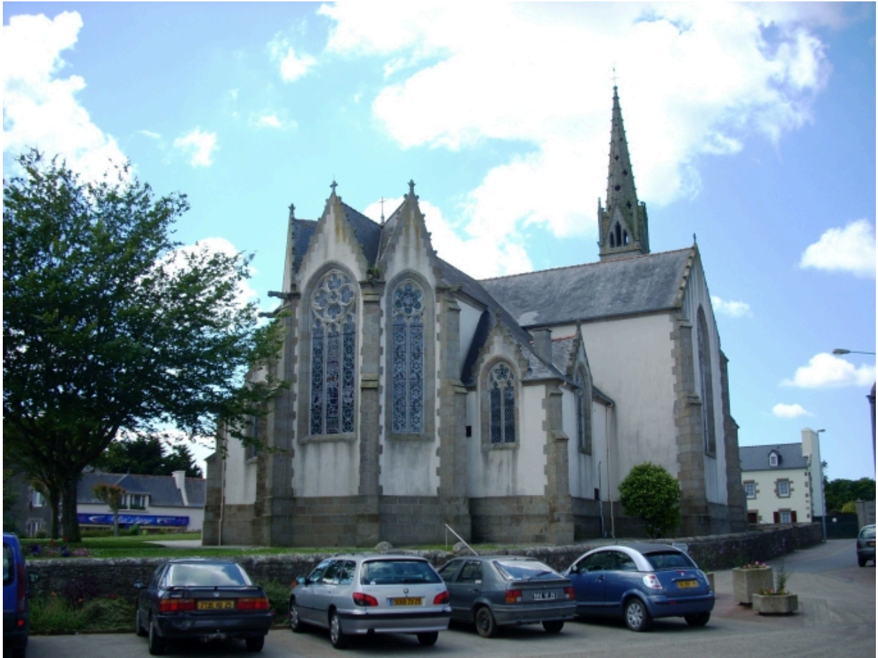
Plouguin, église paroissiale : vue générale nord-est