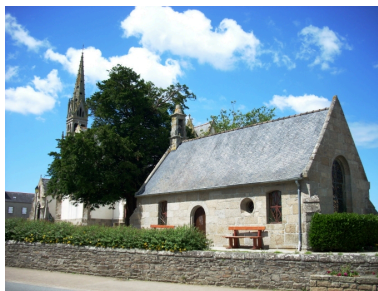
Plouguin, église paroissiale : vue générale sud-est de l'ossuaire IVR53_20082906149NUCA