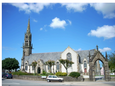
Plouguin, église paroissiale : vue générale sud IVR53_20082906145NUCA