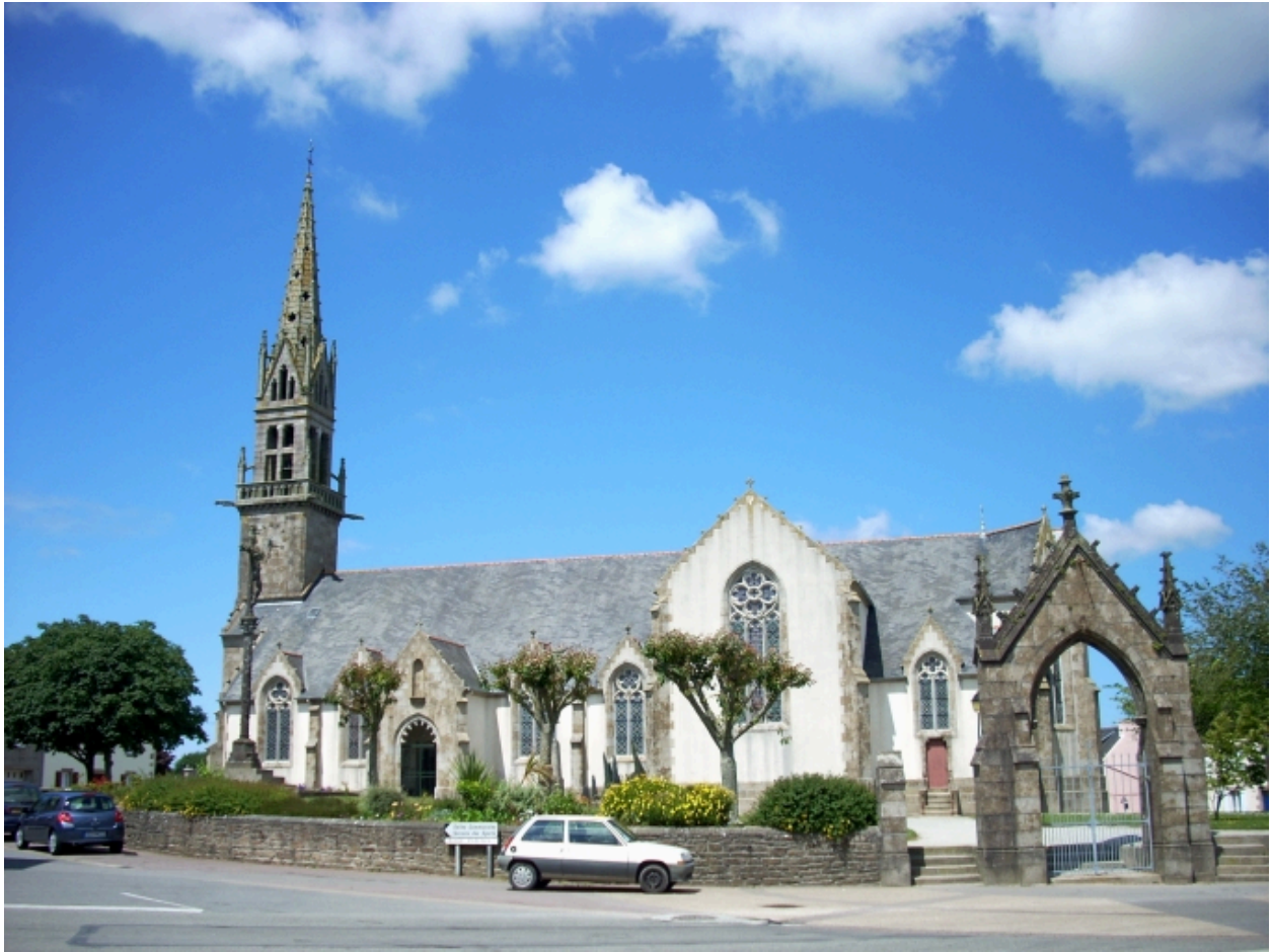
Plouguin, église paroissiale : vue générale sud