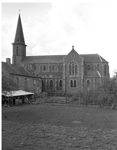
Vue générale sud-est IVR53_19943500762X