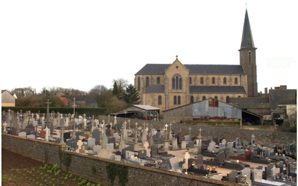
Vue générale nord-ouest