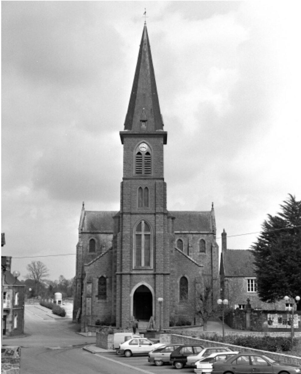
Vue générale sud-ouest