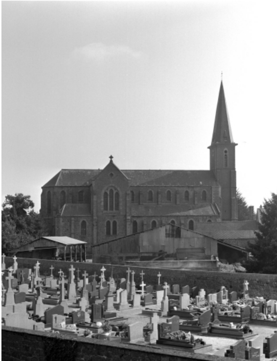
Vue générale nord-ouest