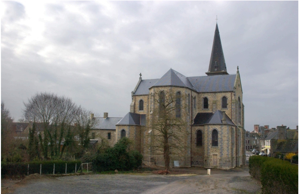
Vue générale nord