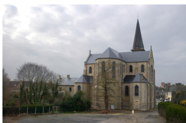
Vue générale nord IVR53_20023502617NUCA