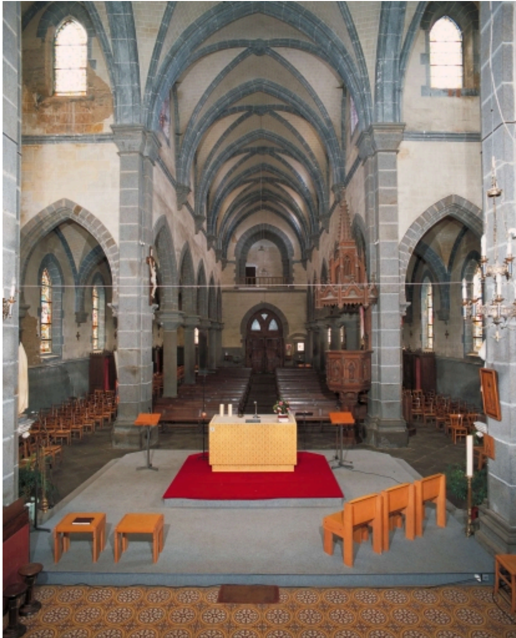
Vue intérieure prise du chœur vers la nef