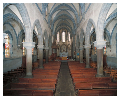
Vue intérieure vers le chœur IVR53_20023500309XA