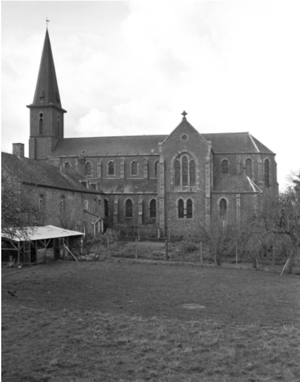
Vue générale sud-est