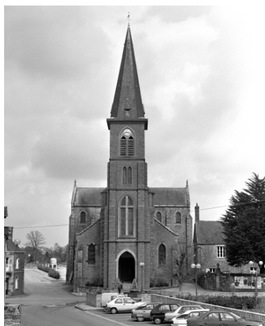
Vue générale sud-ouest IVR53_19943500761X