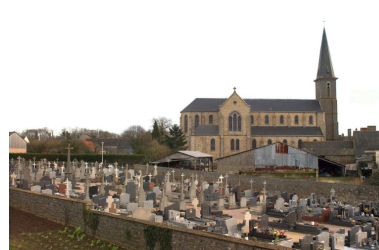
Vue générale nord-ouest IVR53_20023502543NUCA