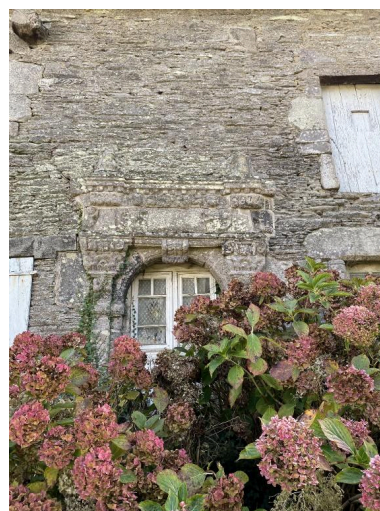
Porte, élévation sud, détail IVR53_20265610939NUCA