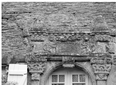
Maison : porte d'entrée (état en 1985) IVR53_19855600217X