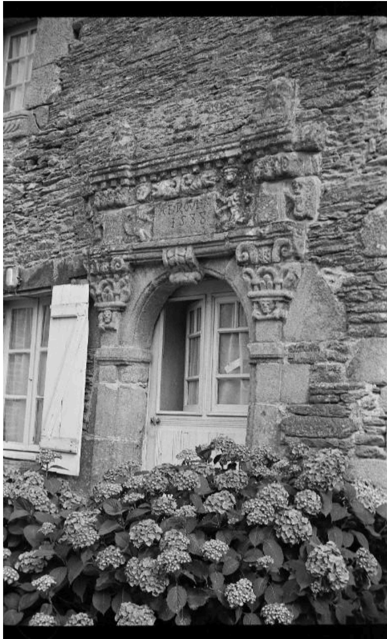
Maison : porte d'entrée (état en 1985)