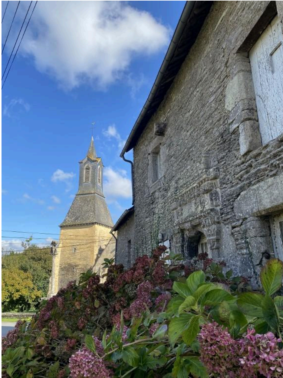
Vue sur la chapelle