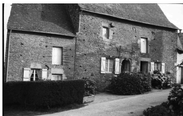
Vue générale IVR53_19745606783Z