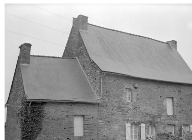
Maison : élévation nord (état en 1985) IVR53_19855600216X