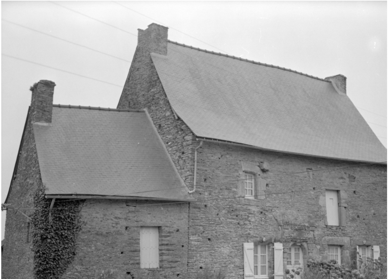
Maison : élévation nord (état en 1985)