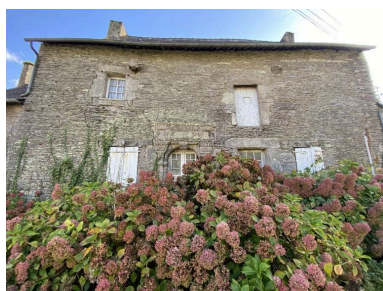
Élévation sud, vue générale