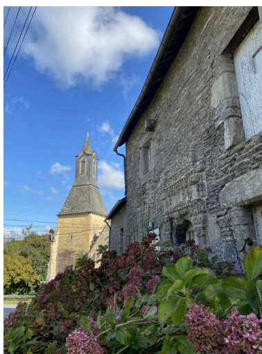
Vue sur la chapelle IVR53_20265610941NUCA