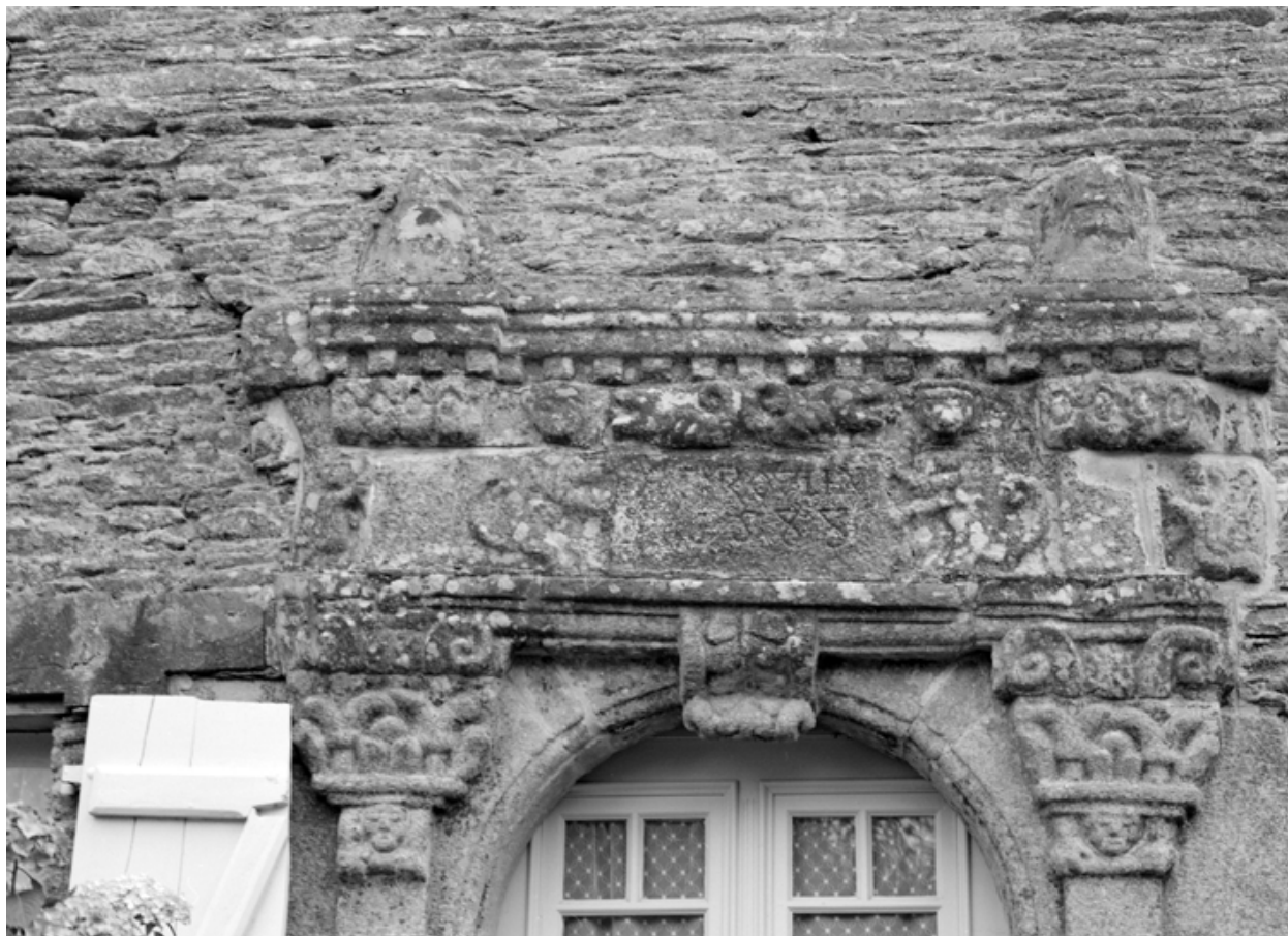
Maison : porte d'entrée (état en 1985)