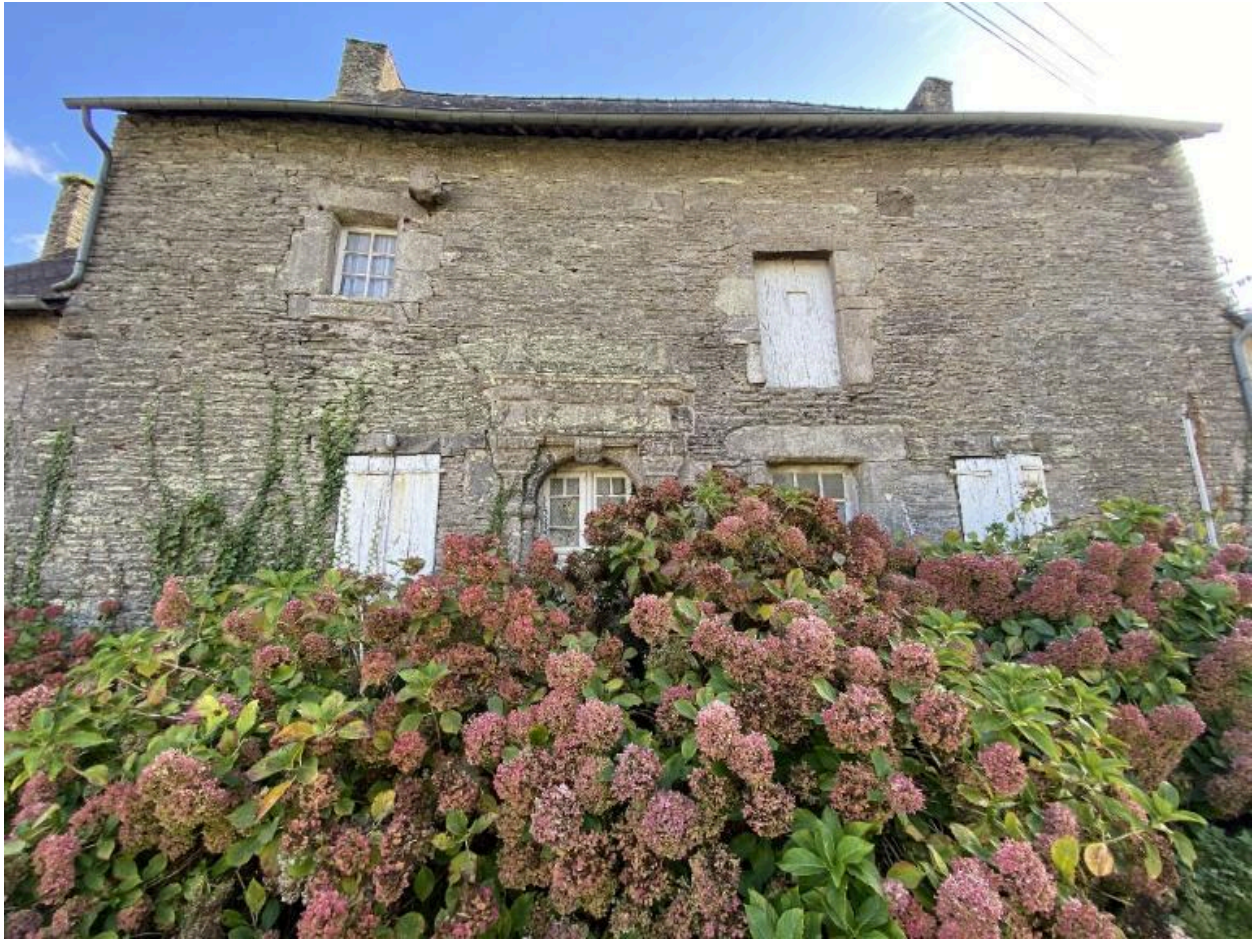
Élévation sud, vue générale