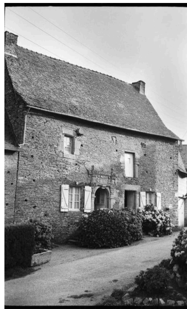
Vue rapprochée IVR53_19745606782Z