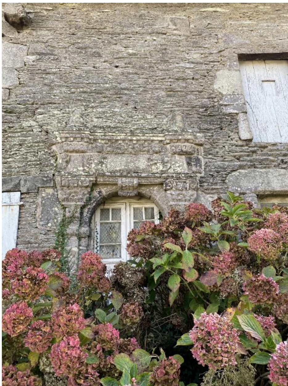
Porte, élévation sud, détail