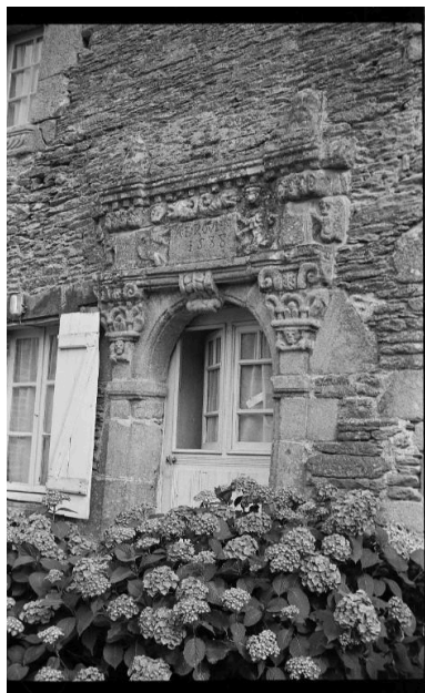
Maison : porte d'entrée (état en 1985) IVR53_19745606754Z