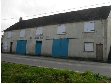
Etablissement Kerbrat IVR53_20062908603NUCA