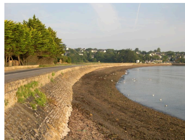
Digue du Sillon et vue du Fret à l'arrière-plan