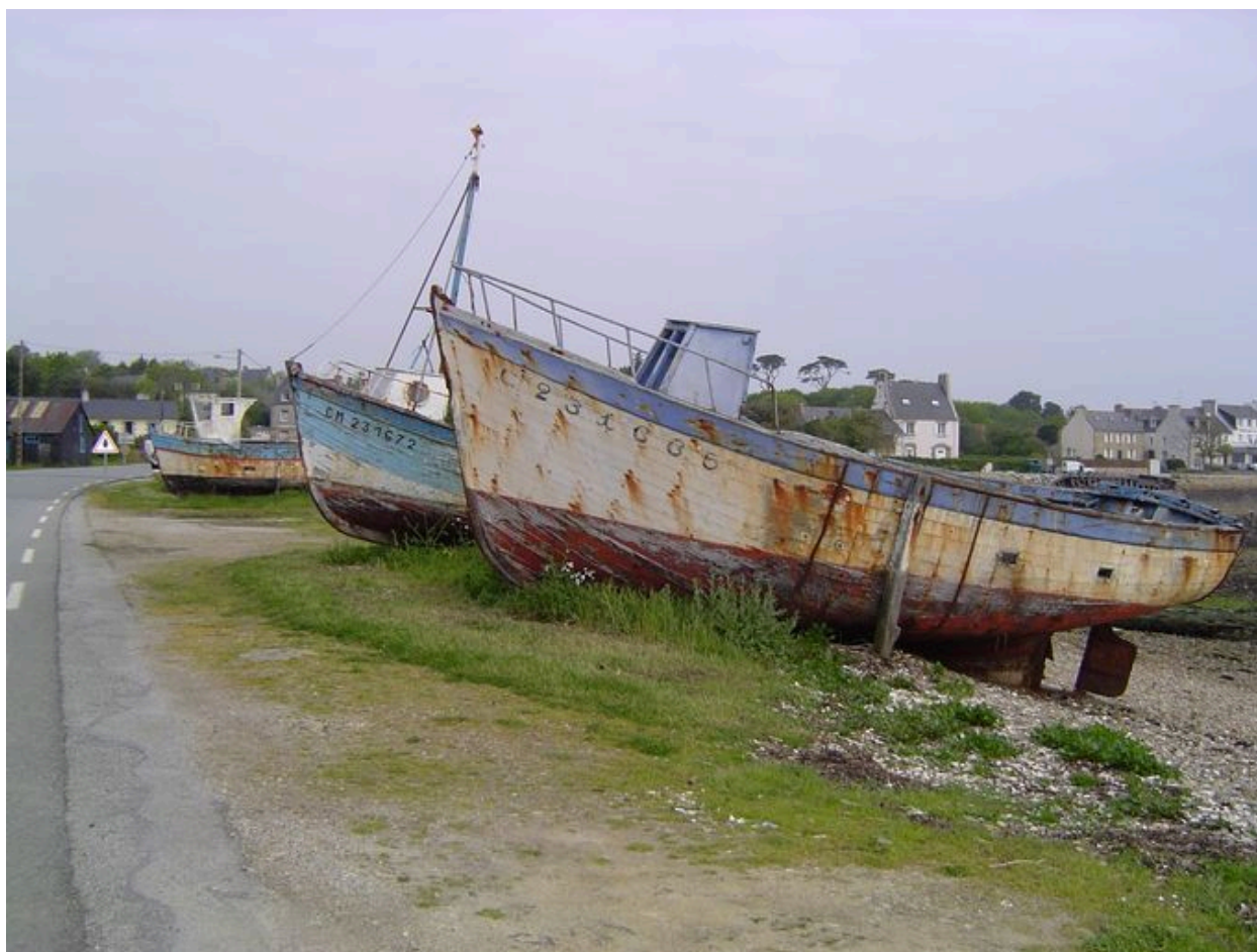
Cimetière de bateaux sur le Sillon du Fret