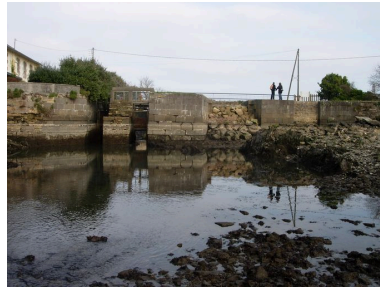
Ecluse du Sillon IVR53_20062908569NUCA