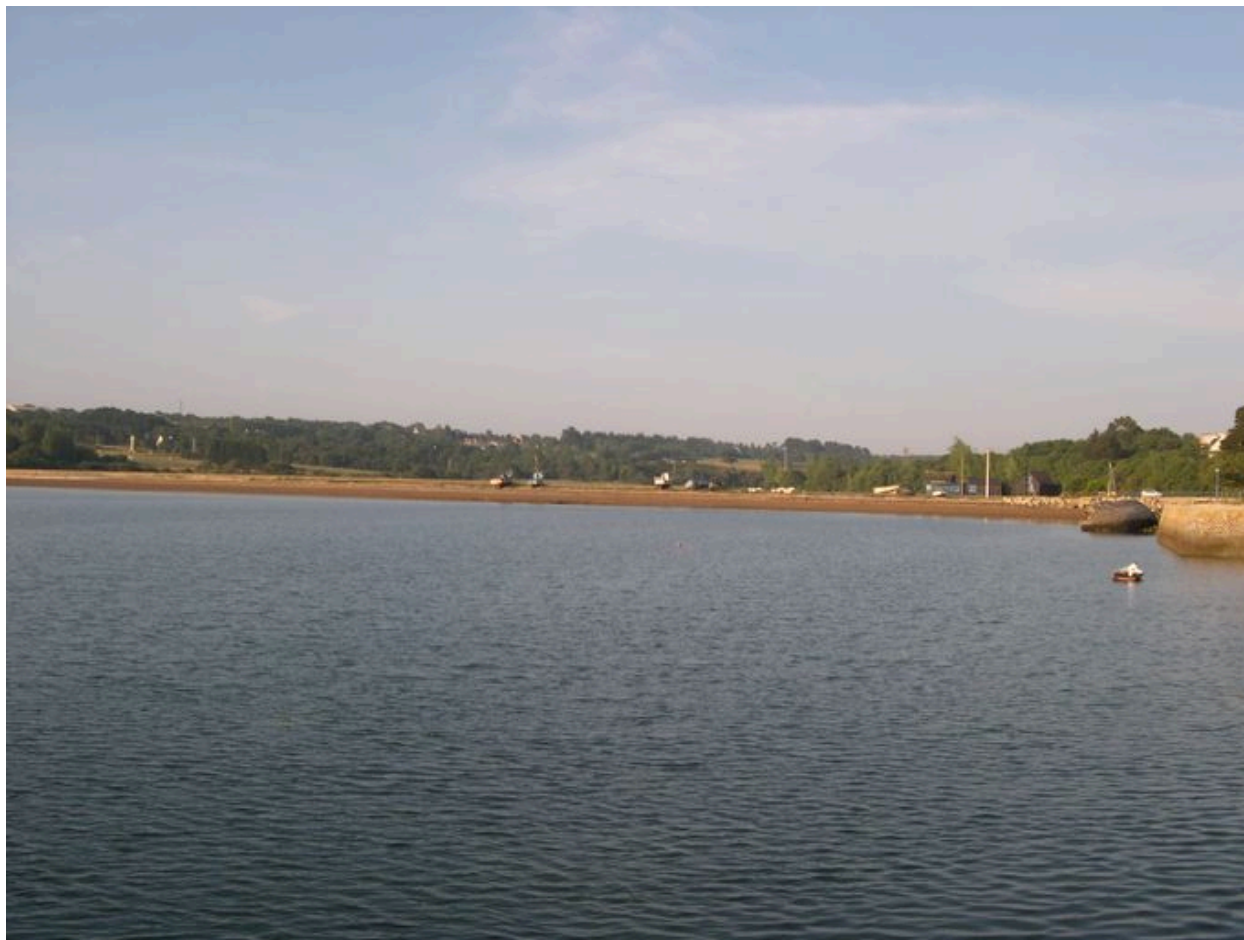
Vue générale du quartier du Sillon