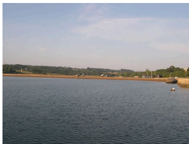
Vue générale du quartier du Sillon