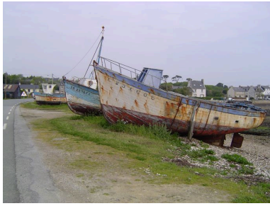
Cimetière de bateaux sur le Sillon du Fret