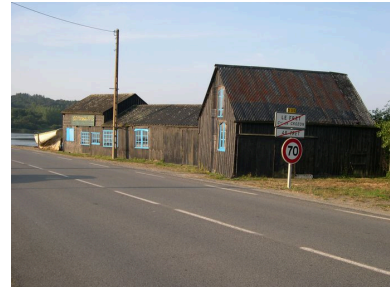
Chantier Stipon IVR53_20062908517NUCA