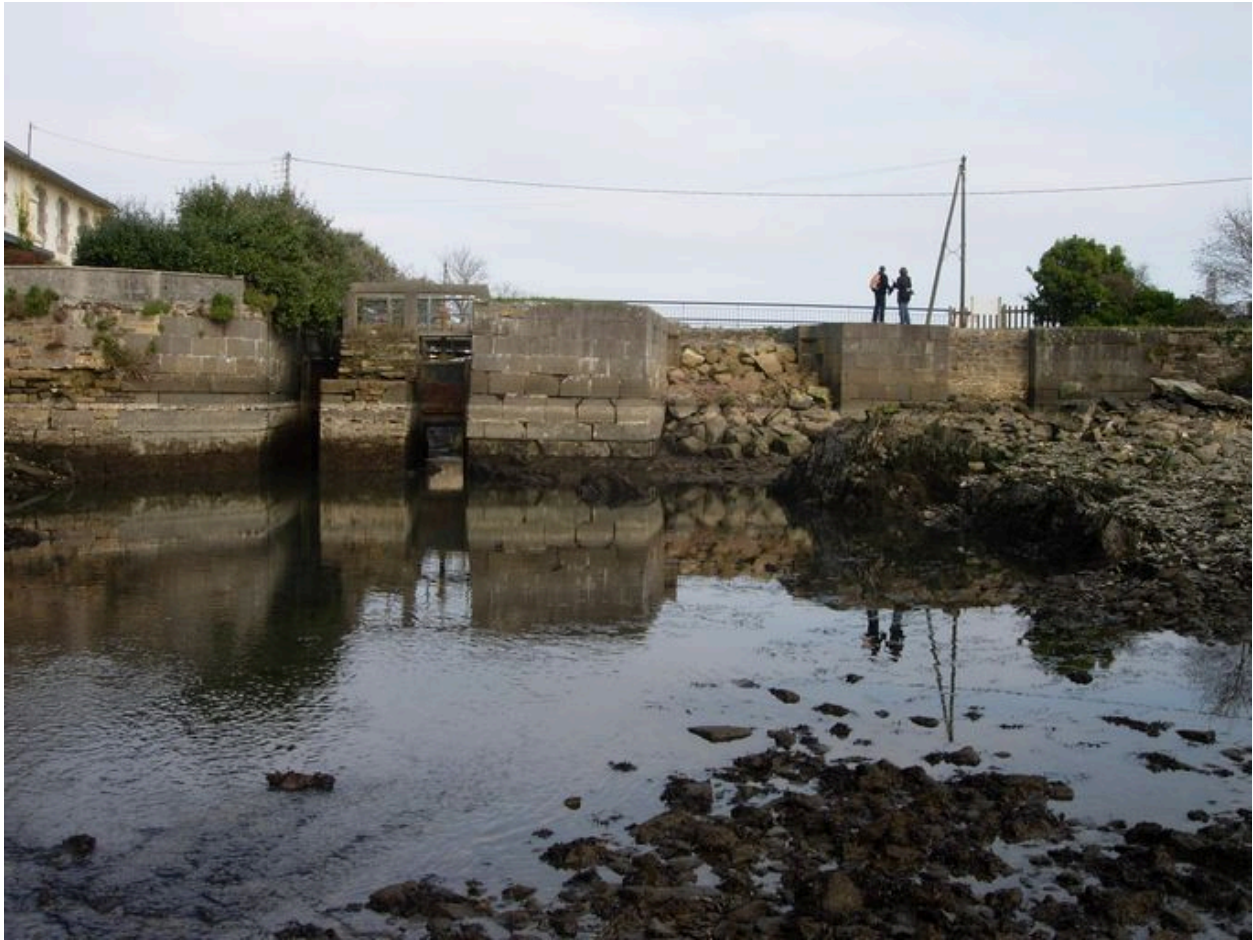
Ecluse du Sillon