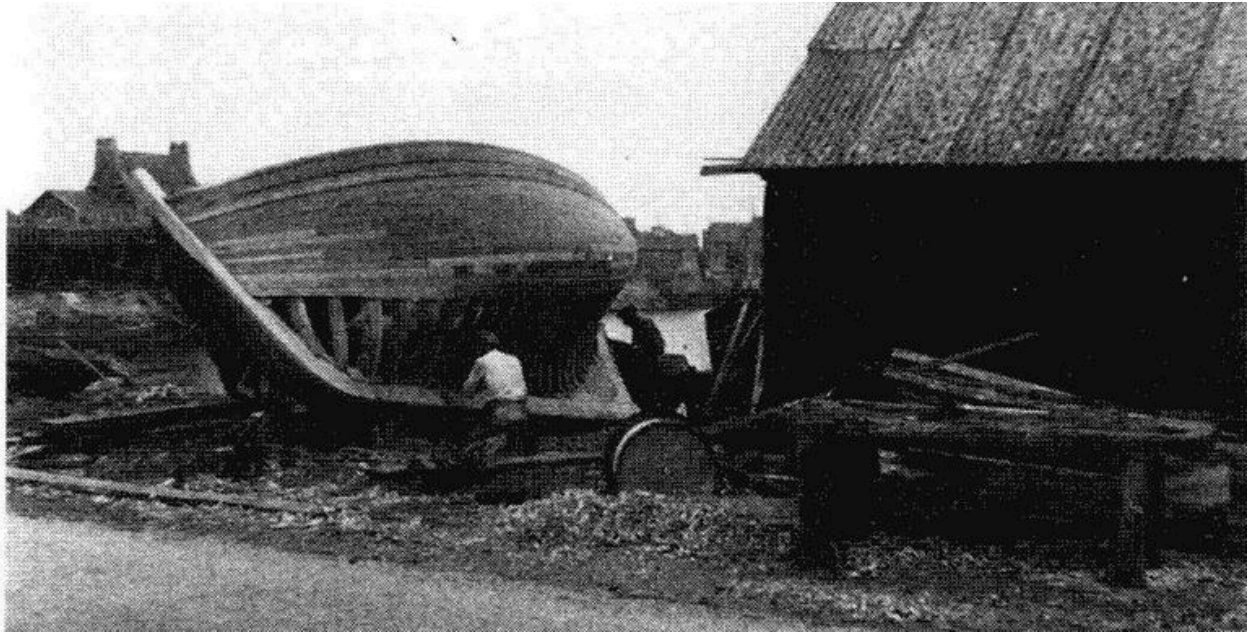
Chantier Belbeoch en 1950