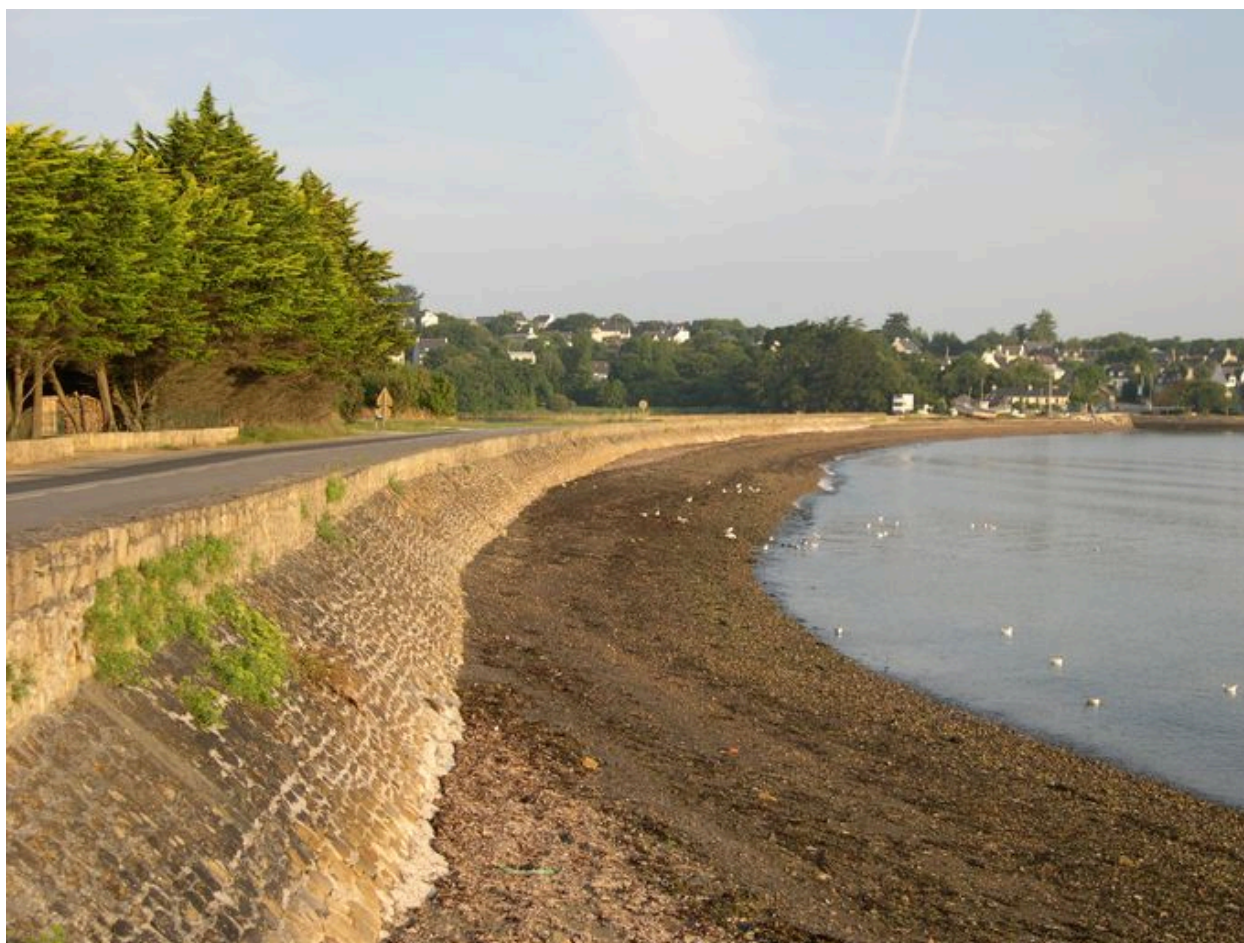
Digue du Sillon et vue du Fret à l'arrière-plan