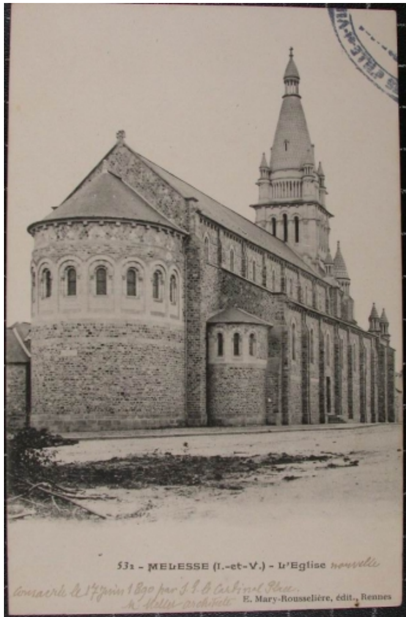
L'église sur une carte postale ancienne