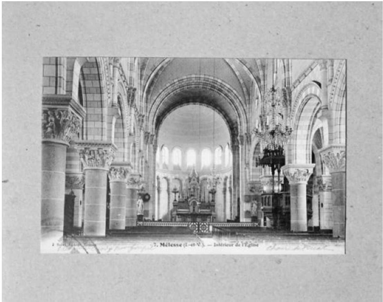
Intérieur de l'église sur une carte postale ancienne