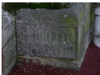
Inscription sur une pierre à l'extérieur IVR53_20053514683NUCA