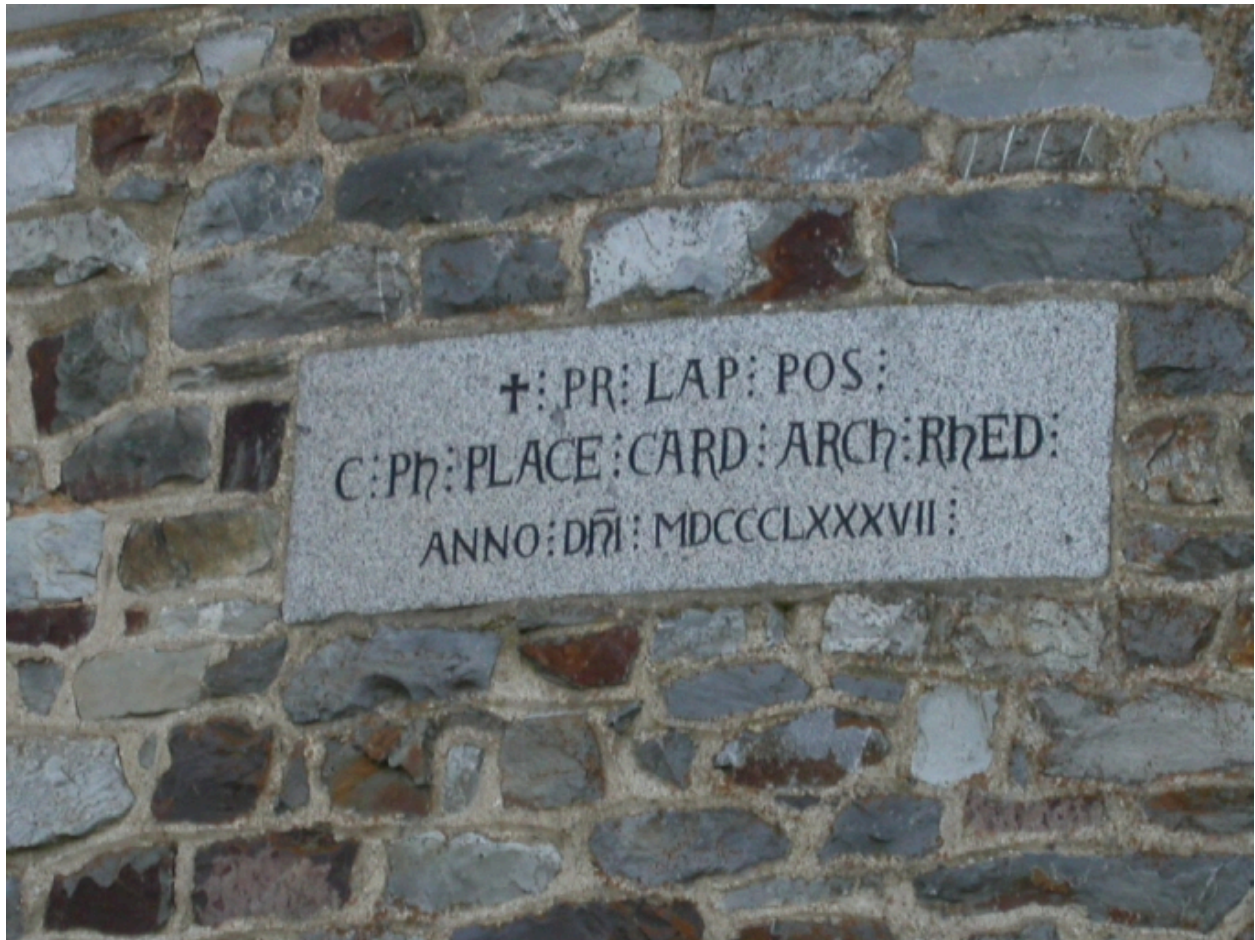
Inscription sur une pierre, mur Est