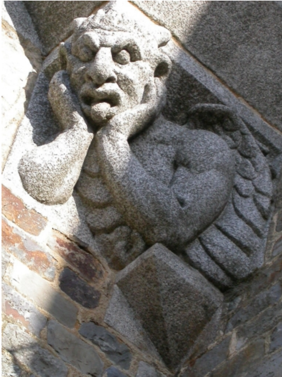
Figure grimaçante, près de la porte principale