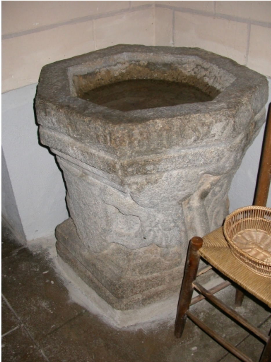
Ancien bénitier du 16e siècle à l'intérieur