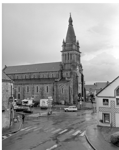
Elevation nord, partie ouest : vue générale IVR53_19943500922X