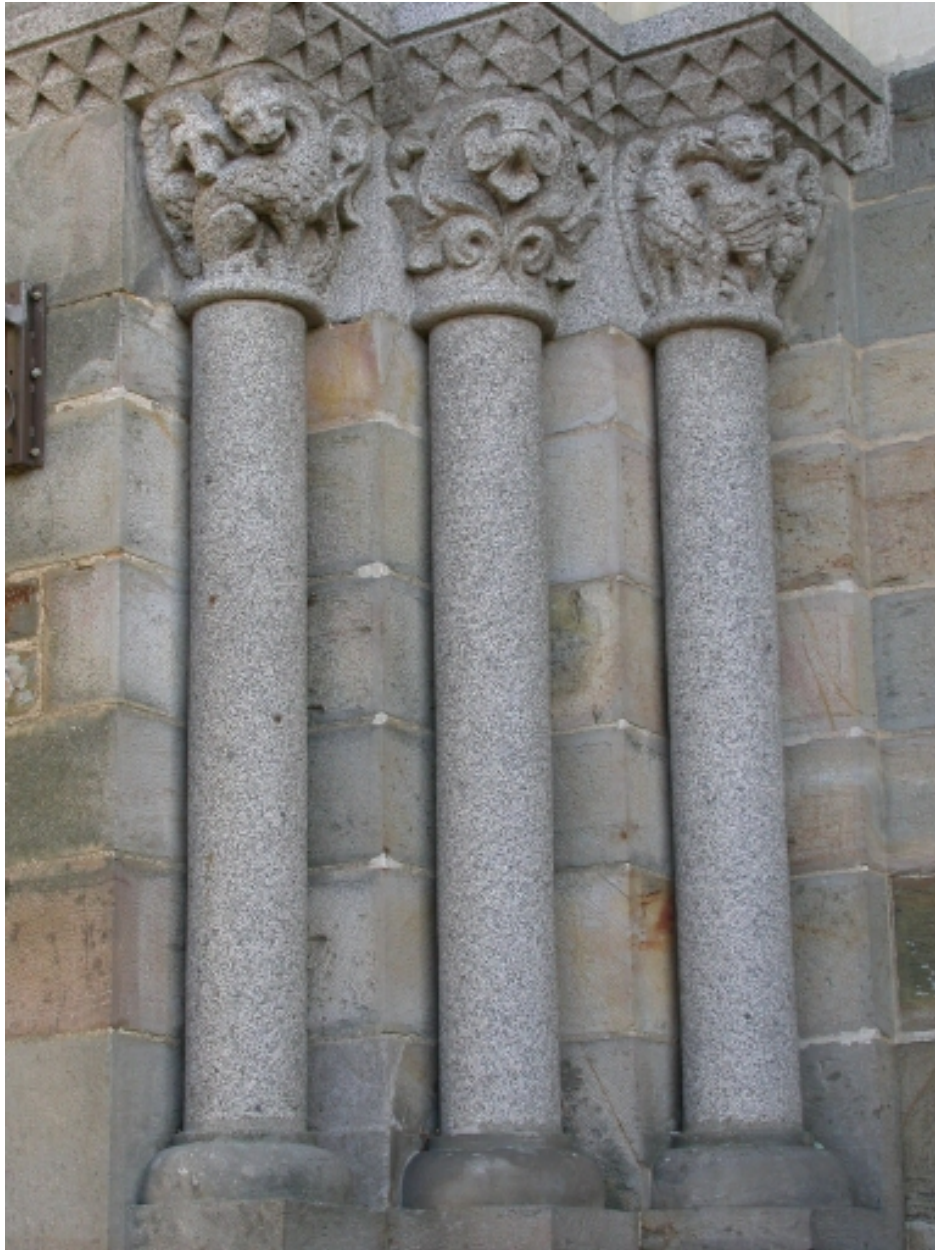
Colonnes entourant la porte principale