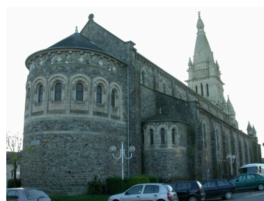
Vue est IVR53_20053514679NUCA