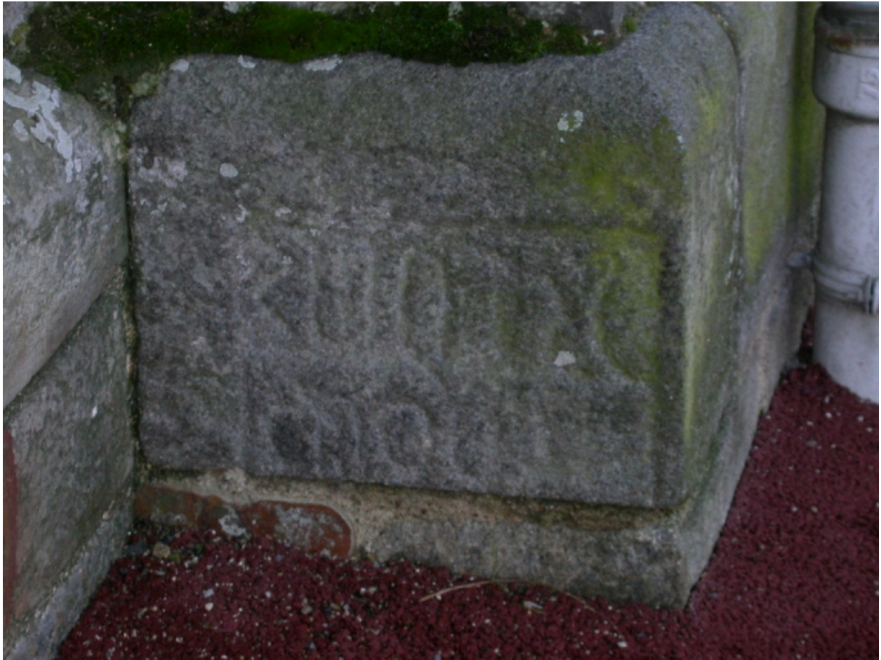
Inscription sur une pierre à l'extérieur