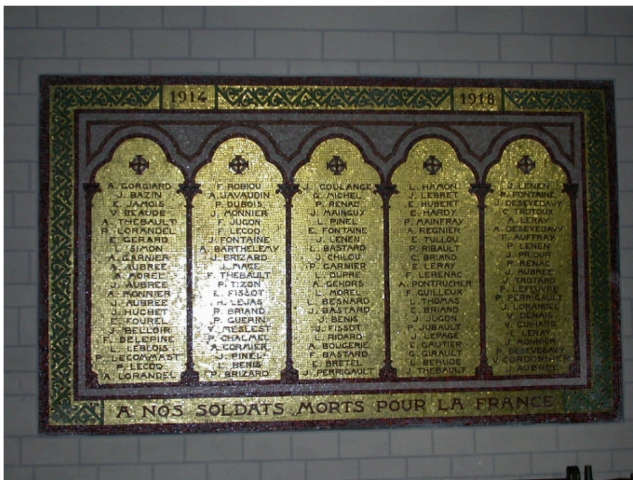
Mosaïque commémorative des morts de la première guerre mondiale réalisée par Odorico en 1923