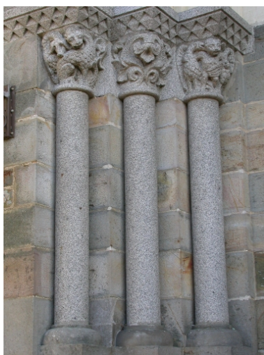
Colonnes entourant la porte principale IVR53_20053514684NUCA