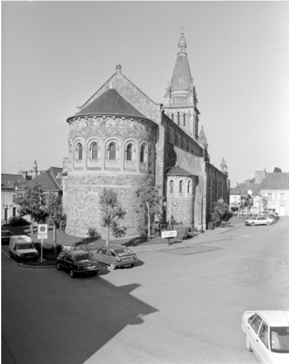
Elevation est : vue générale