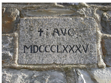
Année de construction en chiffres romains