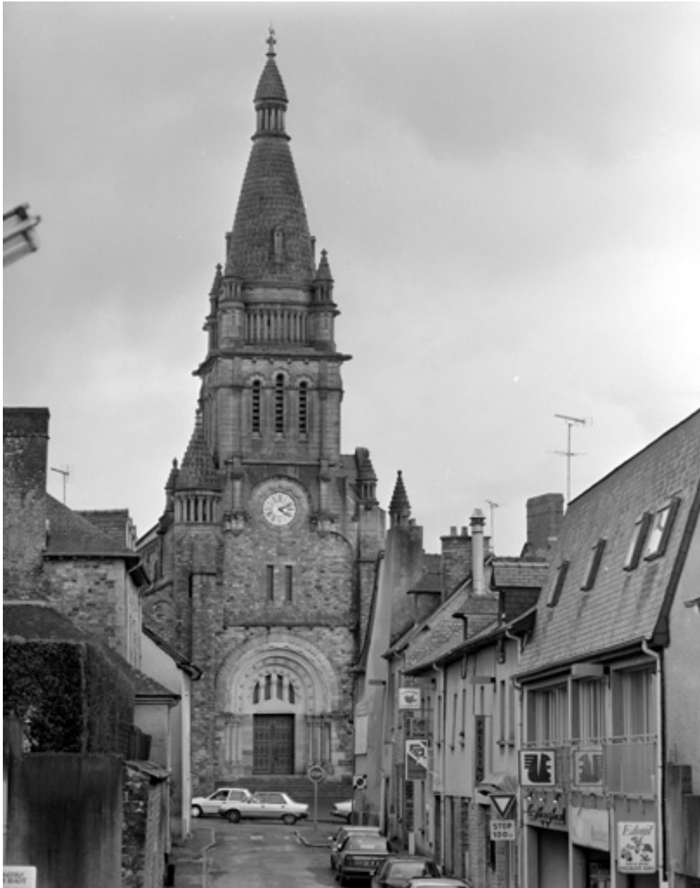
Elévation nord, partie ouest : vue générale