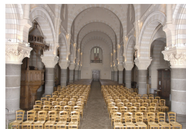
Vue intérieure prise du chœur vers la nef IVR53_20053500646NUCA