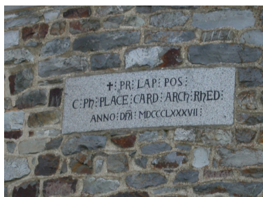
Inscription sur une pierre, mur Est