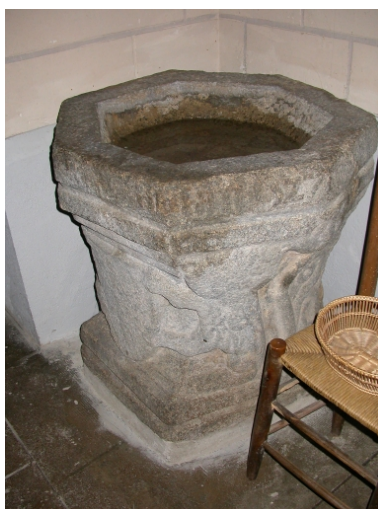
Ancien bénitier du 16e siècle à l'intérieur