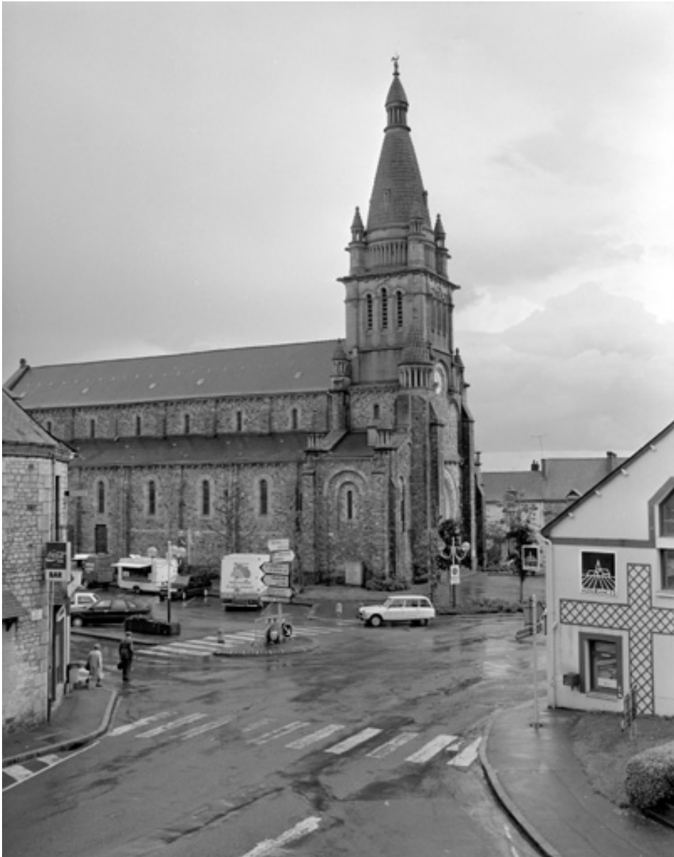
Elevation nord, partie ouest : vue générale