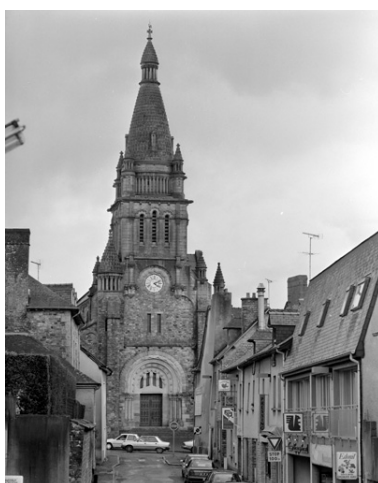
Elévation nord, partie ouest : vue générale IVR53_19943500923X