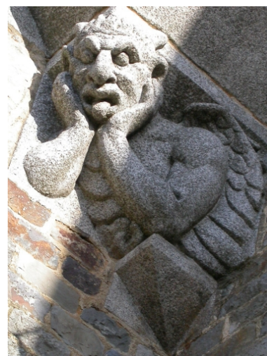
Figure grimaçante, près de la porte principale IVR53_20053514685NUCA