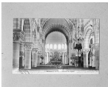
Intérieur de l'église sur une carte postale ancienne IVR53_19933500749XB