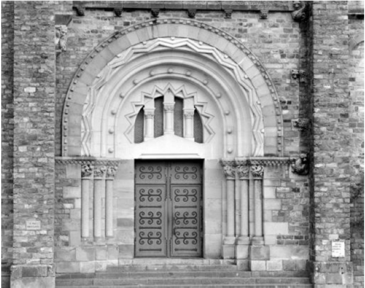
Elévation nord, porte : vue générale