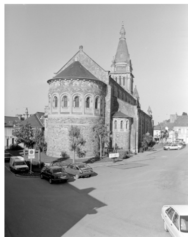
Elevation est : vue générale IVR53_19943500951X