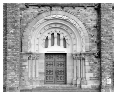
Elévation nord, porte : vue générale IVR53_19943500924X