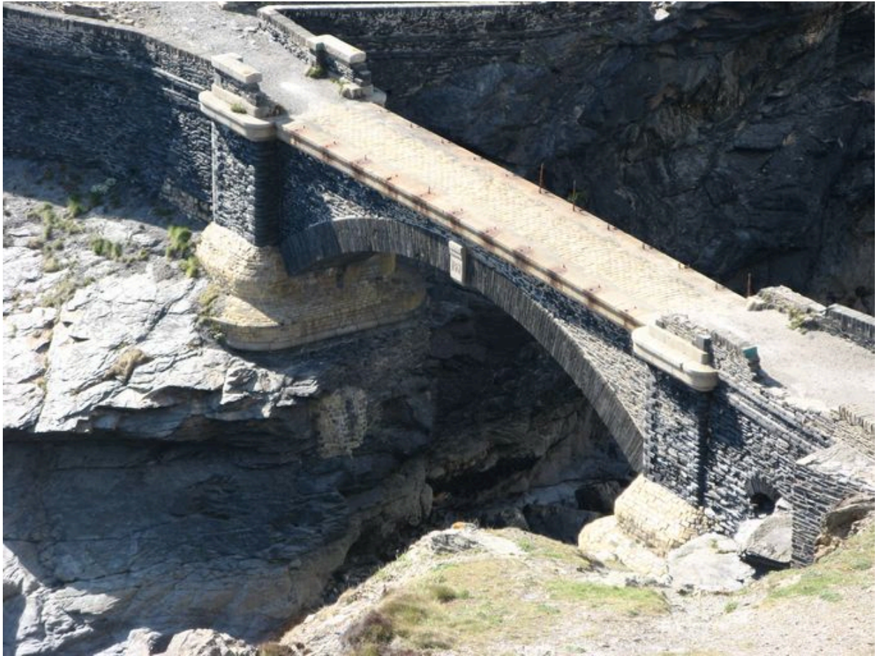
Pont de l'îlot des Capucins