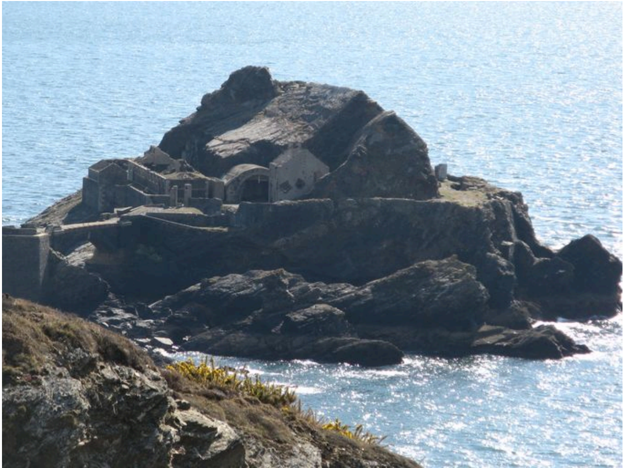
Vue nord l'ensemble fortifié de l'îlot des Capucins