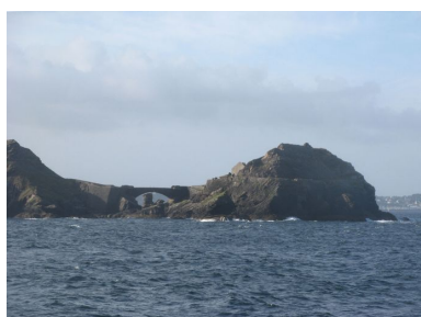
Vue depuis la mer de l'ensemble fortifié de l'îlot des Capucins IVR53_20082908521NUCA