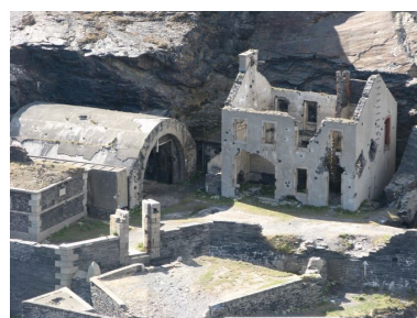
Usine électrique voûtée et maison du gardien de l'îlot des Capucins IVR53_20082908458NUCA