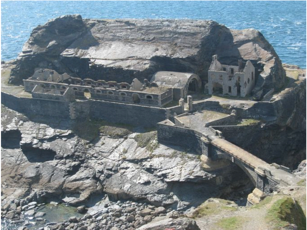
Vue est l'ensemble fortifié de l'îlot des Capucins