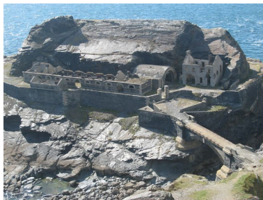
Vue est de l'ensemble fortifié de l'îlot des Capucins