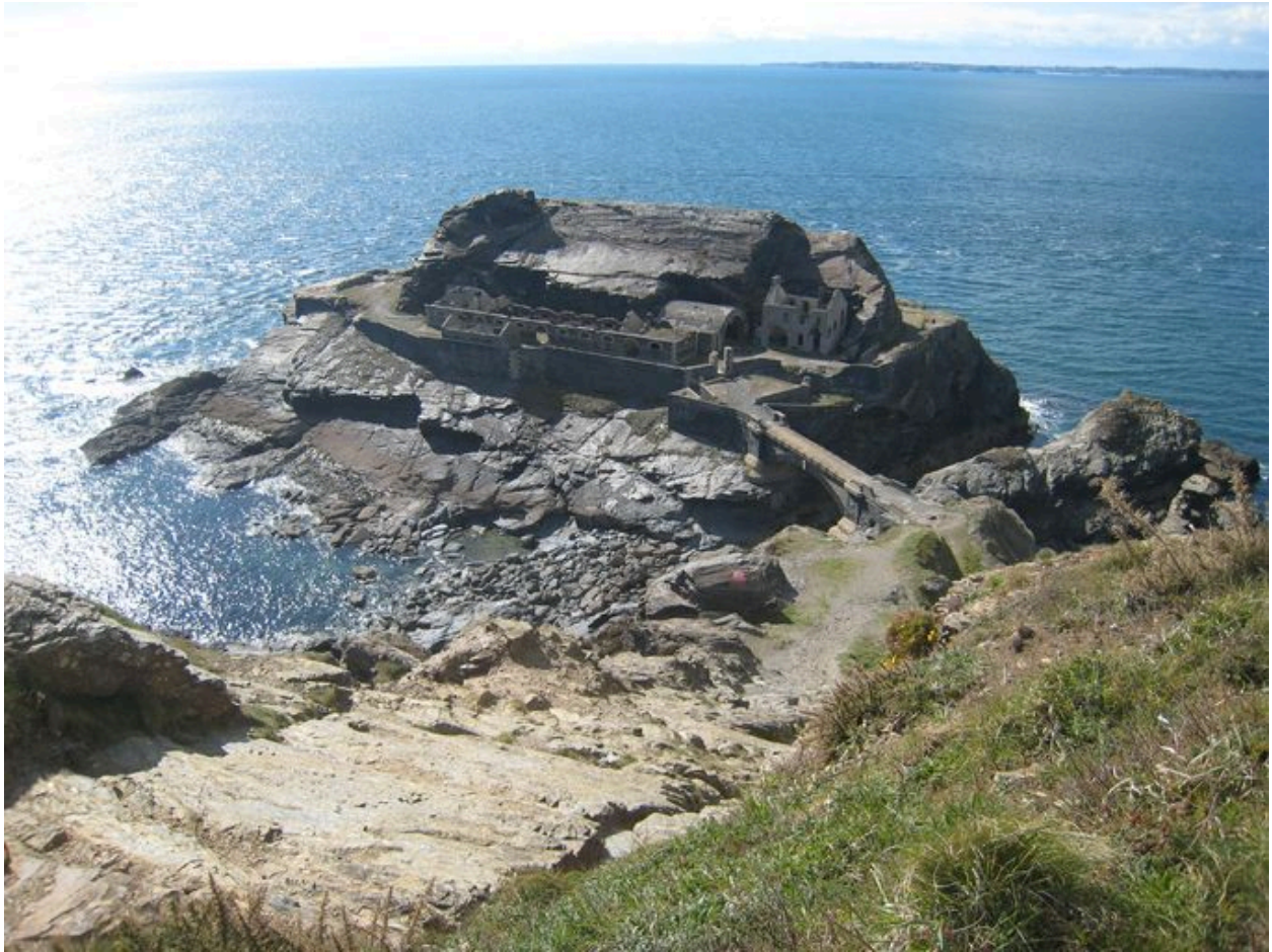
Vue générale de l'ensemble fortifié de l'îlot des Capucins