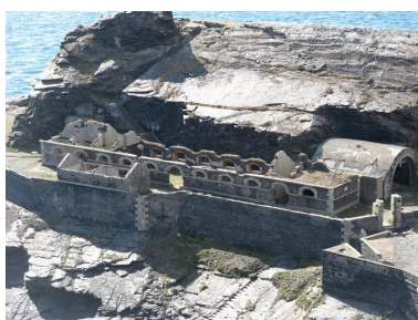
Caserne et usine électrique de l'îlot des Capucins IVR53_20082908460NUCA