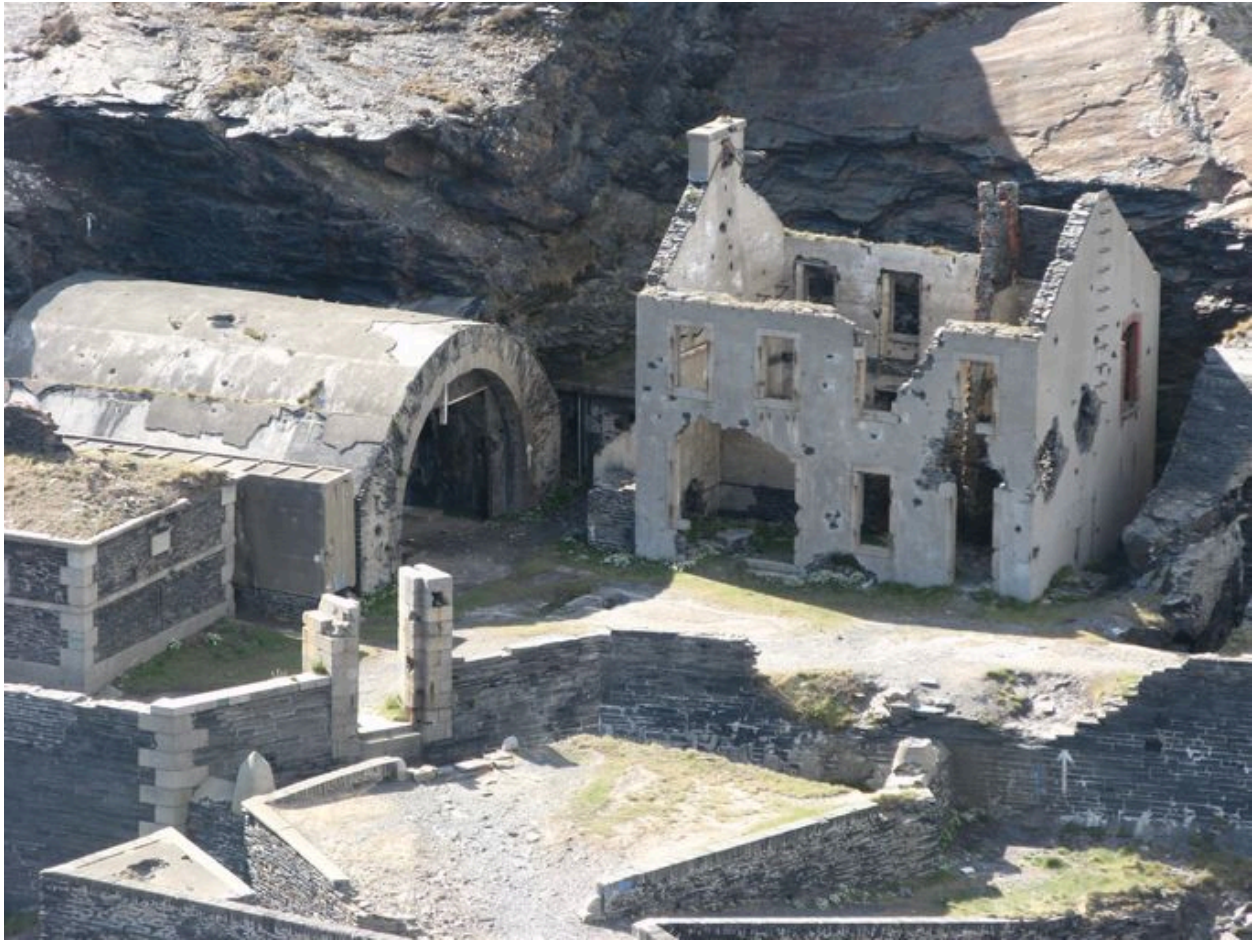
Usine électrique voutée et maison du gardien de l'îlot des Capucins