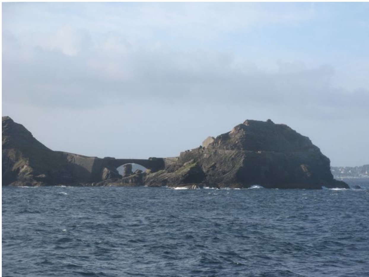
Vue depuis la mer de l'ensemble fortifié de l'îlot des Capucins