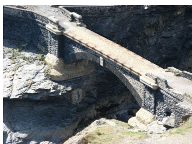
Pont de l'îlot des Capucins