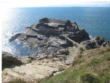
Vue générale de l'ensemble fortifié de l'îlot des Capucins IVR53_20082908456NUCA