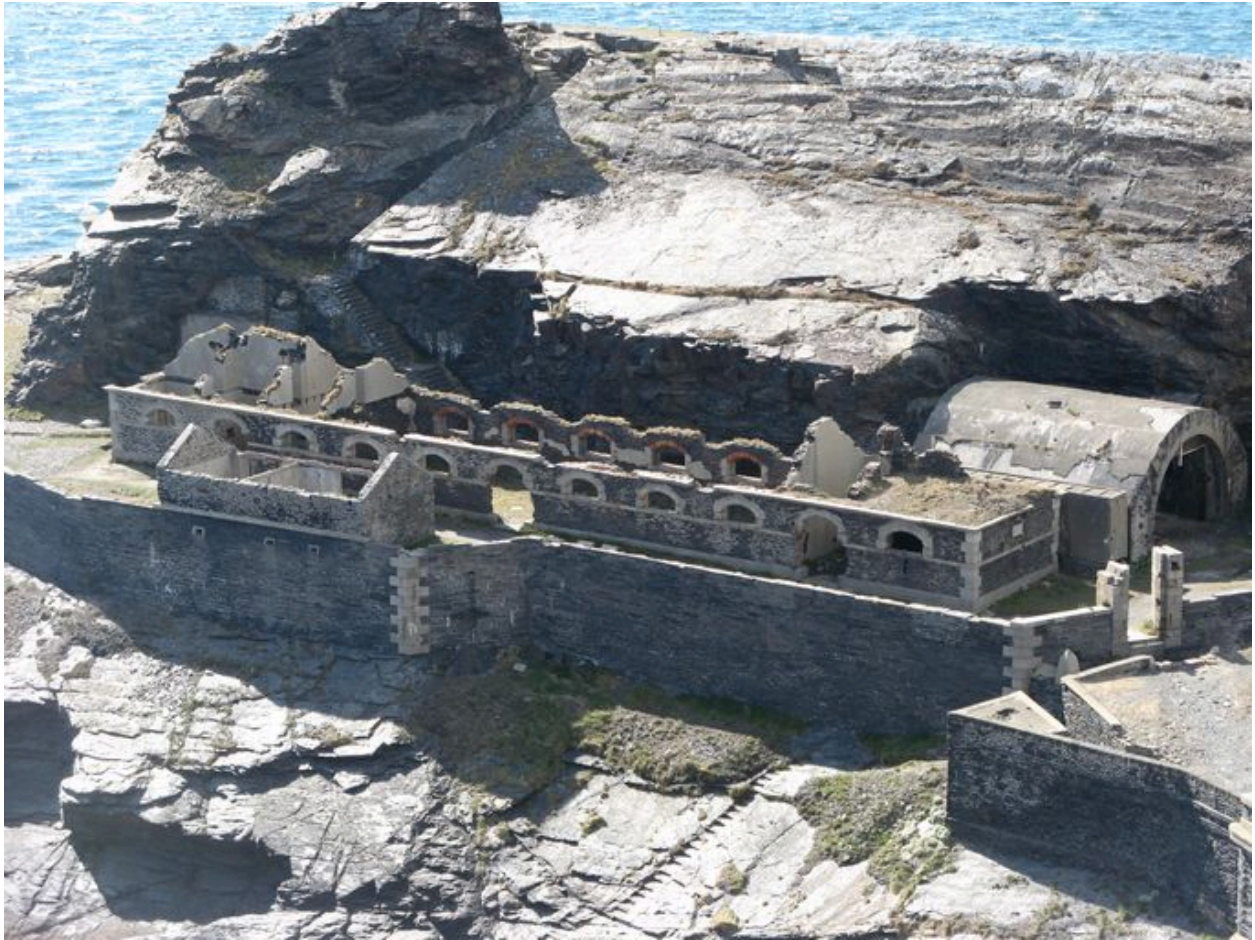
Caserne et usine électrique de l'îlot des Capucins