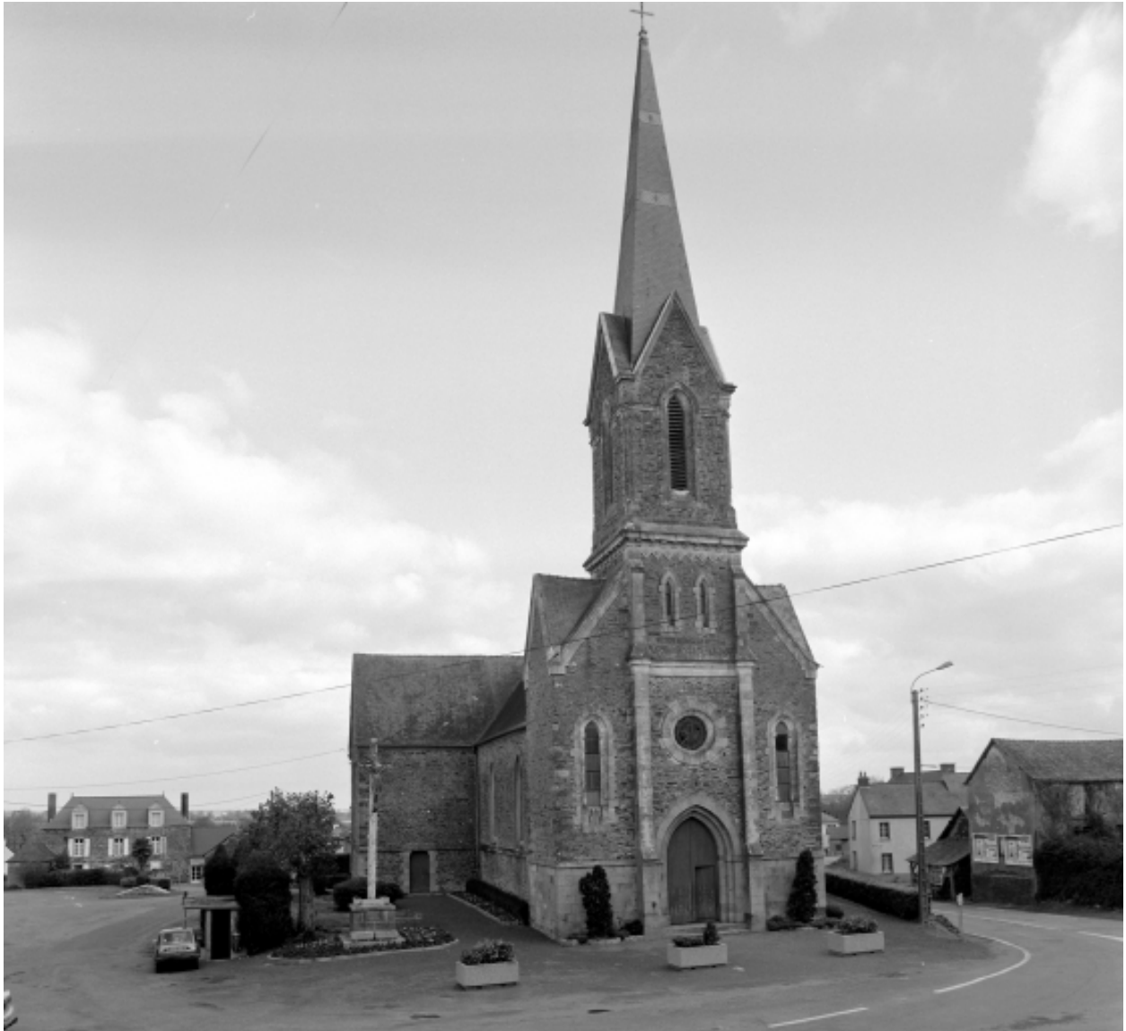
Elévation Sud-Ouest : vue générale