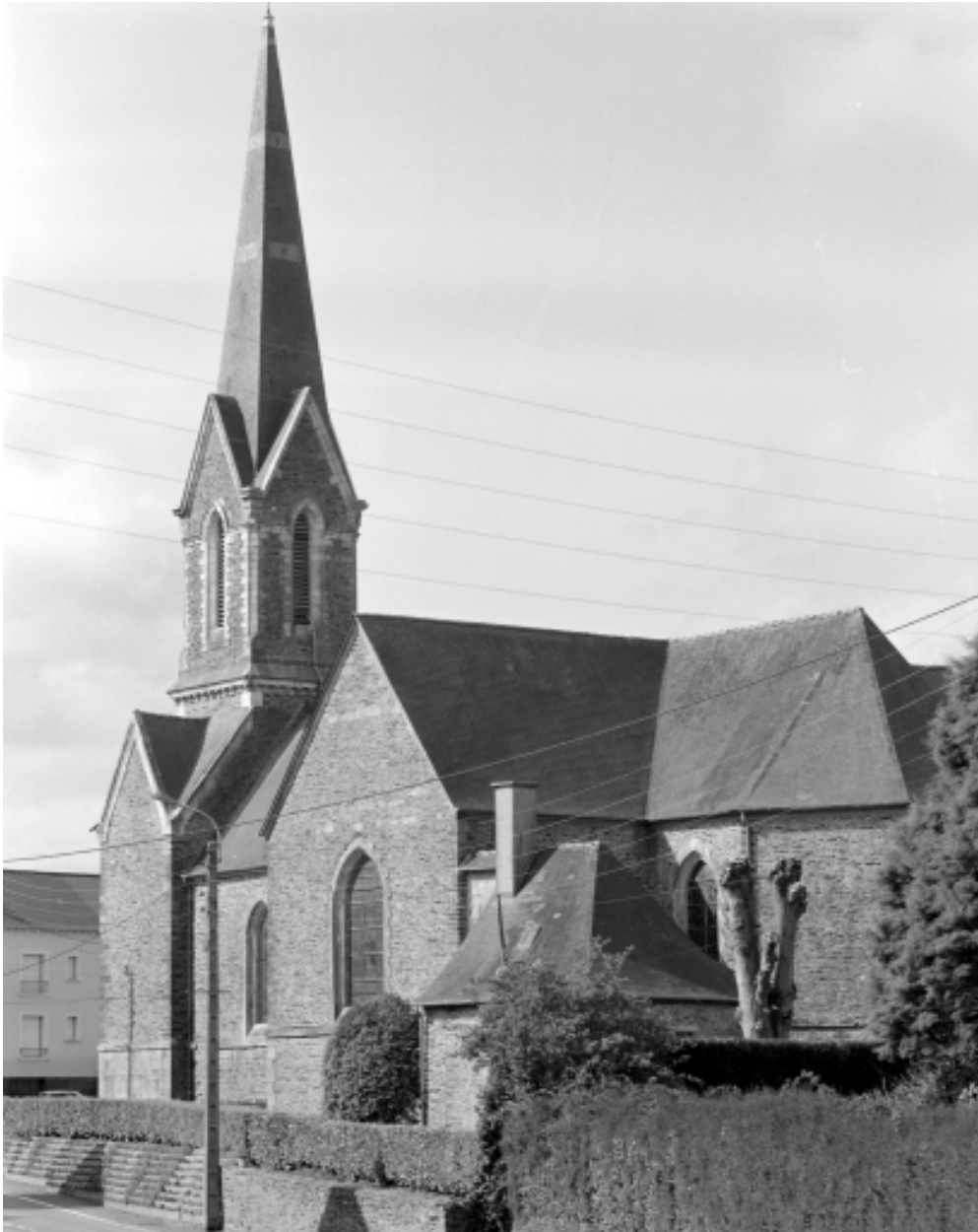
Elévation Est : vue générale