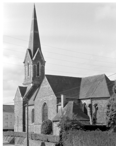
Elévation Est : vue générale IVR53_19943500842X