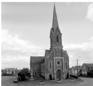
Elévation Sud-Ouest : vue générale IVR53_19943500841X