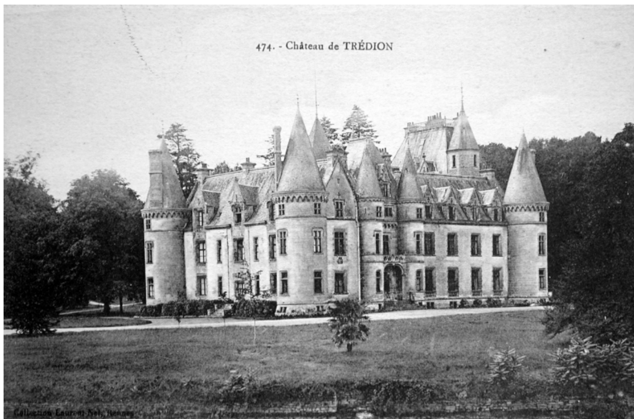
Vue générale côté parc