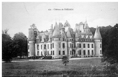
Vue générale côté parc IVR53_20045606213NUCB