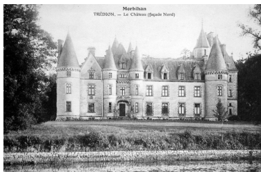
Façade nord IVR53_20045606212NUCB