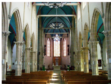
Église paroissiale : vue axiale est (état en 2008) IVR53_20082906270NUCA