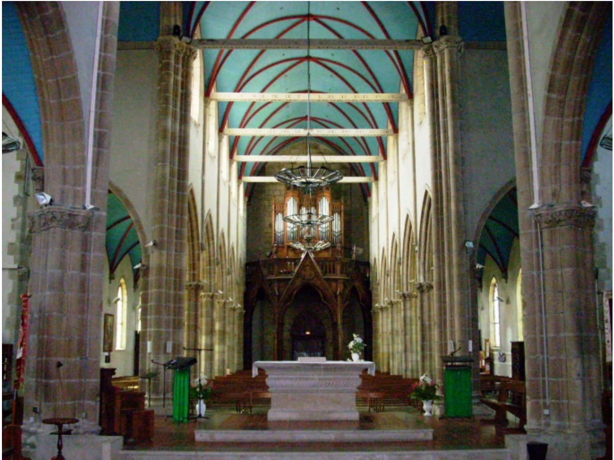
Église paroissiale : vue axiale ouest (état en 2008)