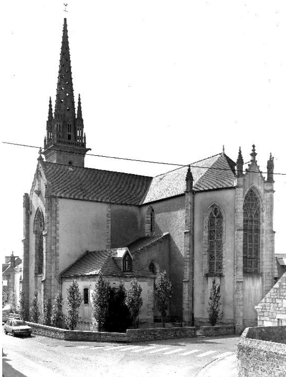
Église paroissiale : élévation est (état en 1986)