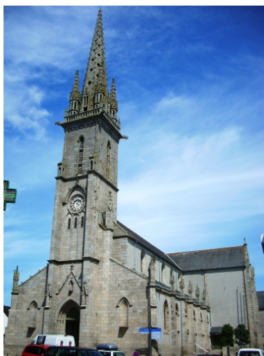
Église paroissiale vue du sud-ouest (état en 2008) IVR53_20082906268NUCA