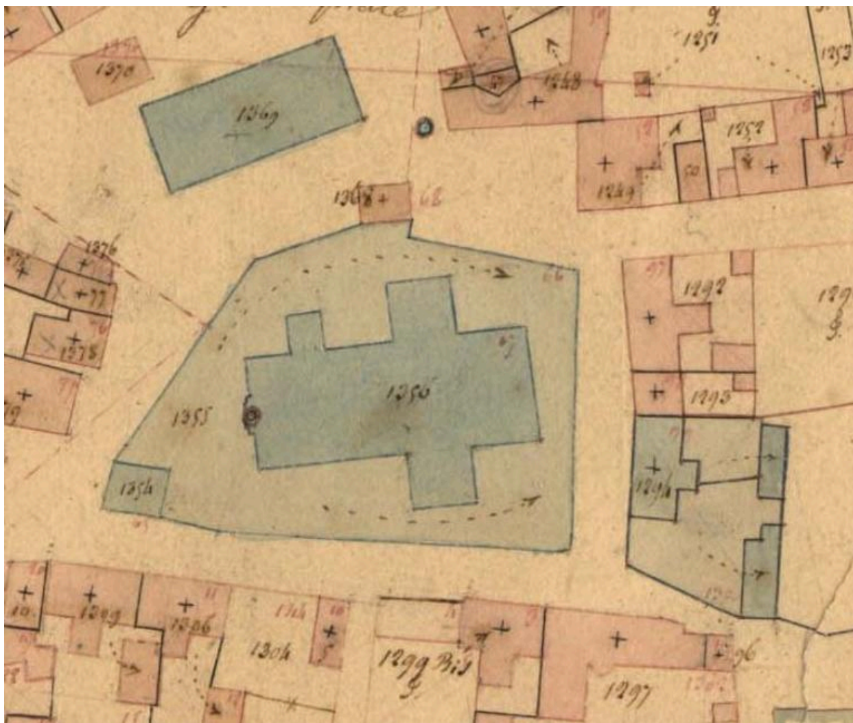
L'église sur le cadastre de 1837 (A. D. du Finistère, 3 P 185/7)