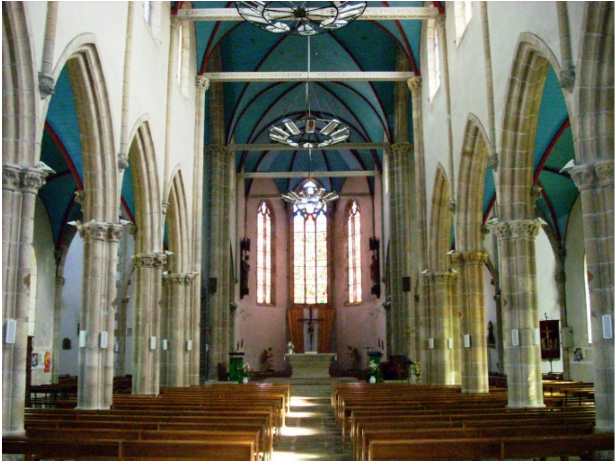
Église paroissiale : vue axiale est (état en 2008)