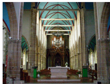
Église paroissiale : vue axiale ouest (état en 2008)