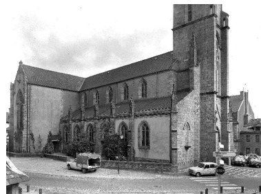
Église paroissiale : élévation nord-ouest (état en 1986) IVR53_19862901290V