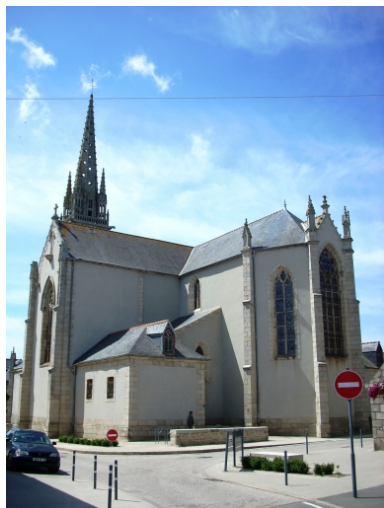
Église paroissiale vue du sud-est (état en 2008)