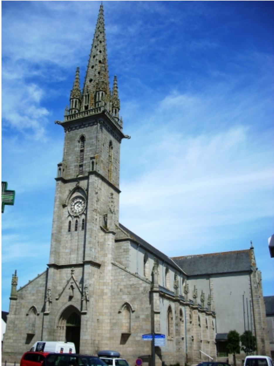
Église paroissiale vue du sud-ouest (état en 2008)