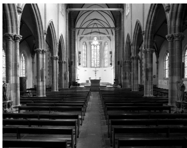
Église paroissiale : vue générale vers le chœur (état en 1986)