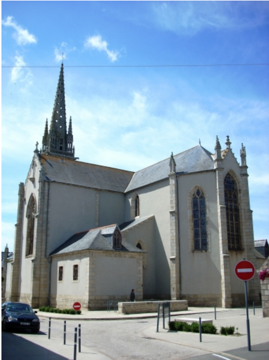
Église paroissiale vue du sud-est (état en 2008)