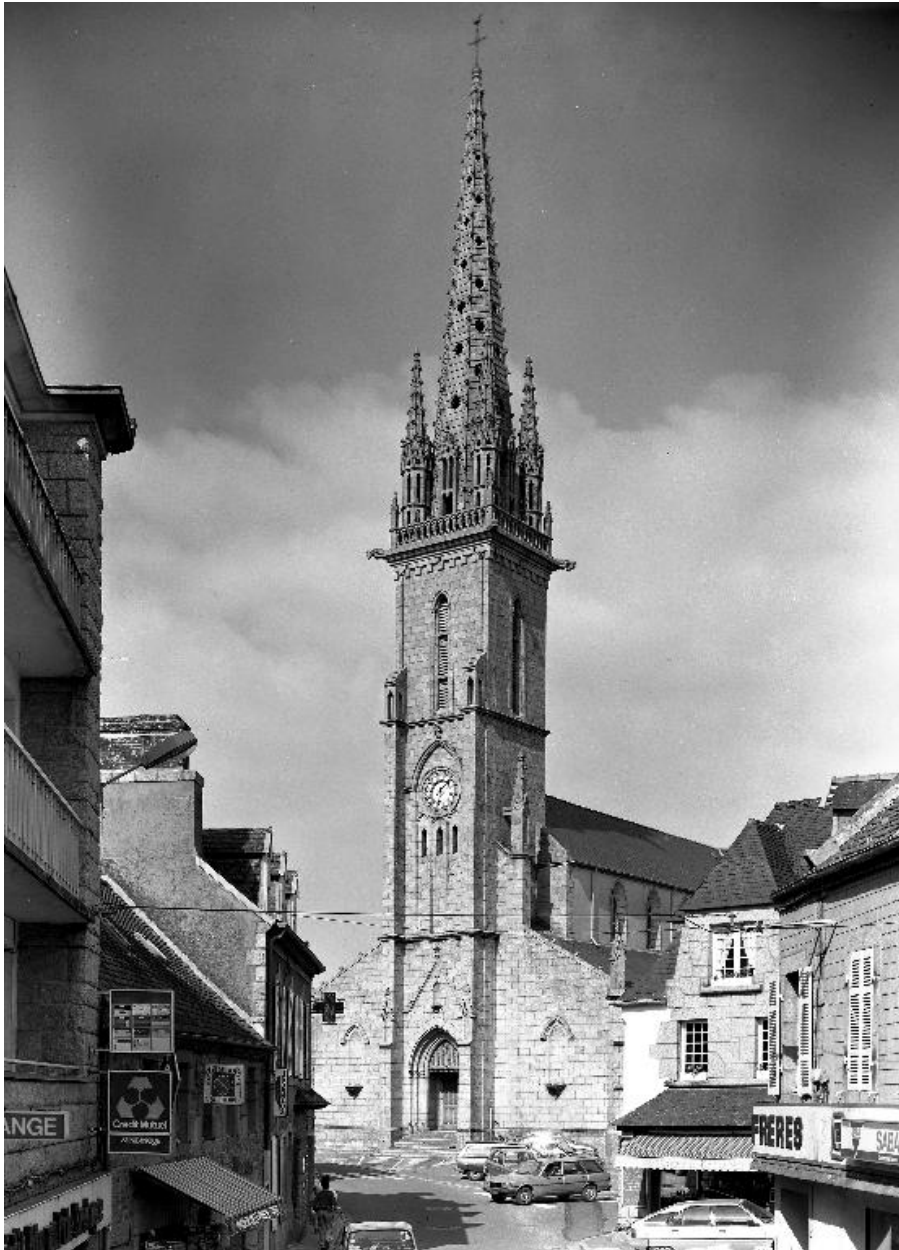
Église paroissiale vue de l'ouest (état en 1986)