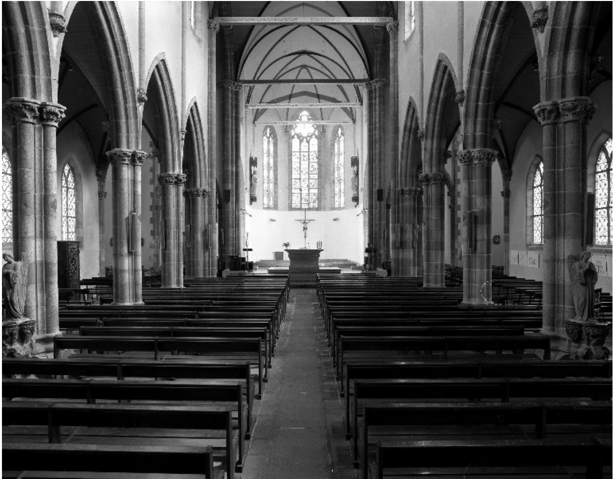
Église paroissiale : vue générale vers le chœur (état en 1986)