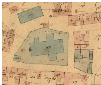
L'église sur le cadastre de 1837 (A. D. du Finistère, 3 P 185/7)