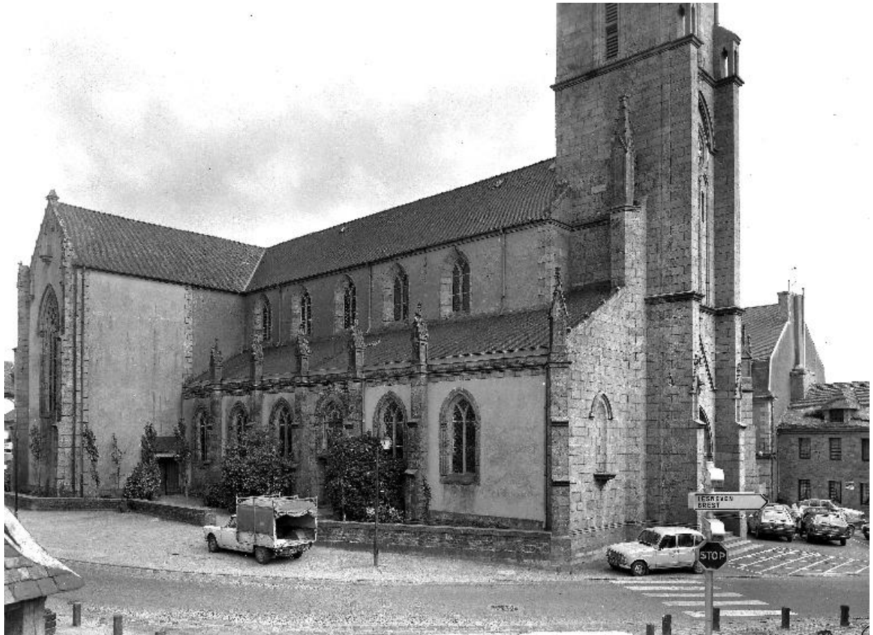
Église paroissiale : élévation nord-ouest (état en 1986)