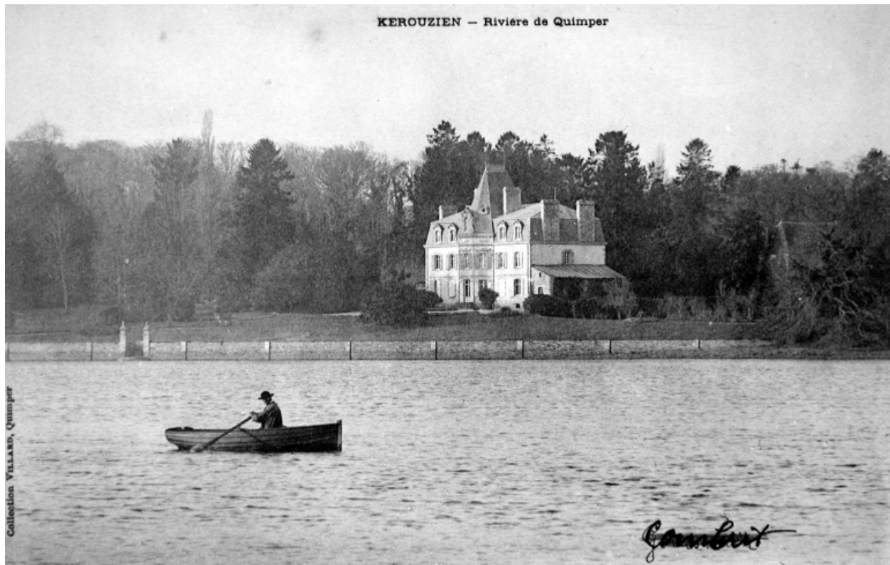
Vue latérale depuis la rivière de Quimper