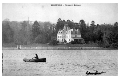
Vue latérale depuis la rivière de Quimper