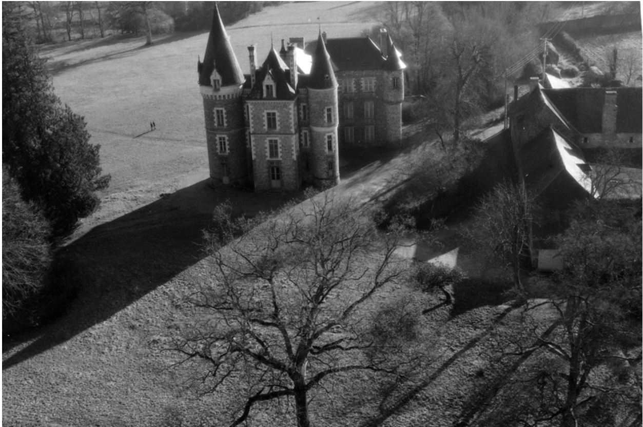
Vue aérienne depuis le nord-ouest