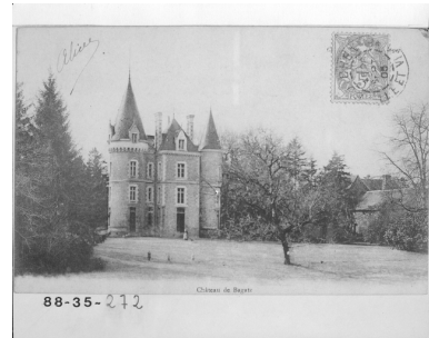
Vue de la façade principale IVR53_19883500272X