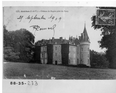
Vue générale sur le parc IVR53_19883500273X