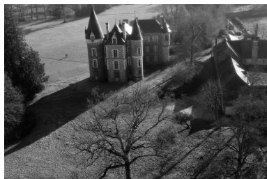
Vue aérienne depuis le nord-ouest IVR53_19713500480V