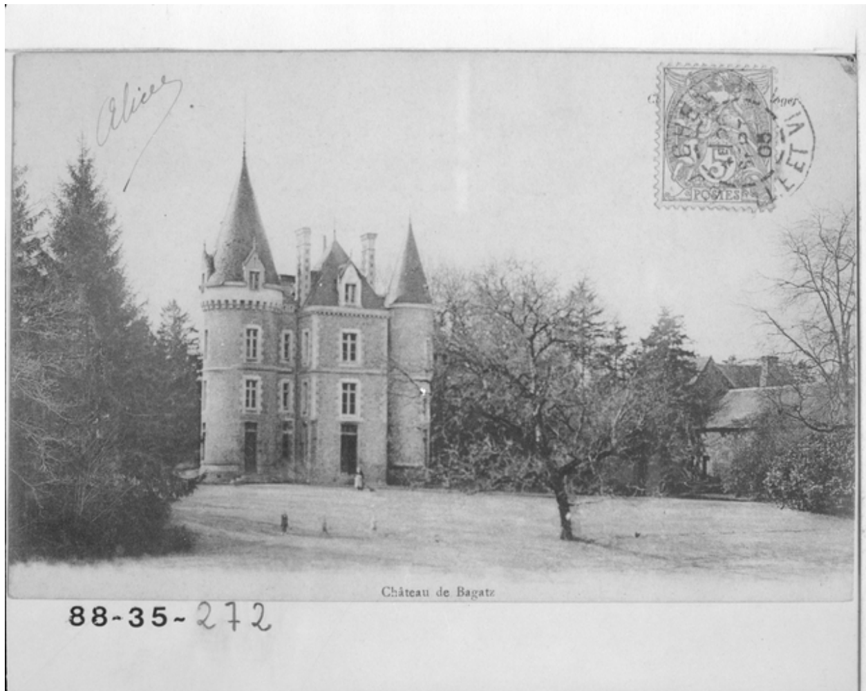
Vue de la façade principale