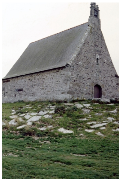
Vue générale prise du sud ouest.

Phot. Isabelle Barbedor IVR53_19943502862ZA