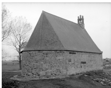
Elévation Nord-Est : vue générale

IVR53_19923500772X