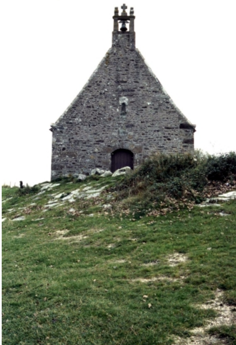
Elévation ouest : vue générale.