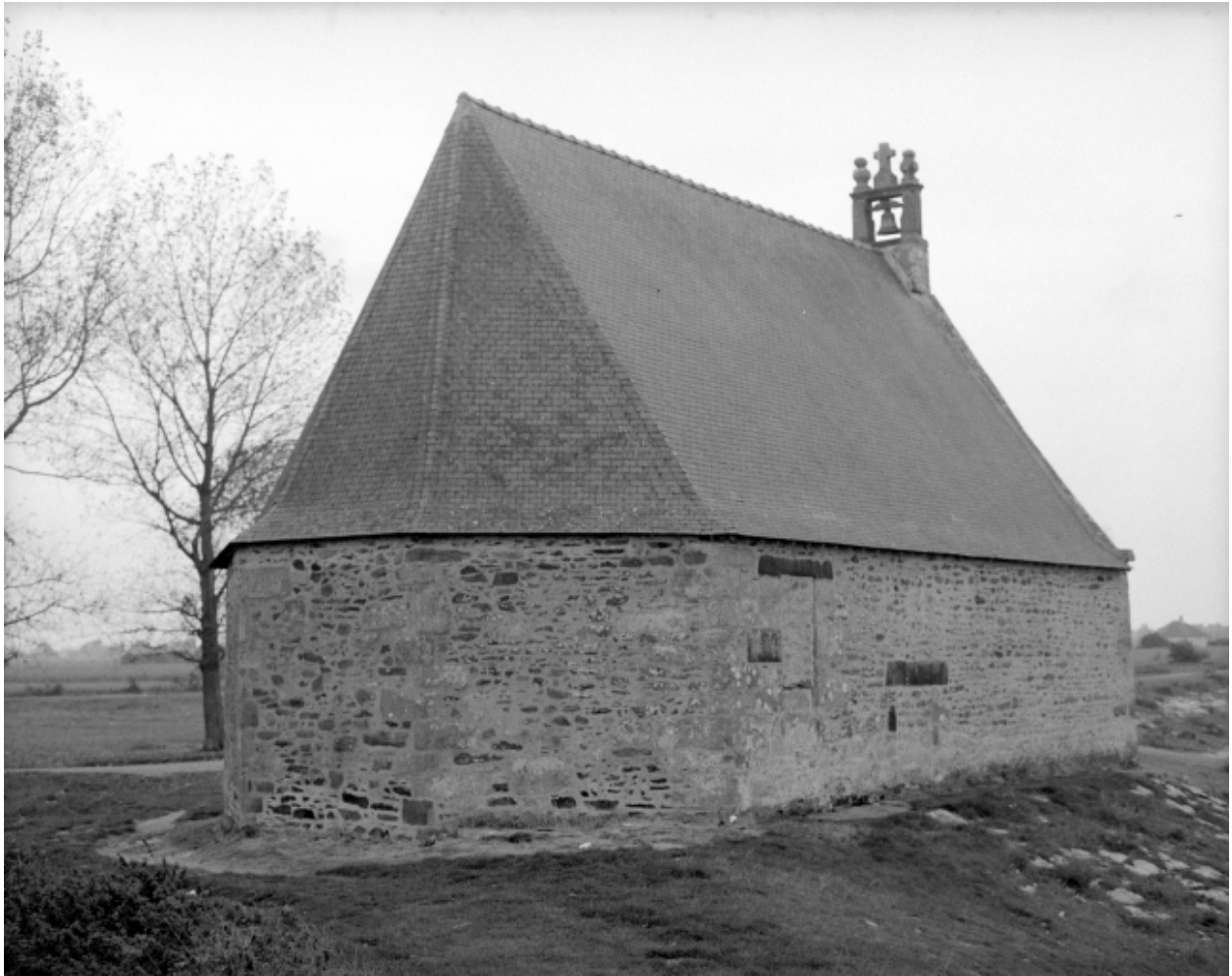
Elévation Nord-Est : vue générale