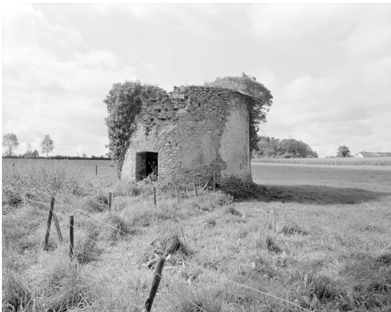
Colombier : vue générale sud-est.