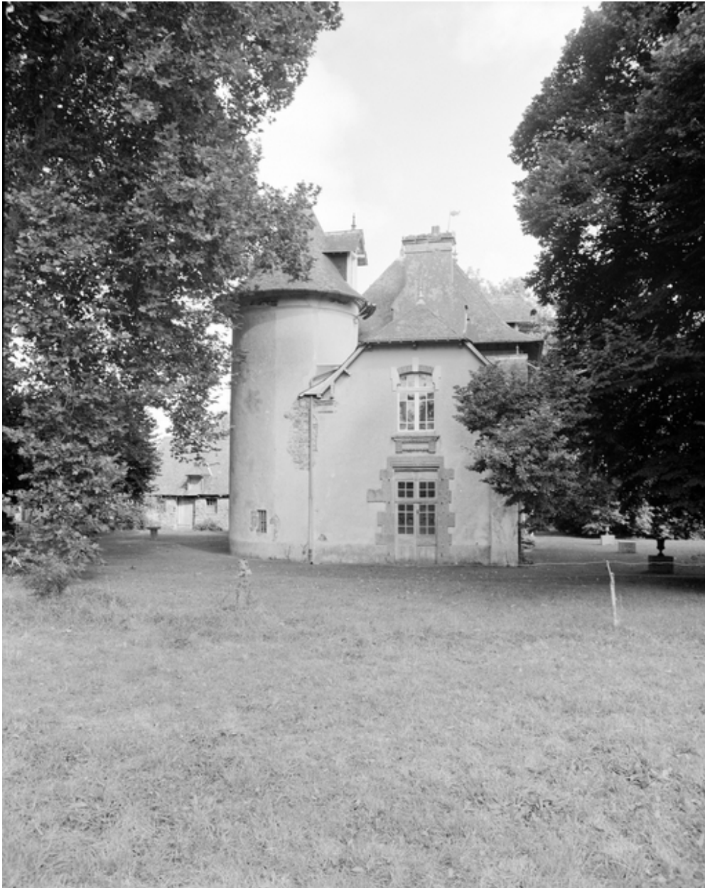
Vue générale sud.