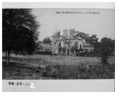
Fonds Lagrée - Carte postale ancienne : 4366 - Saint-M'Hervé (I.-et-V.) - La Bougatrière. IVR53_19883500662X