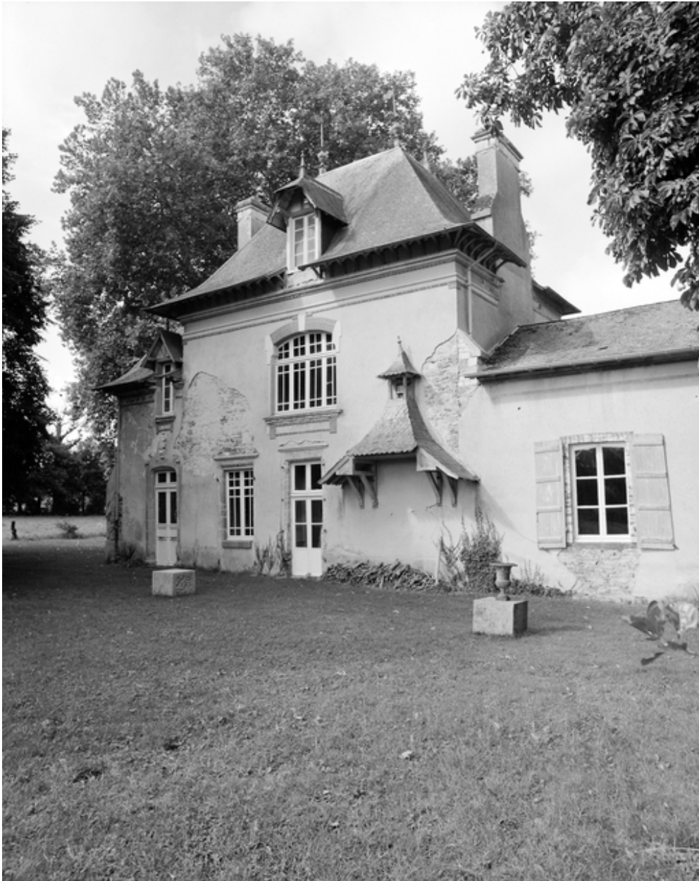
Vue générale est.