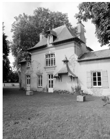
Vue générale est. IVR53_19873500294X