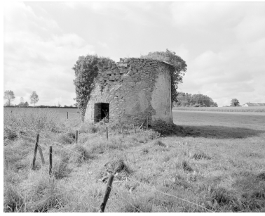
Colombier : vue générale sud-est. IVR53_19873500296X