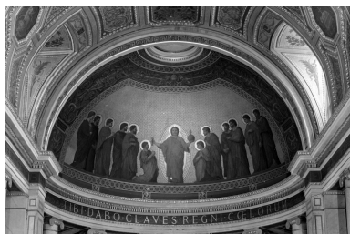
Vue intérieure, chœur, détail