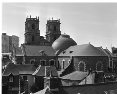
Vue de situation depuis l'hôtel de Blossac