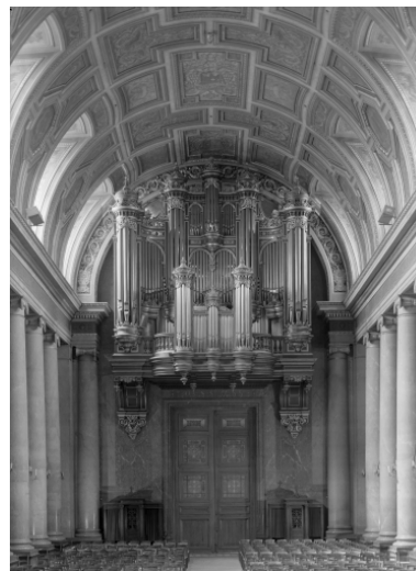
Vue intérieure prise du chœur vers la nef. Vue sur les orgues IVR53_19843501200V