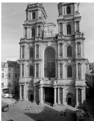
Élévation principale IVR53_20023501878X

IVR53_19933500272X