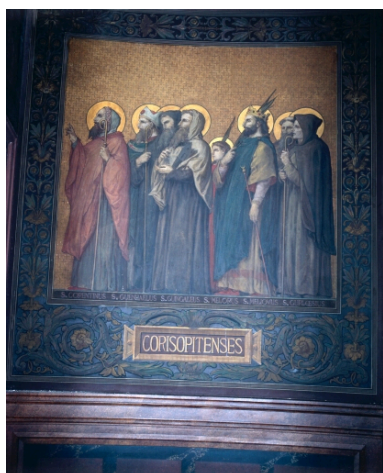
Peinture murale du déambulatoire retraçant le Tro Breiz des anciens diocèses.