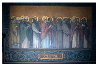
Peinture murale du déambulatoire retraçant le Tro Breiz des anciens diocèses.