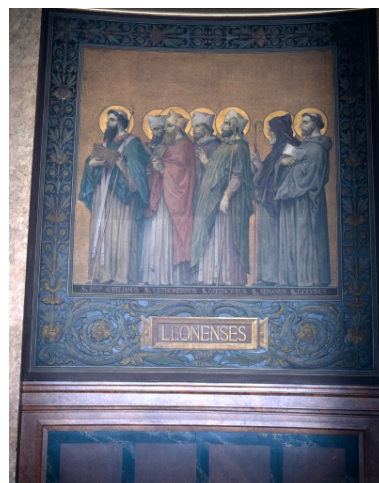
Peinture murale du déambulatoire retraçant le Tro Breiz des anciens diocèses.