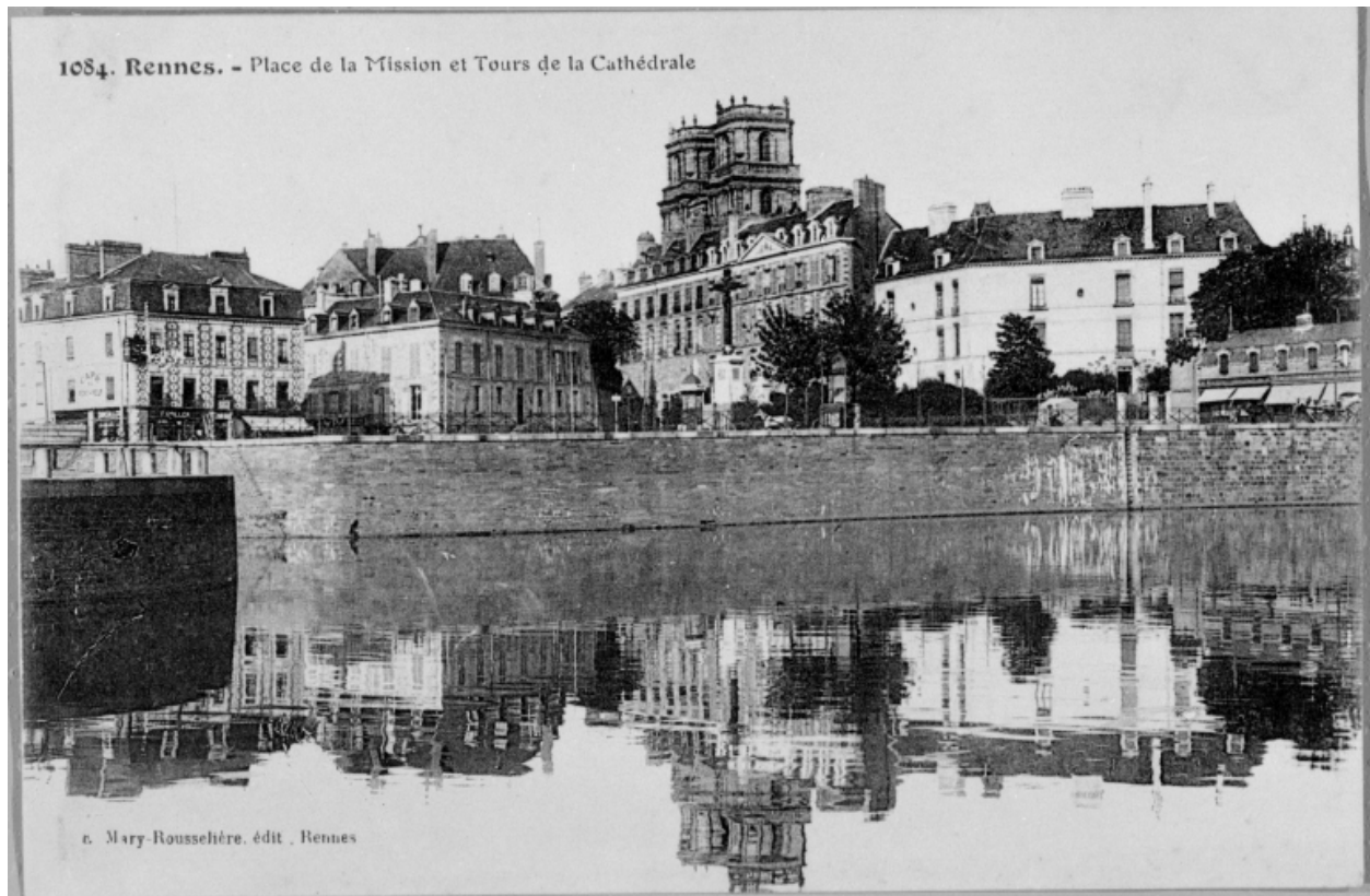
Carte postale ancienne - Vue de la Place de la Mission et des tours de la Cathédrale.