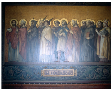
Peinture murale du déambulatoire retraçant le Tro Breiz des anciens diocèses.