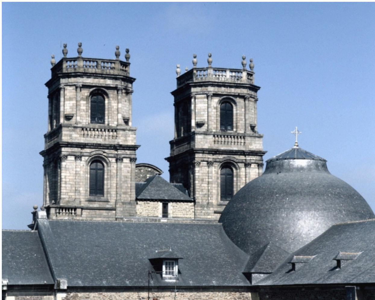
Vue de situation depuis l'hôtel de Blossac