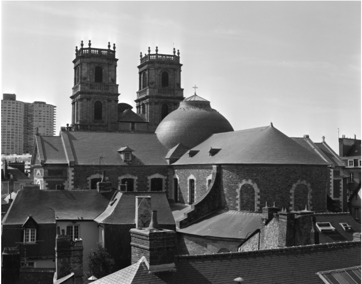
Vue de situation depuis l'hôtel de Blossac