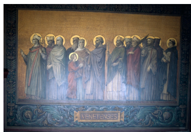
Peinture murale du déambulatoire retraçant le Tro Breiz des anciens diocèses.