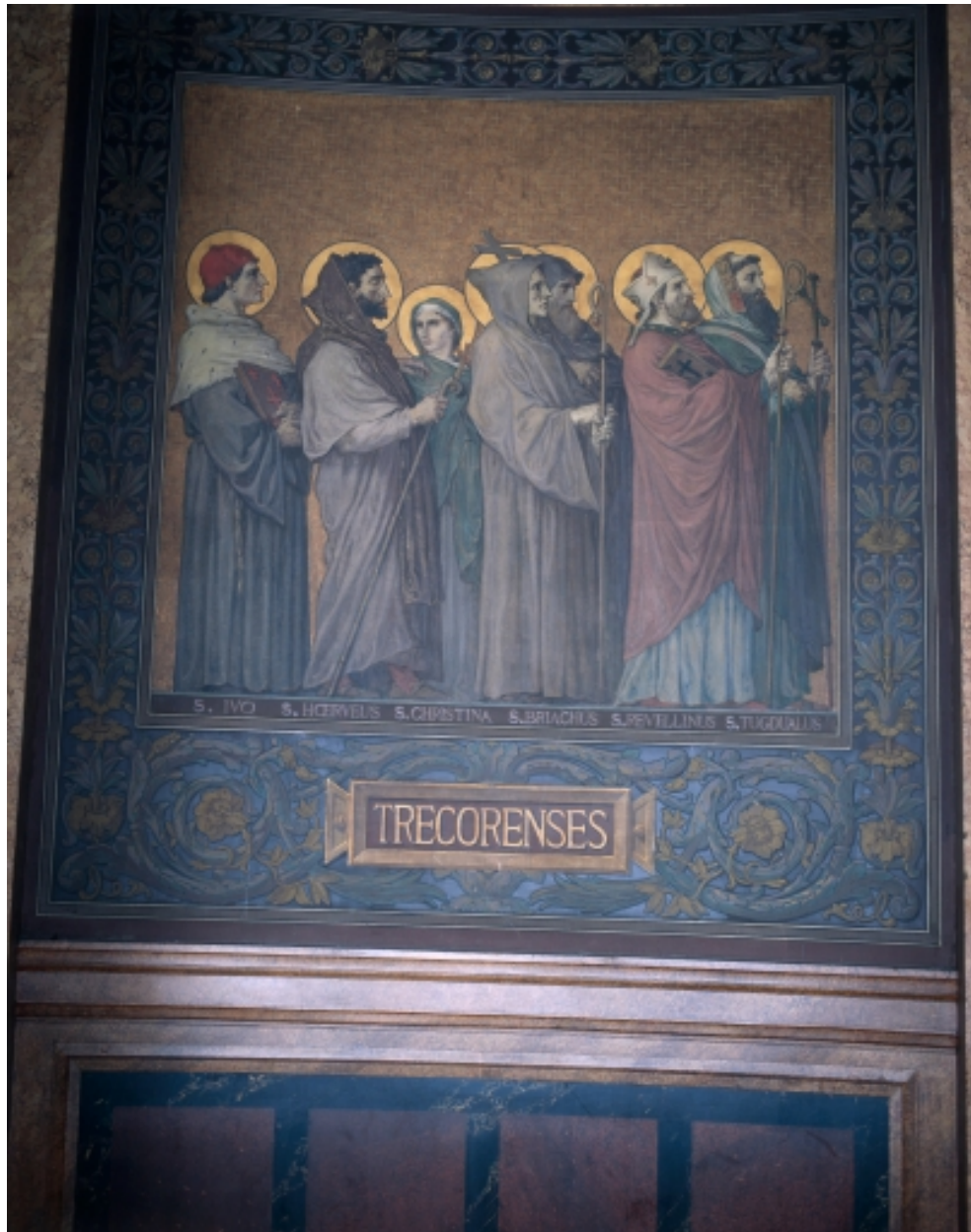
Peinture murale du déambulatoire retraçant le Tro Breiz des anciens diocèses.