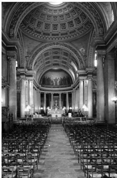
Vue intérieure prise de la nef vers le chœur IVR53_19963500087V