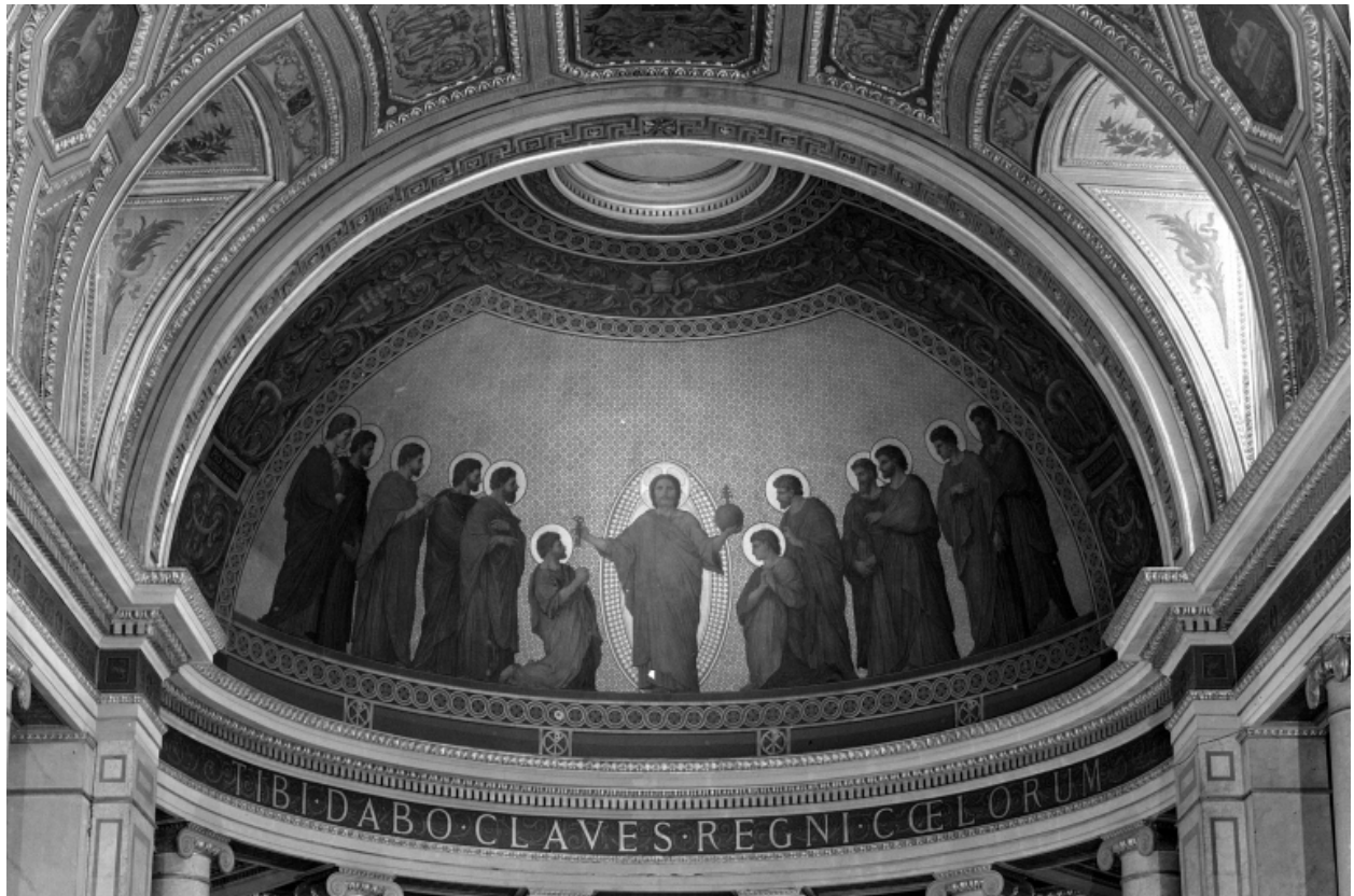
Vue intérieure, chœur, détail