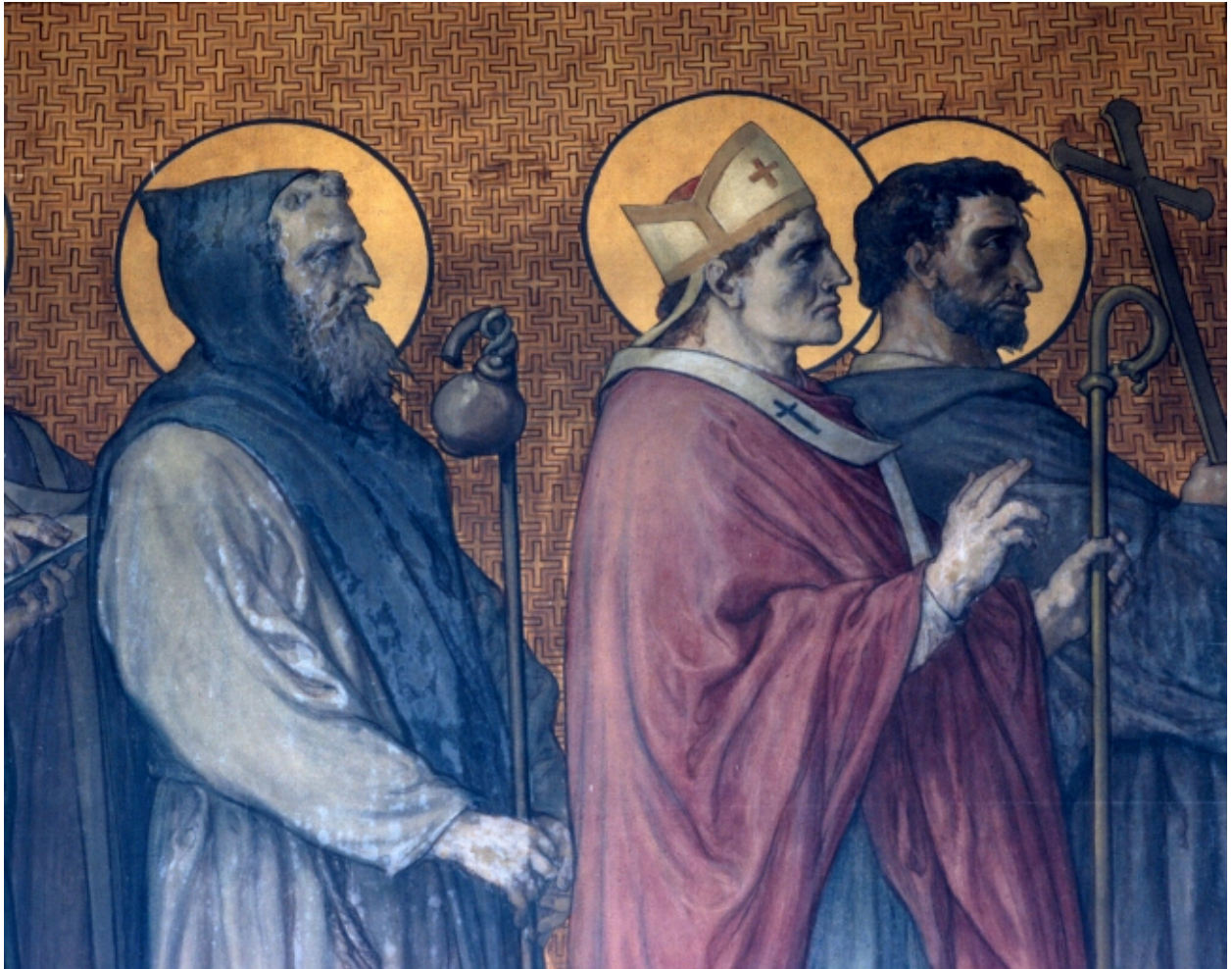
Peinture murale du déambulatoire retraçant le Tro Breiz des anciens diocèses.