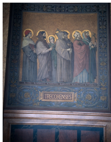
Peinture murale du déambulatoire retraçant le Tro Breiz des anciens diocèses. IVR53_20013501089XA