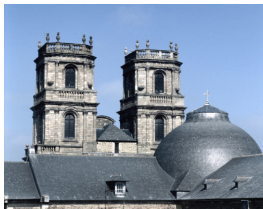
Vue de situation depuis l'hôtel de Blossac