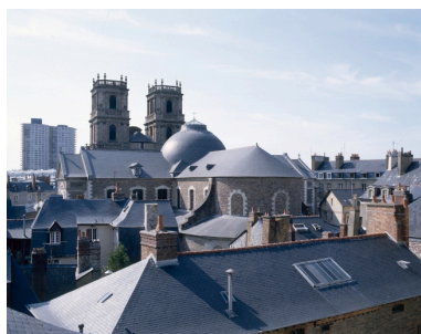
Vue de situation depuis l'hôtel de Blossac