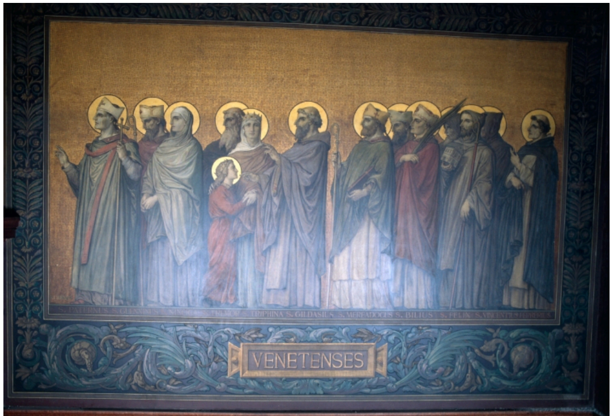
Peinture murale du déambulatoire retraçant le Tro Breiz des anciens diocèses.