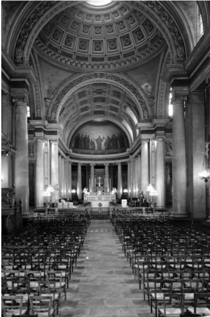
Vue intérieure prise de la nef vers le chœur