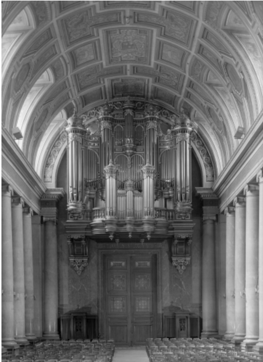
Vue intérieure prise du choeur vers la nef. Vue sur les orgues