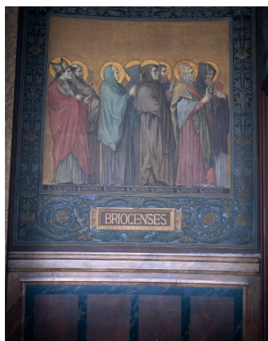
Peinture murale du déambulatoire retraçant le Tro Breiz des anciens diocèses.