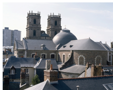
Vue de situation depuis l'hôtel de Blossac