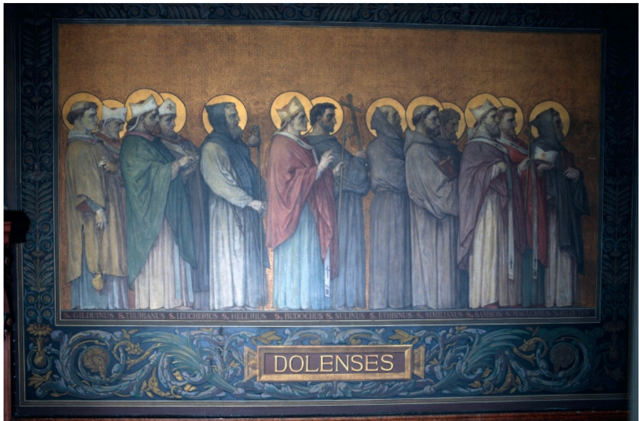
Peinture murale du déambulatoire retraçant le Tro Breiz des anciens diocèses.