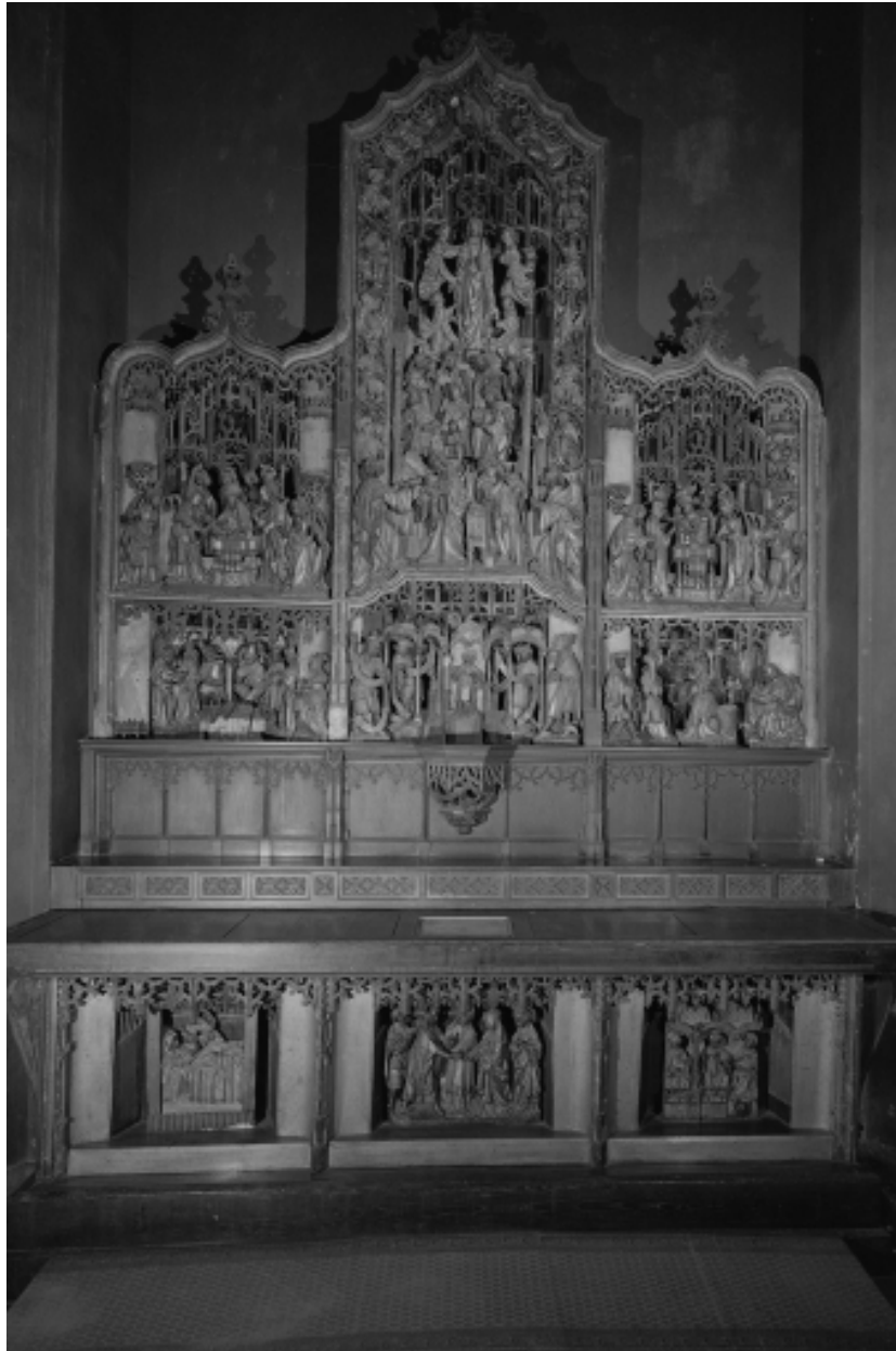
Vue intérieure, mobilier, retable flamand, vue générale.