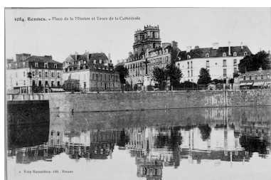
Carte postale ancienne - Vue de la Place de la Mission et des tours de la Cathédrale.

IVR53_19933500272X