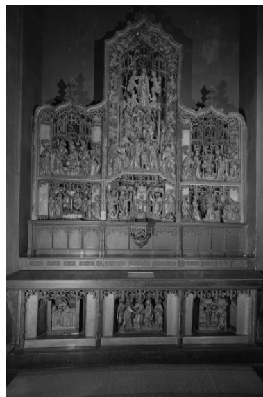
Vue intérieure, mobilier, retable flamand, vue générale. IVR53_19743500234V