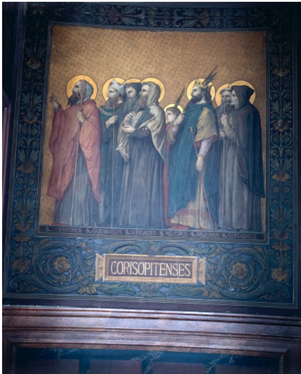
Peinture murale du déambulatoire retraçant le Tro Breiz des anciens diocèses.