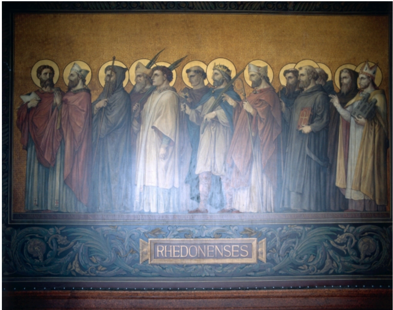
Peinture murale du déambulatoire retraçant le Tro Breiz des anciens diocèses.