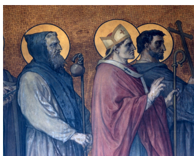
Peinture murale du déambulatoire retraçant le Tro Breiz des anciens diocèses.