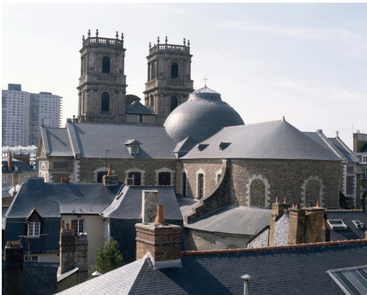
Vue de situation depuis l'hôtel de Blossac