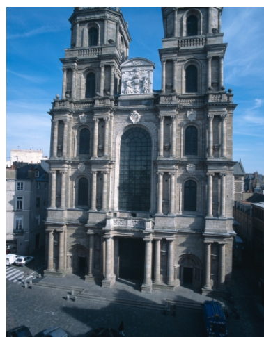
Élévation principale IVR53_20023501879XA