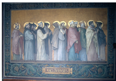
Peinture murale du déambulatoire retraçant le Tro Breiz des anciens diocèses.