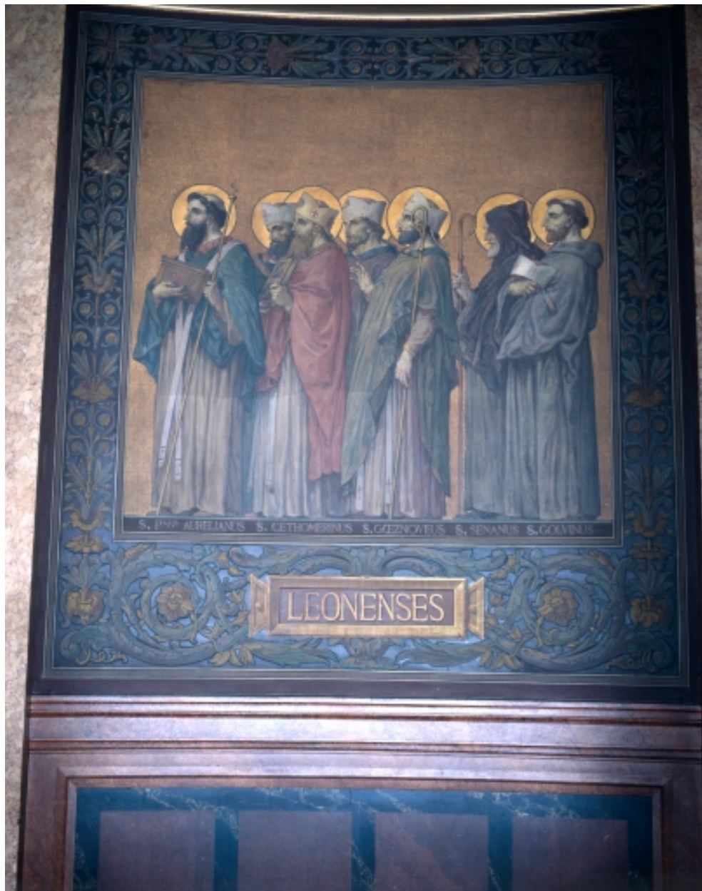
Peinture murale du déambulatoire retraçant le Tro Breiz des anciens diocèses.