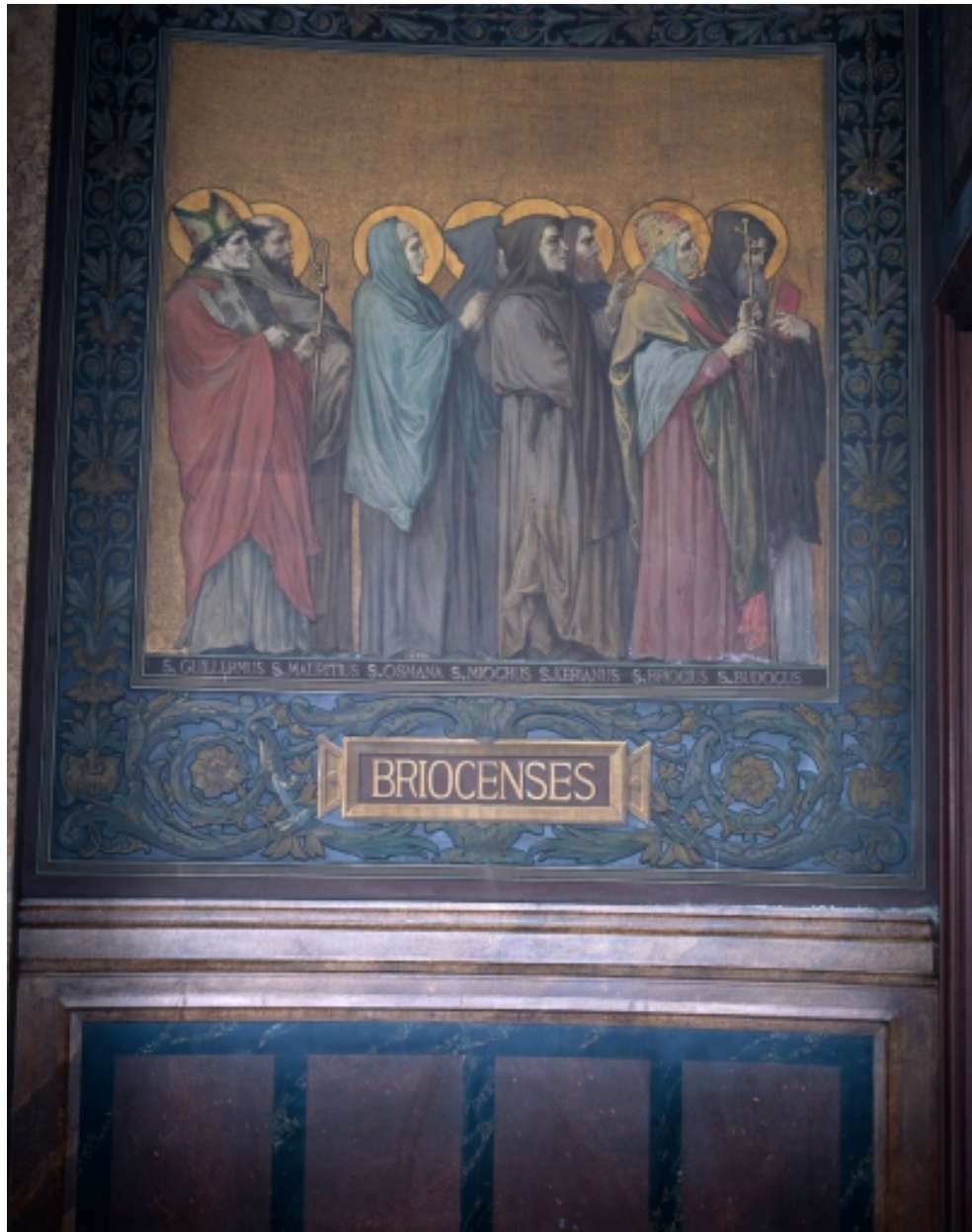
Peinture murale du déambulatoire retraçant le Tro Breiz des anciens diocèses.