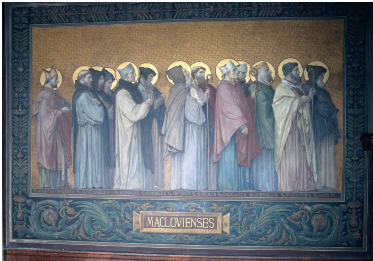
Peinture murale du déambulatoire retraçant le Tro Breiz des anciens diocèses.