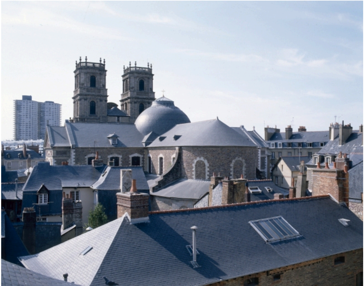
Vue de situation depuis l'hôtel de Blossac