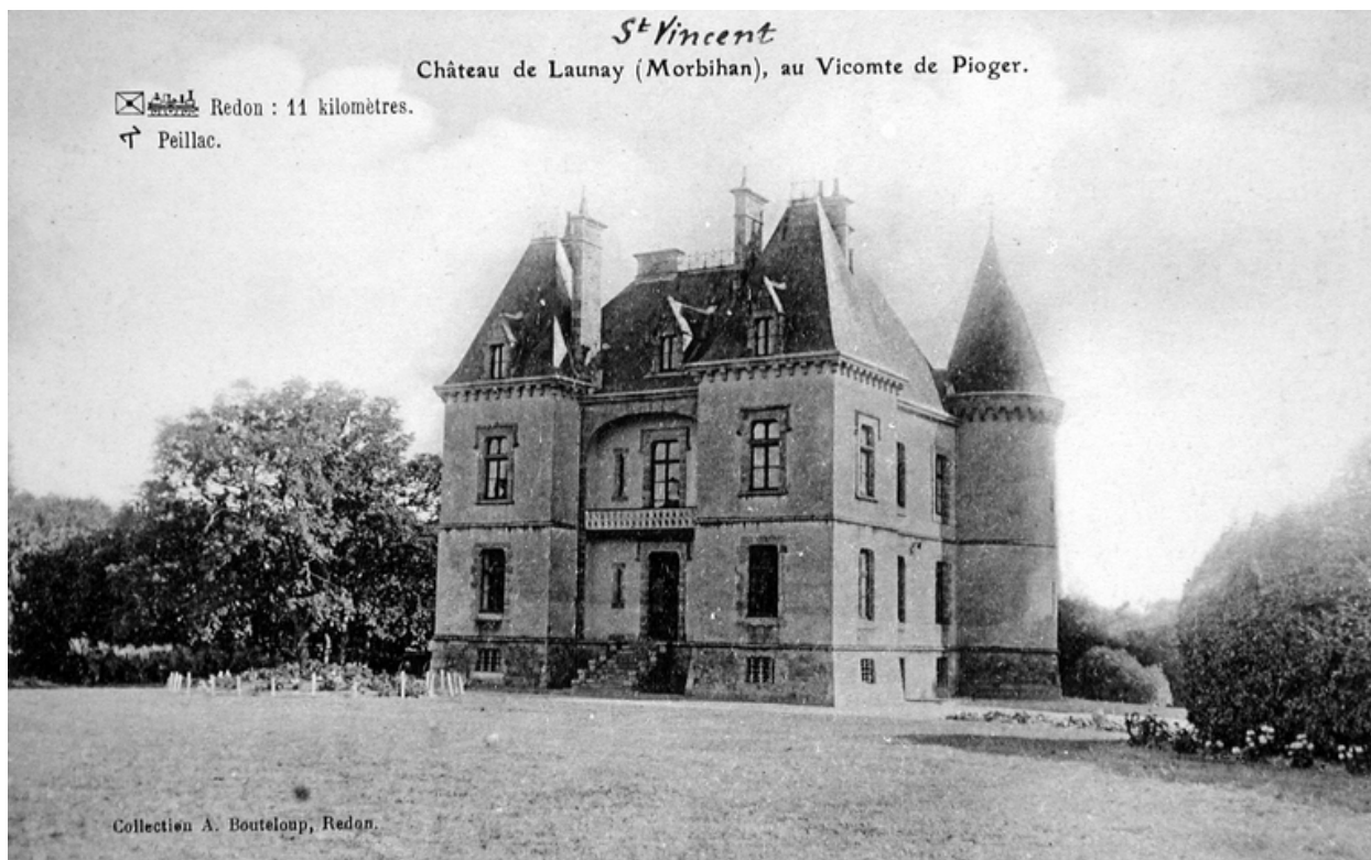
Château de Launay (Morbihan) au vicomte de Pioger. Carte postale, limite 19e-20e siècles (A. D. Ille-&-Vilaine, 6 Fi)