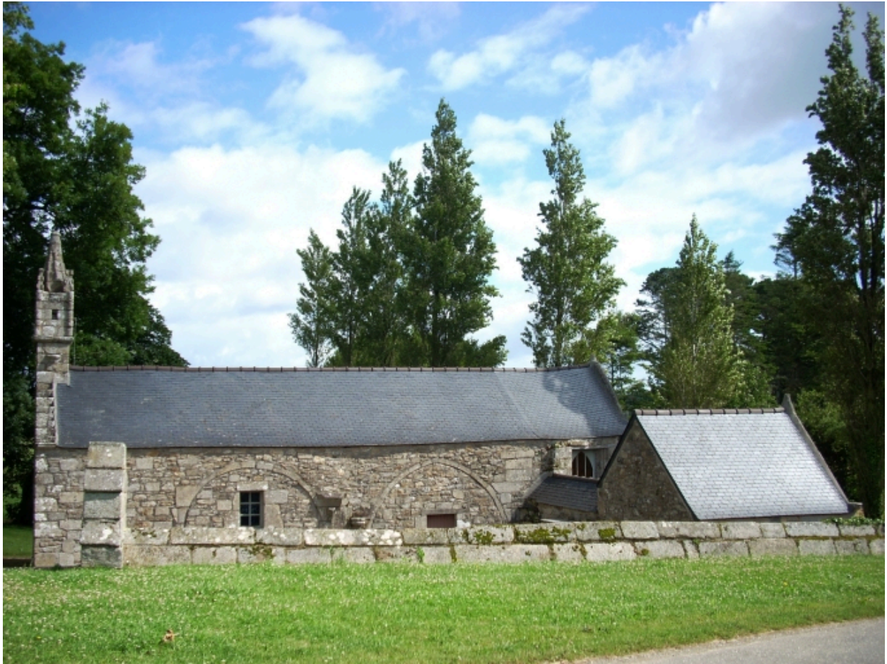
Saint-Vougay, chapelle Saint-Jean-Baptiste : élévation sud