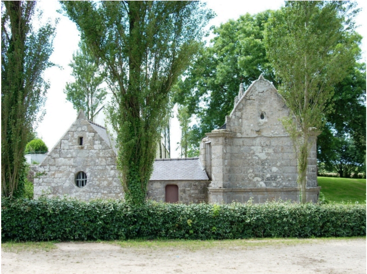
Saint-Vougay, chapelle Saint-Jean-Baptiste : élévation est