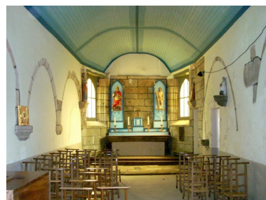
Saint-Vougay, chapelle Saint-Jean-Baptiste : vue axiale est IVR53_20082906524NUCA

IVR53_20082906522NUCA