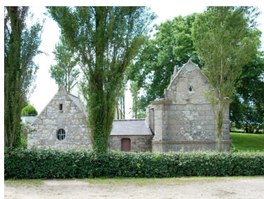
Saint-Vougay, chapelle Saint-Jean-Baptiste : élévation est