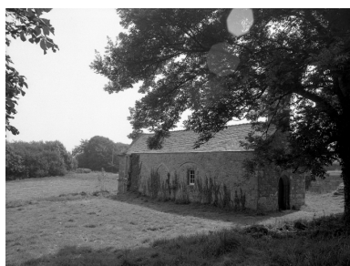
Saint-Vougay, chapelle Saint-Jean-Baptiste : vue générale nord-ouest, état en 1983 IVR53_19832901701X