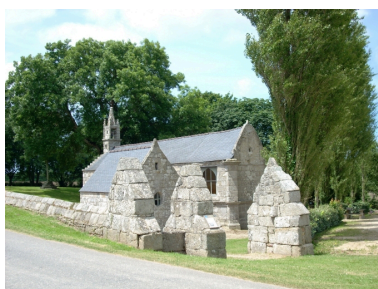
Saint-Vougay, chapelle Saint-Jean-Baptiste : vue générale sud-est IVR53_20082906518NUCA