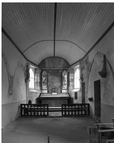
Saint-Vougay, chapelle Saint-Jean-Baptiste : vue générale de la nef vers le chœur, état en 1983 IVR53_19832901689X

IVR53_20082906522NUCA