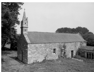
Saint-Vougay, chapelle Saint-Jean-Baptiste : vue générale sud-ouest, état en 1983 IVR53_19832901705X