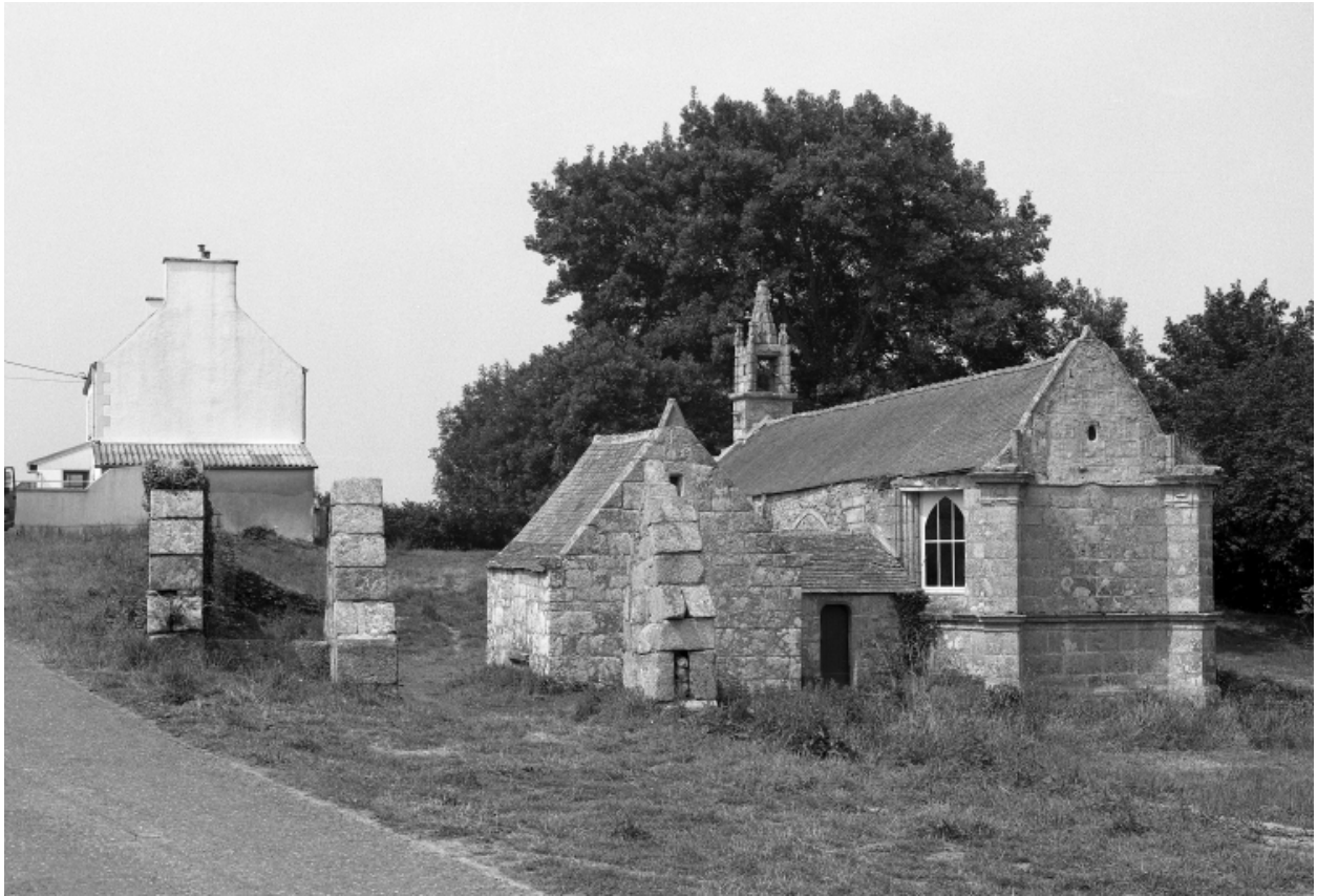
Saint-Vougay, chapelle Saint-Jean-Baptiste : chevet, vue générale, état en 1983