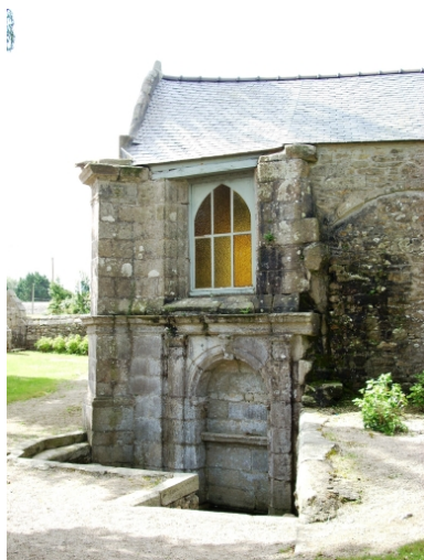
Saint-Vougay, chapelle Saint-Jean-Baptiste : fontaine de dévotion, détail IVR53_20082906523NUCA