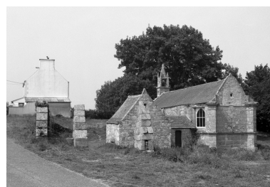
Saint-Vougay, chapelle Saint-Jean-Baptiste : chevet, vue générale, état en 1983