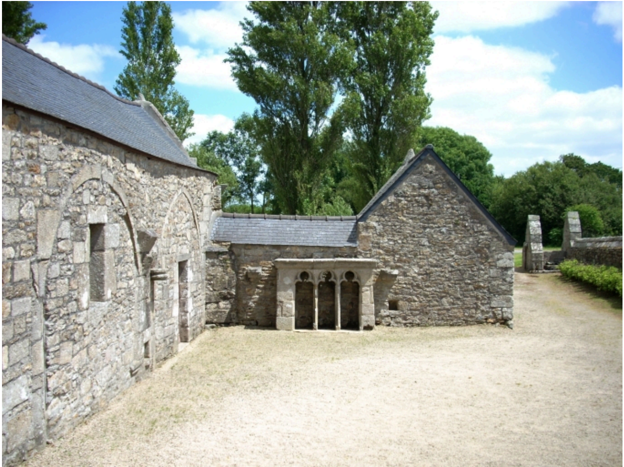
Saint-Vougay, chapelle Saint-Jean-Baptiste : vue générale ouest de l'ossuaire, détail