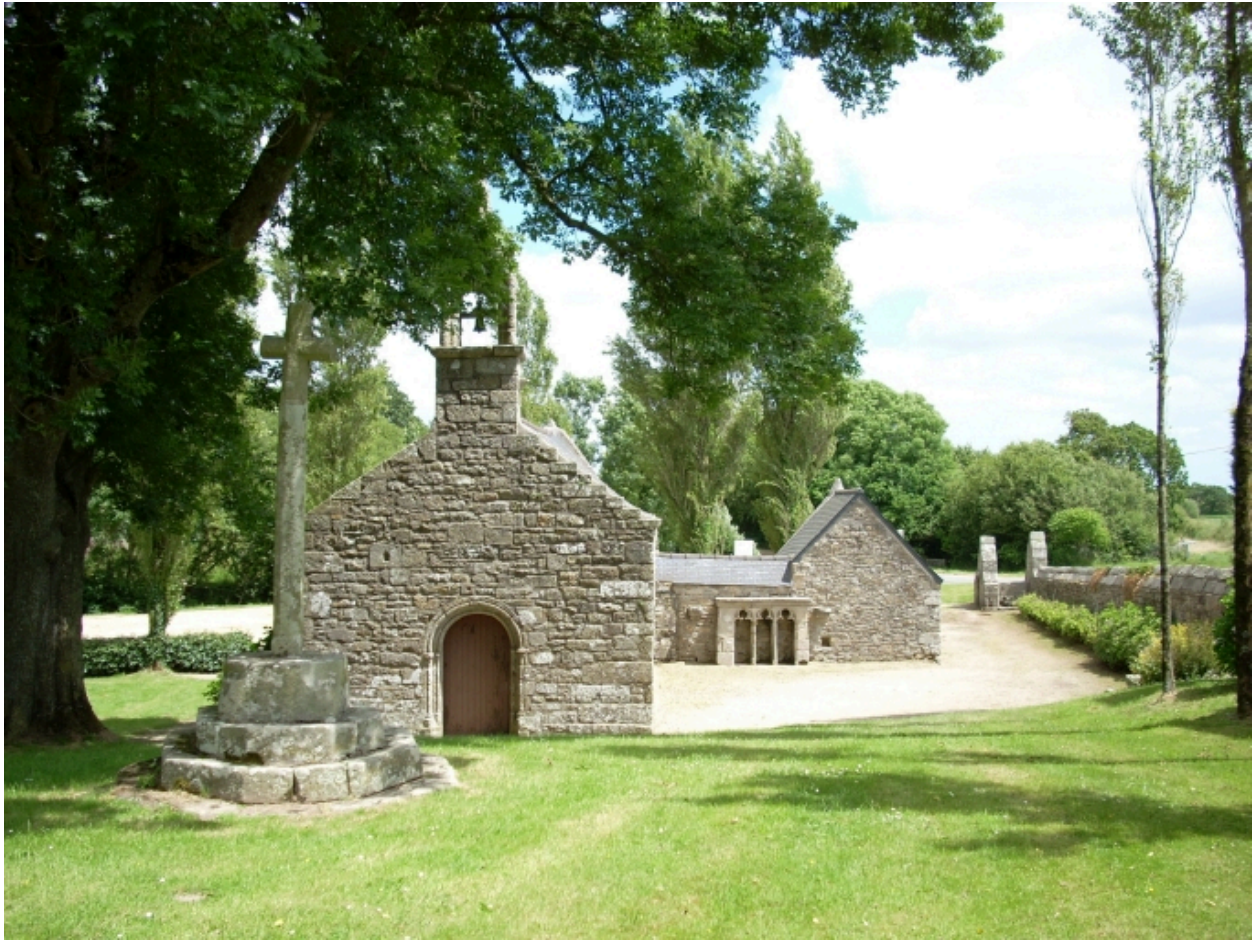
Saint-Vougay, chapelle Saint-Jean-Baptiste : vue générale ouest