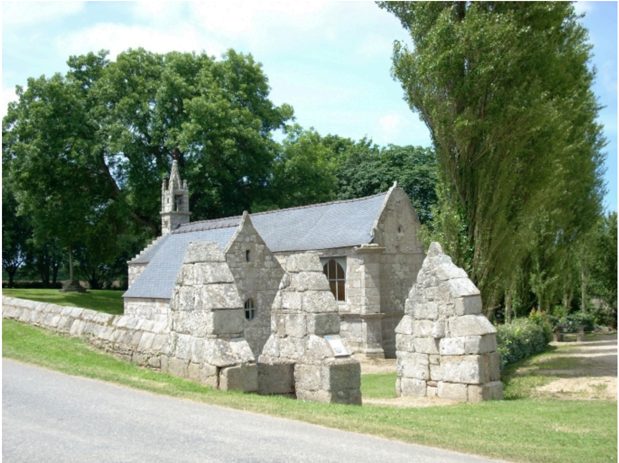
Saint-Vougay, chapelle Saint-Jean-Baptiste : vue générale sud-est