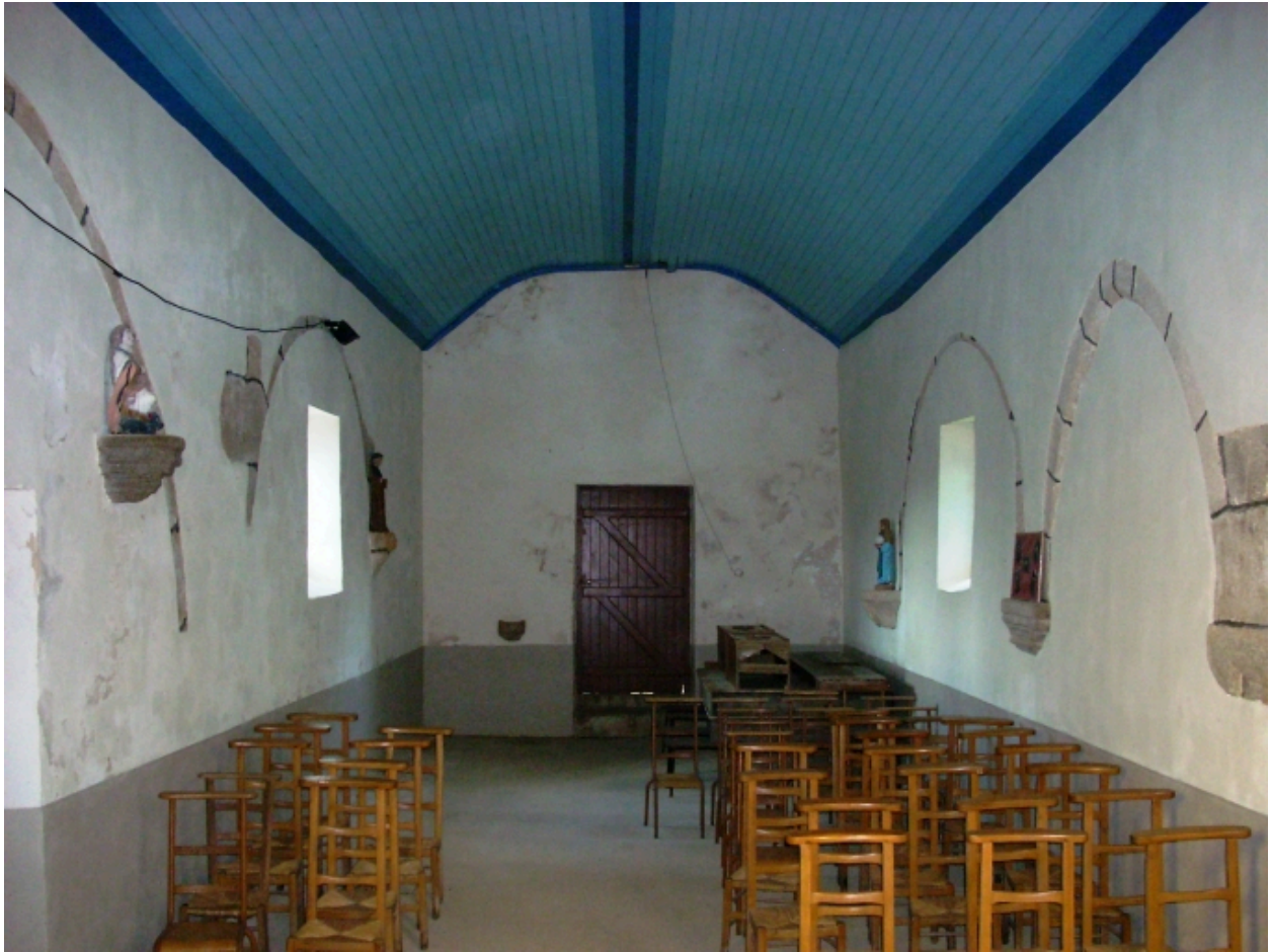
Saint-Vougay, chapelle Saint-Jean-Baptiste : vue axiale ouest