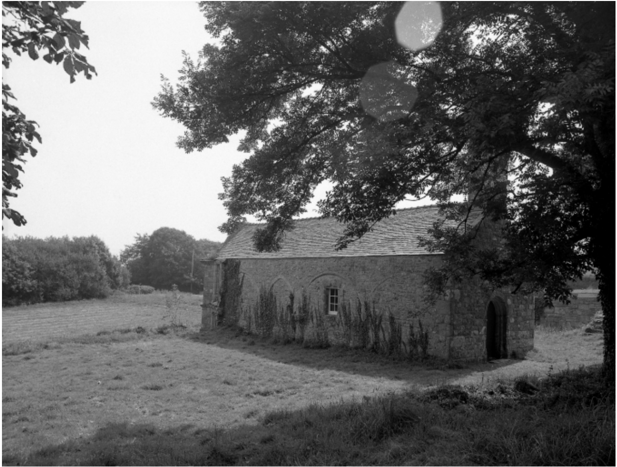
Saint-Vougay, chapelle Saint-Jean-Baptiste : vue générale nord-ouest, état en 1983