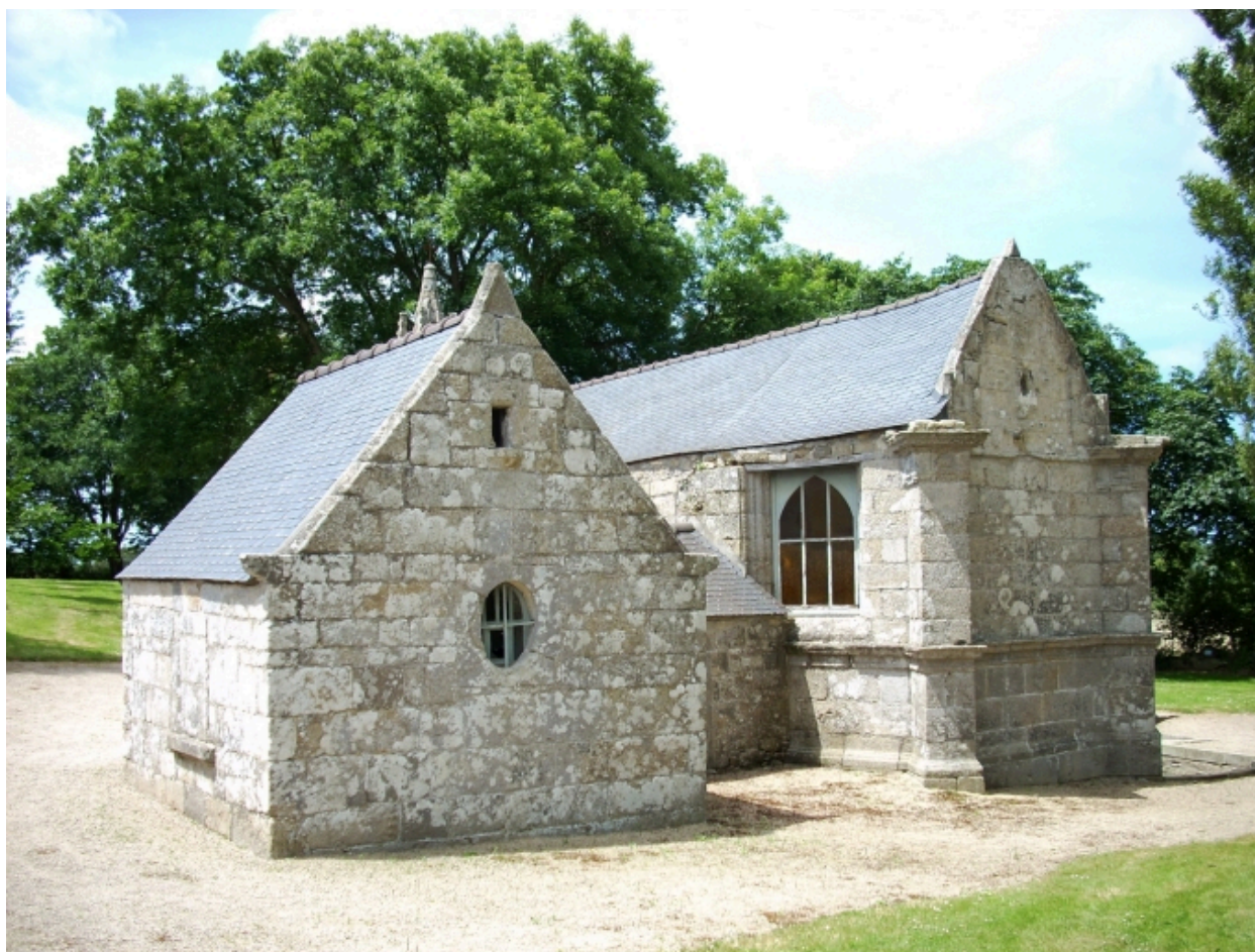
Saint-Vougay, chapelle Saint-Jean-Baptiste : vue générale sud-est