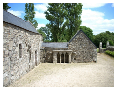
Saint-Vougay, chapelle Saint-Jean-Baptiste : vue générale ouest de l'ossuaire, détail