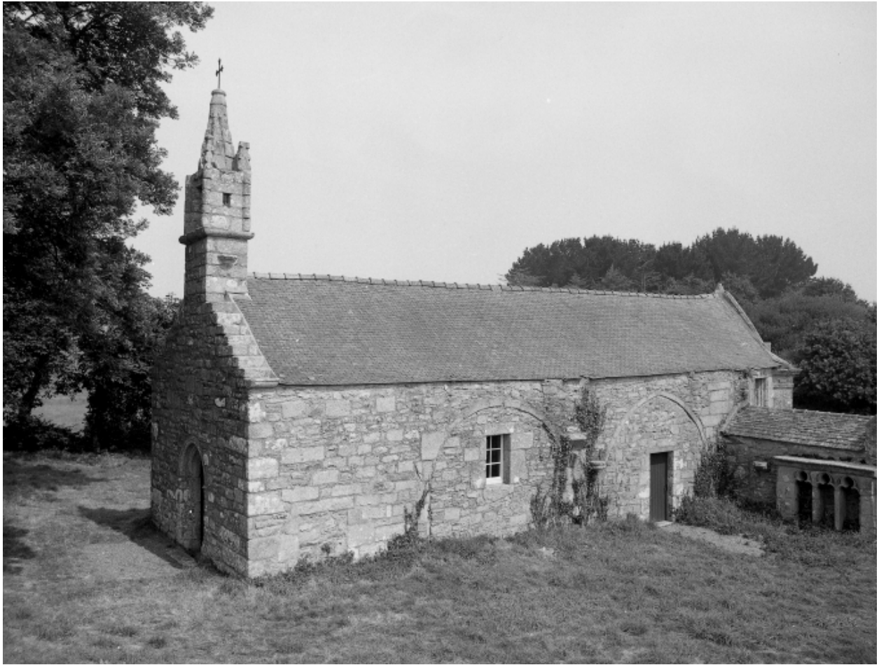
Saint-Vougay, chapelle Saint-Jean-Baptiste : vue générale sud-ouest, état en 1983