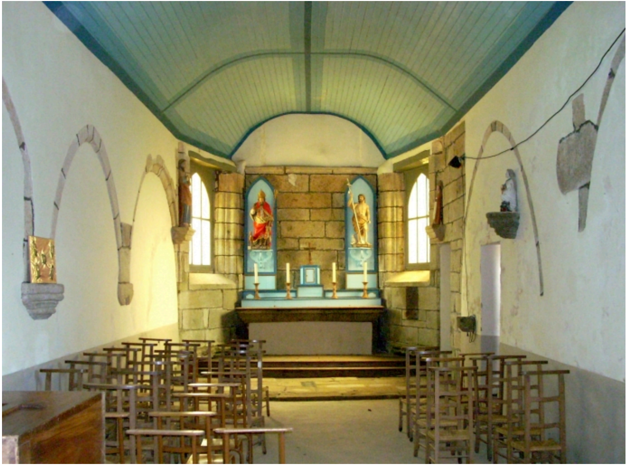
Saint-Vougay, chapelle Saint-Jean-Baptiste : vue axiale est