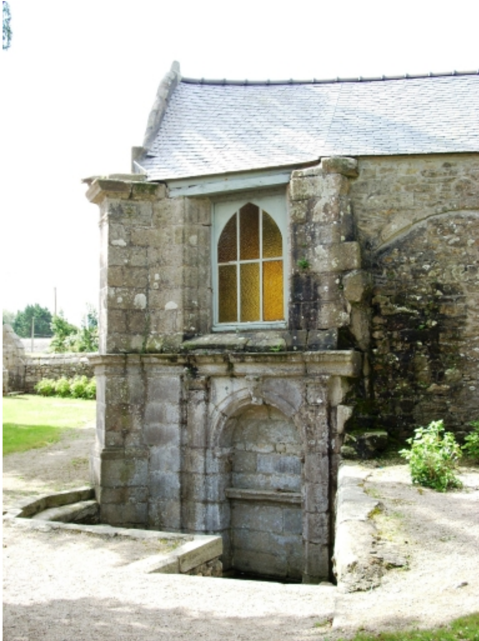
Saint-Vougay, chapelle Saint-Jean-Baptiste : fontaine de dévotion, détail