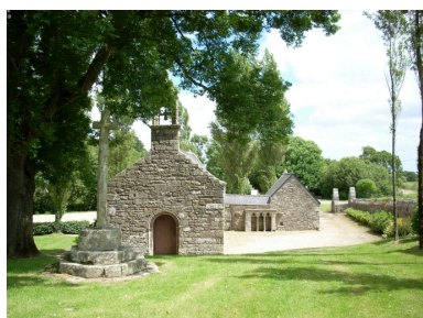
Saint-Vougay, chapelle Saint-Jean-Baptiste : vue générale ouest