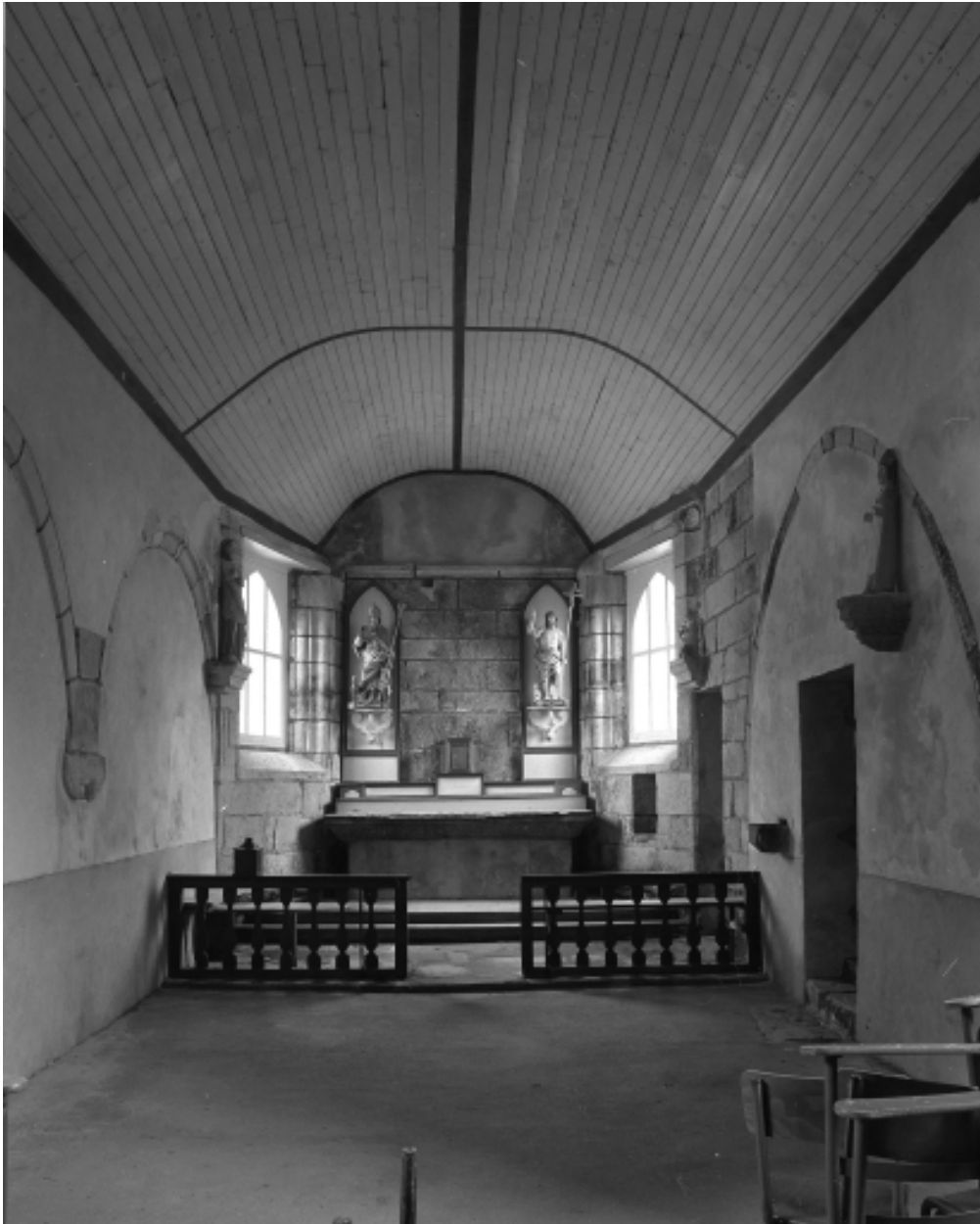
Saint-Vougay, chapelle Saint-Jean-Baptiste : vue générale de la nef vers le chœur, état en 1983