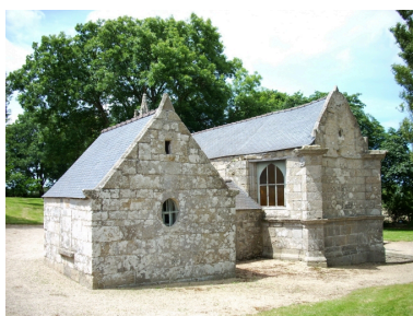
Saint-Vougay, chapelle Saint-Jean-Baptiste : vue générale sud-est