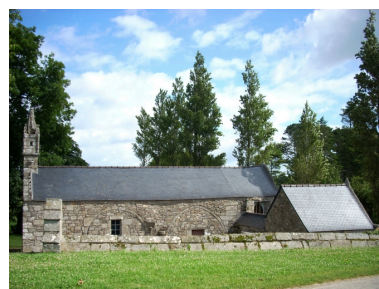
Saint-Vougay, chapelle Saint-Jean-Baptiste : élévation sud IVR53_20082906519NUCA