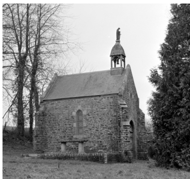
Elévation nord.