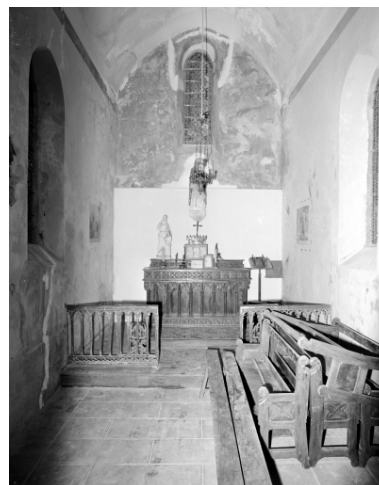
Intérieur : vue générale vers le chœur. IVR53_19933500127X