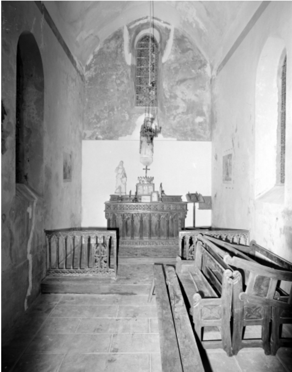
Intérieur : vue générale vers le chœur.