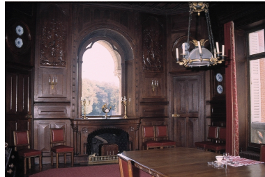
Vue intérieure : salle à manger IVR53_19962205005ZA