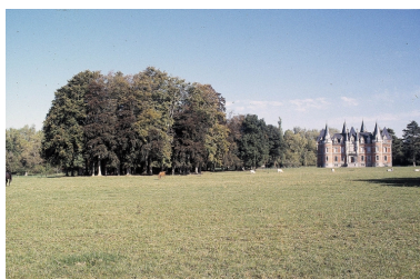
Vue de situation du château et du parc IVR53_19962205001ZA