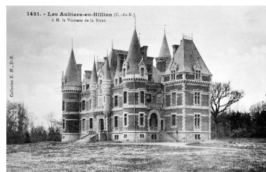
Vue de trois-quart IVR53_20042209066NUCB