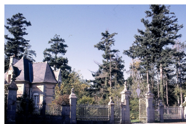
Portail d'entrée et conciergerie IVR53_19962205000ZA