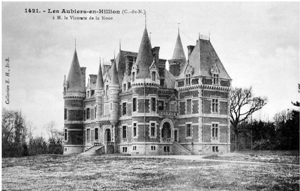
Vue de trois-quart