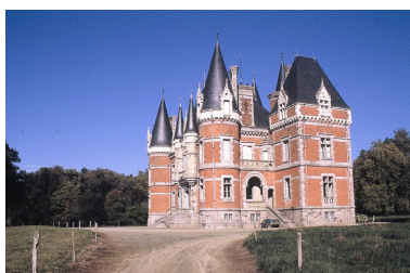
Vue de trois-quart : état actuel