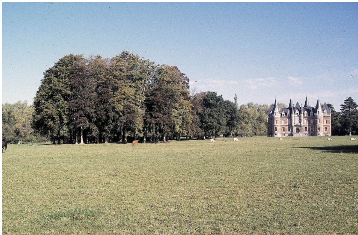
Vue de situation du château et du parc