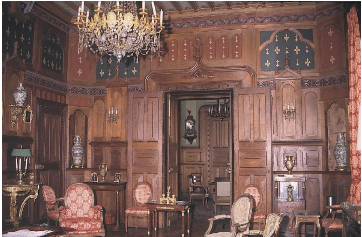
Vue intérieure : salon