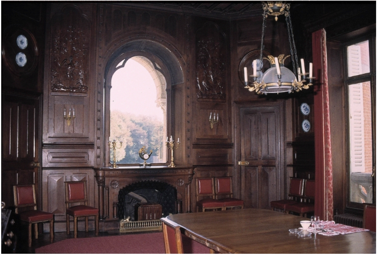
Vue intérieure : salle à manger