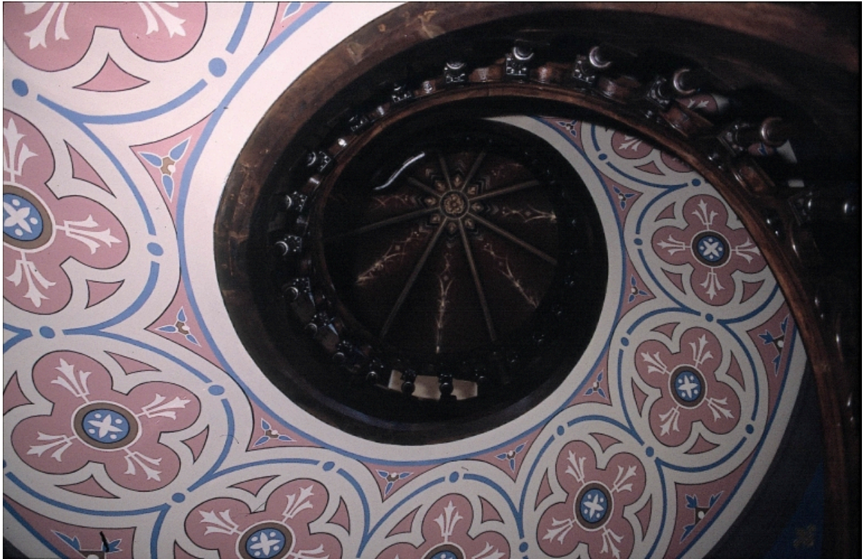
Vue intérieure : décor d'un escalier à vis