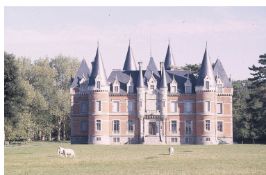
Élévations postérieures