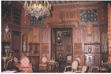
Vue intérieure : salon IVR53_19962205004ZA