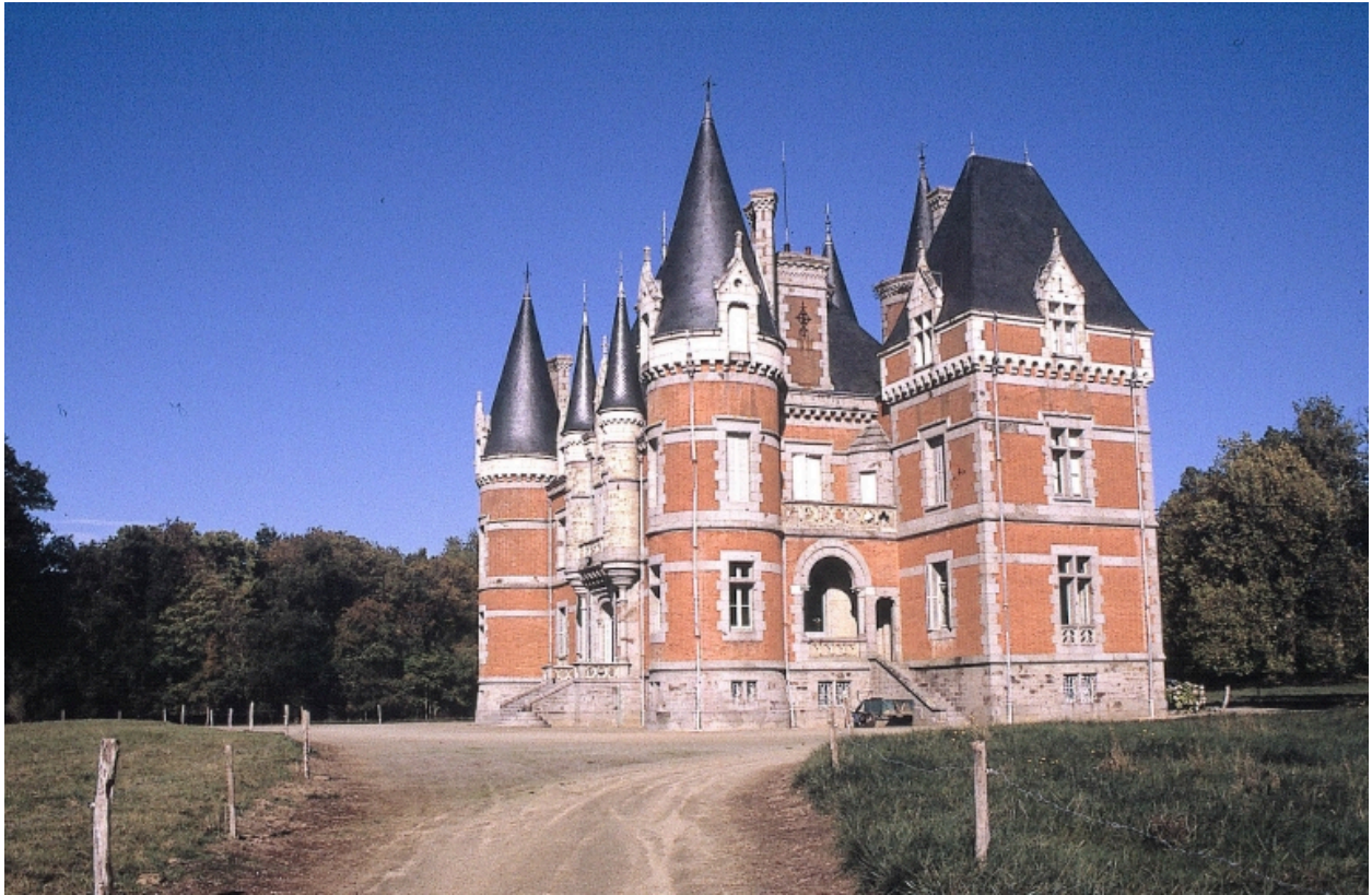
Vue de trois-quart : état actuel