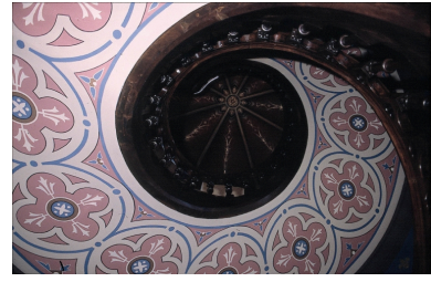
Vue intérieure : décor d'un escalier à vis IVR53_19962205006ZA