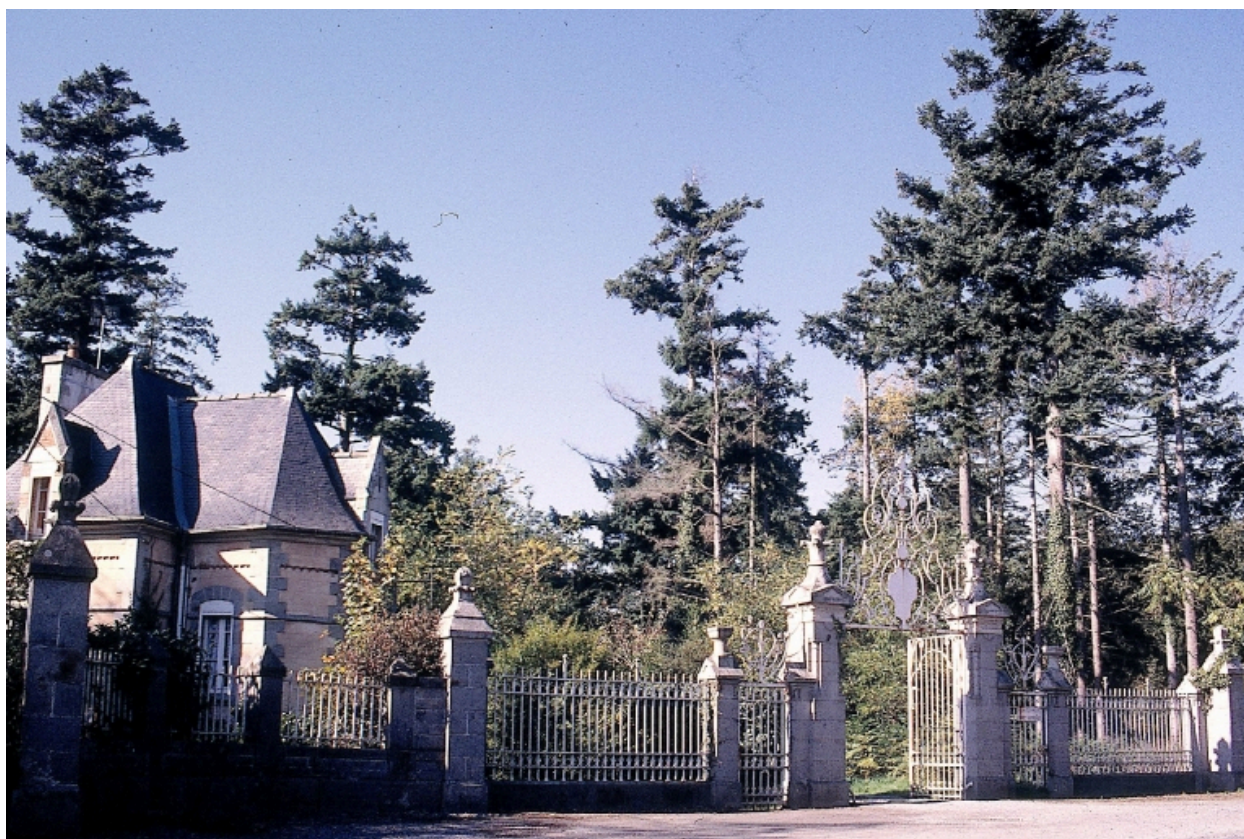
Portail d'entrée et conciergerie