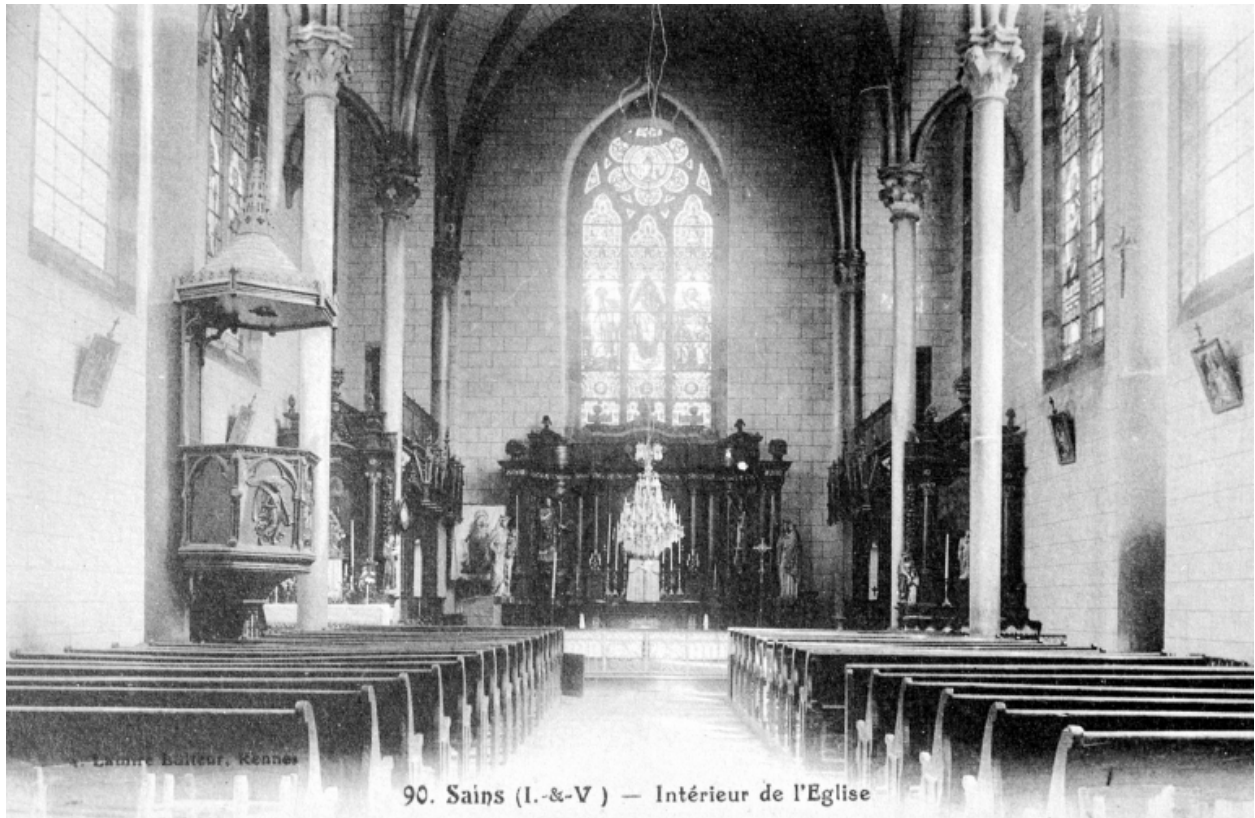
90. Sains (I.-&V) — Intérieur de l'Eglise

Carte postale ancienne - Intérieur : vue générale vers le chœur.