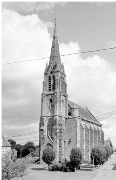
Elévation Ouest : vue générale IVR53_19943501839X