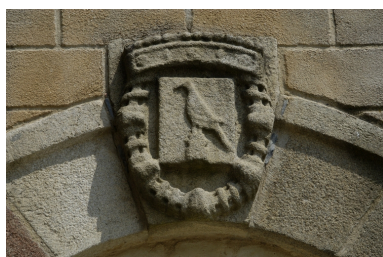
Détail armoirie transept sud IVR53_20053502100NUCA