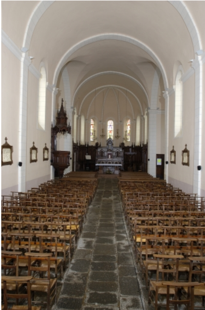
Vue intérieure prise de la nef vers le choeur