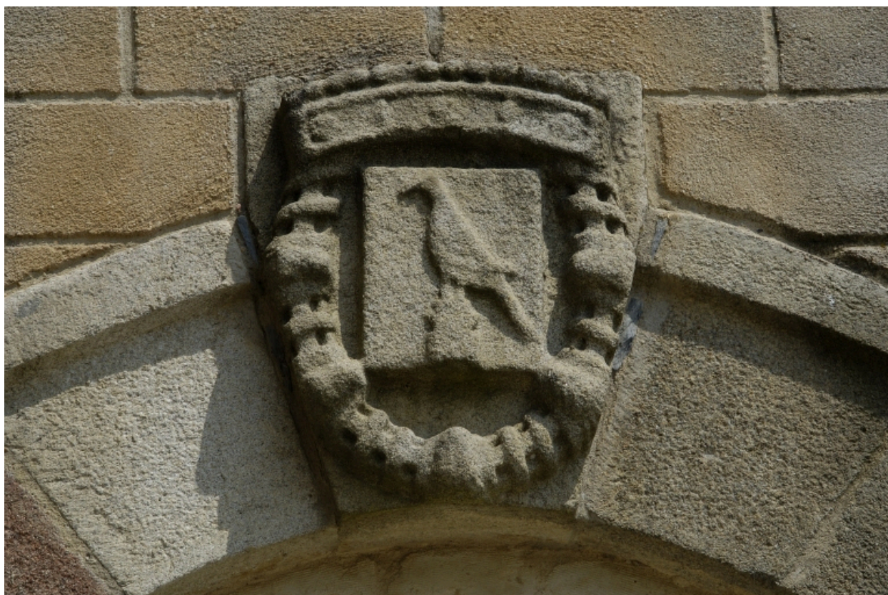
Détail armoirie transept sud