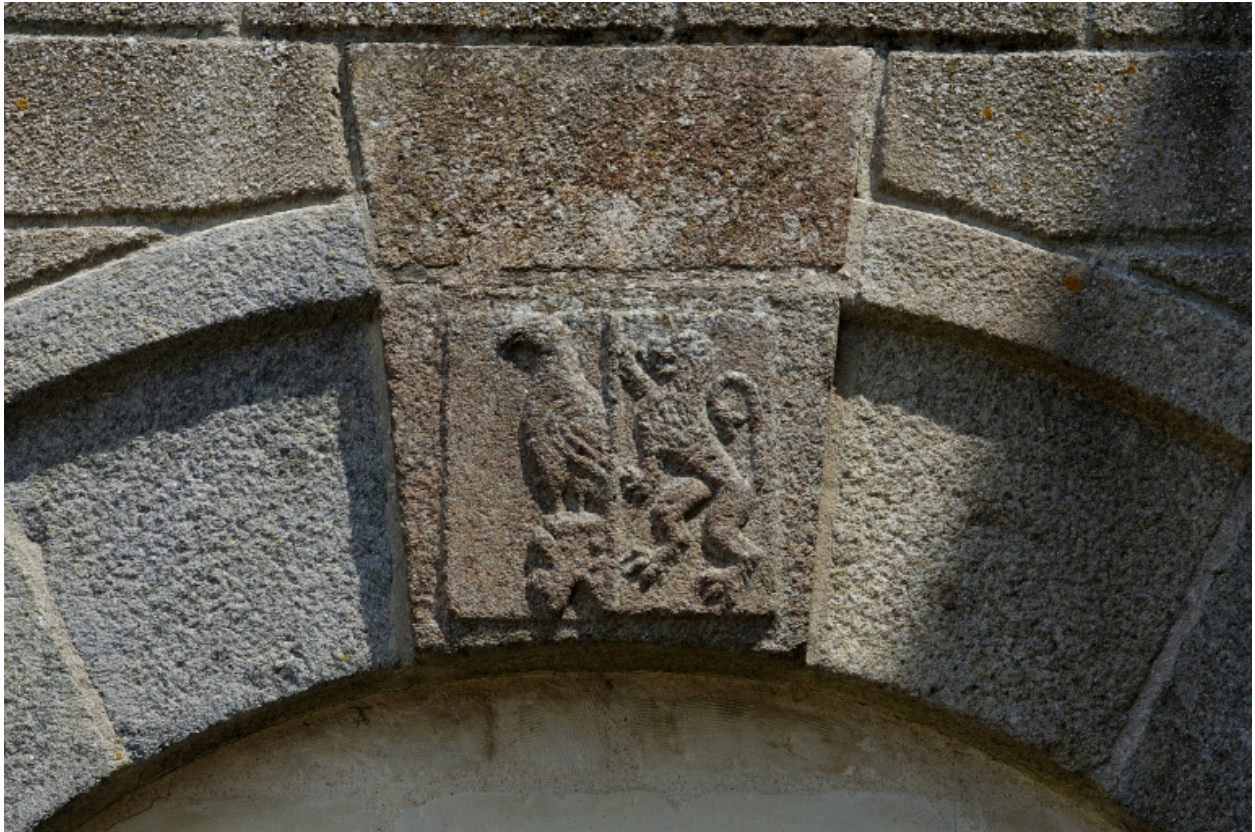
Détail armoirie transept nord