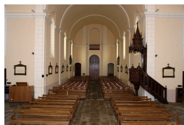
Vue intérieure prise du chœur vers la nef IVR53_20053503547NUCA