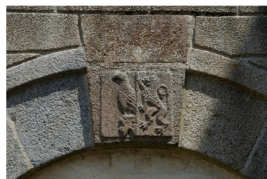
Détail armoirie transept nord IVR53_20053502096NUCA