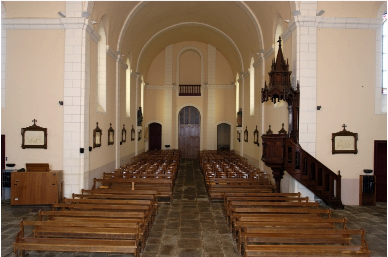
Vue intérieure prise du choeur vers la nef