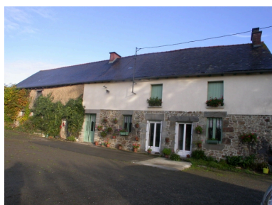
Vue générale sud-est IVR53_20053518955NUCA