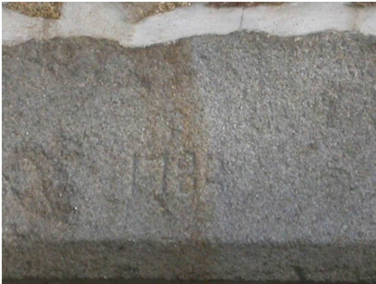
La date portée sur le linteau de la porte