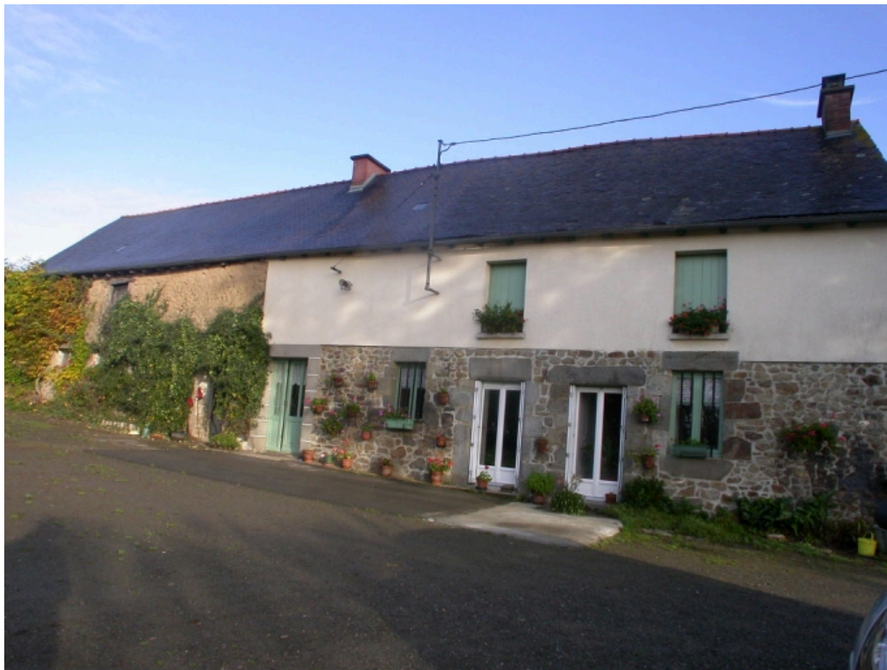
Vue générale sud-est