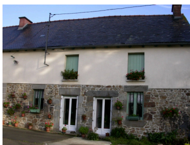
Le logis IVR53_20053518956NUCA