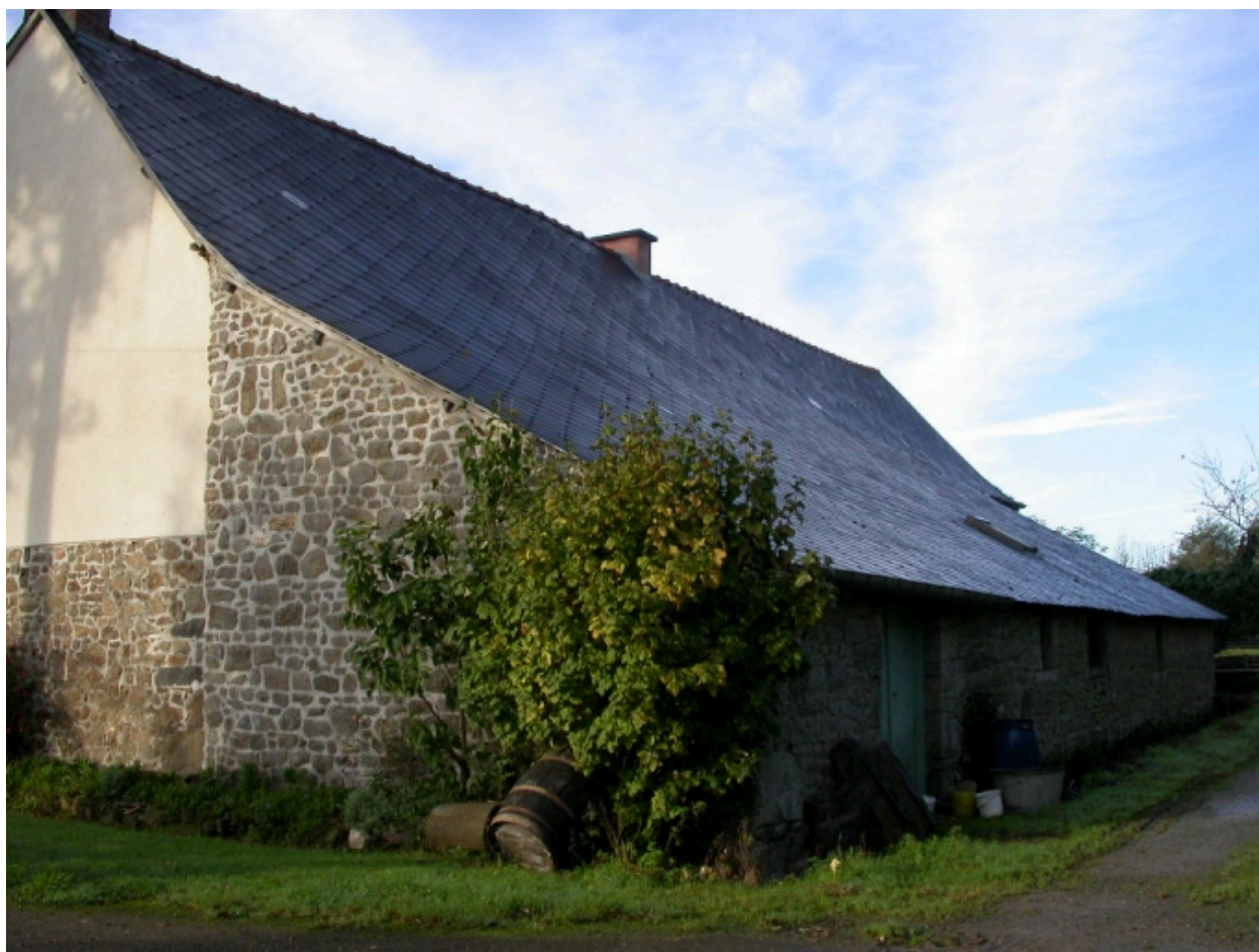
Vue nord-ouest : le cellier