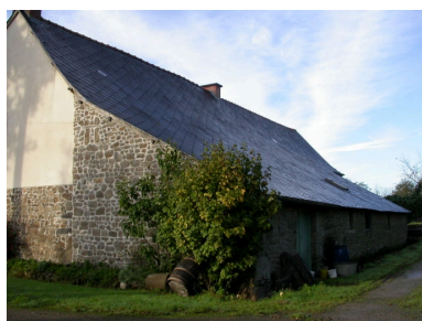
Vue nord-ouest : le cellier