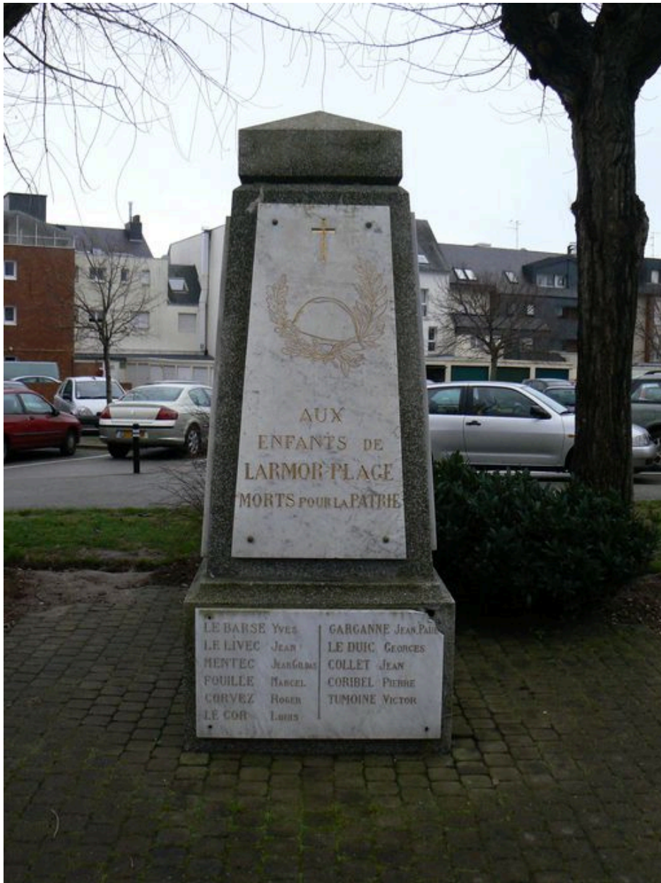
Vue générale du mémorial des naufragés de la Tanche