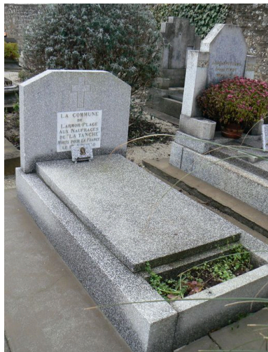
Vue générale de la tombe des naufragés de la Tanche IVR53_20085606013NUCA