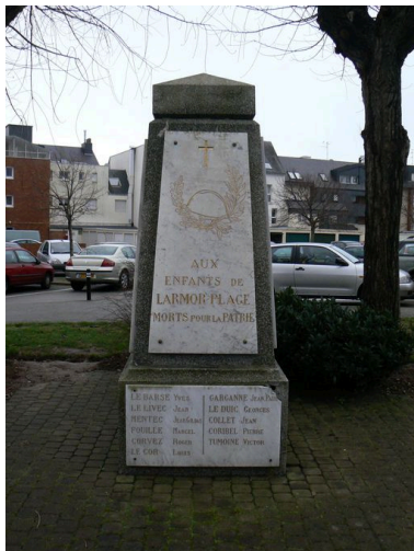
Vue générale du mémorial des naufragés de la Tanche IVR53_20085606014NUCA