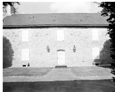
Dépendance, élévation sud. IVR53_19995600388X