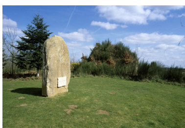
Tumulus, motte ? Vue générale ouest. IVR53_19995600394ZA