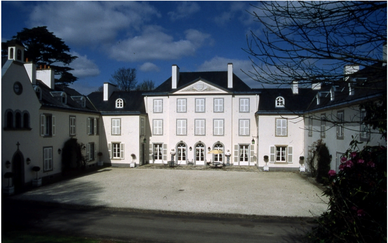
Vue générale sud.