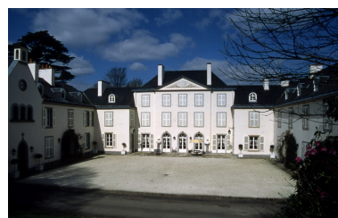
Vue générale sud. IVR53_19995600389ZA