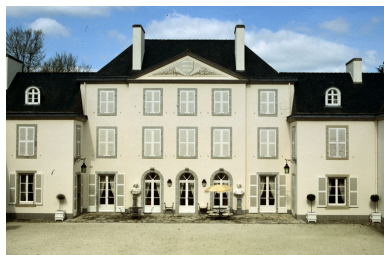
Vue générale sud. IVR53_19995600390ZA