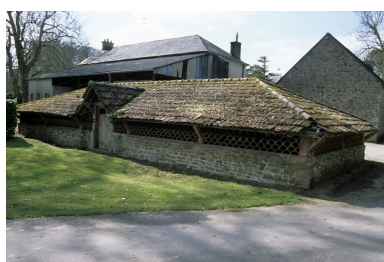
Vue générale du séchoir. IVR53_19995600392ZA