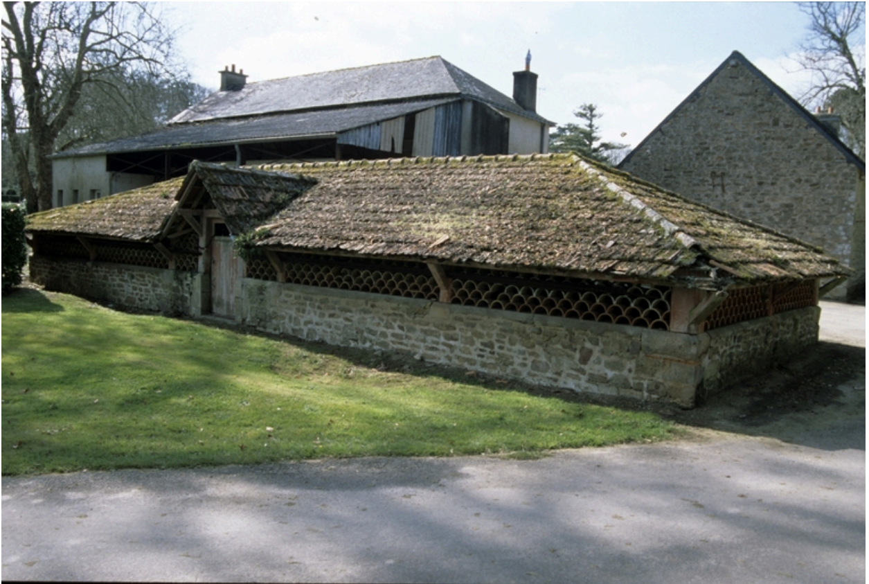
Vue générale du séchoir.