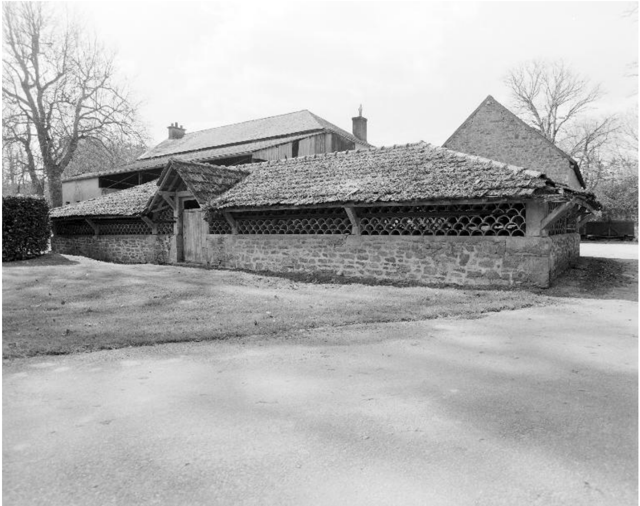
Vue générale du séchoir.