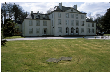
Point culminant du site empierré, vue générale nord. IVR53_19995600393ZA