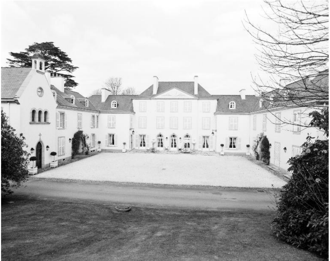
Vue générale sud.