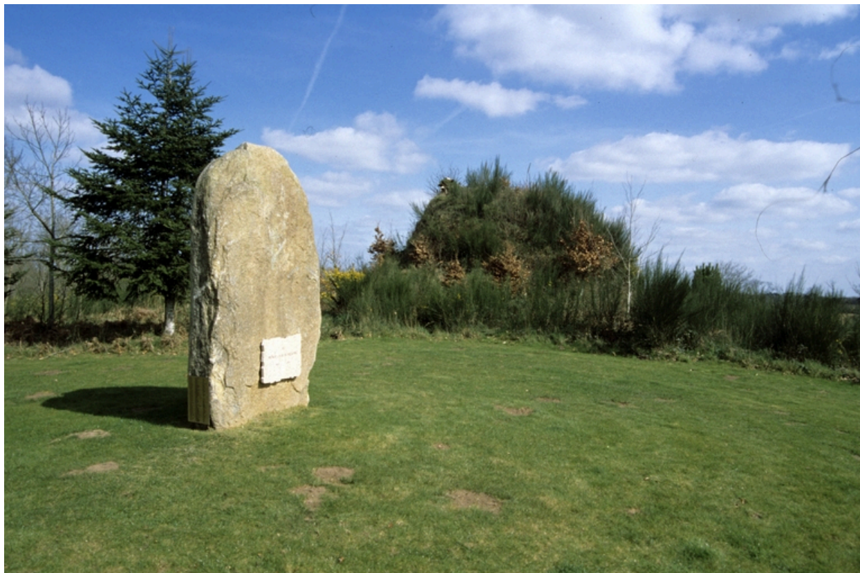
Tumulus, motte ? Vue générale ouest.