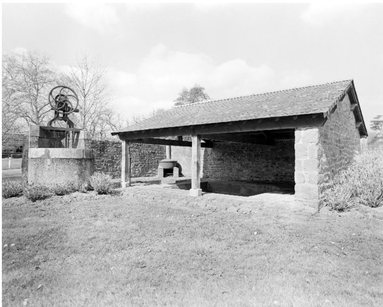
Lavoir, vue générale.