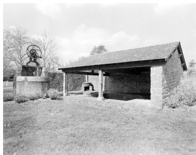
Lavoir, vue générale. IVR53_19995600387X