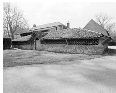
Vue générale du séchoir.