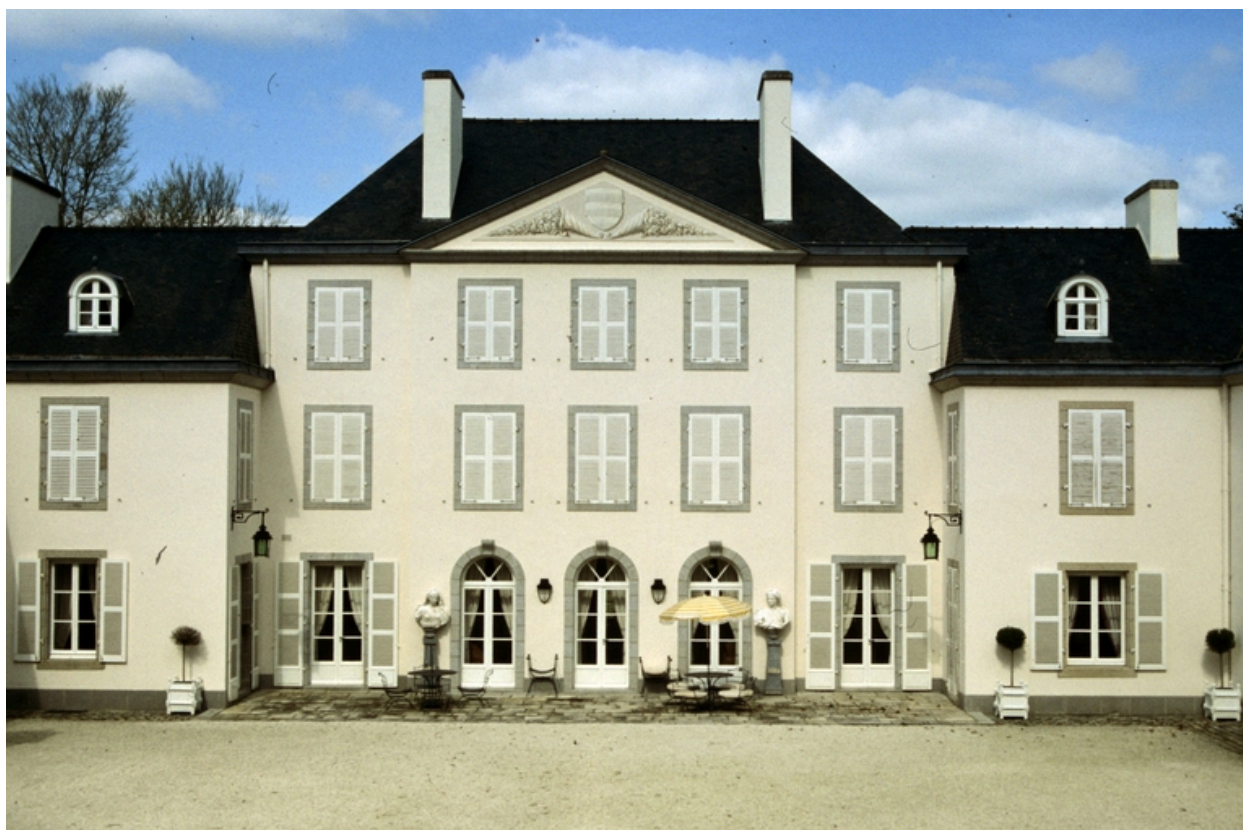
Vue générale sud.