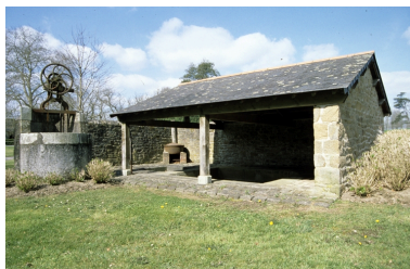
Vue générale du lavoir. IVR53_19995600391ZA