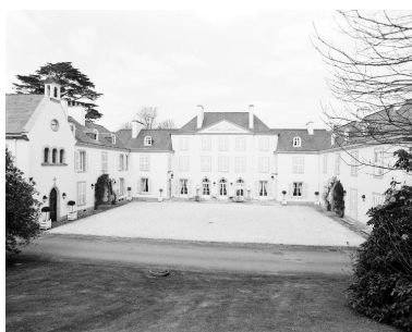
Vue générale sud. IVR53_19995600373X