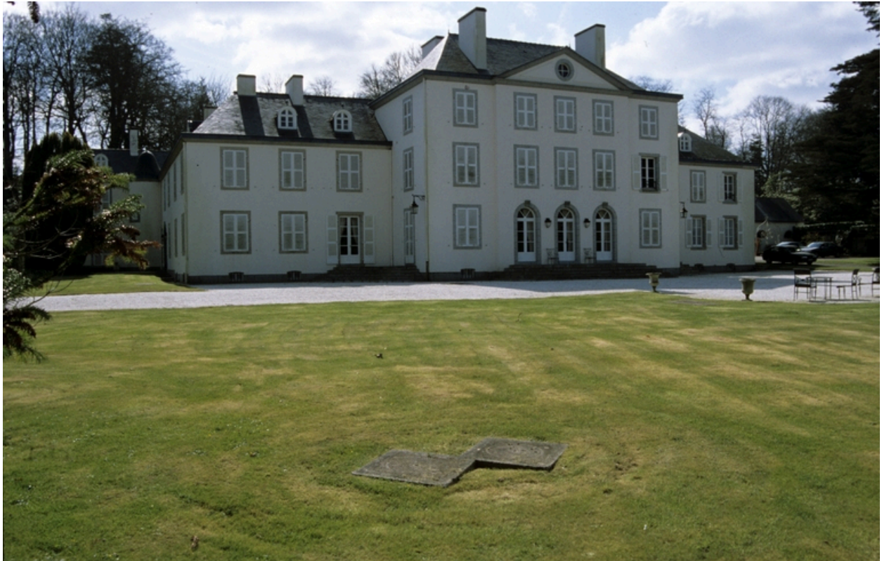
Point culminant du site empierré, vue générale nord.