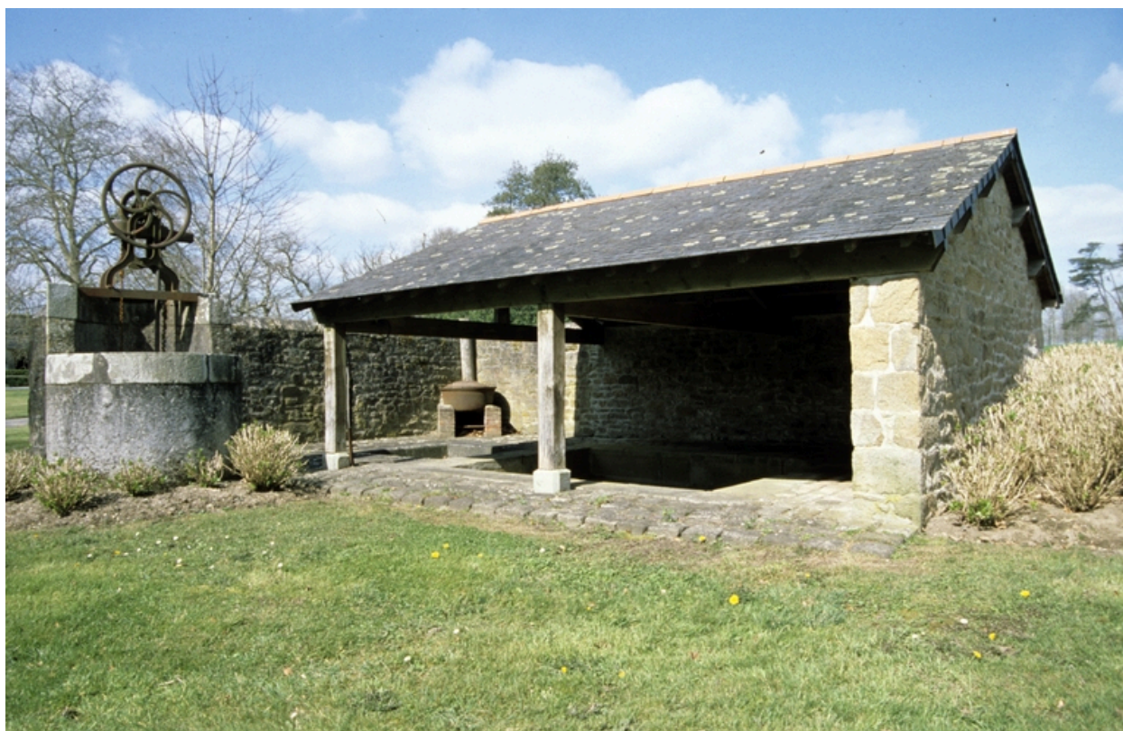
Vue générale du lavoir.