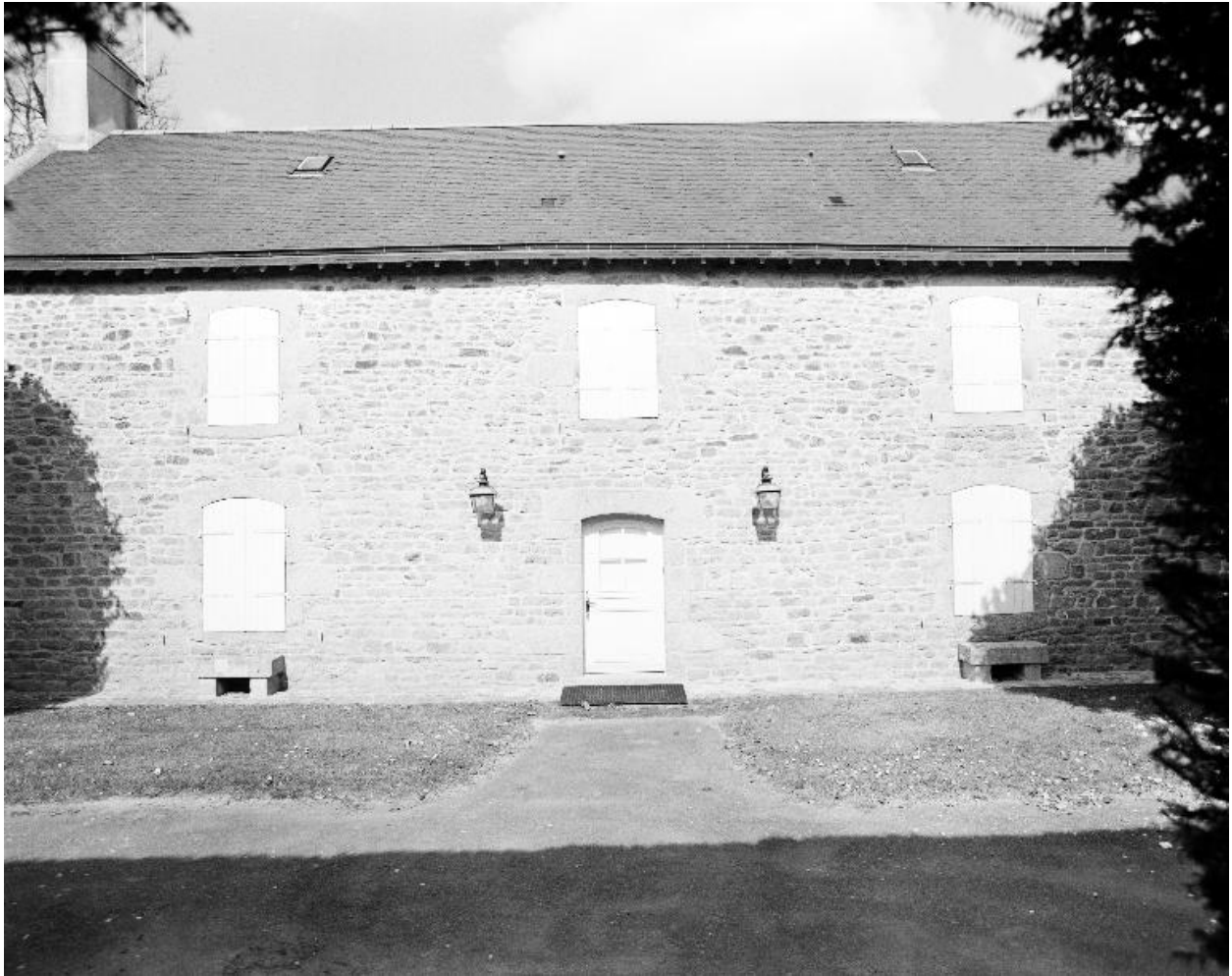
Dépendance, élévation sud.