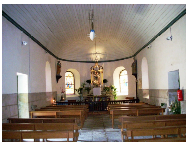
Plougoulm, chapelle de Notre-Dame de Prat-Coulm : vue axiale est