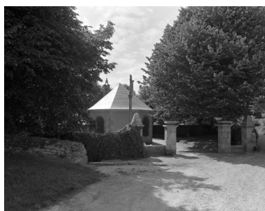
Plougoum, chapelle de Notre-Dame de Prat-Coum : vue de situation prise de l'est, état en 1985 IVR53_19852901408XC