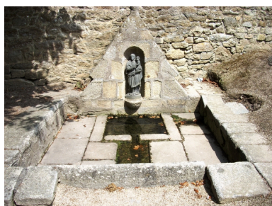
Plougoulm, chapelle de Notre-Dame de Prat-Coulm : fontaine de dévotion