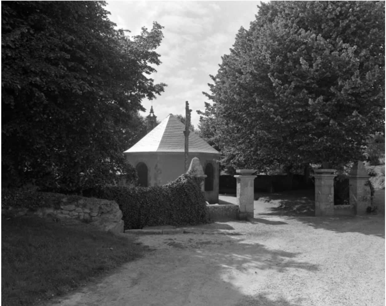
Plougoulm, chapelle de Notre-Dame de Prat-Coulm : vue de situation prise de l'est, état en 1985