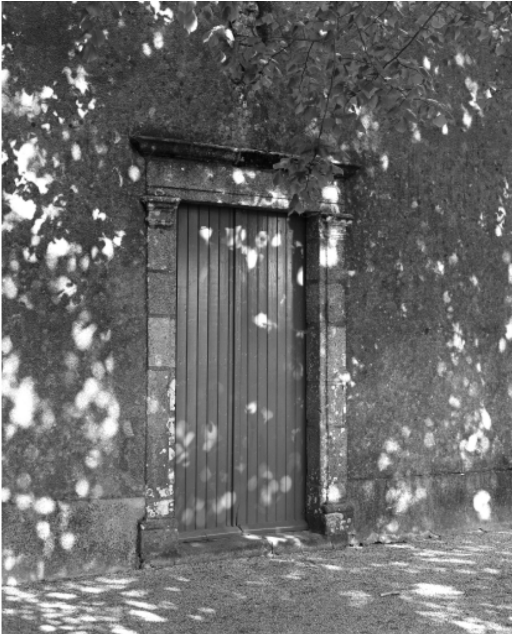
Plougoulm, chapelle de Notre-Dame de Prat-Coulm : porte ouest, vue générale, état en 1986