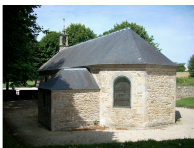
Plougoum, chapelle de Notre-Dame de Prat-Coum : vue générale sud-est