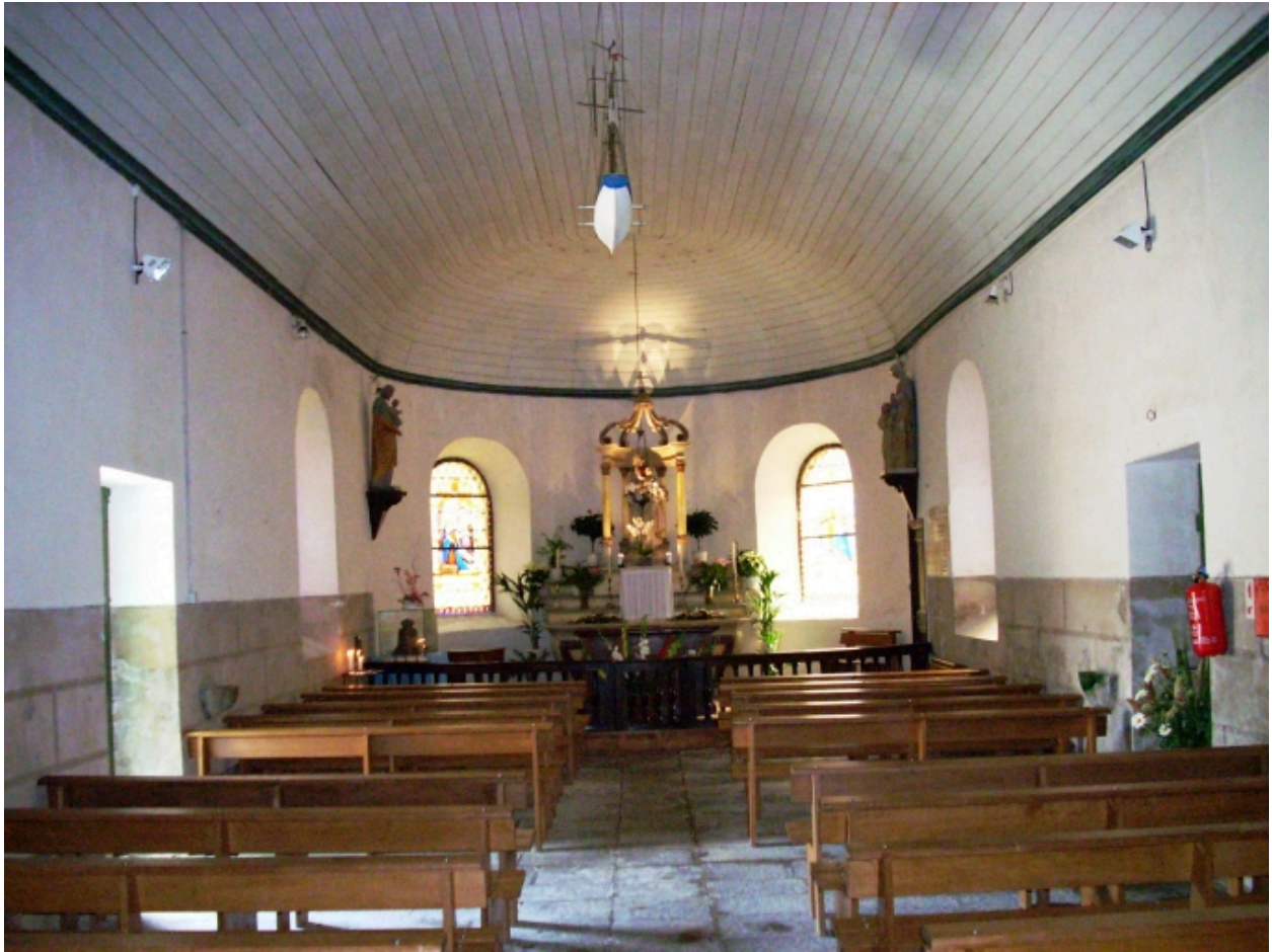
Plougoulm, chapelle de Notre-Dame de Prat-Coulm : vue axiale est