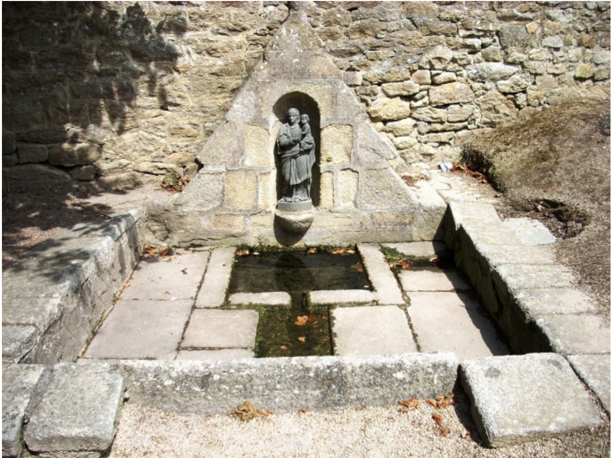
Plougoulm, chapelle de Notre-Dame de Prat-Coulm : fontaine de dévotion