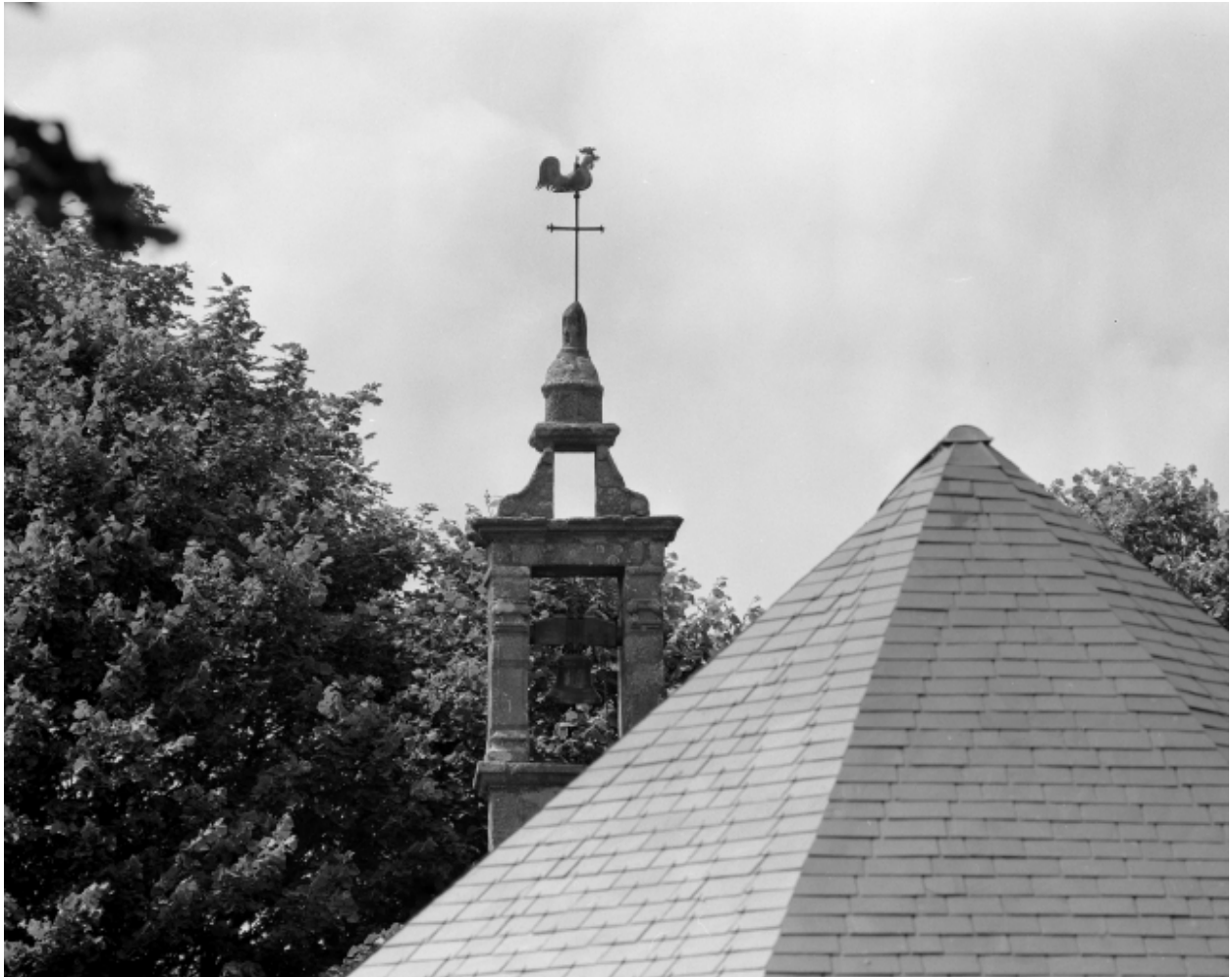
Plougoulm, chapelle de Notre-Dame de Prat-Coulm : clocheton, vue générale rapprochée, état en 1985