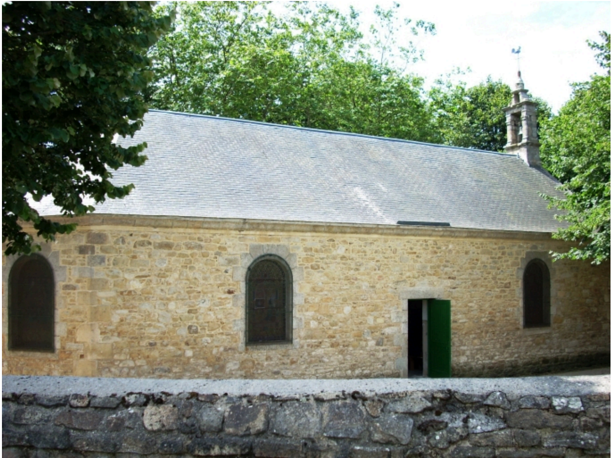
Plougoum, chapelle de Notre-Dame de Prat-Coulm : vue générale nord