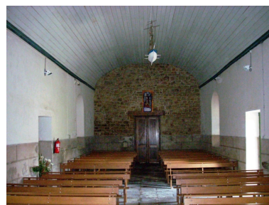
Plougoulm, chapelle de Notre-Dame de Prat-Coulm : vue axiale ouest IVR53_20082906566NUCA