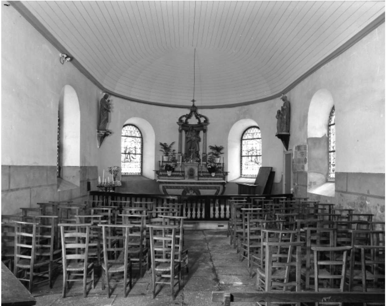
Plougoulm, chapelle de Notre-Dame de Prat-Coulm : intérieur, vue axiale est, état en 1985