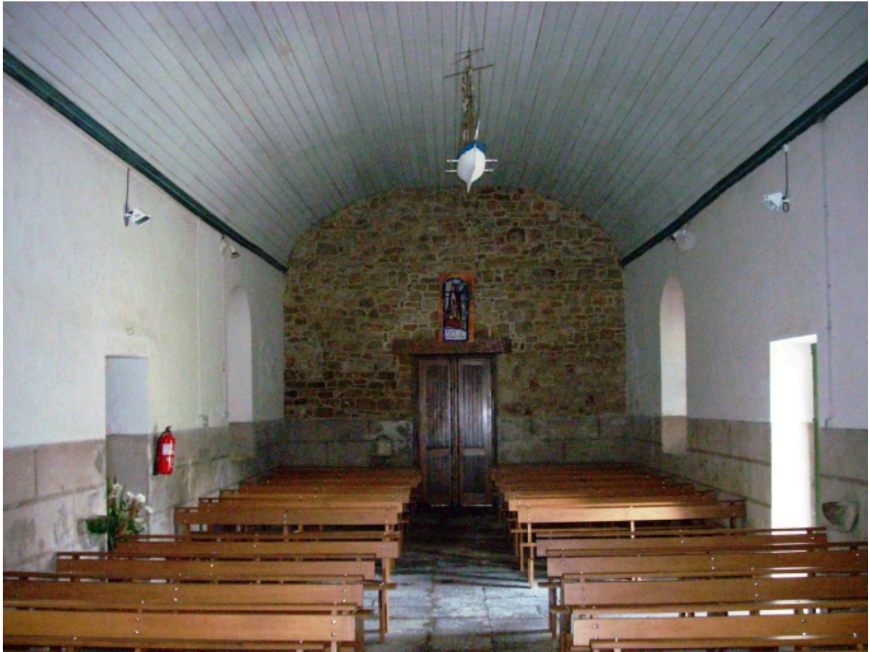
Plougoum, chapelle de Notre-Dame de Prat-Coulm : vue axiale ouest