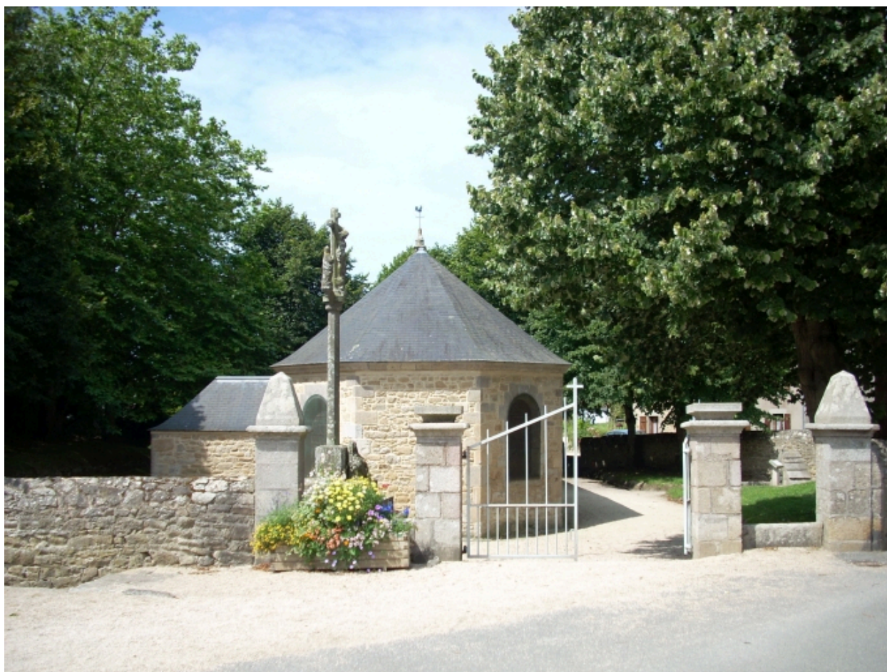
Plougoulm, chapelle de Notre-Dame de Prat-Coulm : élévation est