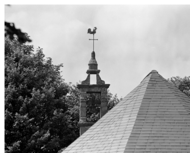
Plougoum, chapelle de Notre-Dame de Prat-Coum : clocheton, vue générale rapprochée, état en 1985 IVR53_19852901409XC