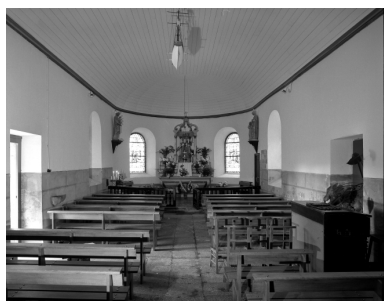
Plougoulm, chapelle de Notre-Dame de Prat-Coulm : intérieur, vue axiale vers le chœur, état en 1987 IVR53_19872900576X