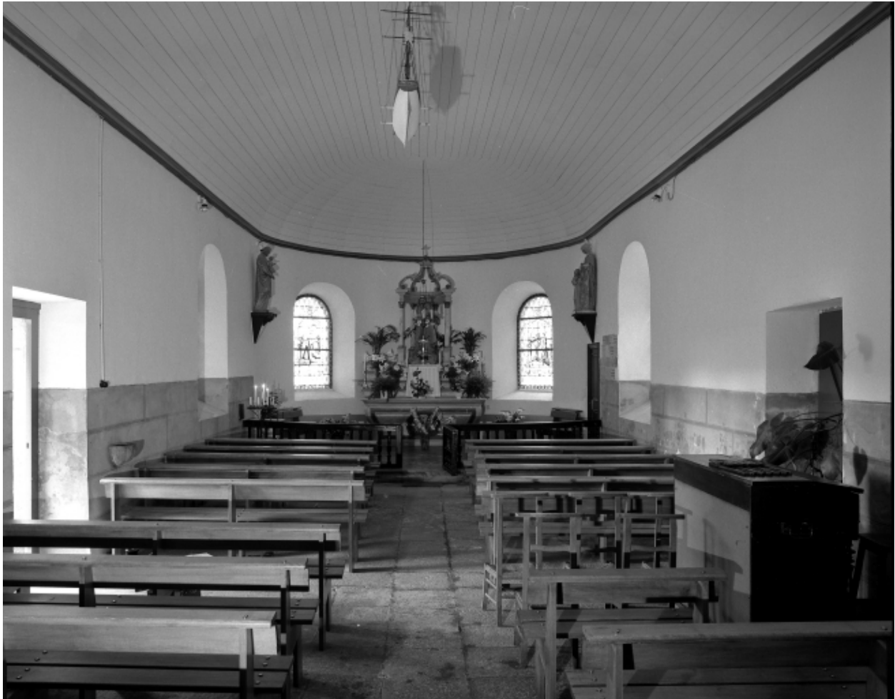
Plougoum, chapelle de Notre-Dame de Prat-Coulm : intérieur, vue axiale vers le choeur, état en 1987