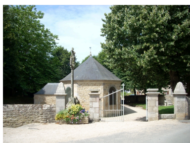
Plougoum, chapelle de Notre-Dame de Prat-Coum : élévation est