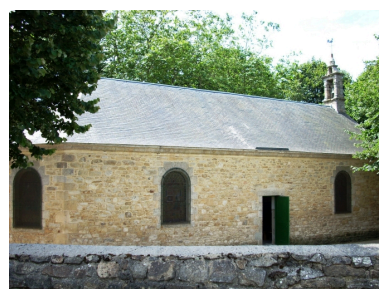
Plougoum, chapelle de Notre-Dame de Prat-Coum : vue générale nord