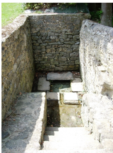
Plougoulm, chapelle de Notre-Dame de Prat-Coulm : fontaine IVR53_20082906564NUCA