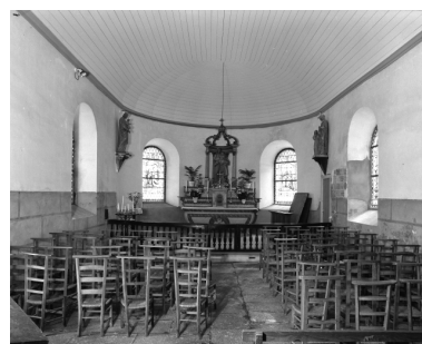
Plougoulm, chapelle de Notre-Dame de Prat-Coulm : intérieur, vue axiale est, état en 1985 IVR53_19852901407XC