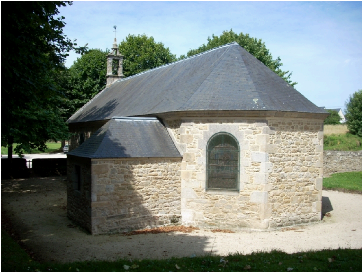
Plougoulm, chapelle de Notre-Dame de Prat-Coulm : vue générale sud-est