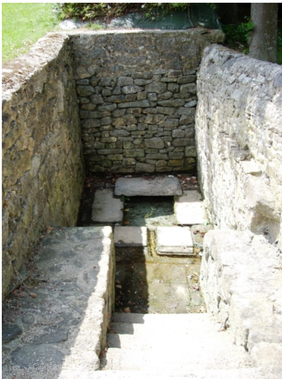
Plougoulm, chapelle de Notre-Dame de Prat-Coulm : fontaine