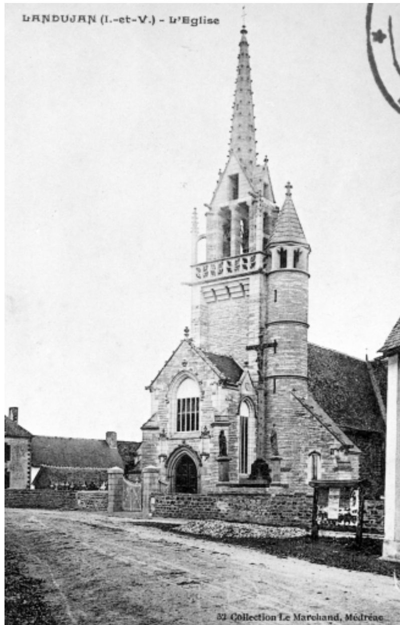
Elévation Ouest : vue générale (Carte postale ancienne, AD35 : 6Fi)