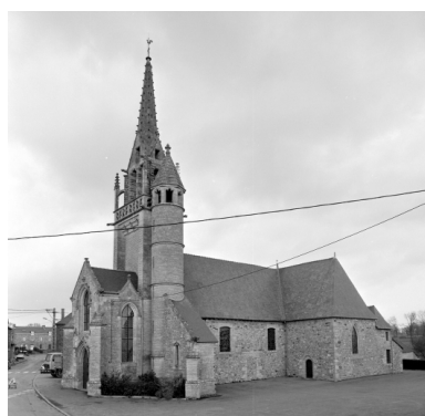
Elévation Sud-Ouest : vue générale IVR53_19943500697X