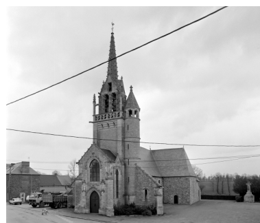
Elévation Ouest : vue générale IVR53_19943500696X