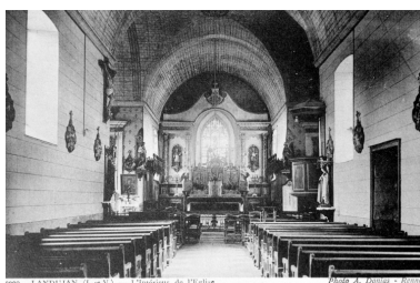
Carte postale ancienne - Intérieur, chœur : vue générale. IVR53_19933500572X