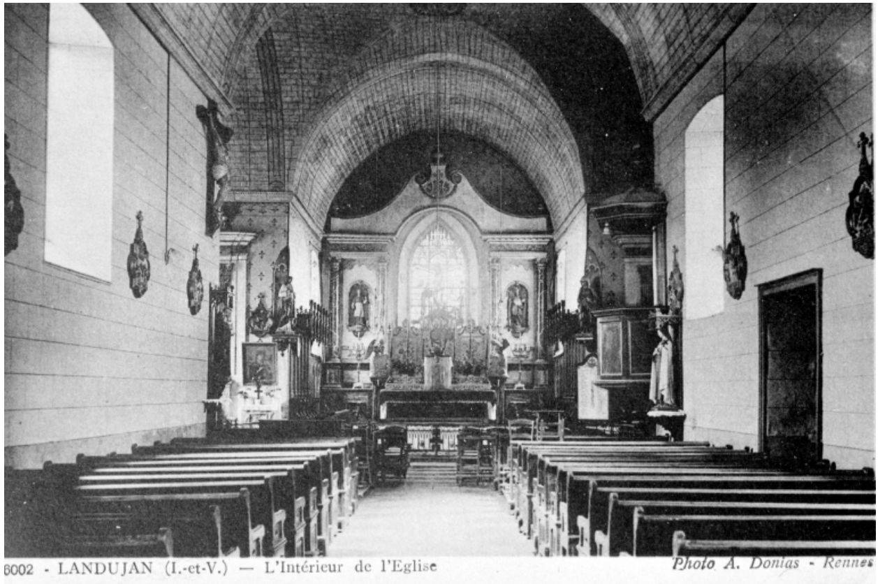
6002 - LANDUJAN (I.-et-V.) — L'Intérieur de l'Eglise