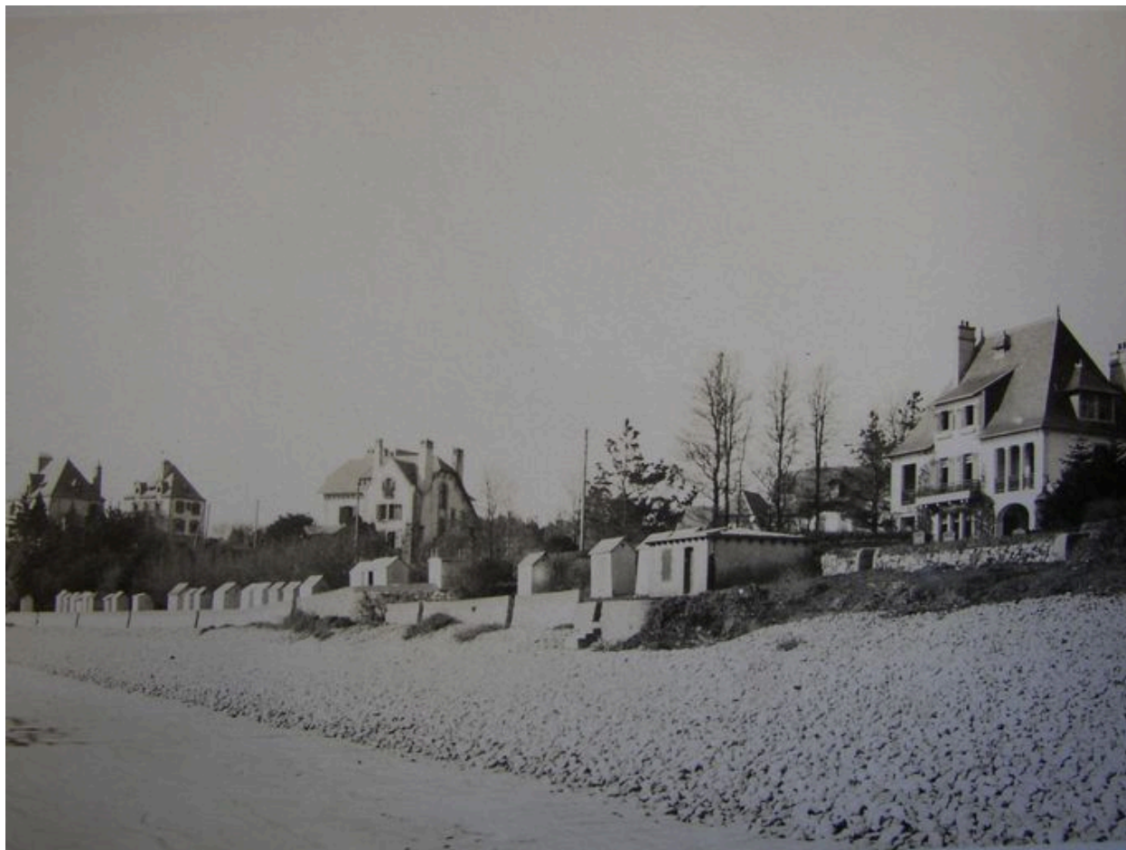
Villas, plage de Morgat et ses cabines