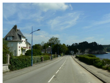
Boulevard de la plage à Morgat