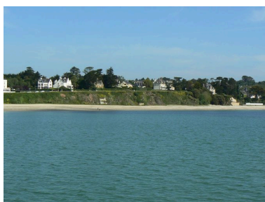
Vue générale du quartier balnéaire de Morgat