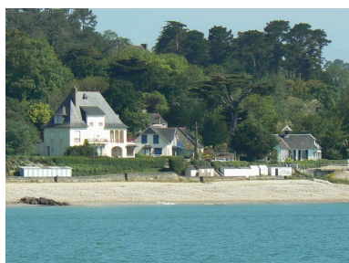
Villas en front de mer à Morgat