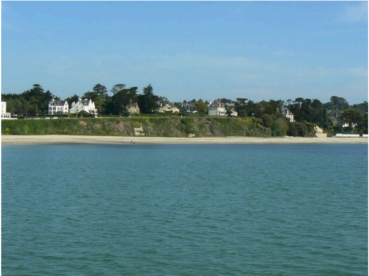
Vue générale du quartier balnéaire de Morgat