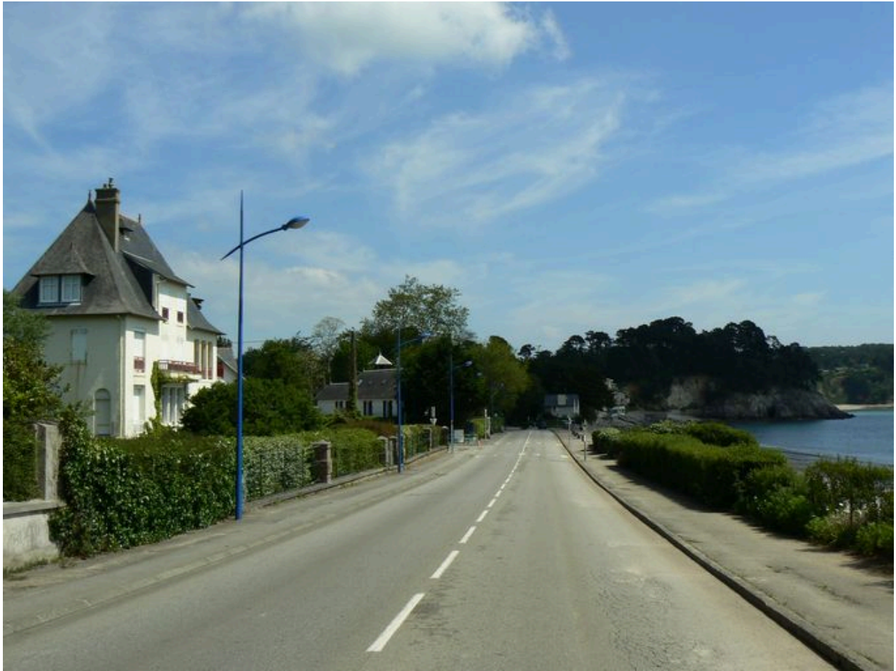
Boulevard de la plage à Morgat