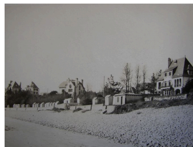
Villas, plage de Morgat et ses cabines IVR53_20072908626NUC