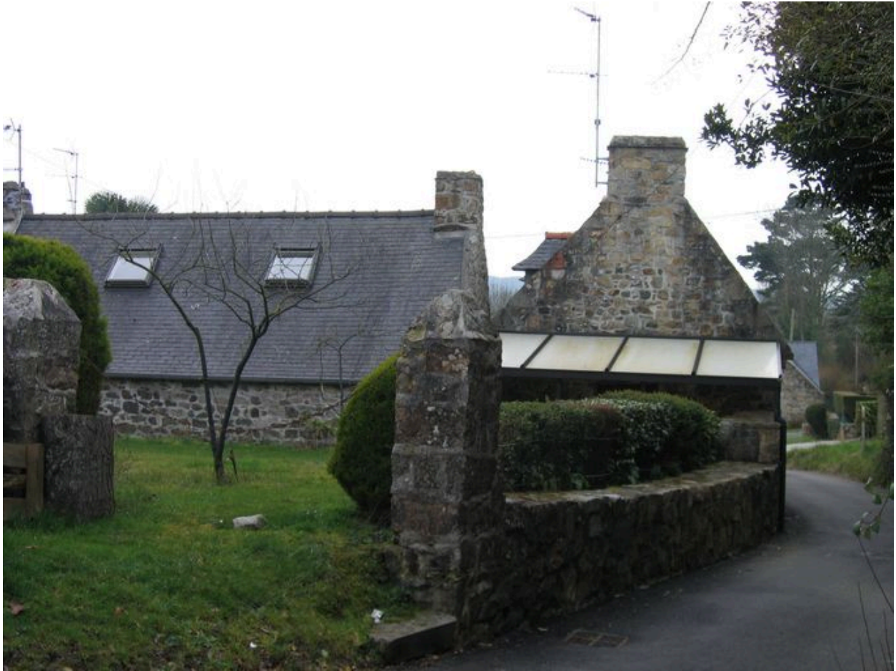
Vue du hameau rural de Kerrigou