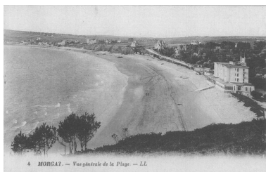
Carte postale : Vue générale de la plage de Morgat IVR53_20082908350NUCB