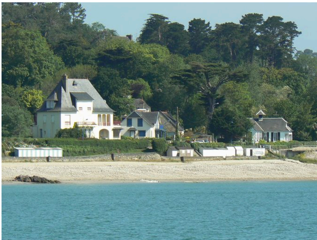
Villas en front de mer à Morgat