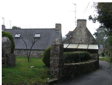
Vue du hameau rural de Kerrigou