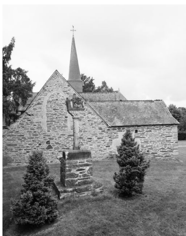
Vue générale prise de l'est IVR53_19915600539X