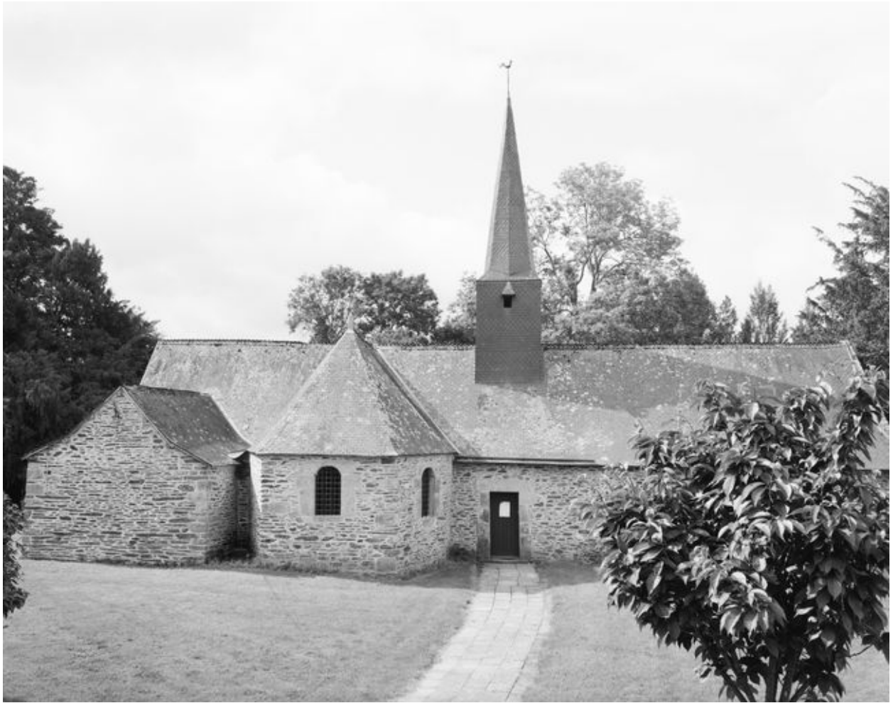
Vue générale prise du nord