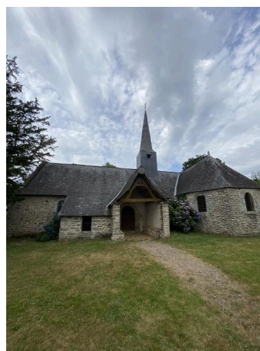
Vue générale sud IVR53_20265610398NUCA