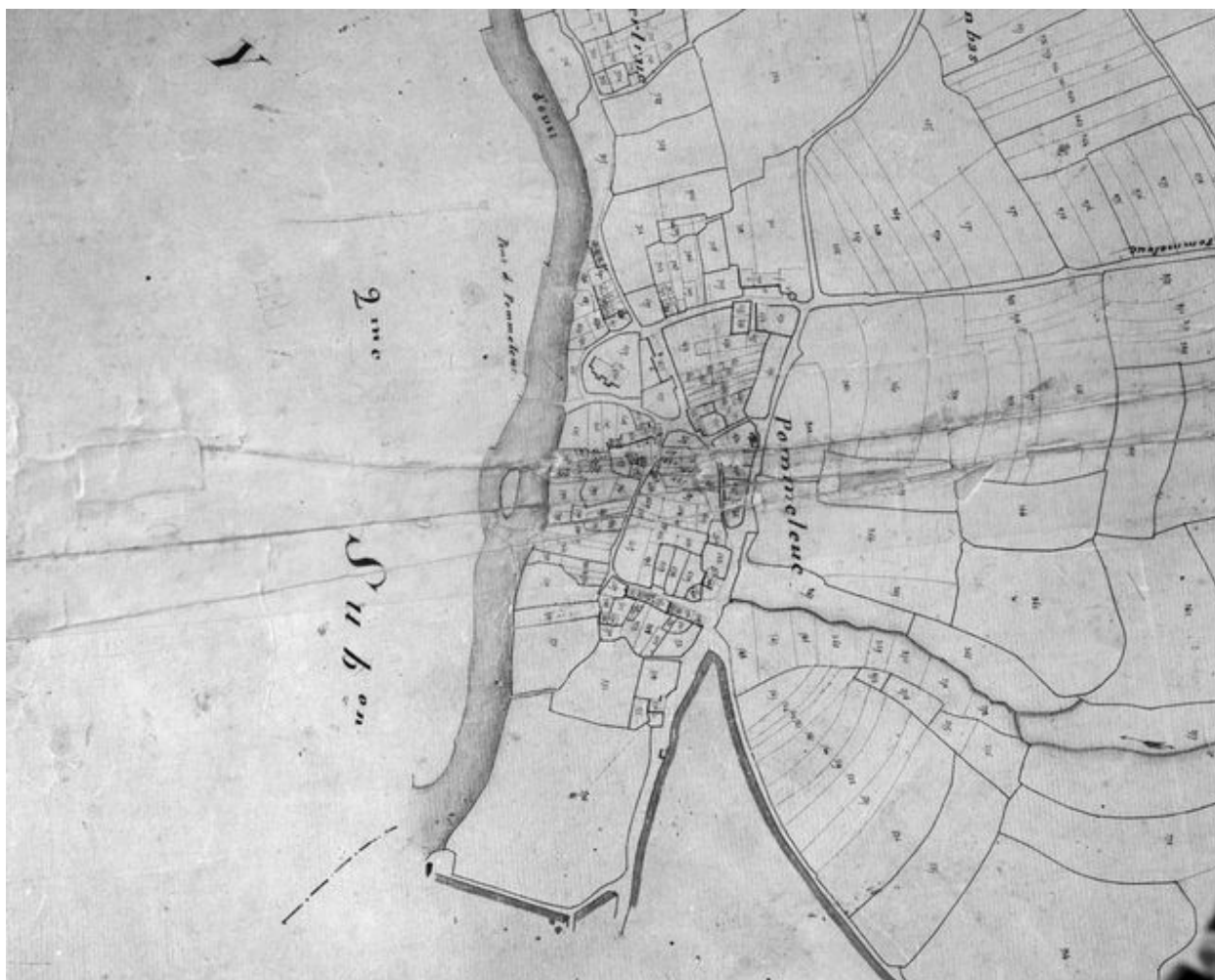
La chapelle Saint-Mélec à Pomeleuc sur le cadastre de 1831