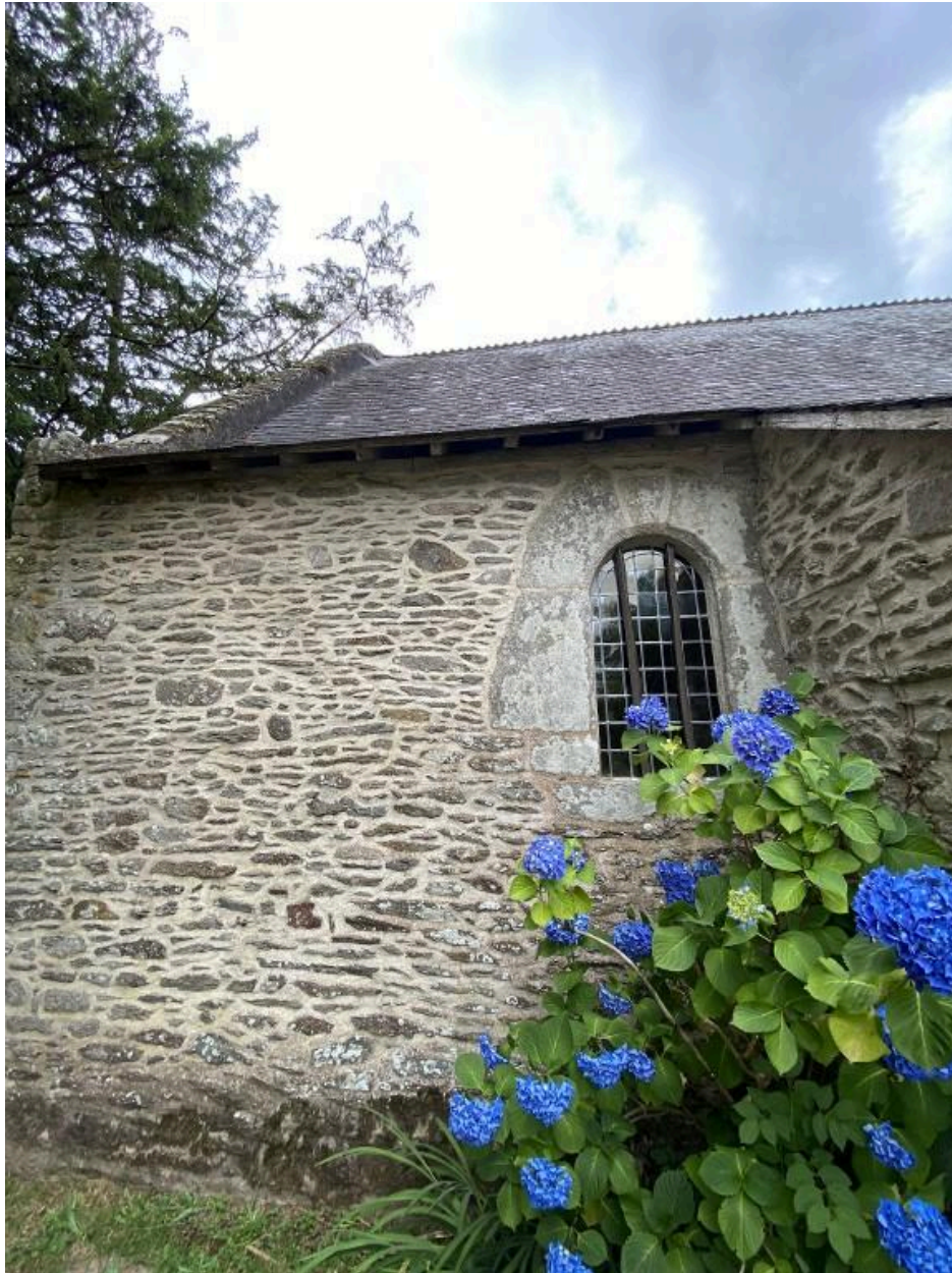
Élévation sud, détail