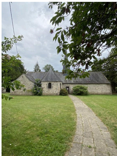
Vue nord IVR53_20265610404NUCA