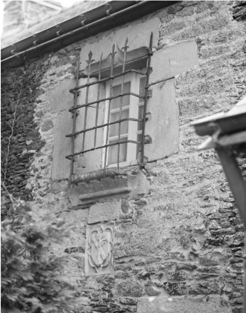
Ancien presbytère : détail fenêtre grillée en face nord