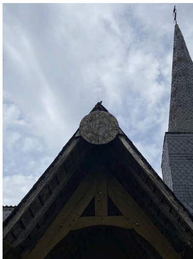
Porche sud, détail IVR53_20265610399NUCA