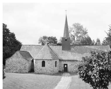
Vue générale prise du nord IVR53_19915600534X