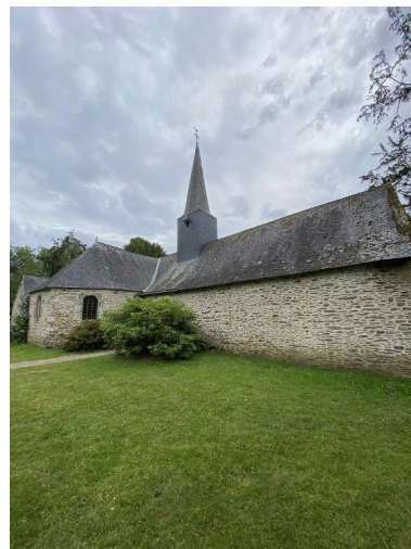
Vue nord-ouest IVR53_20265610403NUCA