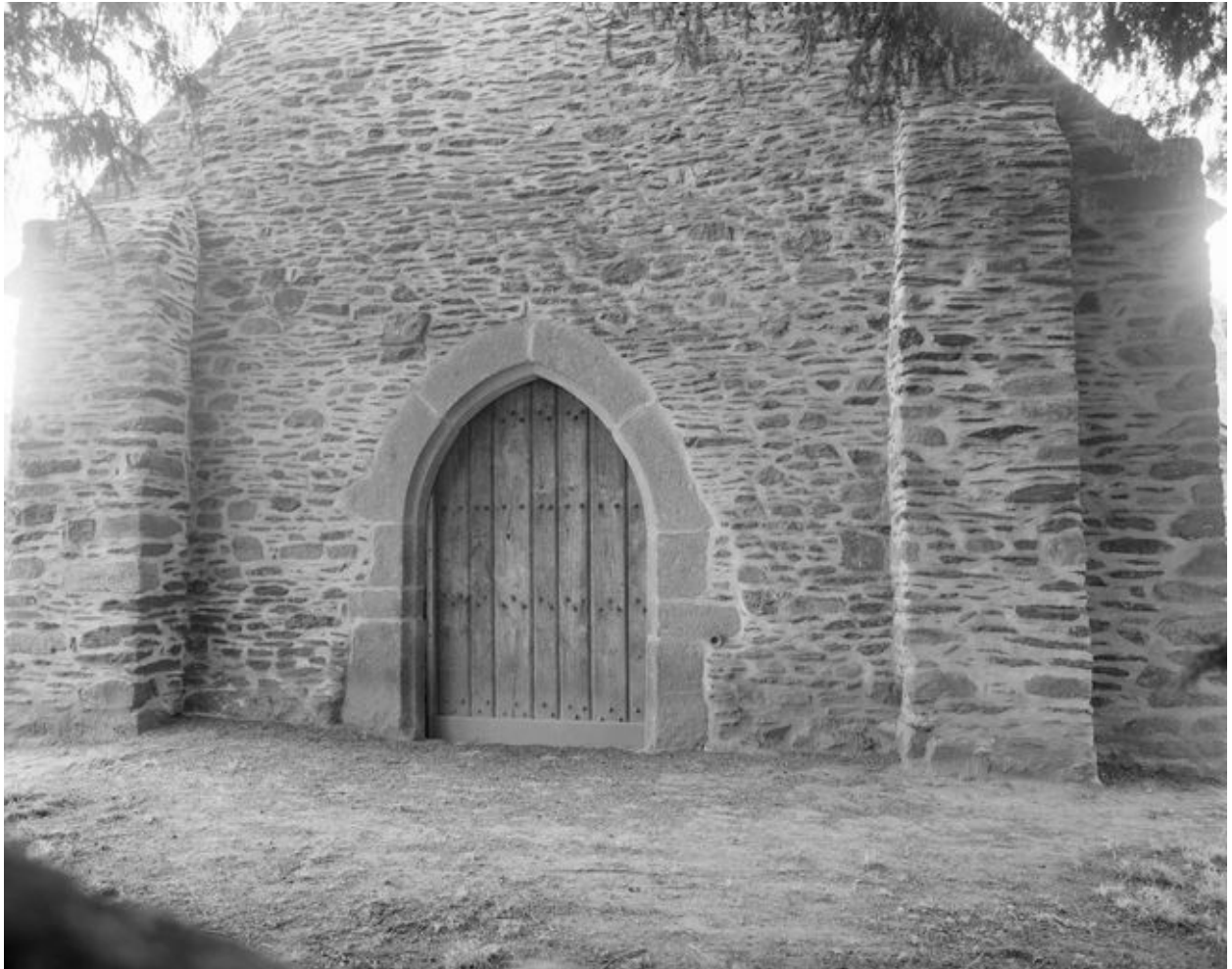
Elévation ouest : la porte