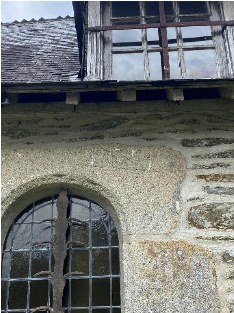
Date, élévation sud