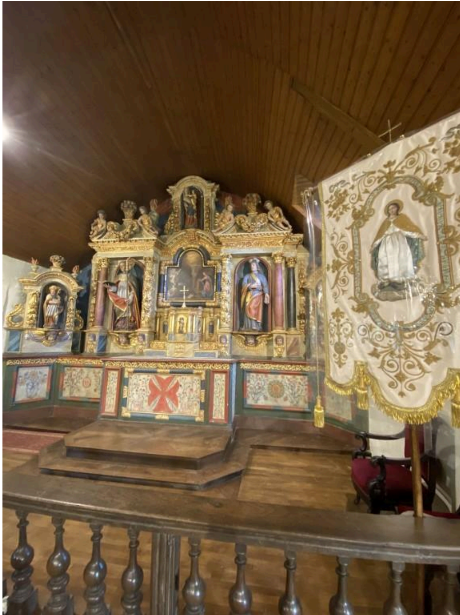
Vue de l'autel et du chœur