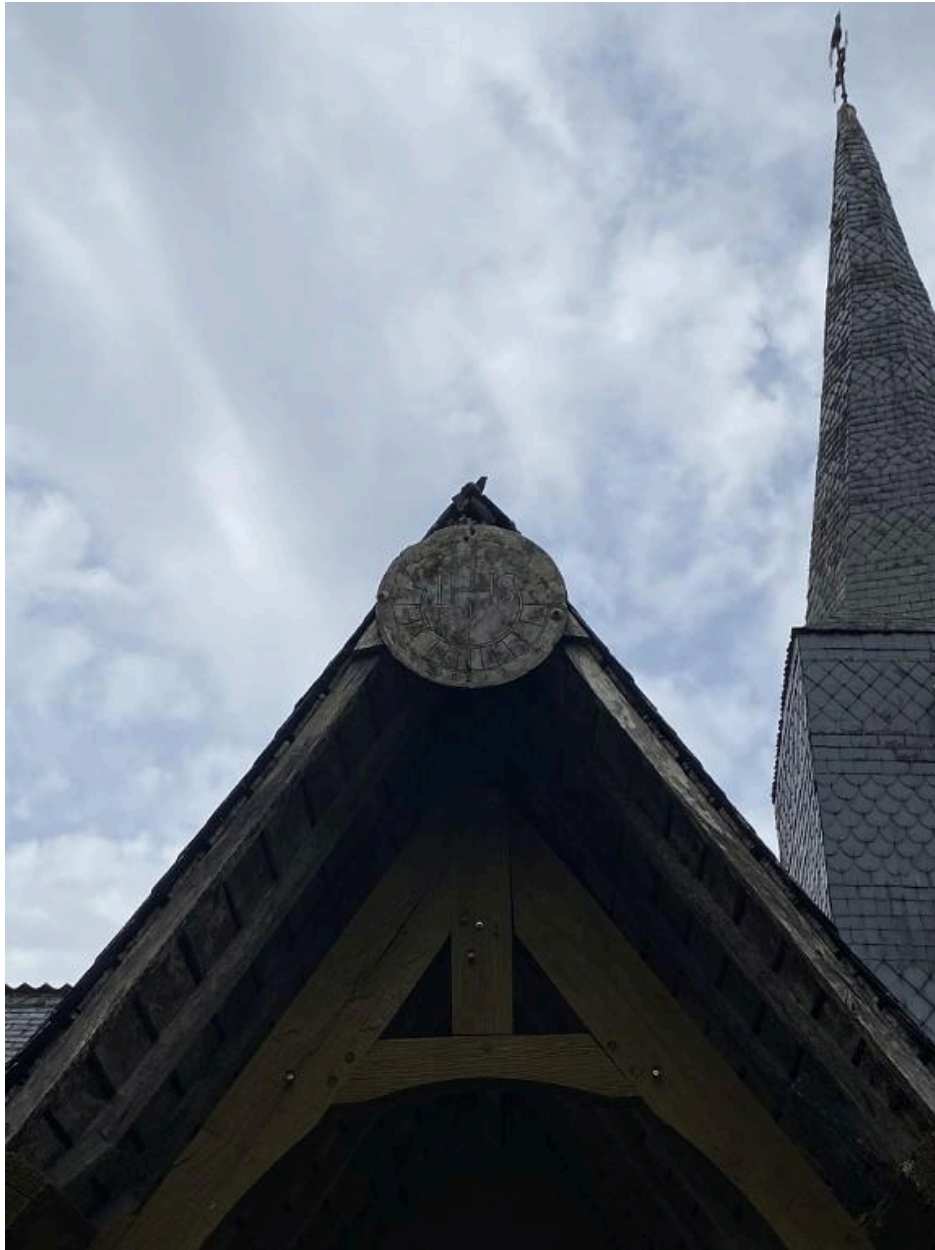
Porche sud, détail