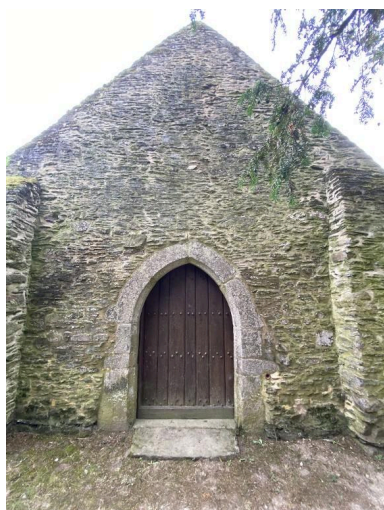
Élévation ouest IVR53_20265610402NUCA