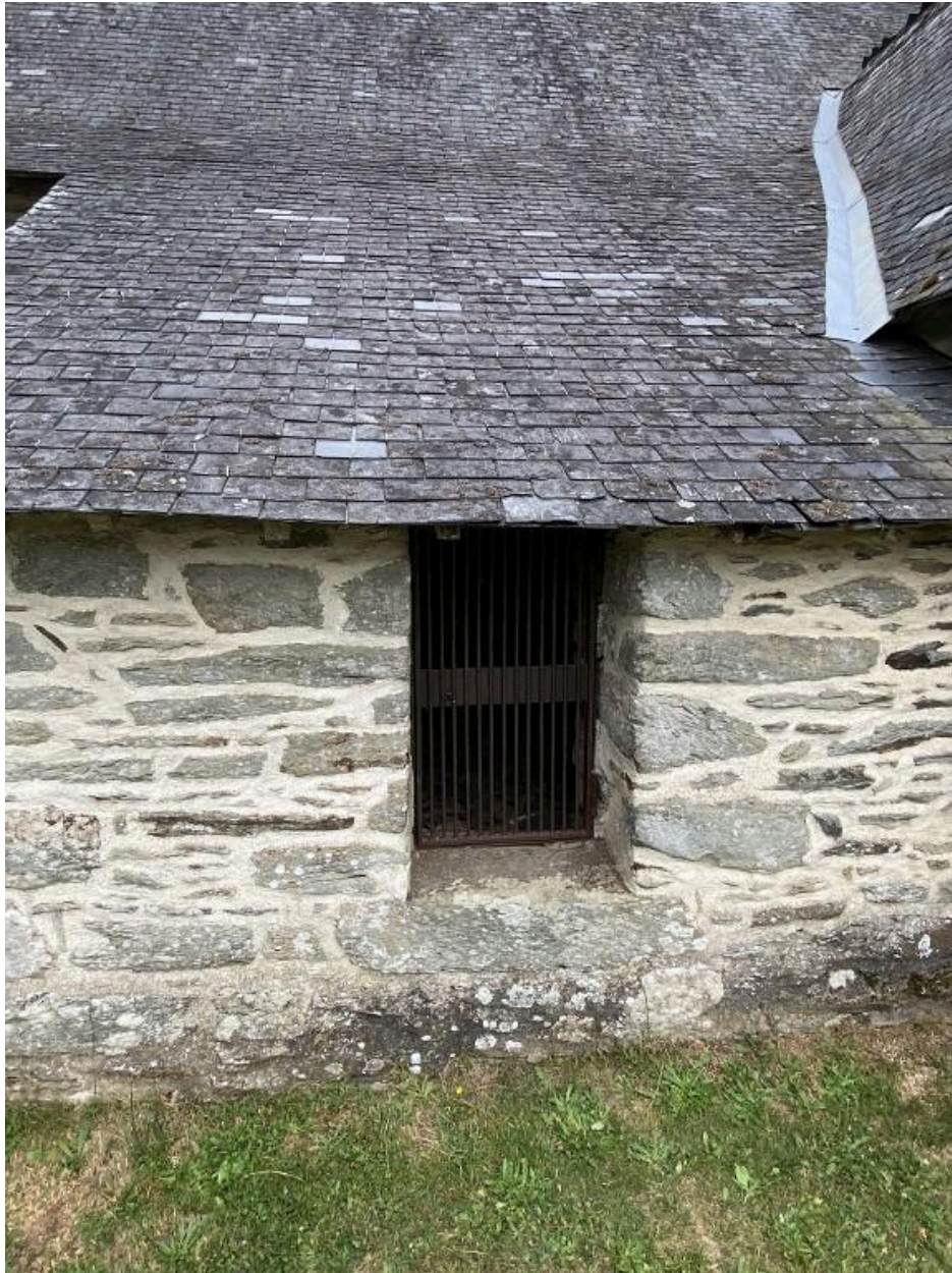
Élévation sud, détail