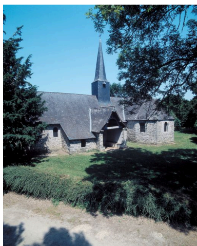
Vue rapprochée prise du sud, IVR53_19945600979XA