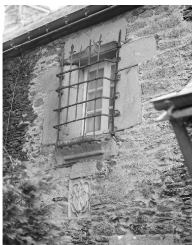
Ancien presbytère : détail fenêtre grillée en face nord