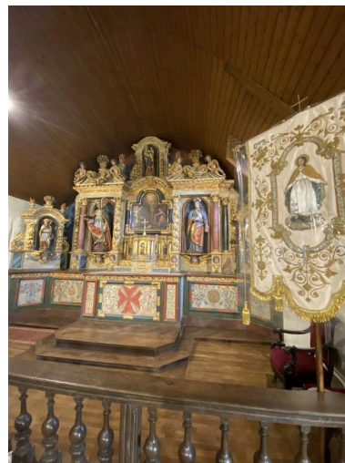
Vue de l'autel et du chœur IVR53_20265610405NUCA