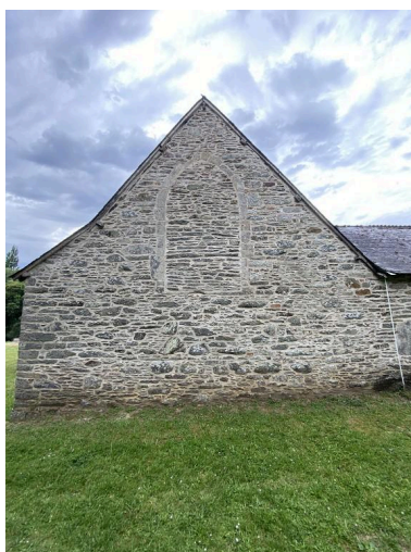
Élévation est IVR53_20265610395NUCA