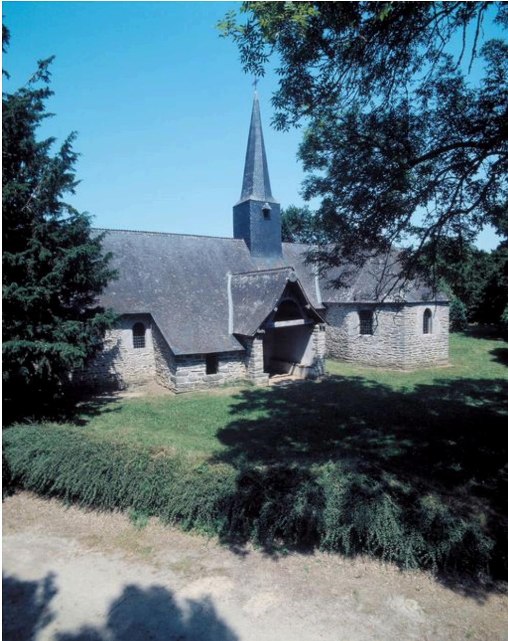
Vue rapprochée prise du sud