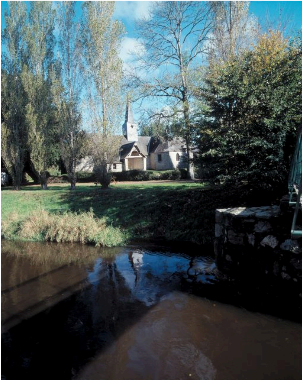
Vue de situation prise du sud