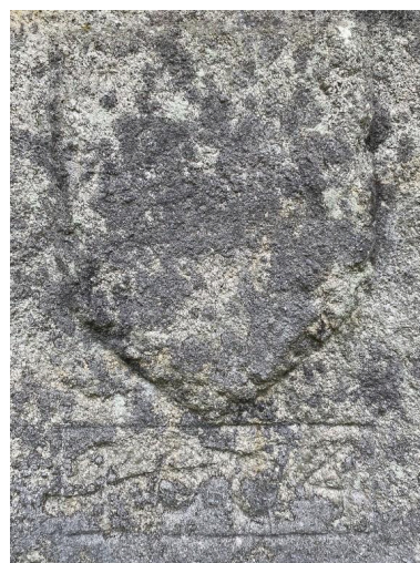
Blason, façade nord, détail IVR53_20265610394NUCA