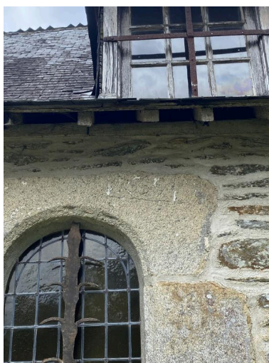
Date, élévation sud IVR53_20265610397NUCA