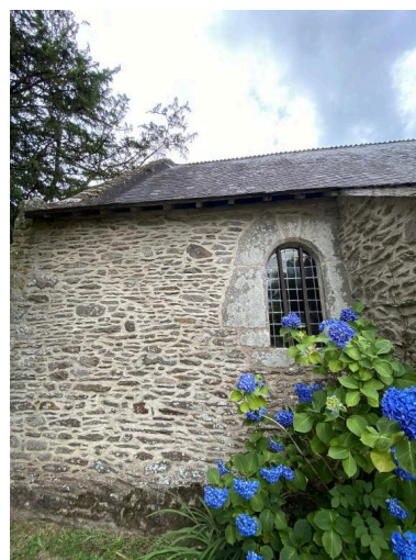
Élévation sud, détail IVR53_20265610400NUCA