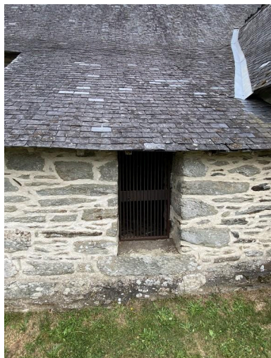
Élévation sud, détail IVR53_20265610401NUCA