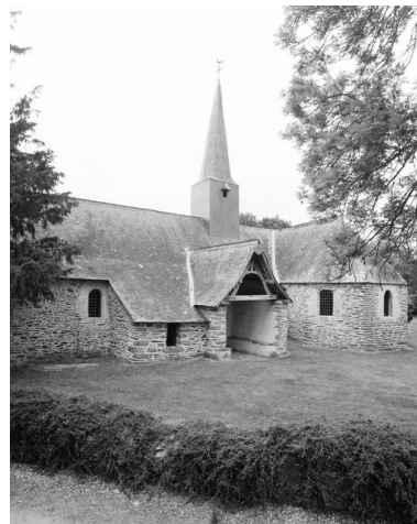
Elévation sud IVR53_19915600540X