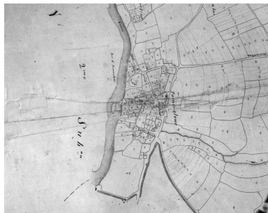
La chapelle Saint-Mélec à Pomeleuc sur le cadastre de 1831