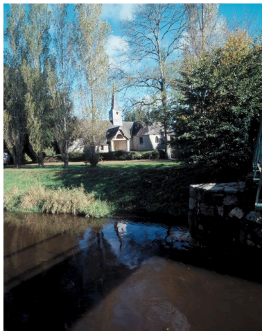
Vue de situation prise du sud IVR53_19945601050XA