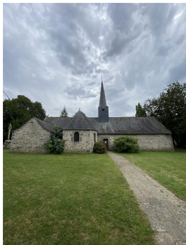
Vue nord