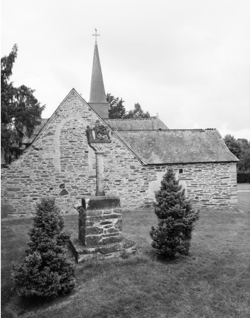
Vue générale prise de l'est