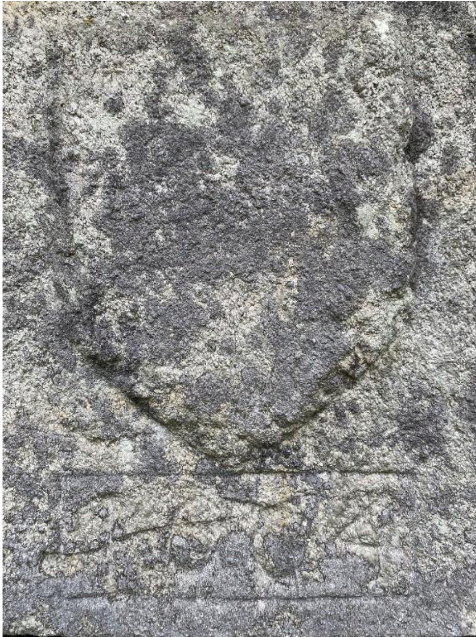
Blason, façade nord, détail