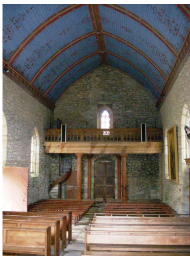
Guissény, chapelle Notre-Dame : vue axiale ouest