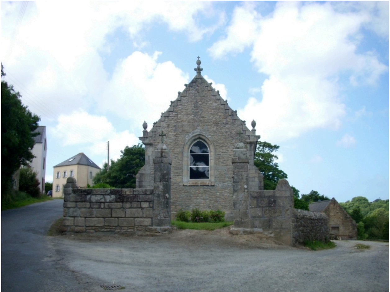
Guissény, chapelle Notre-Dame : élévation est