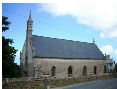
Guissény, chapelle Notre-Dame : vue générale sud-ouest