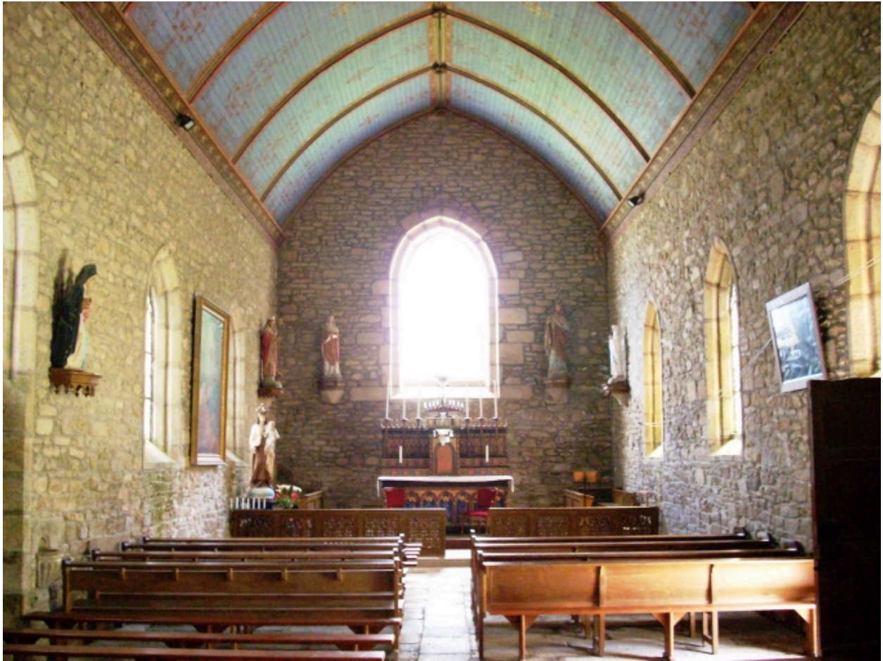
Guissény, chapelle Notre-Dame : vue axiale est