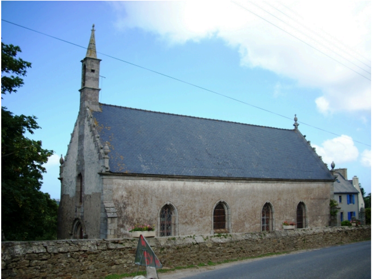
Guissény, chapelle Notre-Dame : vue générale sud-ouest