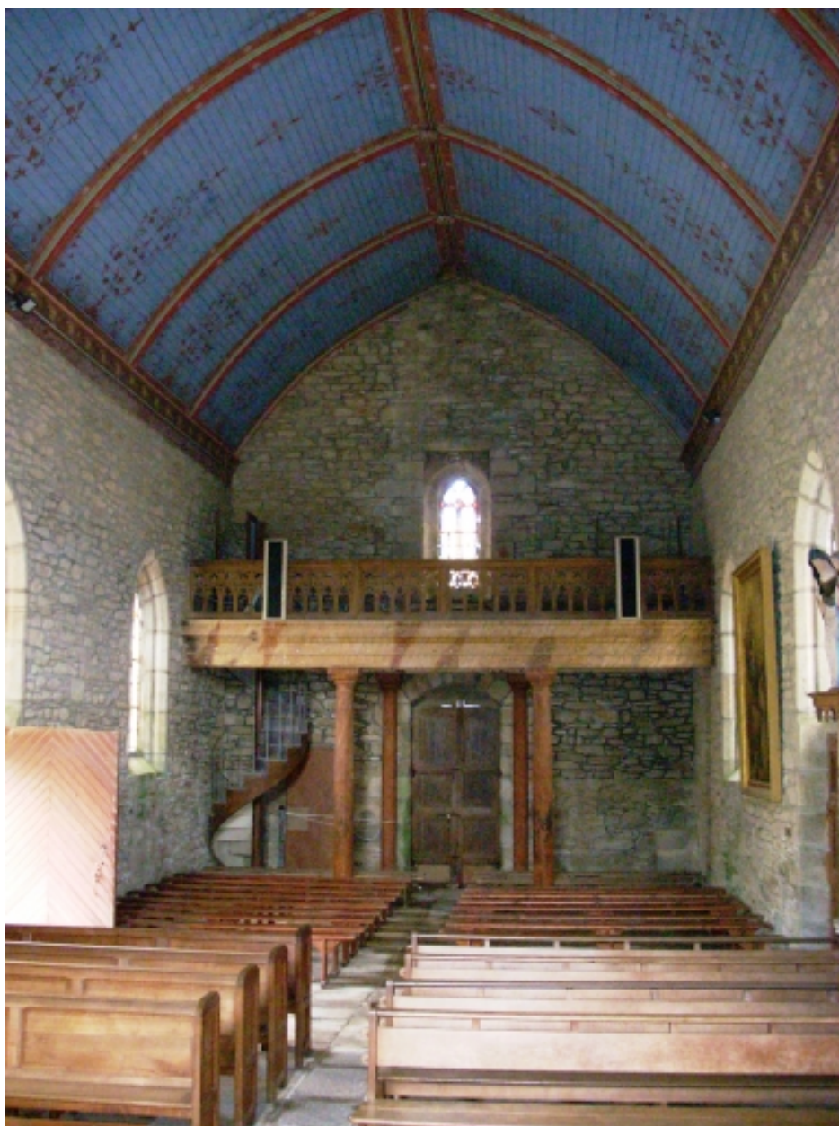
Guissény, chapelle Notre-Dame : vue axiale ouest