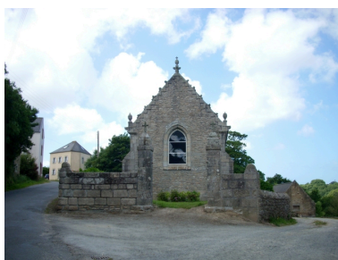
Guissény, chapelle Notre-Dame : élévation est IVR53_20082906314NUCA