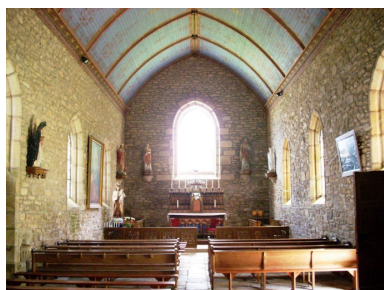
Guissény, chapelle Notre-Dame : vue axiale est