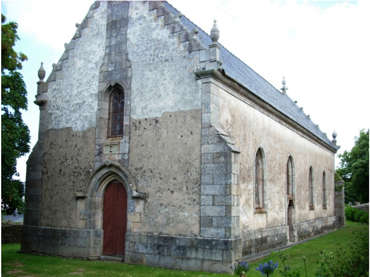
Guissény, chapelle Notre-Dame : vue générale sud-ouest