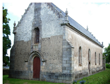
Guissény, chapelle Notre-Dame : vue générale sud-ouest