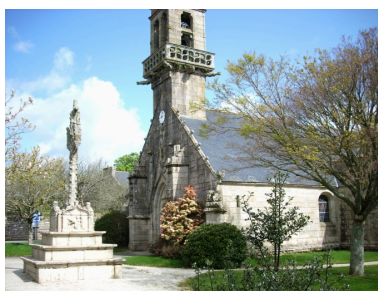
Langolen, église paroissiale Saint-Gunthiern : calvaire