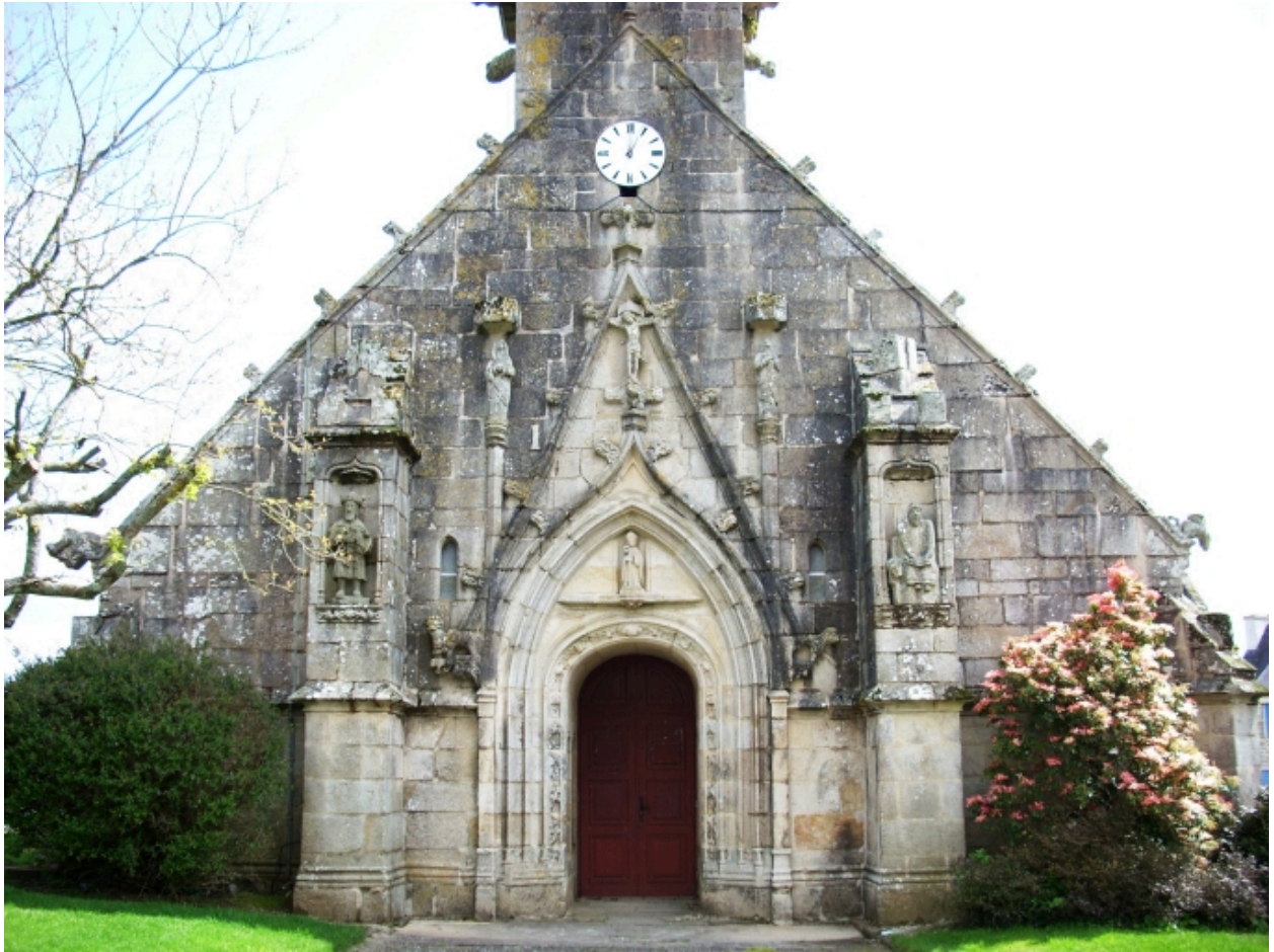
Langolen, église paroissiale Saint-Gunthiern : portail occidental