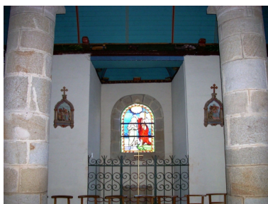
Langolen, église paroissiale Saint-Gunthiern : chapelle des fonds baptismaux