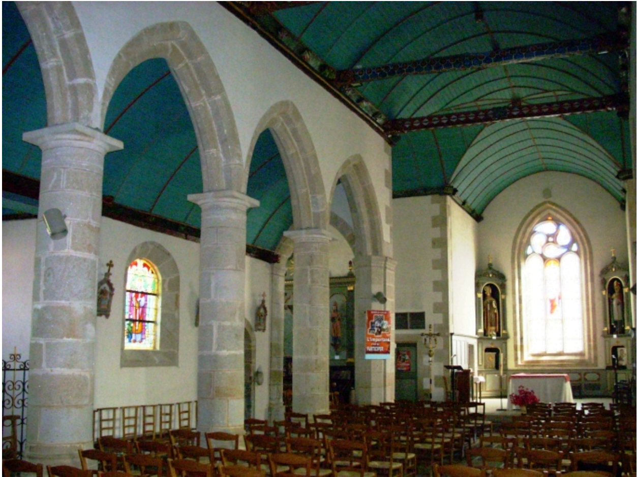
Langolen, église paroissiale Saint-Gunthiern : vue transversale nord-est