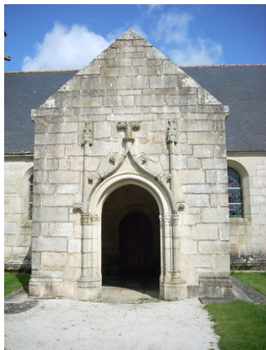
Langolen, église paroissiale Saint-Gunthiern : porche sud IVR53_20082905544NUCA