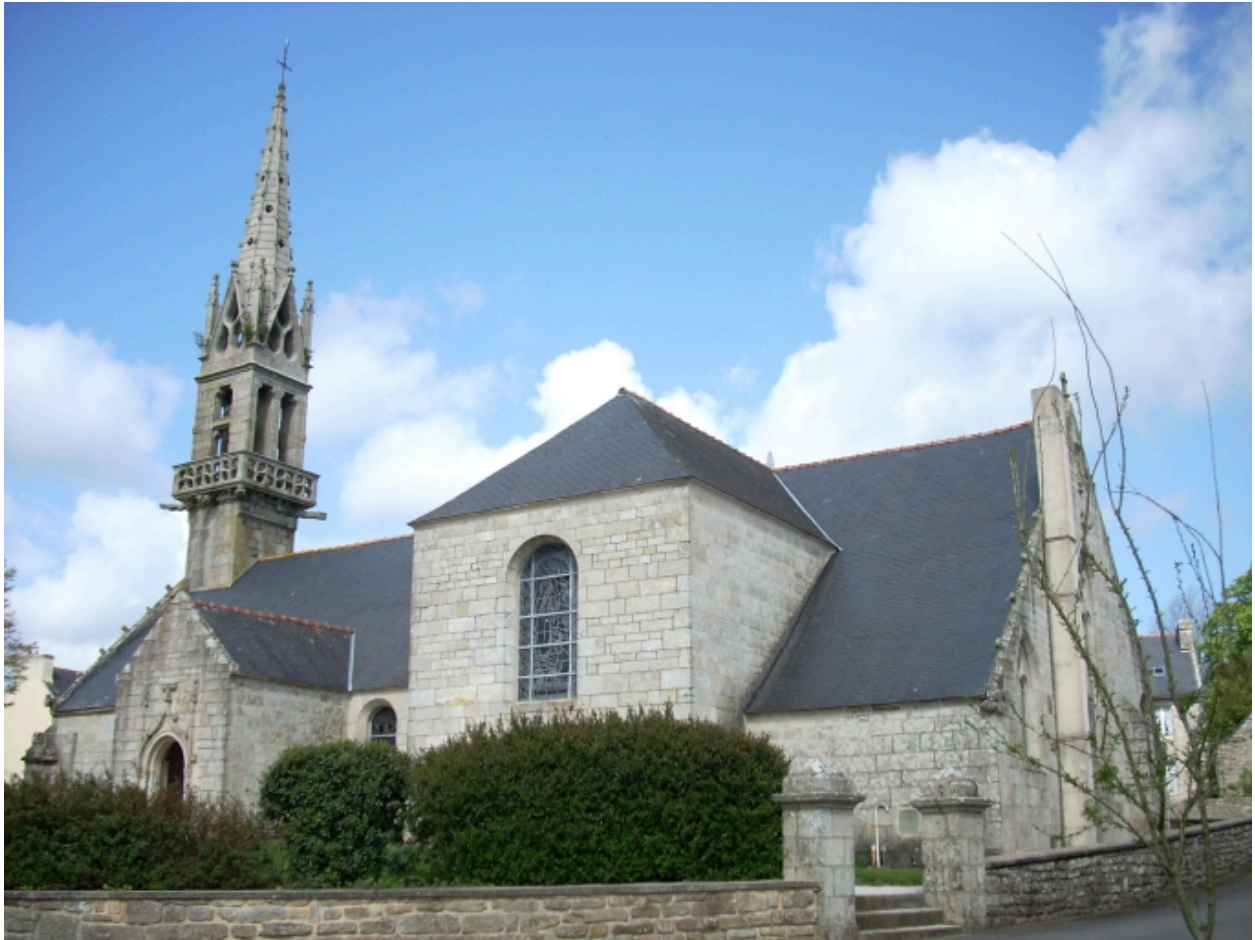
Langolen, église paroissiale Saint-Gunthiern : vue générale sud-est