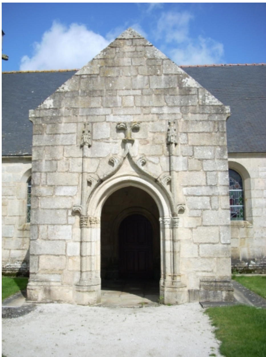
Langolen, église paroissiale Saint-Gunthiern : porche sud