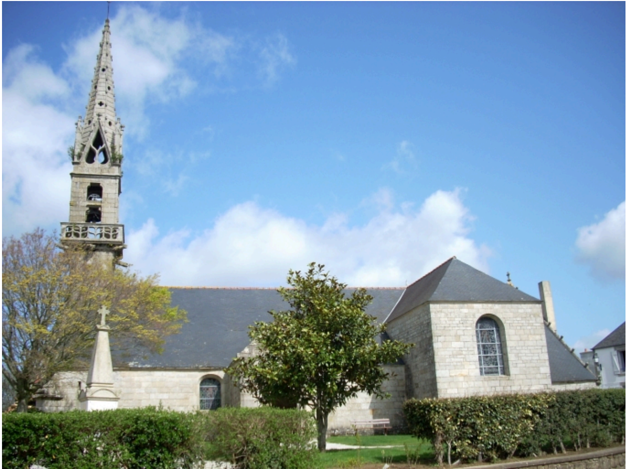
Langolen, église paroissiale Saint-Gunthiern : vue générale sud