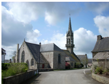
Langolen, église paroissiale Saint-Gunthiern : vue générale nord-est IVR53_20082905539NUCA