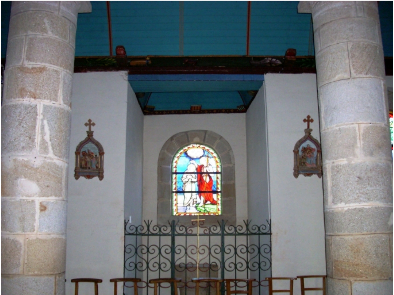
Langolen, église paroissiale Saint-Gunthiern : chapelle des fonds baptismaux