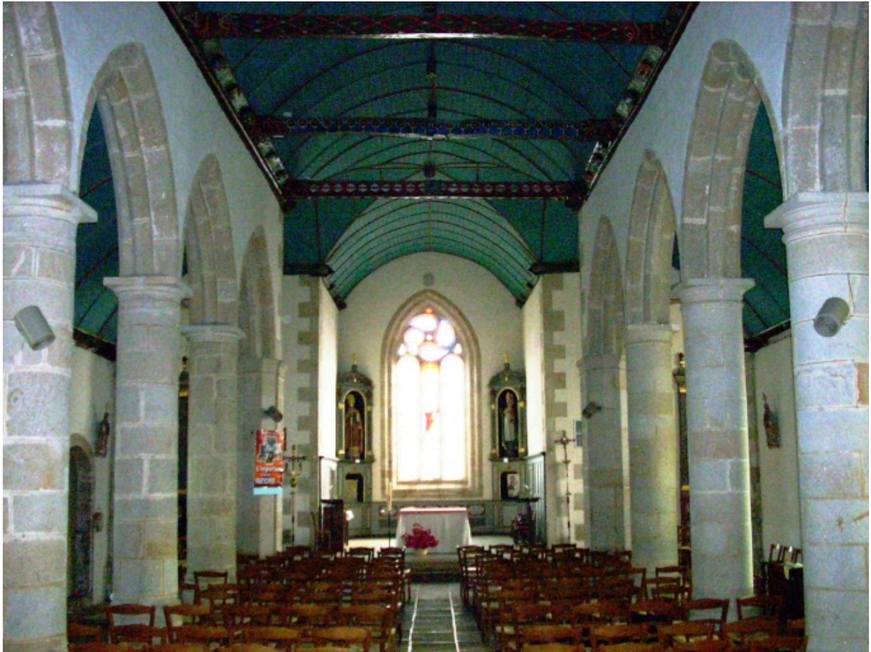
Langolen, église paroissiale Saint-Gunthiern : vue axiale est