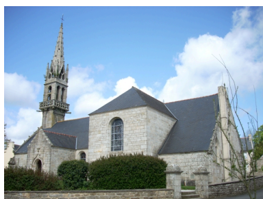
Langolen, église paroissiale Saint-Gunthiern : vue générale sud-est