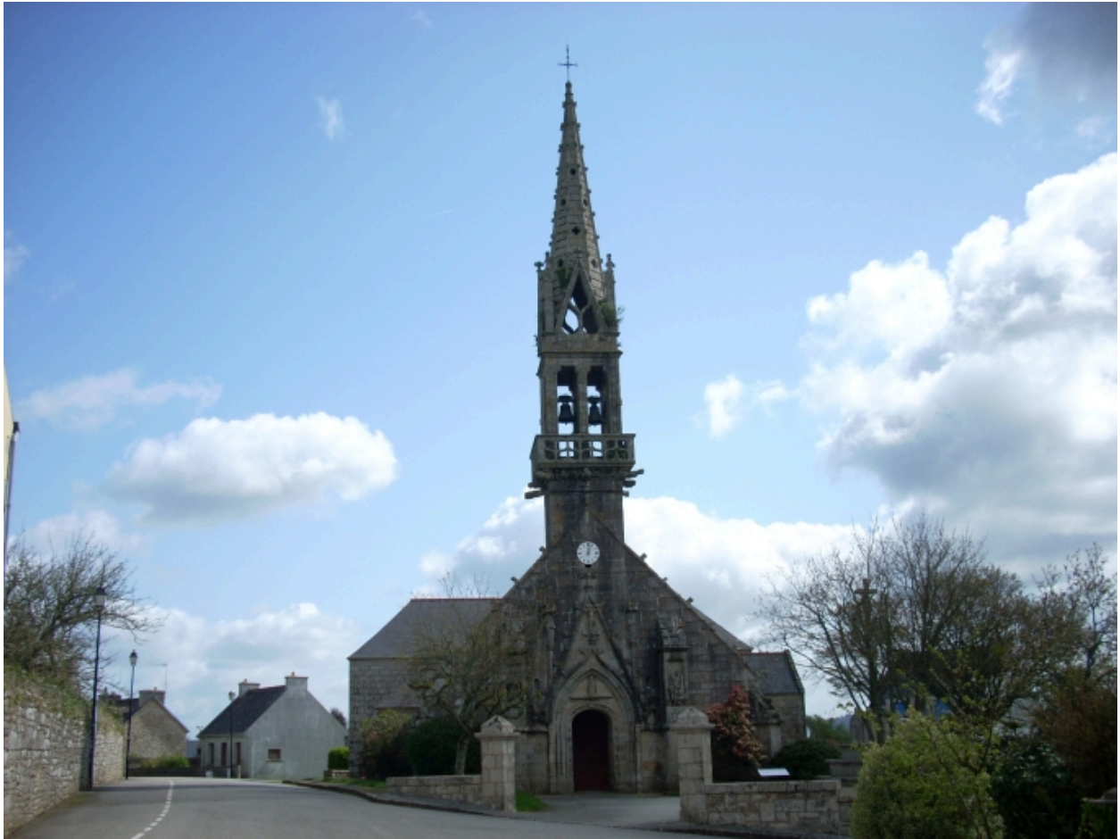
Langolen, église paroissiale Saint-Gunthiern : vue générale ouest