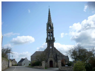
Langolen, église paroissiale Saint-Gunthiern : vue générale ouest IVR53_20082905538NUCA