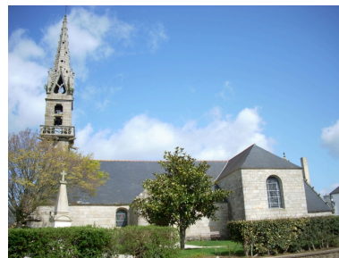
Langolen, église paroissiale Saint-Gunthiern : vue générale sud IVR53_20082905540NUCA