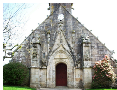
Langolen, église paroissiale Saint-Gunthiern : portail occidental IVR53_20082905543NUCA