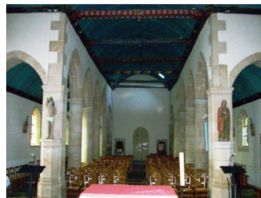
Langolen, église paroissiale Saint-Gunthiern : vue axiale ouest IVR53_20082905546NUCA