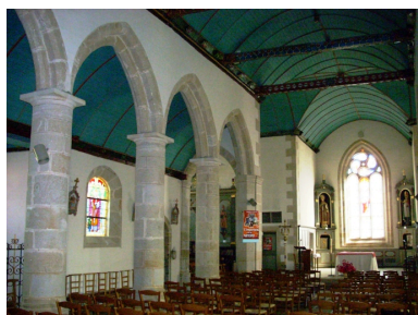
Langolen, église paroissiale Saint-Gunthiern : vue transversale nord-est IVR53_20082905547NUCA