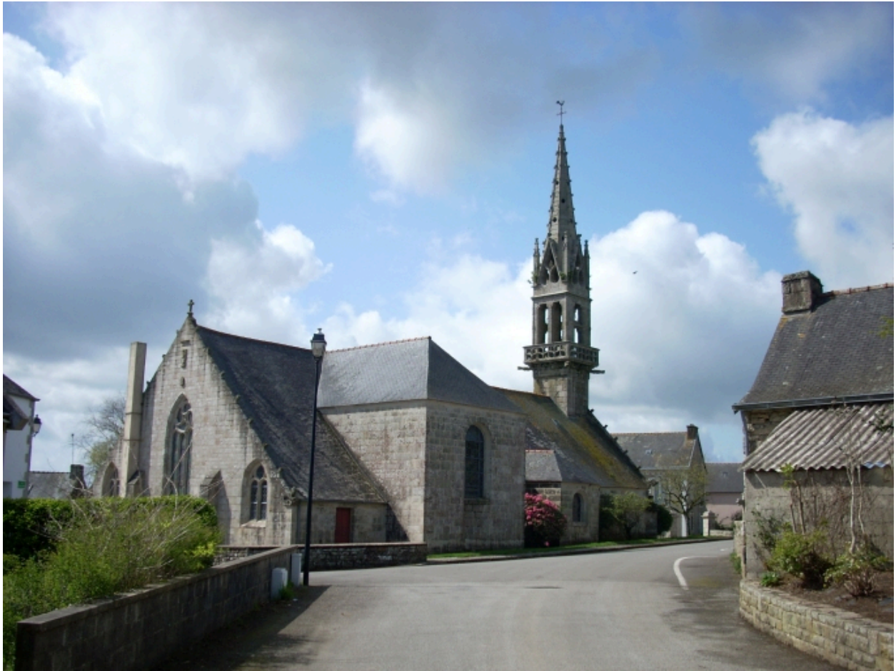
Langolen, église paroissiale Saint-Gunthiern : vue générale nord-est