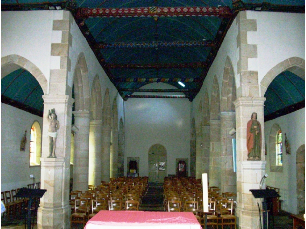
Langolen, église paroissiale Saint-Gunthiern : vue axiale ouest