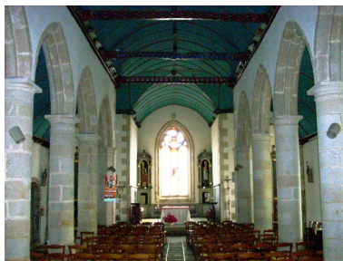
Langolen, église paroissiale Saint-Gunthiern : vue axiale est