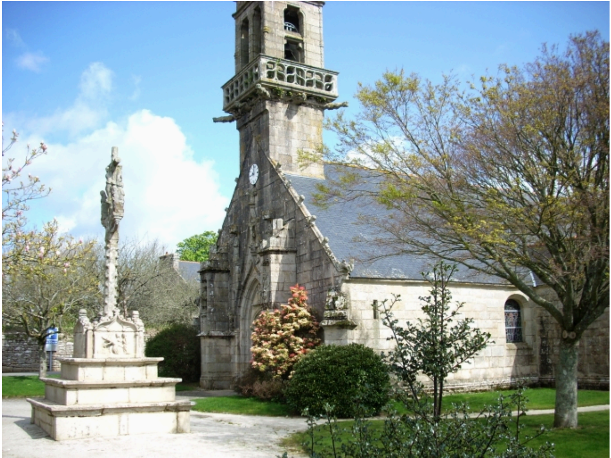
Langolen, église paroissiale Saint-Gunthiern : calvaire