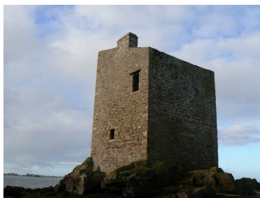
Tour de Ténéro IVR53_20085606126NUCA