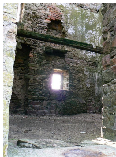
Vue intérieure de la tour de Ténéro IVR53_20085606129NUCA