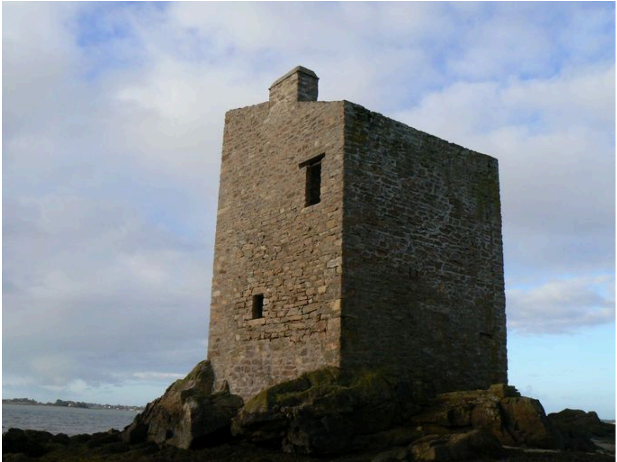
Tour de Ténéro