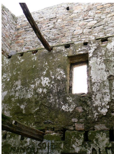
Vue intérieure d'une ouverture de la tour de Ténéro IVR53_20085606131NUCA