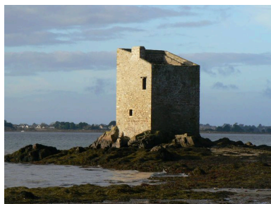
Vue générale de la Cabane de gardien de parcs à huîtres dite Tour de Ténéro IVR53_20085606125NUCA