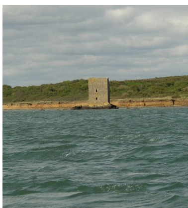
Tour de Ténéro IVR53_20065606611NUCA