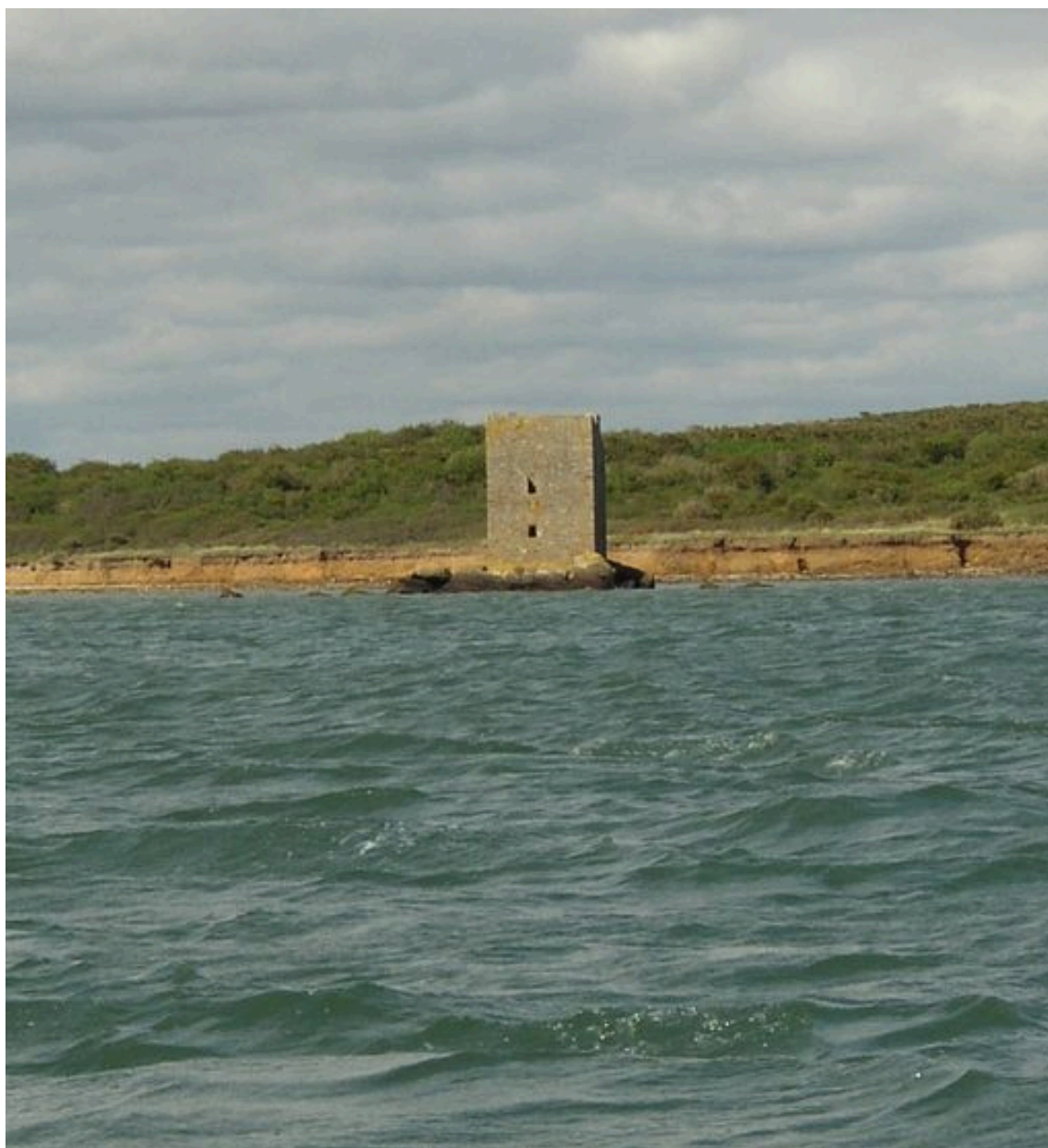
Tour de Ténéro