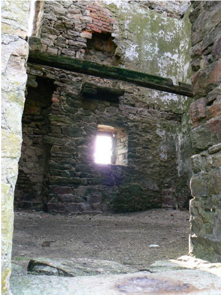
Vue intérieure de la tour de Ténéro