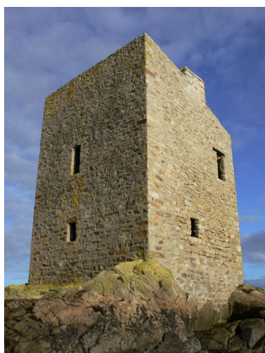
Tour de Ténéro IVR53_20085606128NUCA