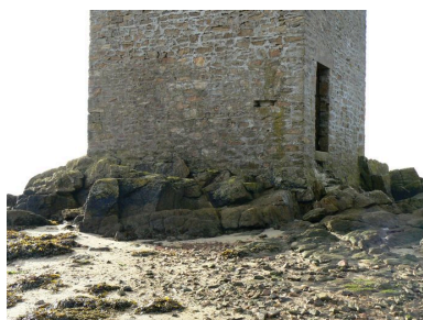
Vue de la base de la tour de Ténéro IVR53_20085606130NUCA