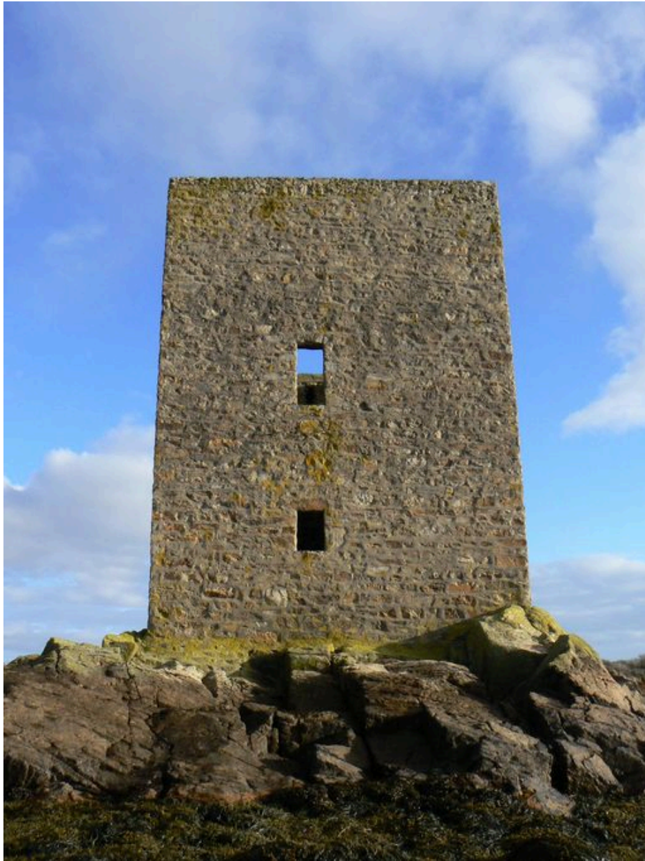
Tour de Ténéro