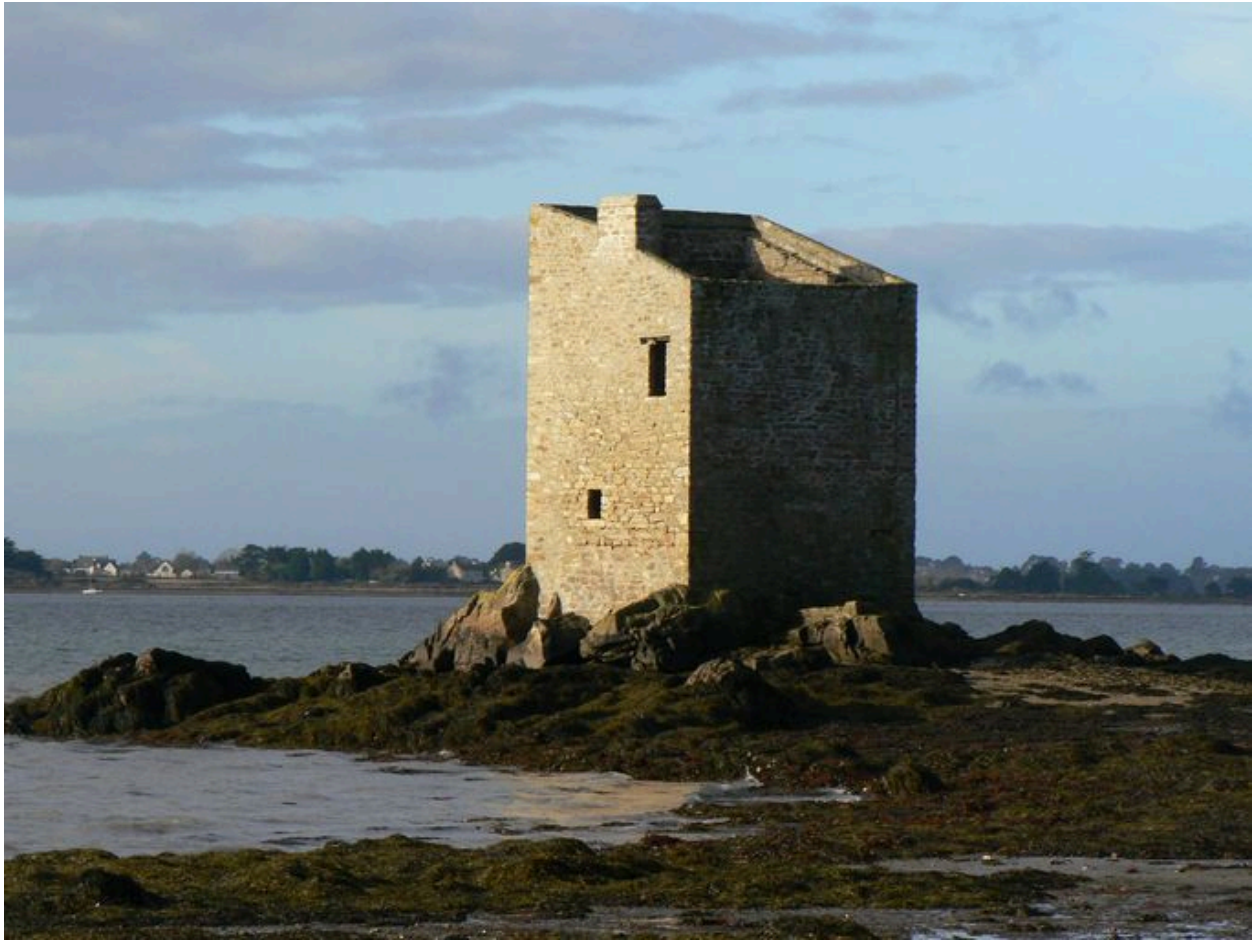
Vue générale de la Cabane de gardien de parcs à huîtres dite Tour de Ténéro