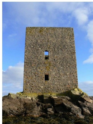
Tour de Ténéro