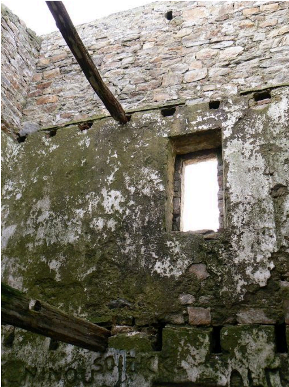
Vue intérieure d'une ouverture de la tour de Ténéro