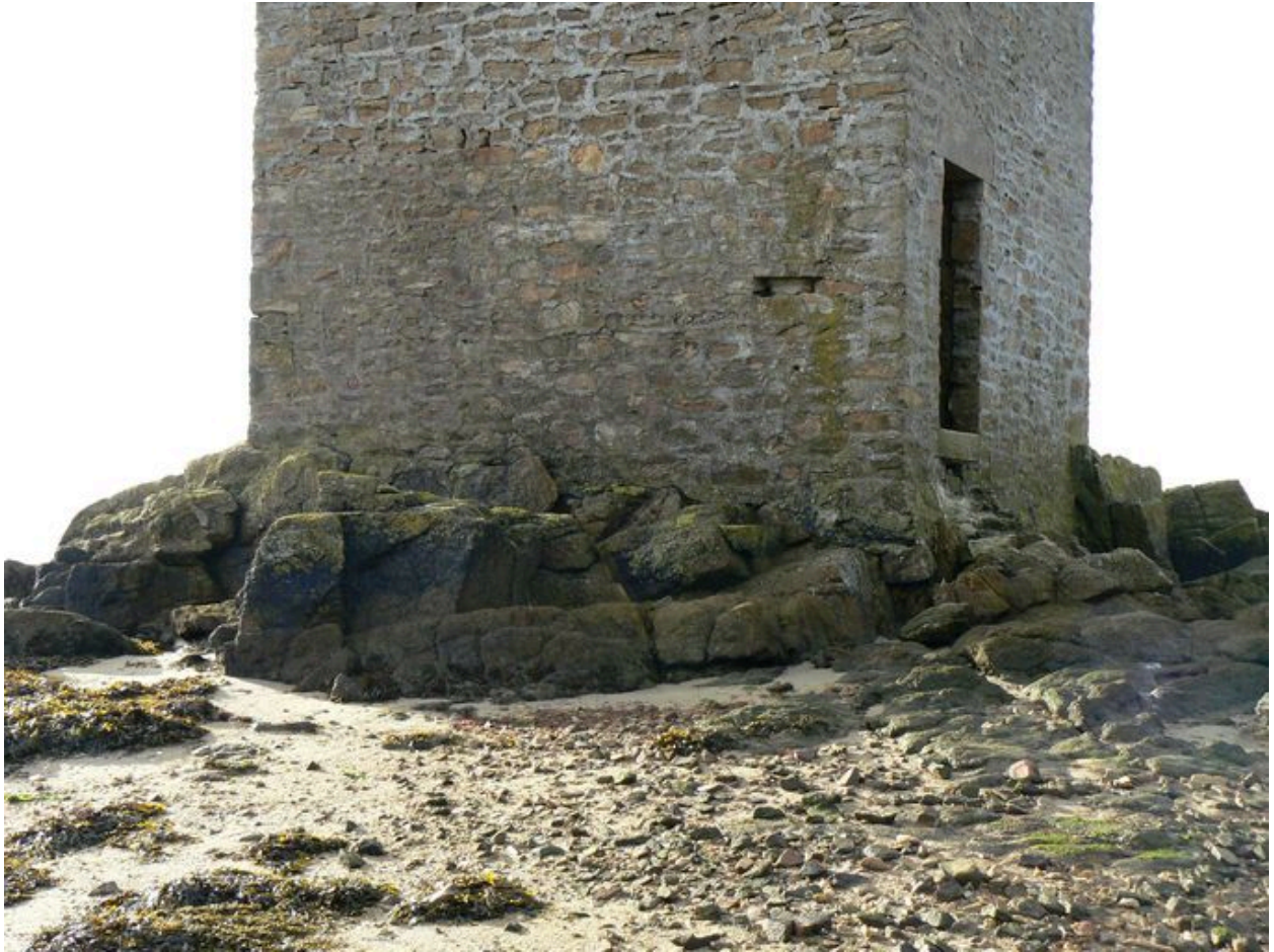
Vue de la base de la tour de Ténéro