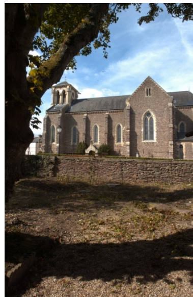
Vue de situation sud-est IVR53_20033501540NUCA