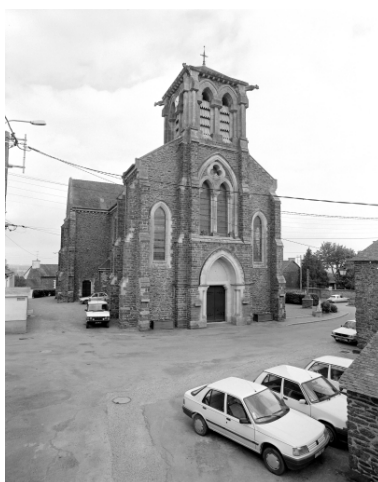
Elévation Ouest : vue générale IVR53_19943500845X