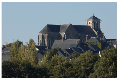
Vue de situation nord-est