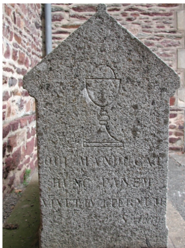
Tombe de l'ancien cimetière, au sud de l'église IVR53_20033514710NUCA