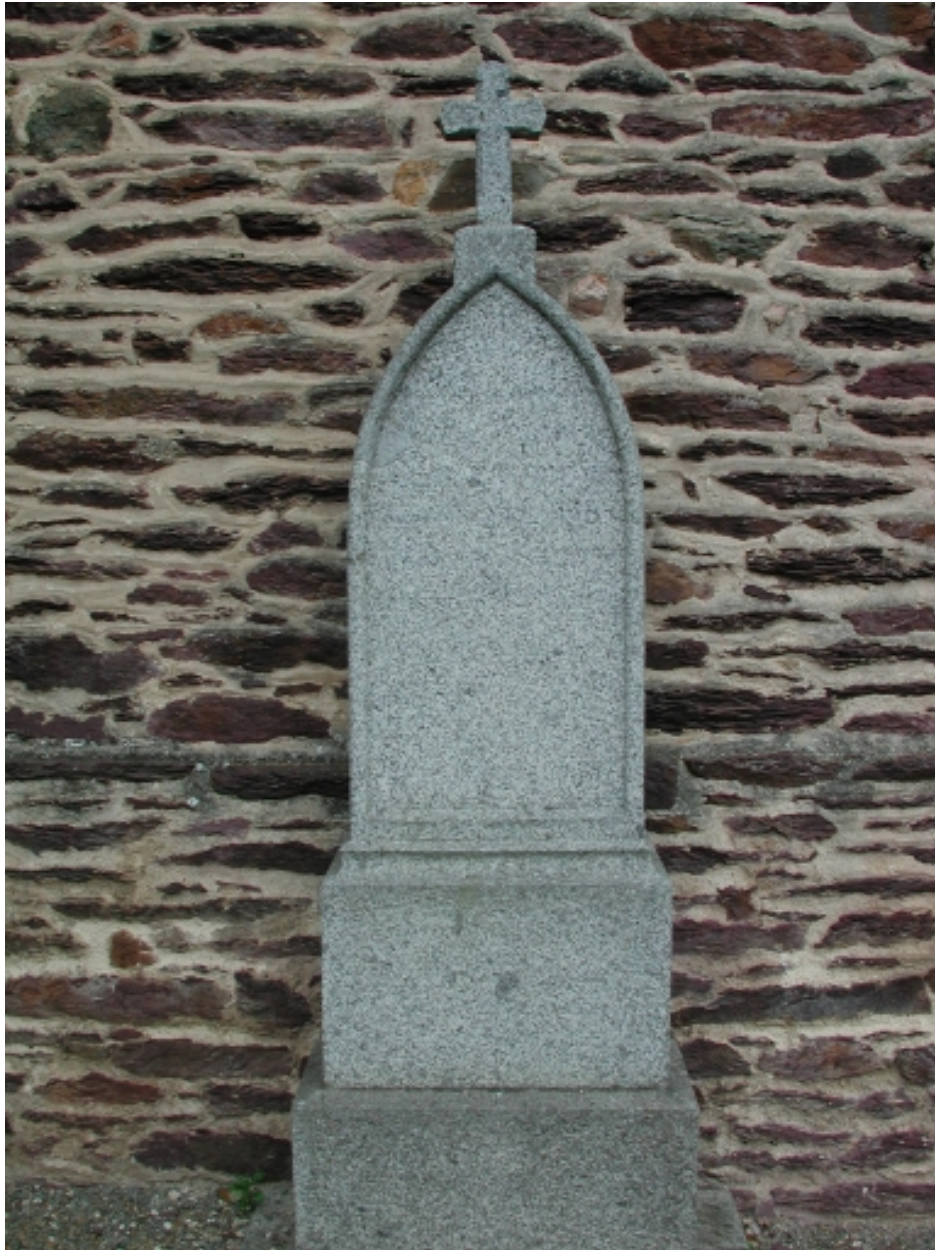
Tombe de l'ancien cimetière, au sud du transept