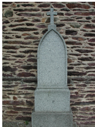
Tombe de l'ancien cimetière, au sud du transept IVR53_20033514712NUCA