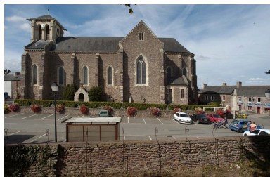
Elévation Sud : vue générale IVR53_20033501539NUCA