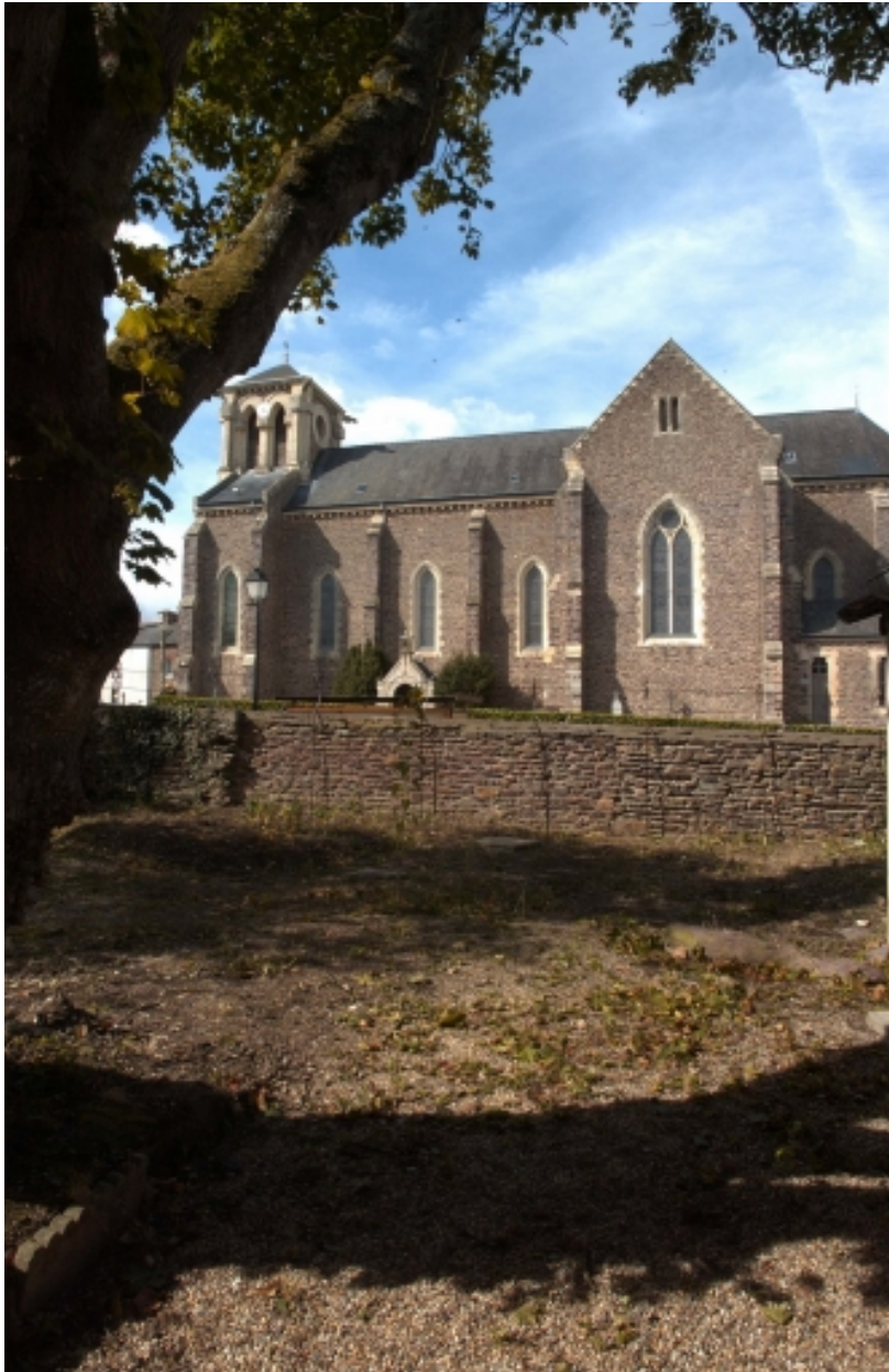
Vue de situation sud-est