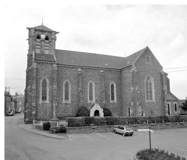
Elévation Sud : vue générale IVR53_19943500844X