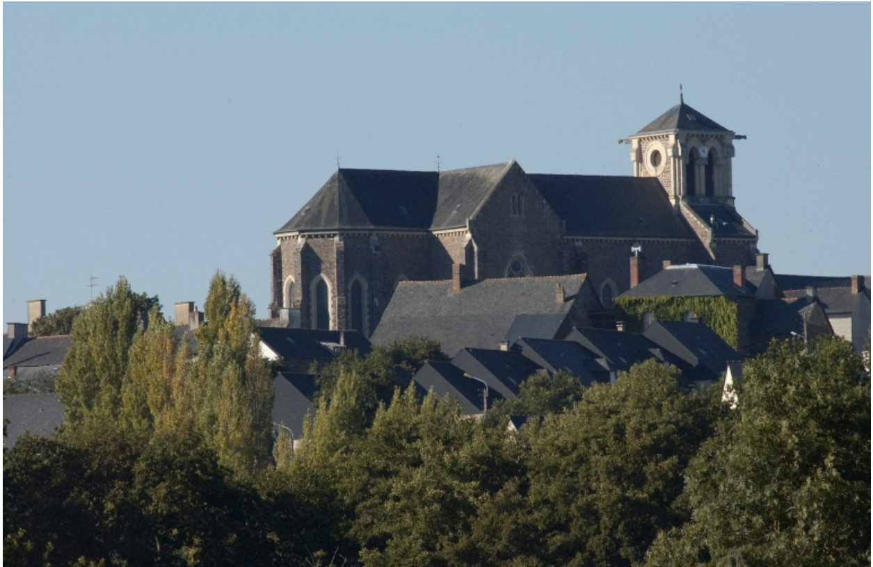
Vue de situation nord-est