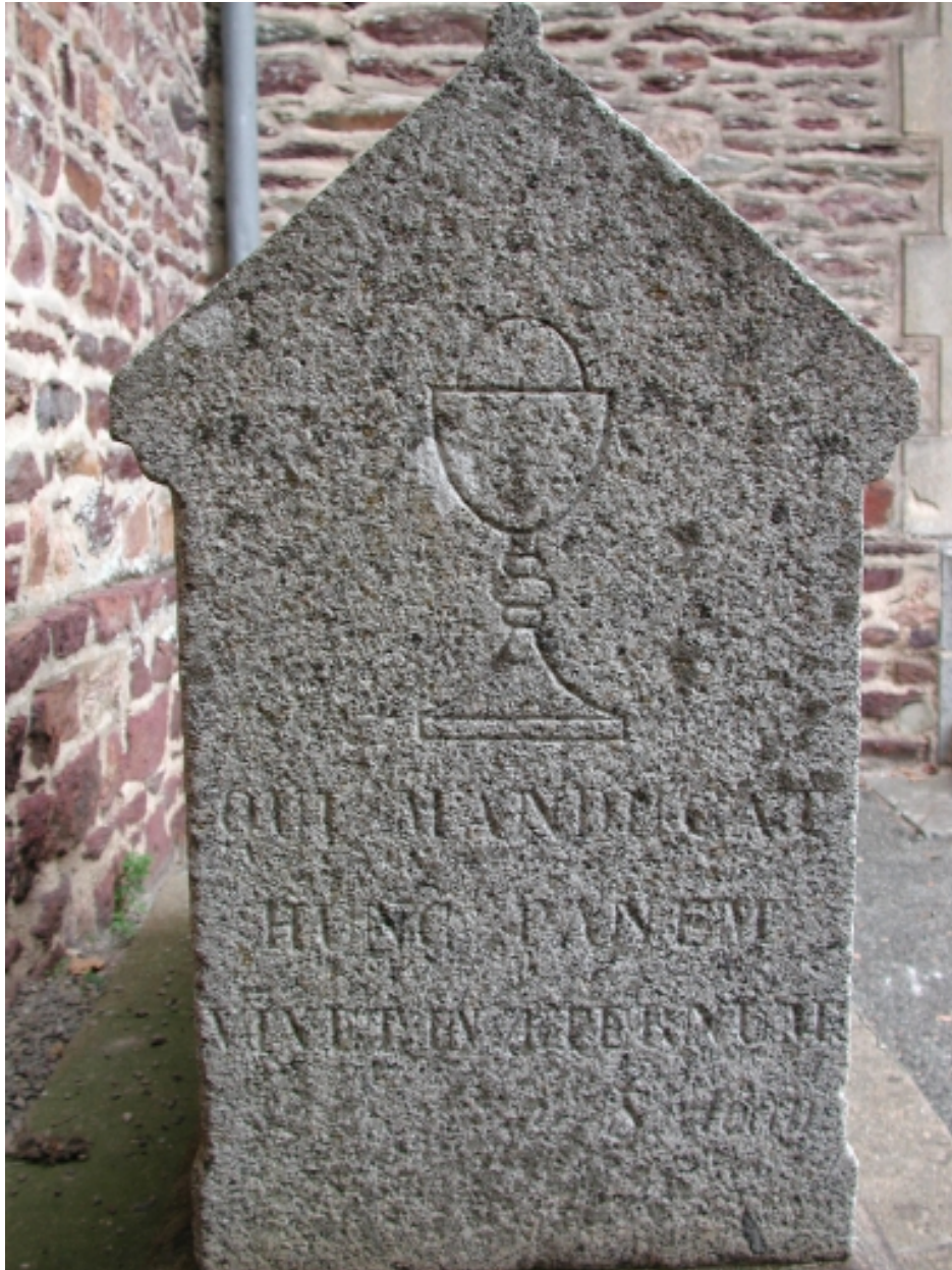
Tombe de l'ancien cimetière, au sud de l'église