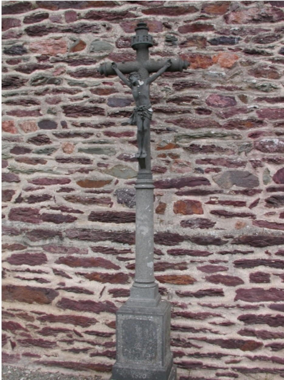
Tombe de l'ancien cimetière, au sud du transept