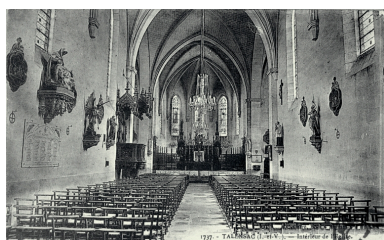
Intérieur : vue générale vers le chœur, carte postale ancienne IVR53_19933500932X