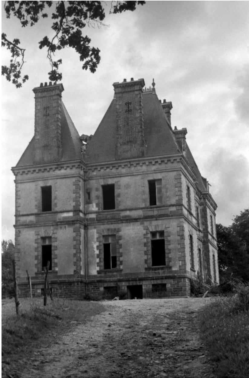
Plougonven, château de Rosampoul (état 1988, avant sa destruction)