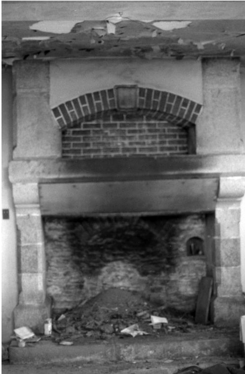
Plougonven, château Rosampoul, (état en 1988, avant sa destruction)