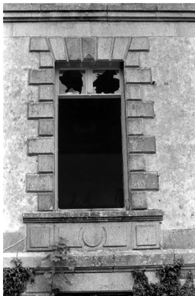
Plougonven, château de Rosampoul (état 1988, avant sa destruction)