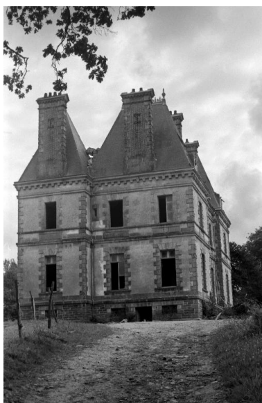
Plougonven, château de Rosampoul (état 1988, avant sa destruction) IVR53_19882905001Z