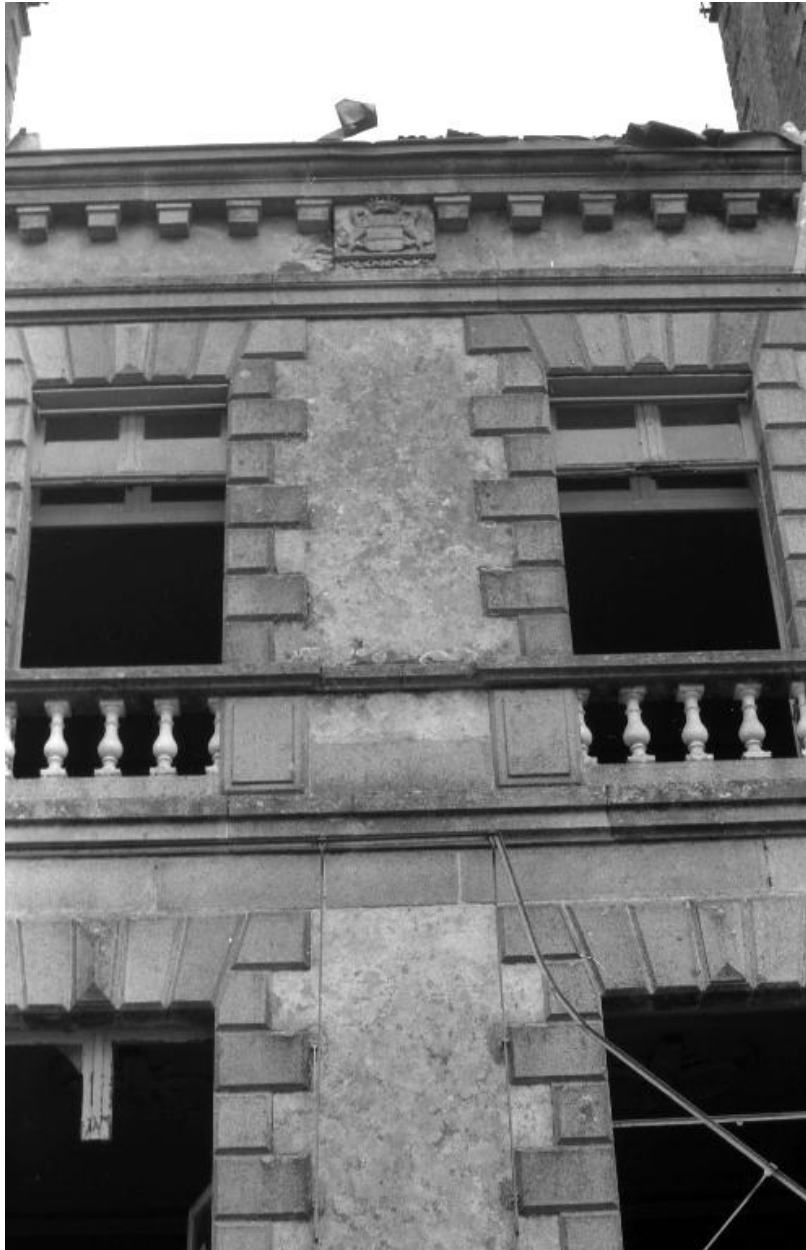
Plougonven, château de Rosampoul (état 1988, avant sa destruction)