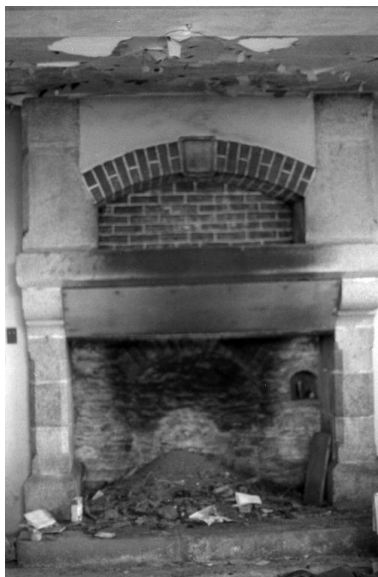
Plougonven, château Rosampoul, (état en 1988, avant sa destruction)