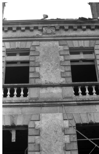
Plougonven, château de Rosampoul (état 1988, avant sa destruction)