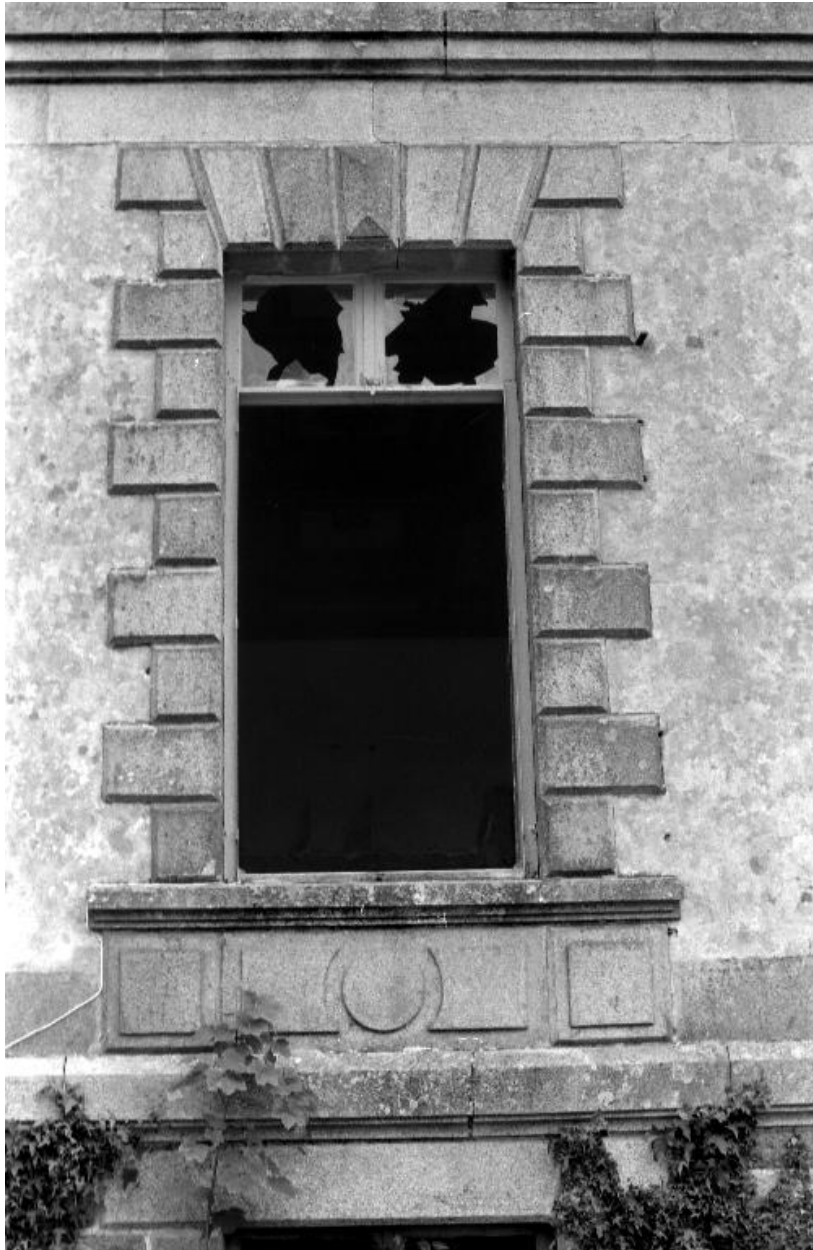
Plougonven, château de Rosampoul (état 1988, avant sa destruction)