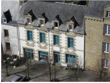
Maison Ponsard, vue générale IVR53_20225605083NUCA