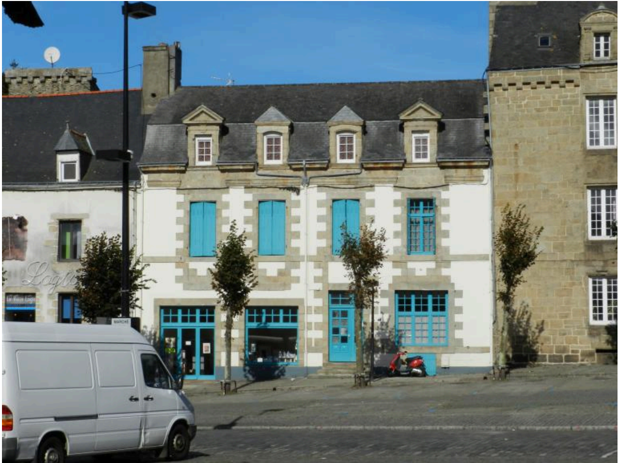
Maison Ponsard, place Maréchal Foch