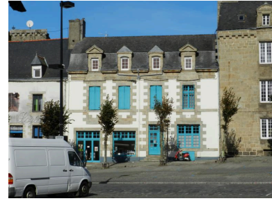
Maison Ponsard, place Maréchal Foch IVR53_20225605091NUCA