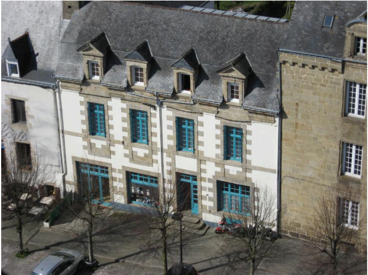
Maison Ponsard, vue générale