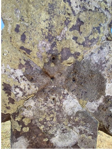
Face ouest, détail