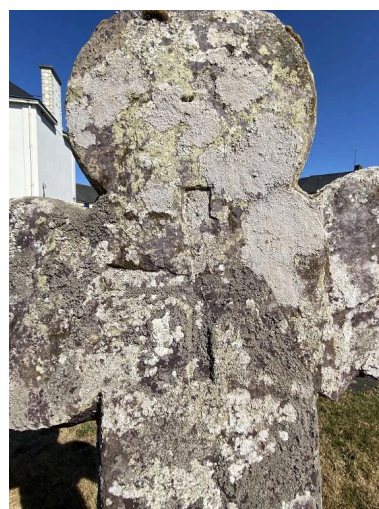
Face est, détail