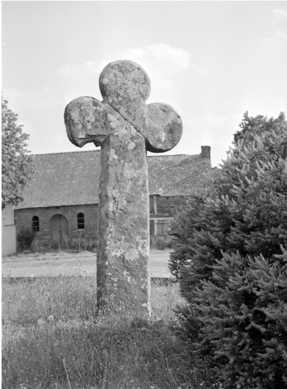
Vue générale, face ouest (état en 1977)