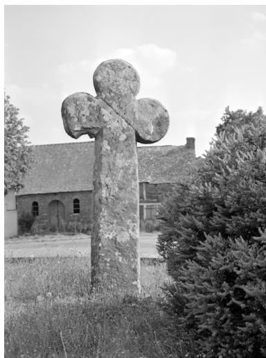
Vue générale, face ouest (état en 1977) IVR53_19775600534X