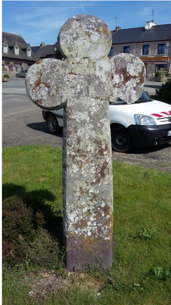
Vue générale, face est (état en 2016)