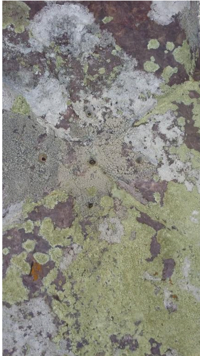
Détail face ouest