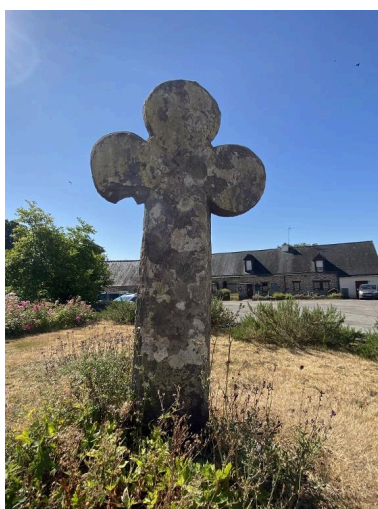
Vue générale ouest IVR53_20255610905NUCA