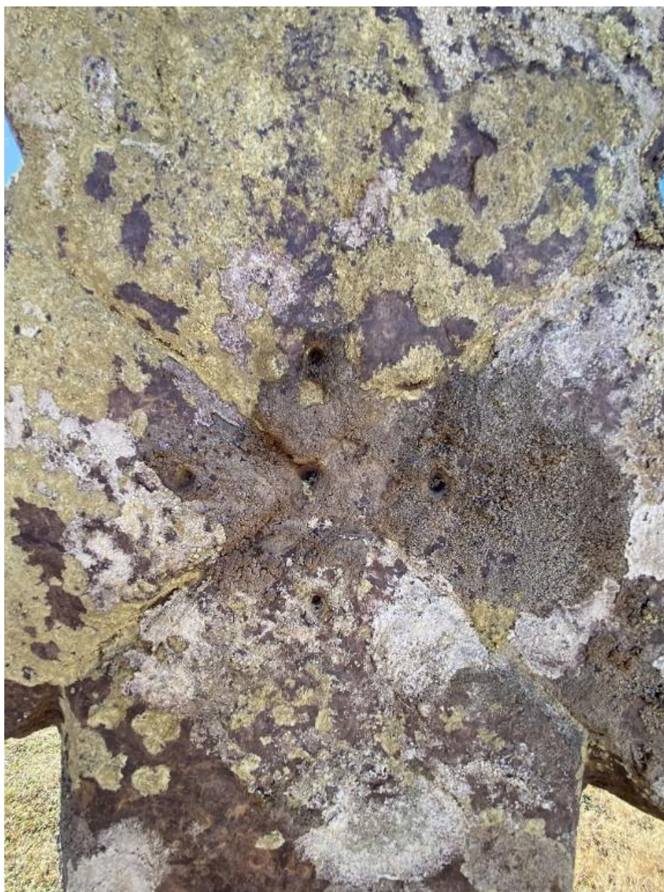
Face ouest, détail