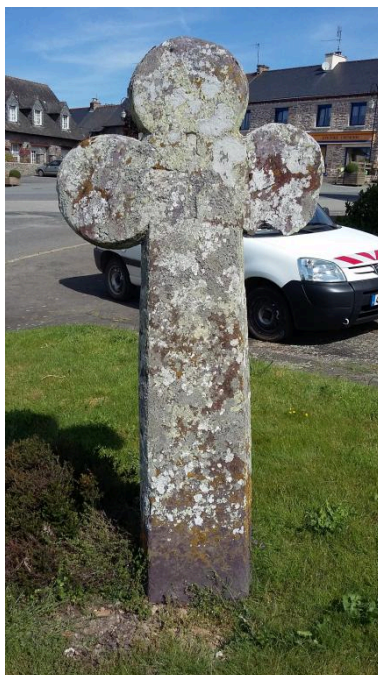
Vue générale, face est (état en 2016) IVR53_20165605444NUCA