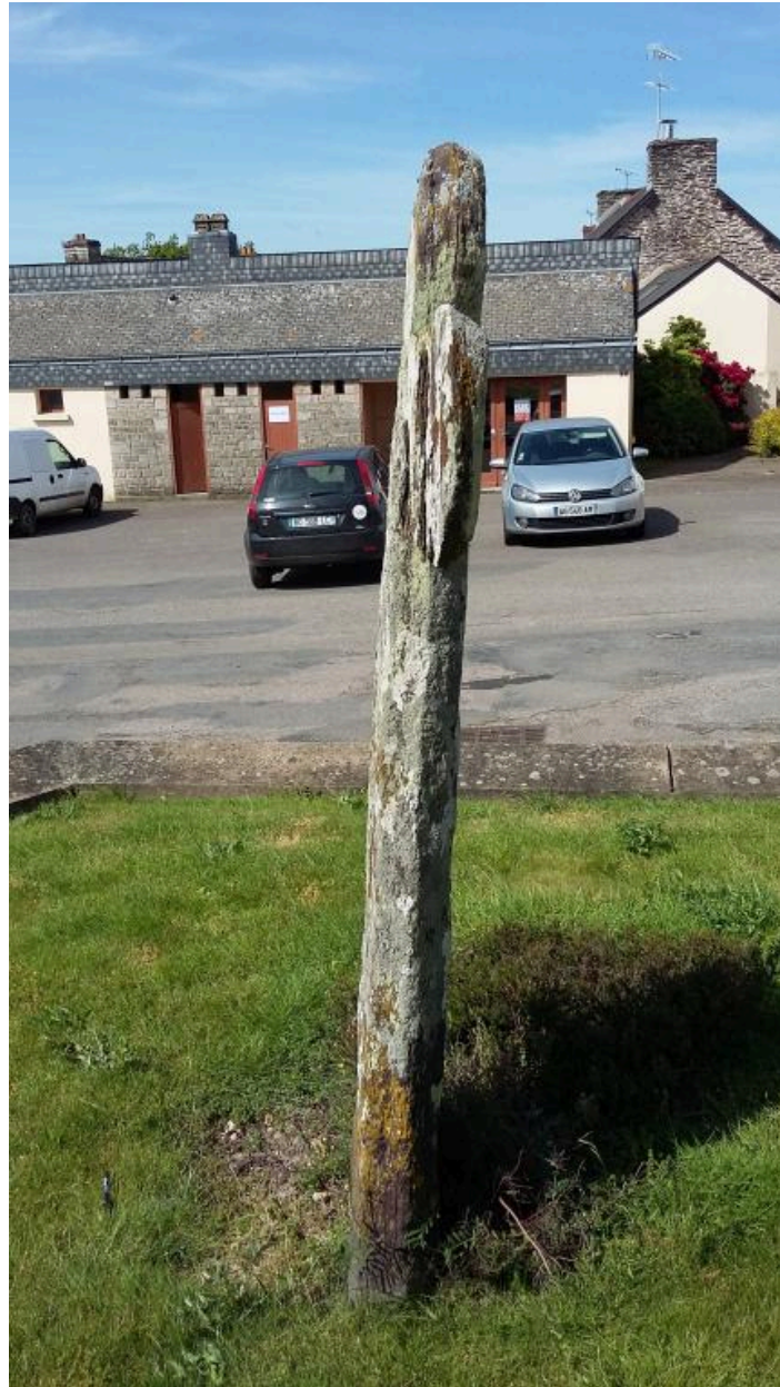
Vue générale face nord (état en 2016)