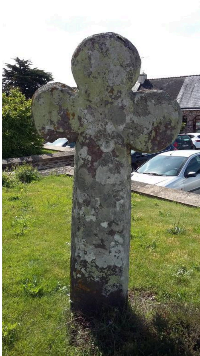
Vue générale face ouest (état en 2016)