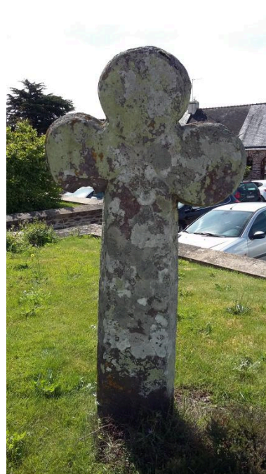
Vue générale face ouest (état en 2016) IVR53_20165605445NUCA