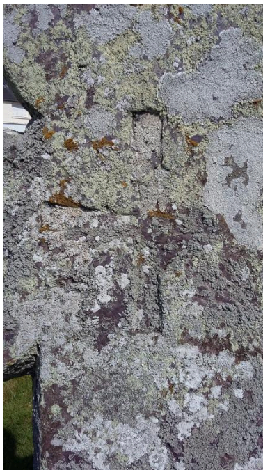
Détail face est