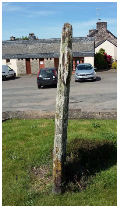
Vue générale face nord (état en 2016) IVR53_20165605446NUCA