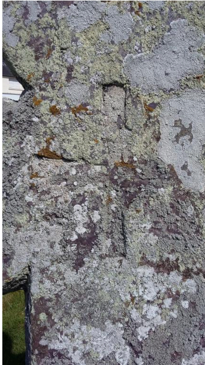
Détail face est