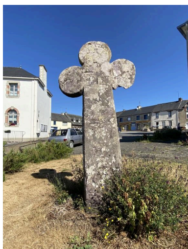
Vue générale est IVR53_20255610908NUCA