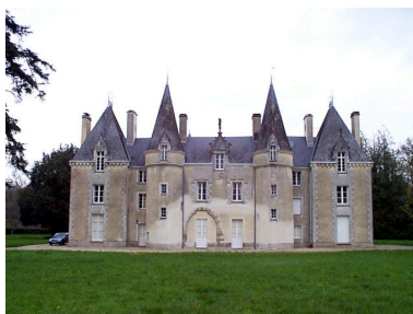
Façade principale : vue générale sud IVR53_19993504734NUCA