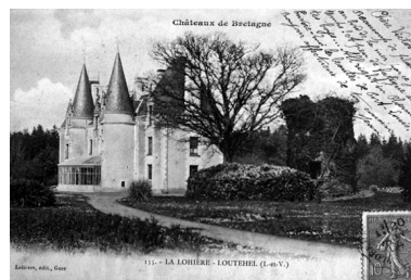
Le château sur une carte postale du début du 20e siècle ; remarquez les ruines de la tour au premier plan vue générale sud-est IVR53_19993509567X