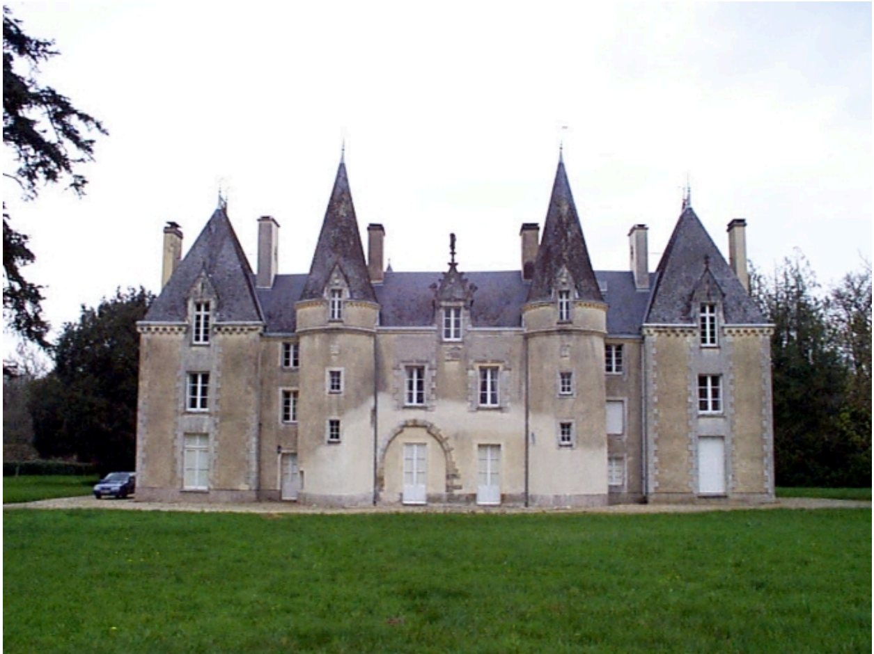
Façade principale : vue générale sud