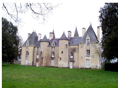
Façade postérieure donnant sur l'étang : vue générale nord-ouest IVR53_19993504735NUCA