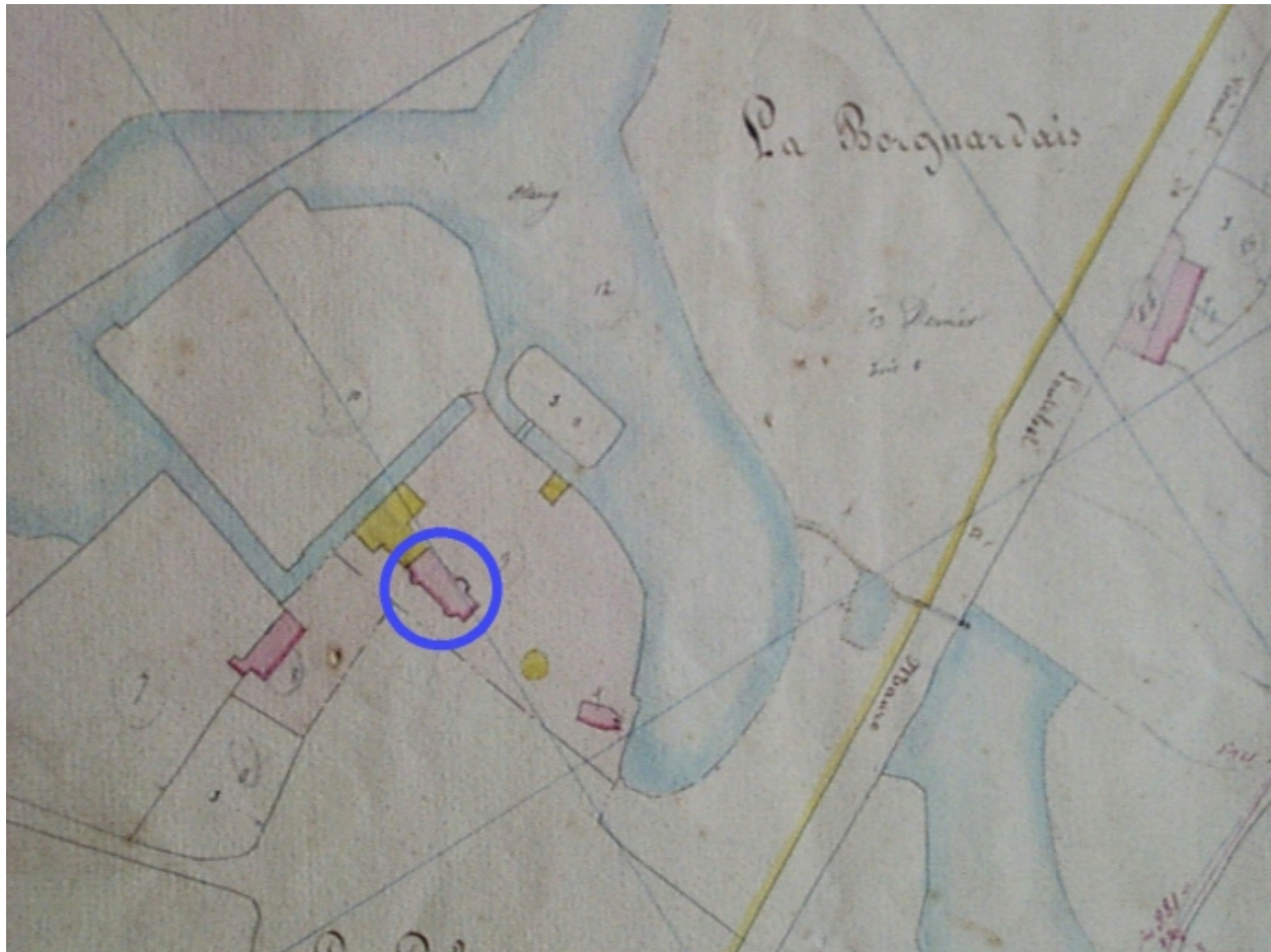
L'ancien manoir sur le cadastre napoléonien