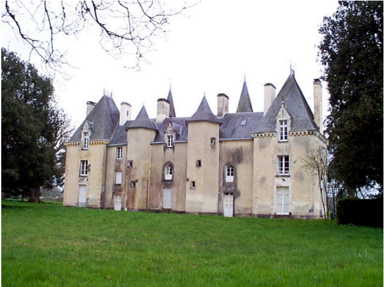
Façade postérieure donnant sur l'étang : vue générale nord-ouest