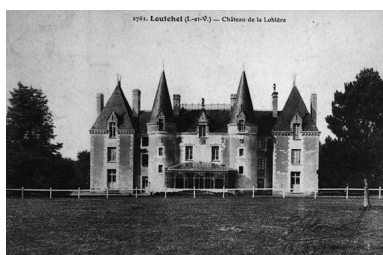
Le château, façade principale, sur une carte postale du début du 20e siècle : vue générale sud