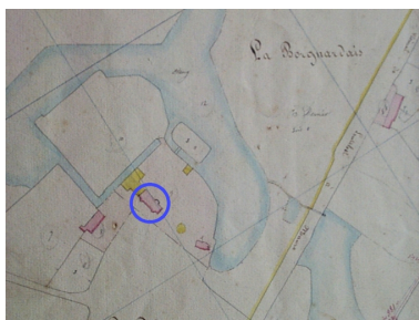
L'ancien manoir sur le cadastre napoléonien IVR53_19993504674NUC