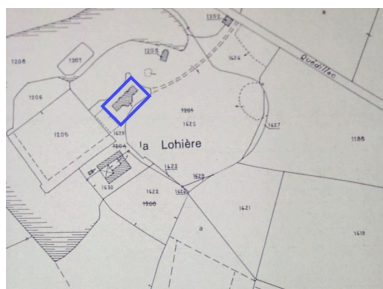
Le château sur le cadastre rénové IVR53_19993504690NUC