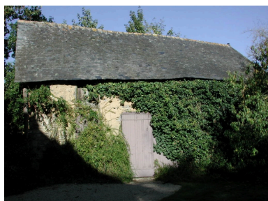
Chapelle IVR53_20013515502NUCA