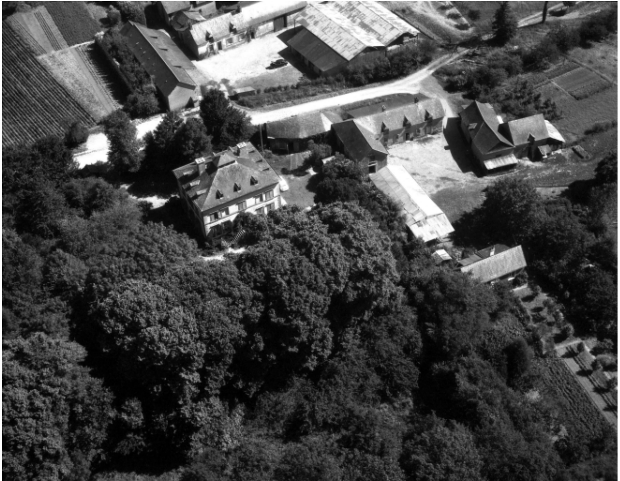
Vue aérienne prise du sud