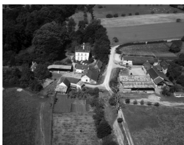
Vue aérienne prise de l'est de l'ensemble du village de la Saudrais IVR53_19843500732X