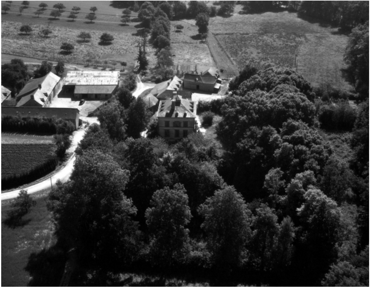
Vue aérienne prise de l'ouest