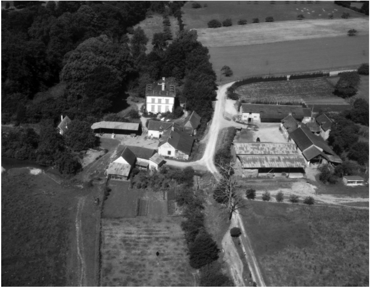
Vue aérienne prise de l'est de l'ensemble du village de la Saudrais