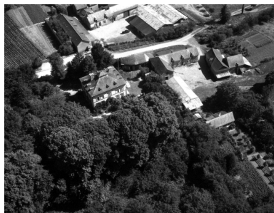
Vue aérienne prise du sud IVR53_19843500730X