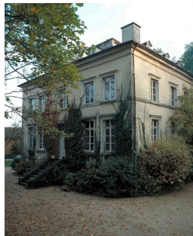
Vue générale façade sur cour IVR53_20013502258XA