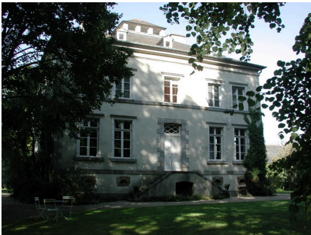
Vue générale de la façade sur le parc