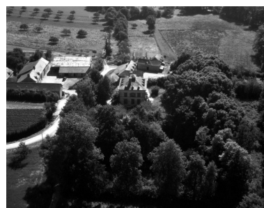
Vue aérienne prise de l'ouest IVR53_20013500729X