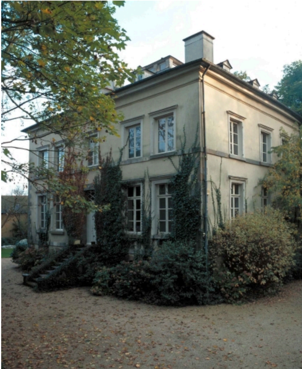
Vue générale façade sur cour