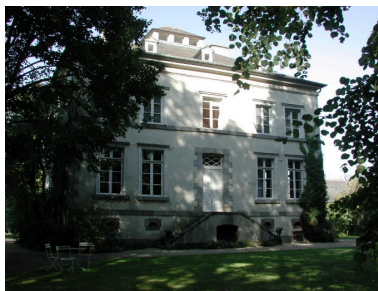
Vue générale de la façade sur le parc IVR53_20013515501NUCA