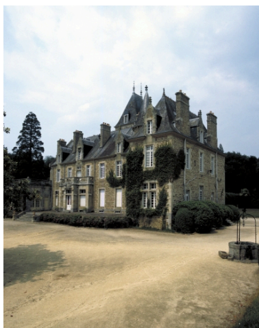
Vue générale sud-est IVR53_19992200320XA