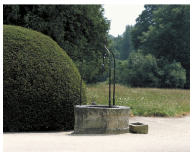
Puits IVR53_19992200321XA