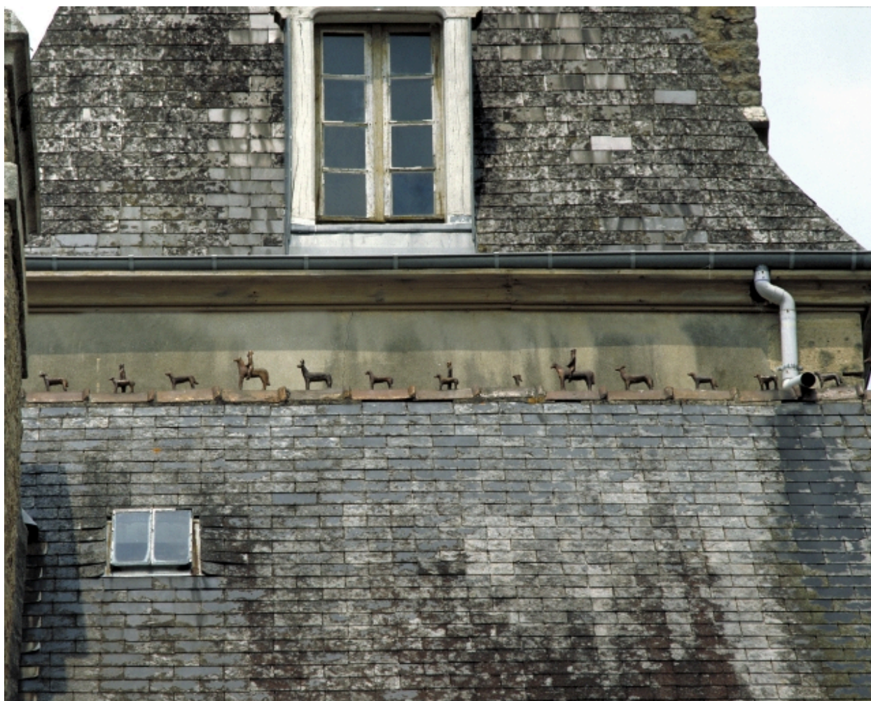
Détail du faîtage de l'aile ouest : chasse à courre