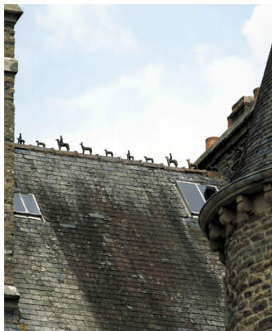
Détail du faîtage de l'aile ouest : chasse à courre