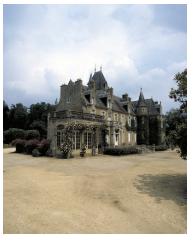
Vue générale sud-ouest IVR53_19992200318XA