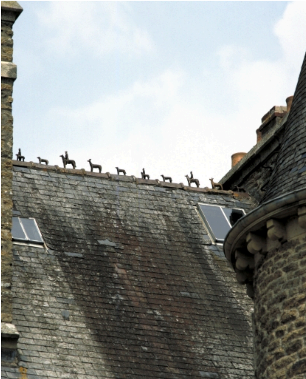
Détail du faîtage de l'aile ouest : chasse à courre