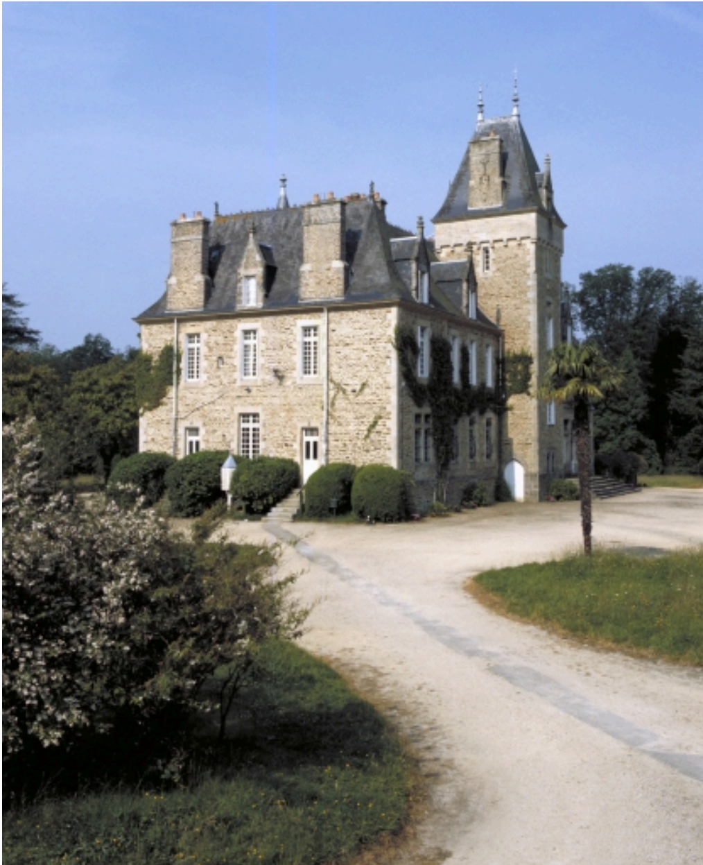
vue générale nord-est