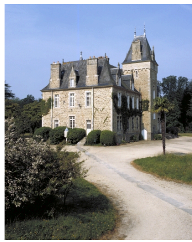
vue générale nord-est