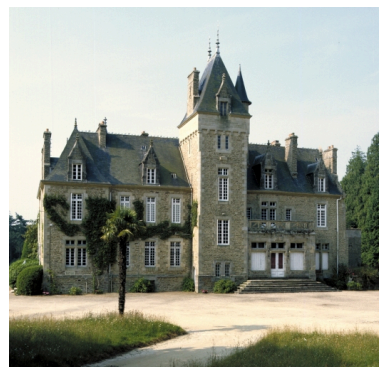
Vue générale nord IVR53_19992200309XA