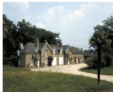
Vue générale des dépendances est IVR53_19992200316XA