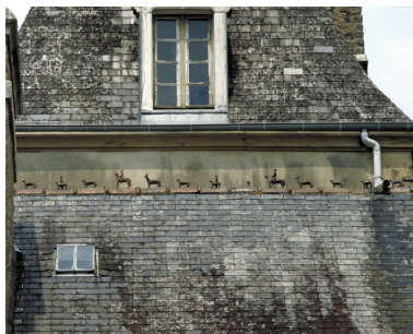
Détail du faîtage de l'aile ouest : chasse à courre