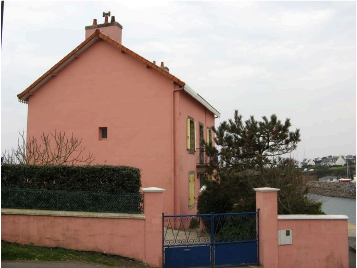
La Maison rose, pignon est