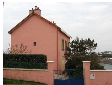
La Maison rose, pignon est IVR53_20072909025NUCA