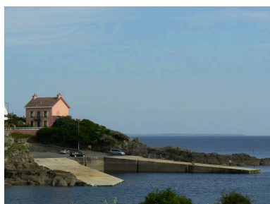
Vue d'ensemble de la Maison rose et des cales Cayenne et Larzul