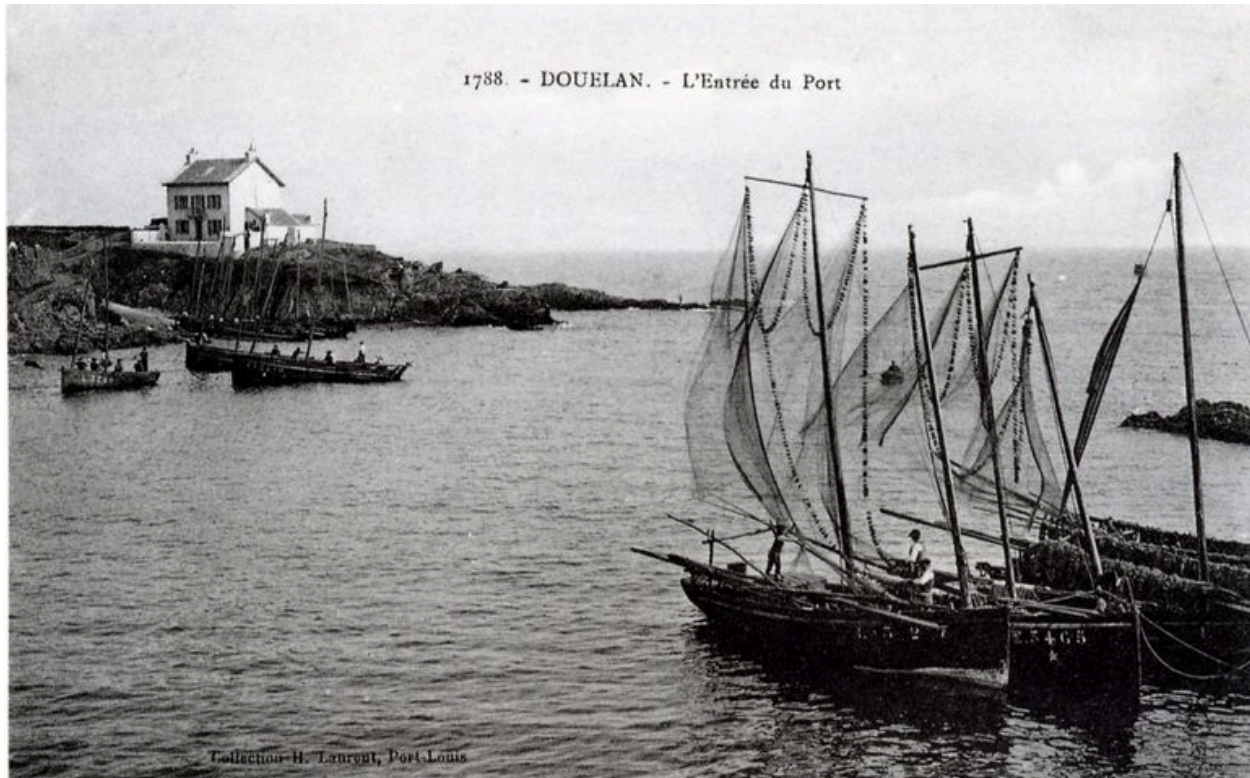
Maison rose, avant 1920