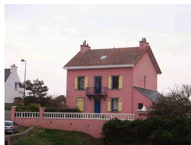
Vue générale de la Maison rose