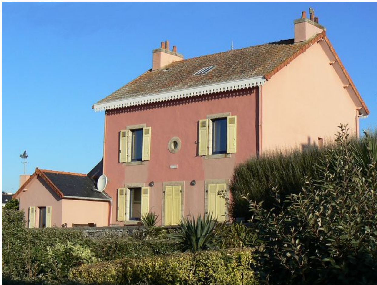
La Maison rose côté mer