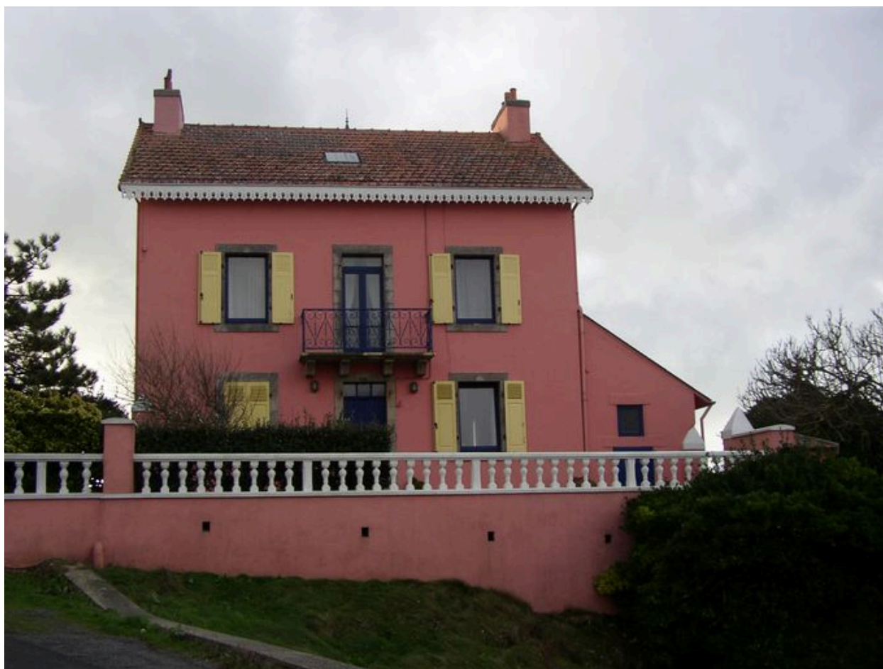
La Maison rose côté ancienne conserverie Capitaine Cook