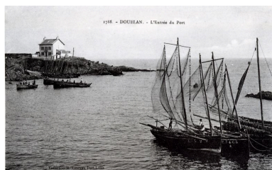
Maison rose, avant 1920 IVR53_20092909052NUCB