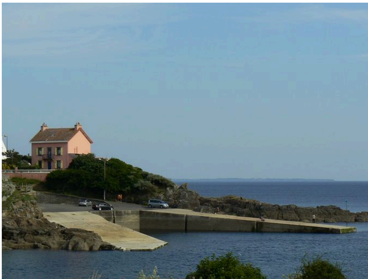
Vue d'ensemble de la Maison rose et des cales Cayenne et Larzul