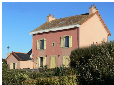
La Maison rose côté mer