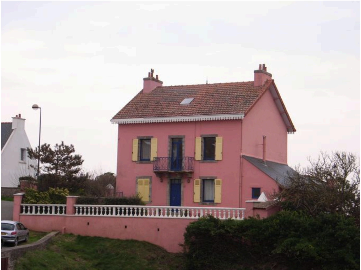
Vue générale de la Maison rose