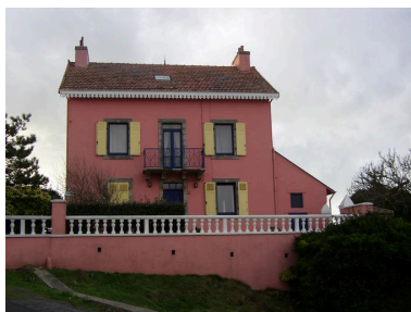
La Maison rose côté ancienne conserverie Capitaine Cook