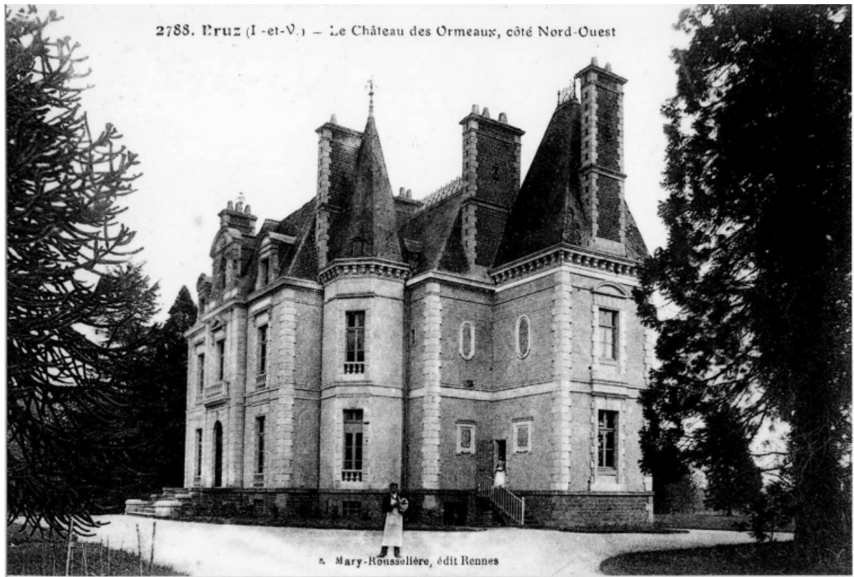
Carte postale : le château des Ormeaux, côté Nord-Ouest