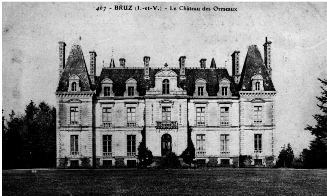
Fonds Lagrée - Carte postale ancienne - 407 - Bruz - Le Château des Ormeaux.