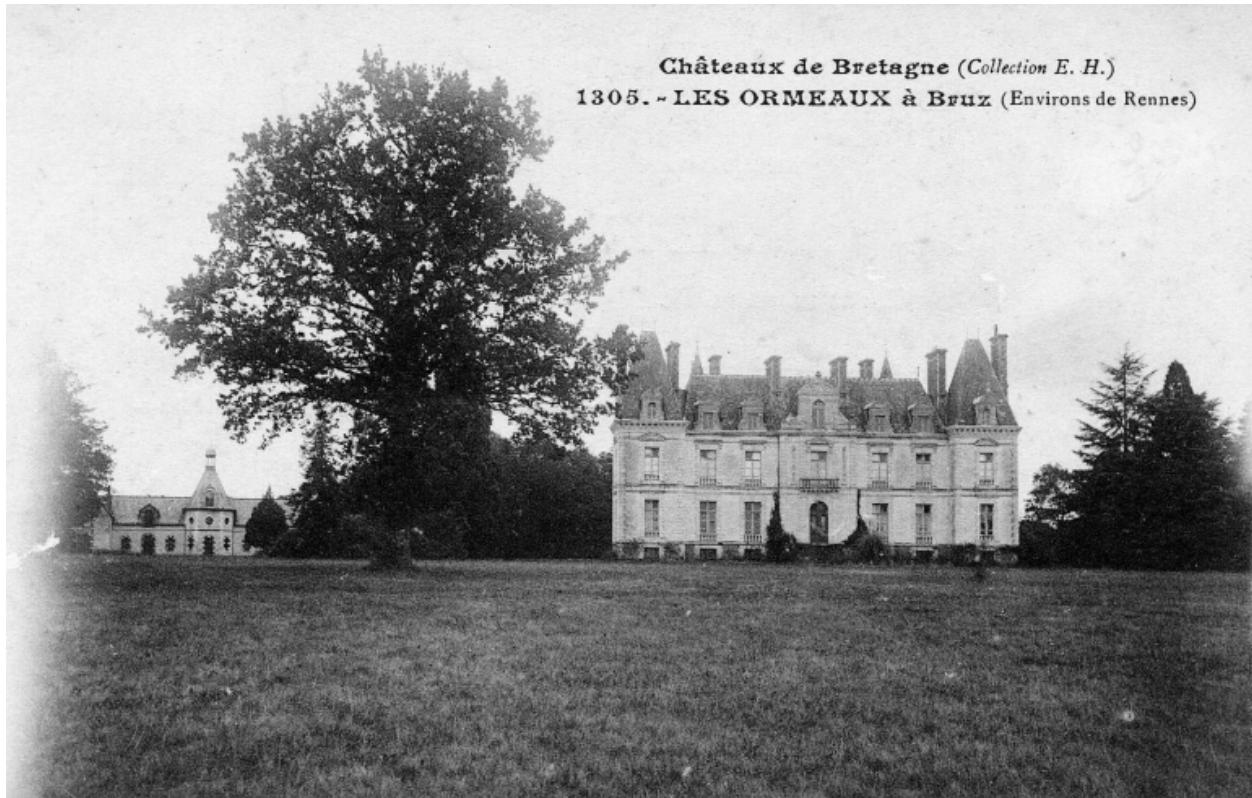
Carte postale ancienne : les Ormeaux à Bruz