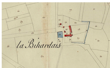
Ancien manoir de la Bihardais sur le cadastre napoléonien, remplacé par le château des Ormeaux