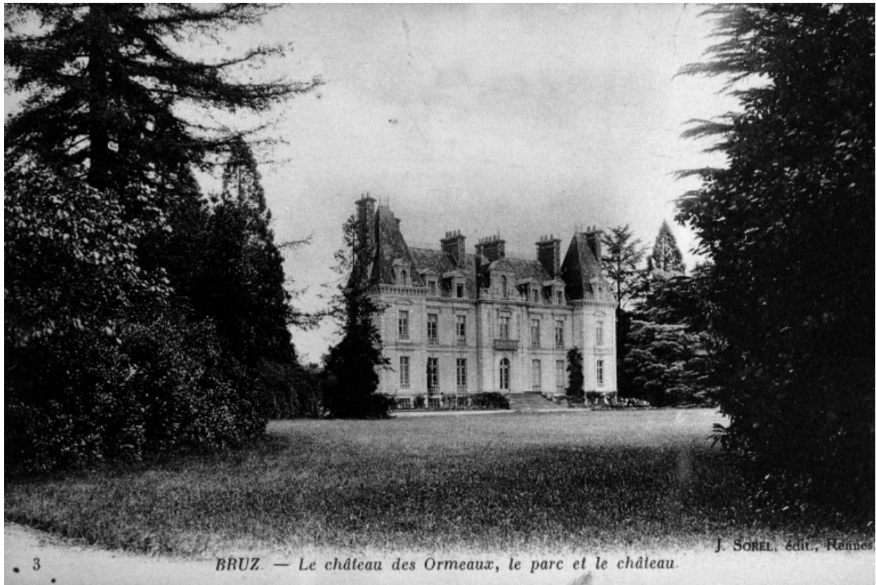
Fonds Lagrée - Carte postale ancienne - Bruz - Le Château des Ormeaux, le parc et le château.