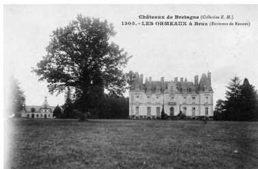
Carte postale ancienne : les Ormeaux à Bruz IVR53_20083508126NUCB