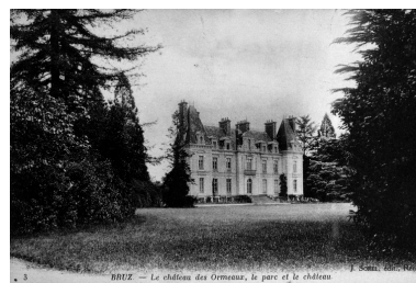
Carte postale ancienne - Bruz - Le Château des Ormeaux, le parc et le château., IVR53_19883500103X