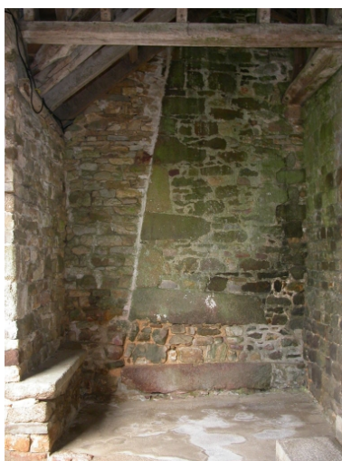
Vue du porche IVR53_20053506209NUCA