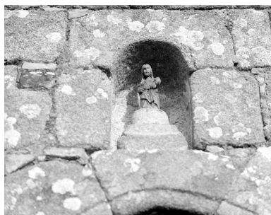
Elévation Ouest, porte : détail de la statuette