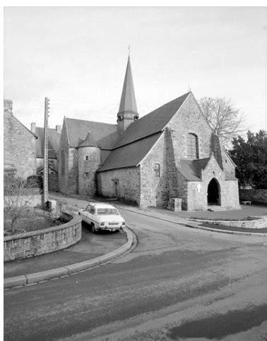
Elévation Nord-Ouest : vue générale IVR53_19943500061X