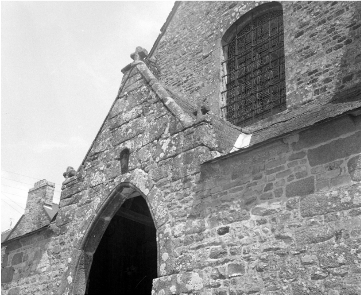
Etat en 1971, détail du porche ouest