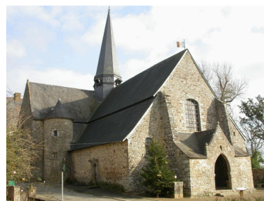
Vue générale nord-ouest IVR53_20053506203NUCA