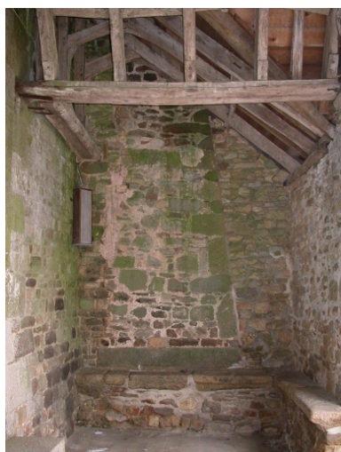
Le porche IVR53_20053506210NUCA