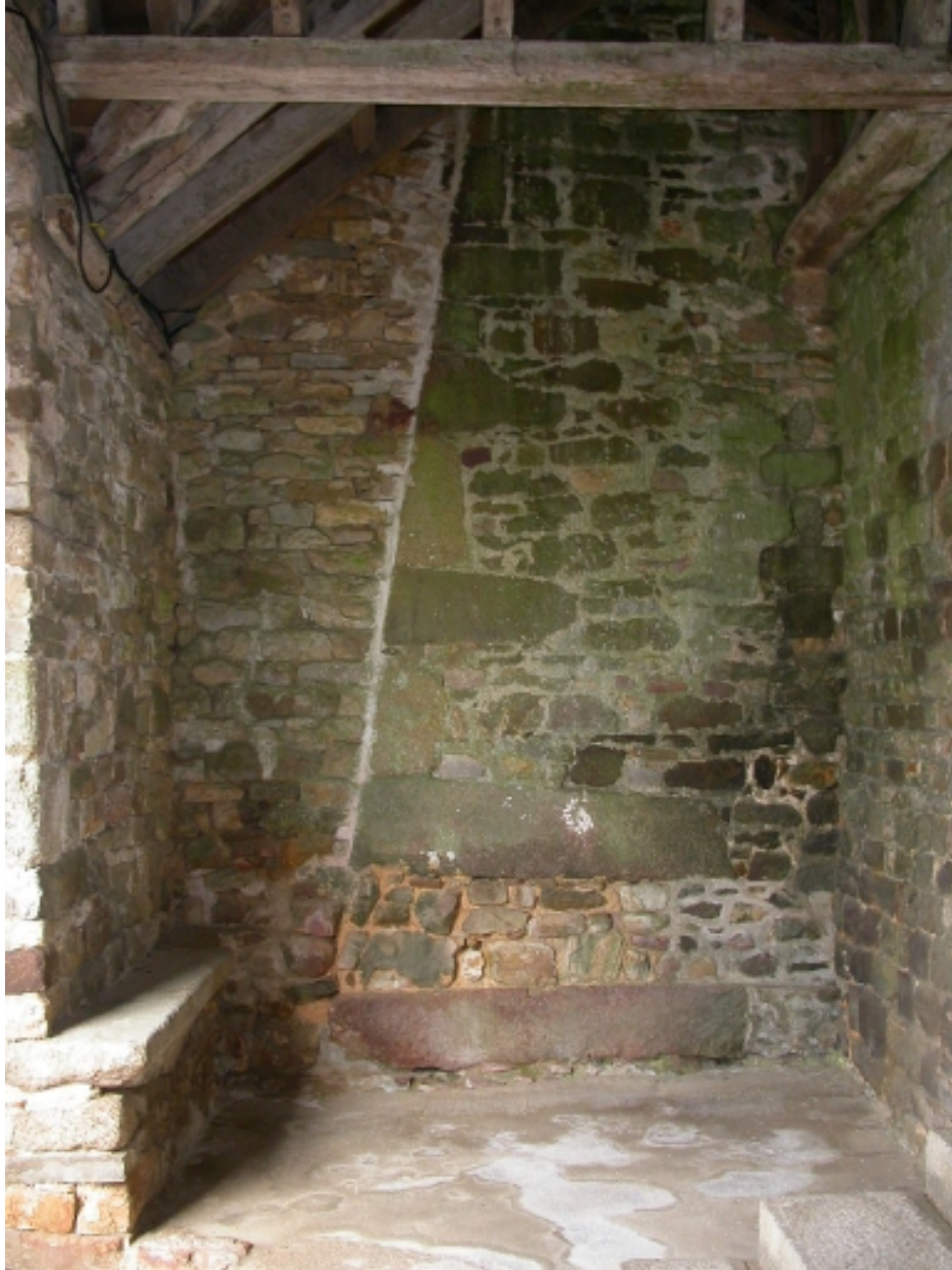
Vue du porche