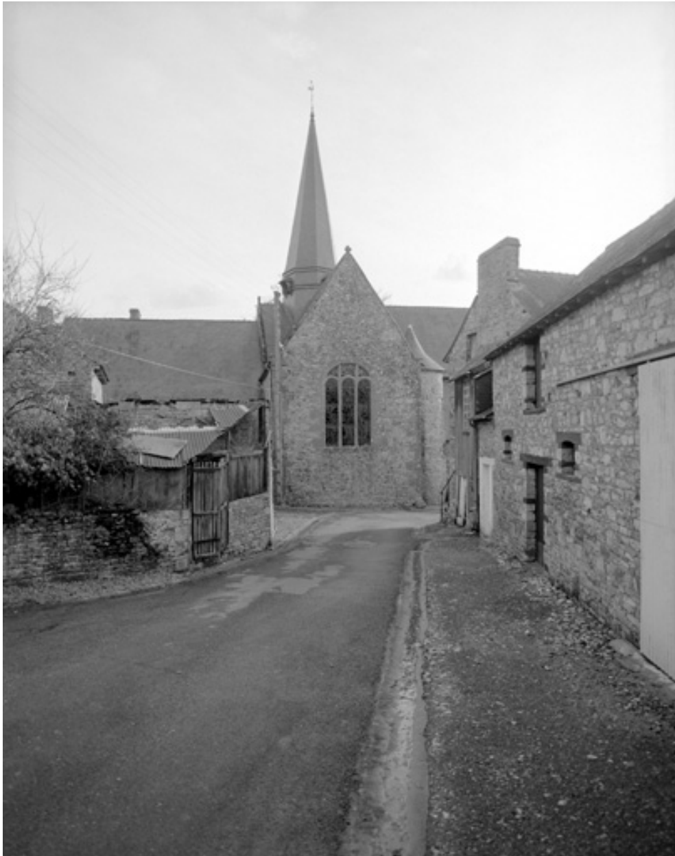
Elévation Nord, bras Nord du transept : vue générale