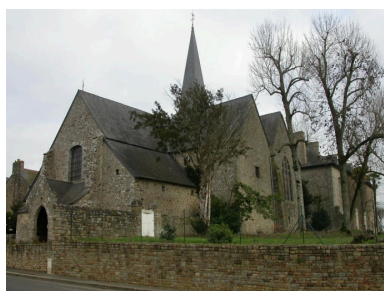
Vue sud-ouest IVR53_20053506204NUCA