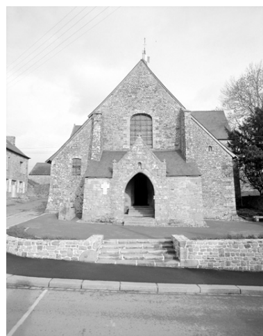
Elévation Ouest : vue générale IVR53_19943500064X