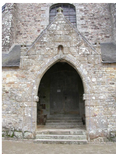
Portail ouest IVR53_20053506205NUCA