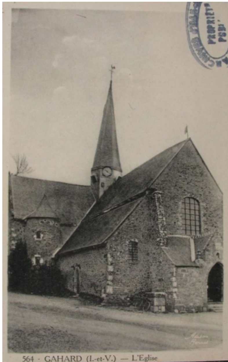
L'église sur une carte postale ancienne