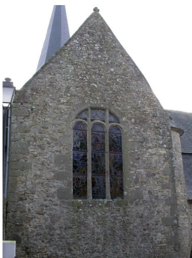
Transept nord IVR53_20053506206NUCA