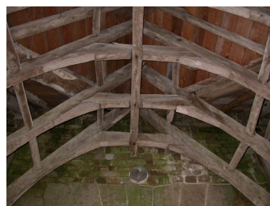
Charpente du porche IVR53_20053506211NUCA