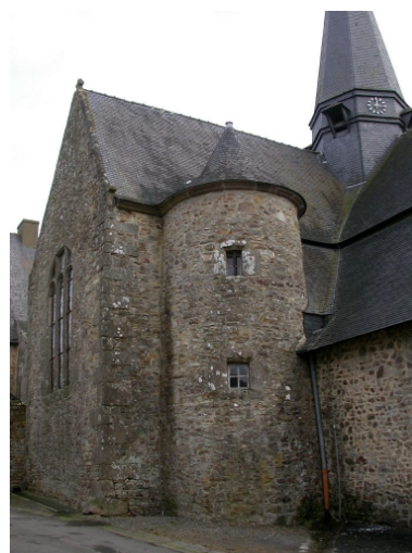
Tourelle d'escalier située sur la façade nord