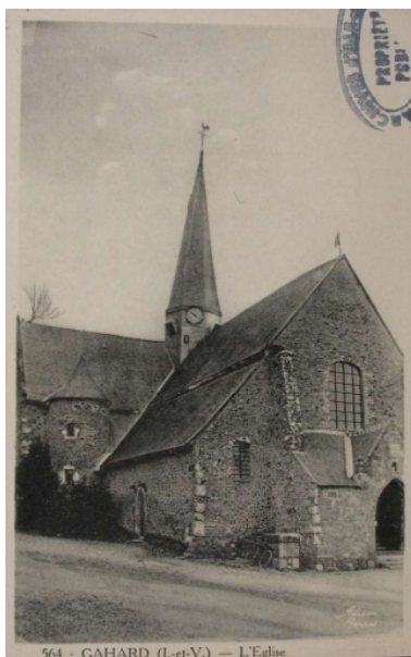
L'église sur une carte postale ancienne