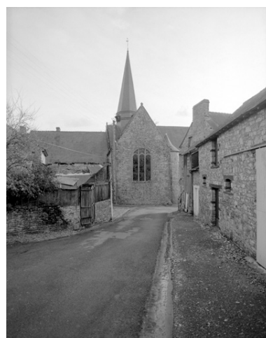
Elévation Nord, bras Nord du transept : vue générale IVR53_19943500062X