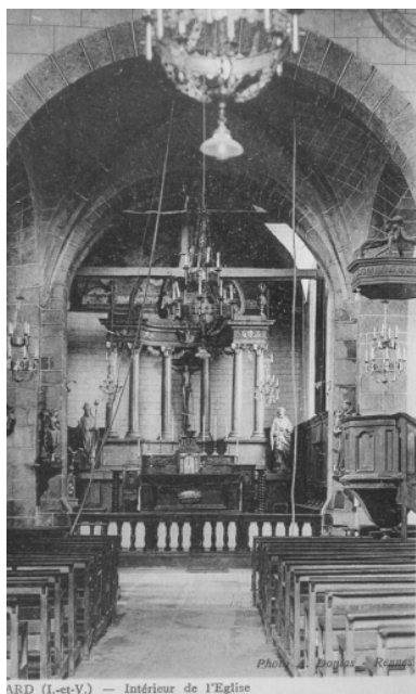
L'intérieur de l'église sur une carte postale du début du 20e siècle