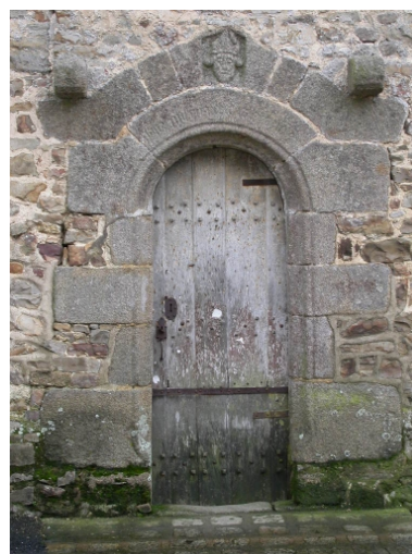
Porte nord