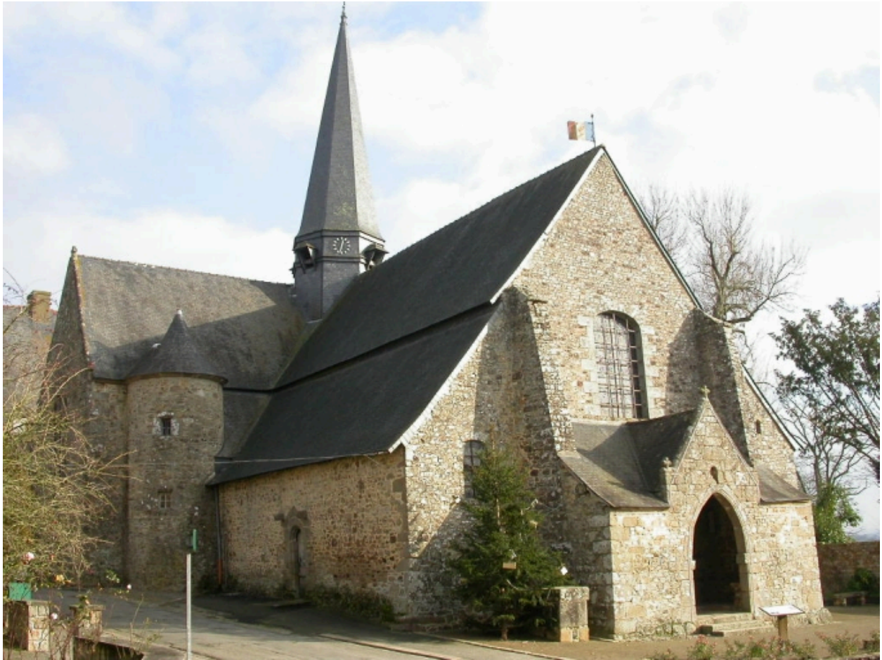
Vue générale nord-ouest