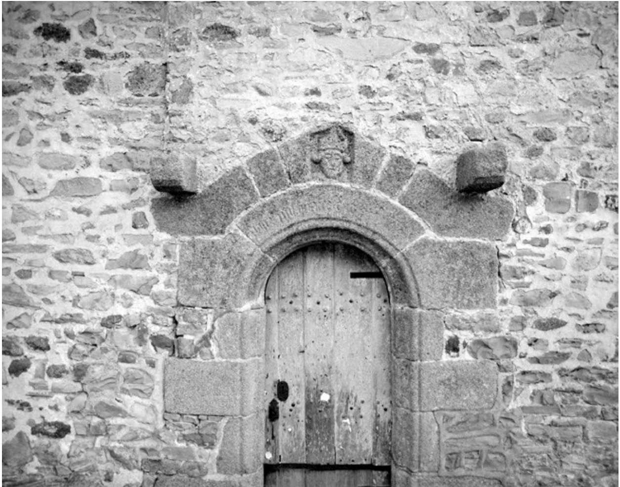
Elévation Nord, porte : détail de l'inscription