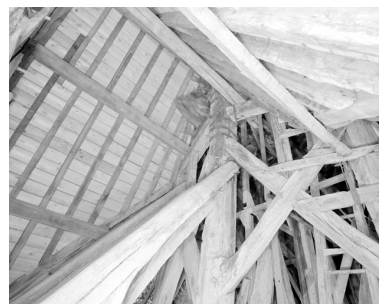
Clocher, combles : détail de la charpente IVR53_19943500070X