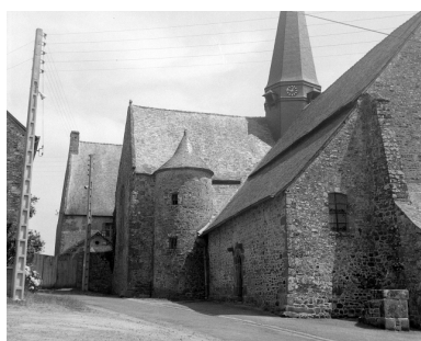
Etat en 1971, vue nord-ouest IVR53_19713500504Z