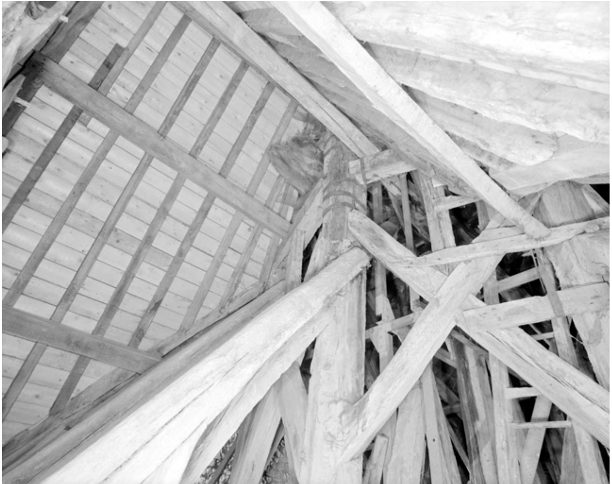
Clocher, combles : détail de la charpente