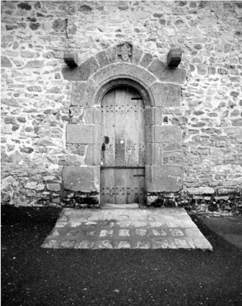
Elévation Nord : vue générale