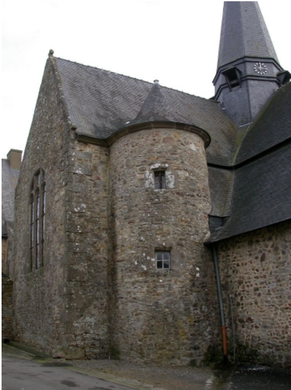
Tourelle d'escalier située sur la façade nord