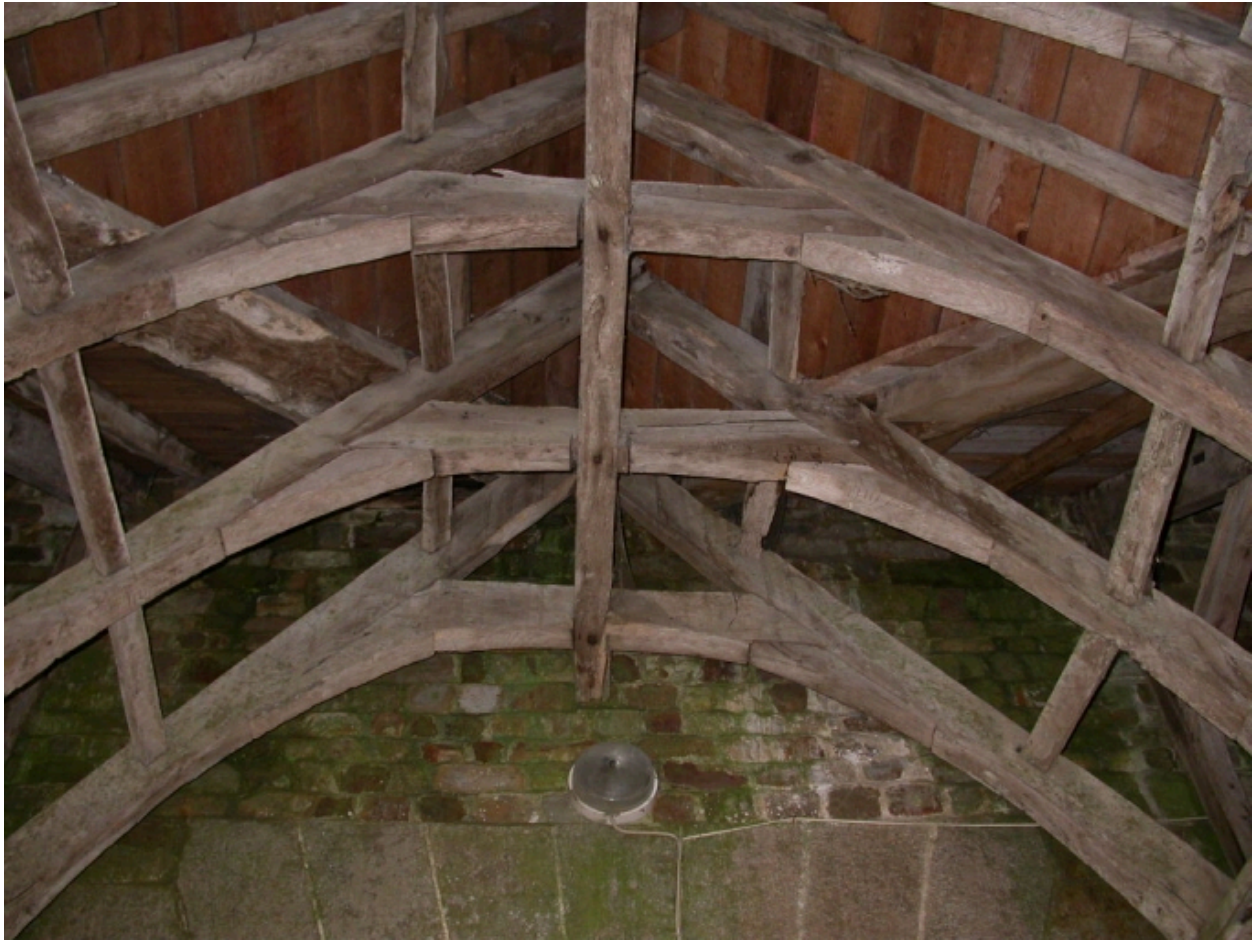
Charpente du porche