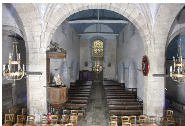
Vue intérieure prise de la nef vers le chœur IVR53_20053500573NUCA