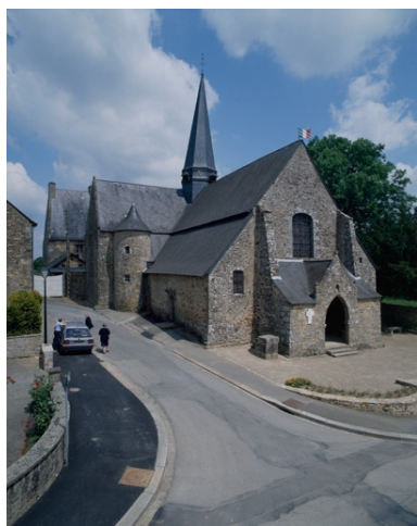
Elévation Nord-Ouest : vue générale