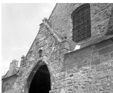
Etat en 1971, détail du porche ouest IVR53_19713500503Z