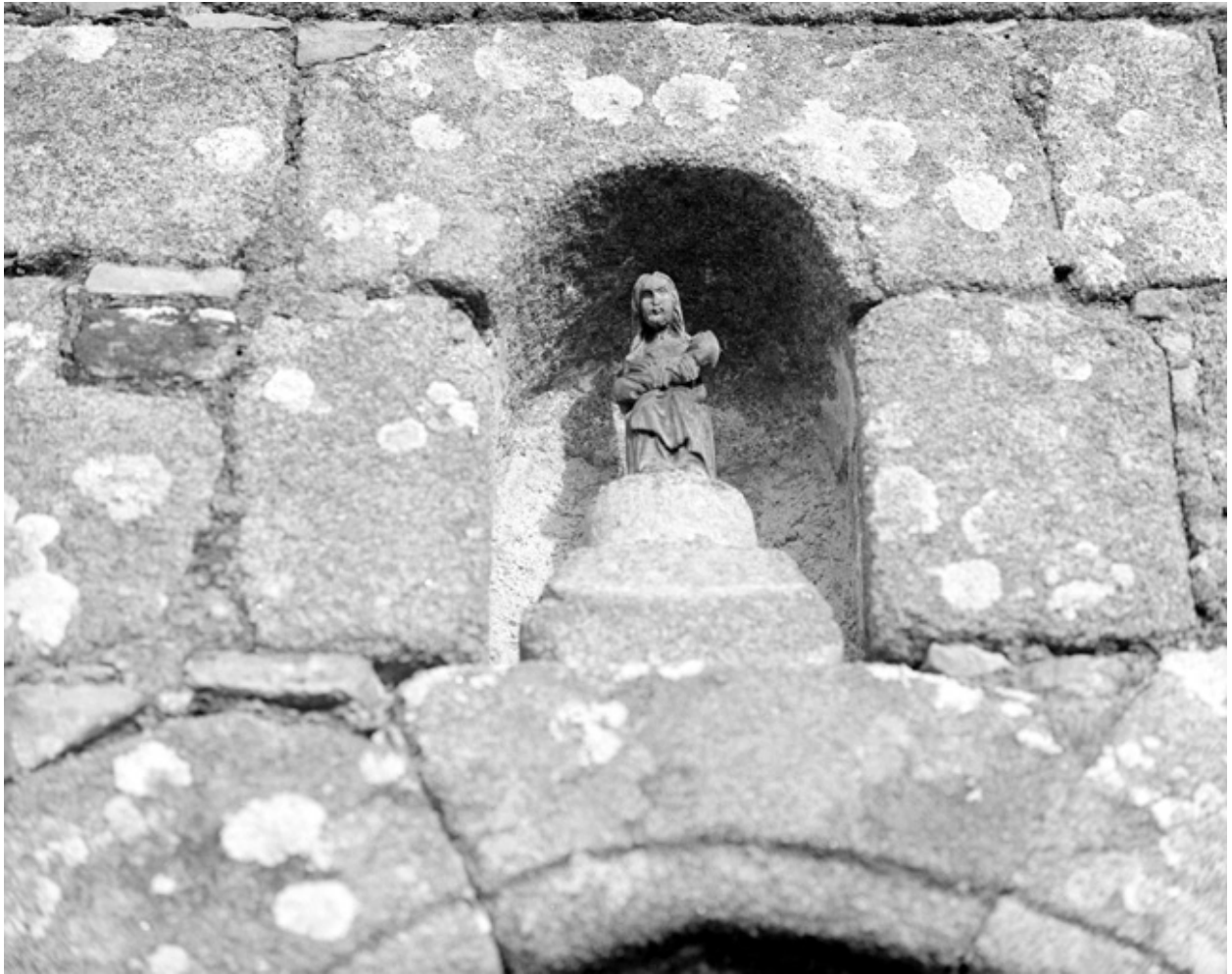
Elévation Ouest, porte : détail de la statuette