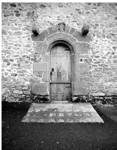
Elévation Nord : vue générale IVR53_19943500071X