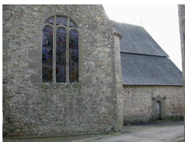
Vue nord IVR53_20053506207NUCA