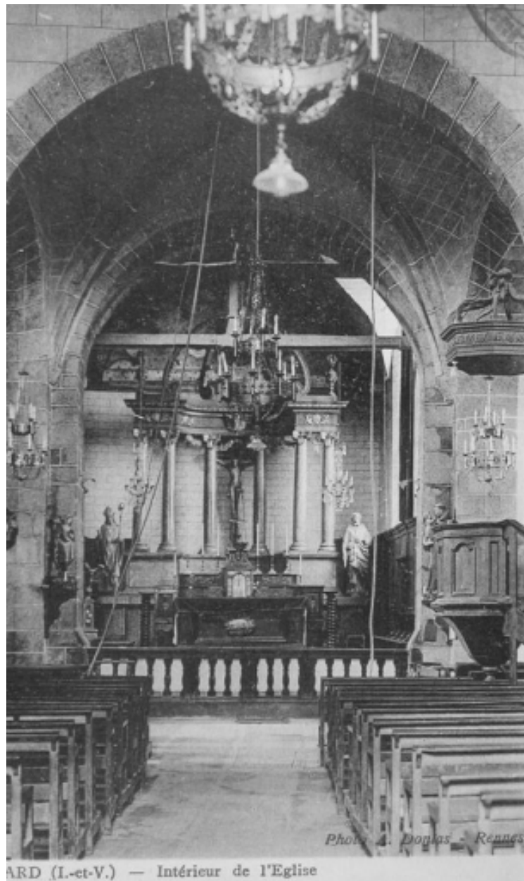
L'intérieur de l'église sur une carte postale du début du 20e siècle