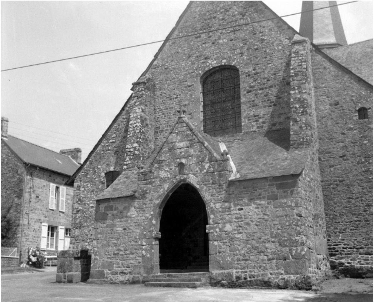
Etat en 1971, élévation ouest