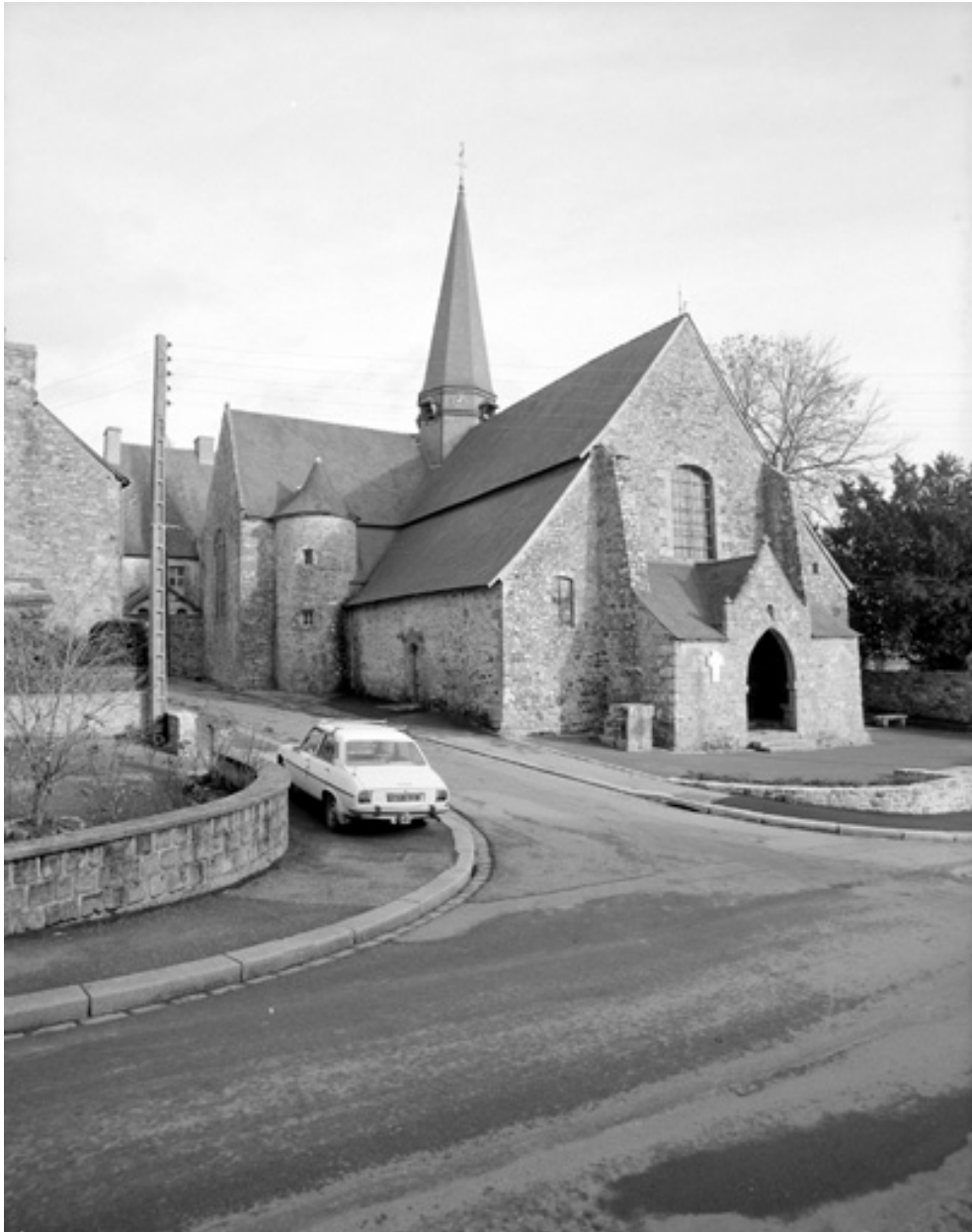
Elévation Nord-Ouest : vue générale