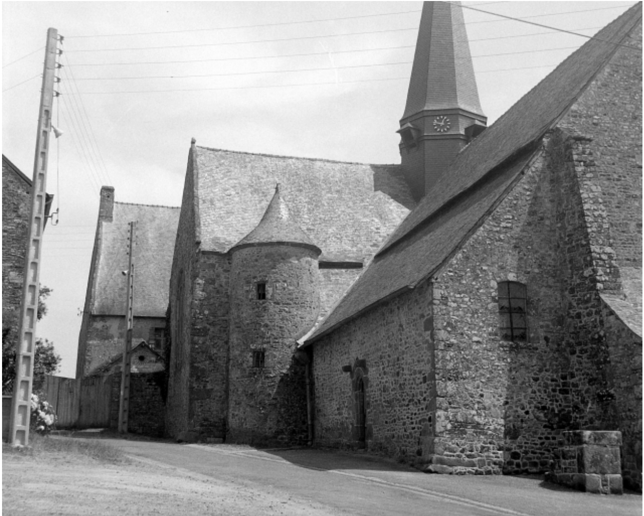
Etat en 1971, vue nord-ouest