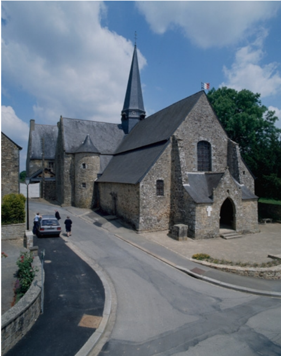
Elévation Nord-Ouest : vue générale