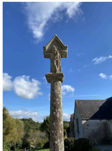
Face ouest, détail IVR53_20265610897NUCA