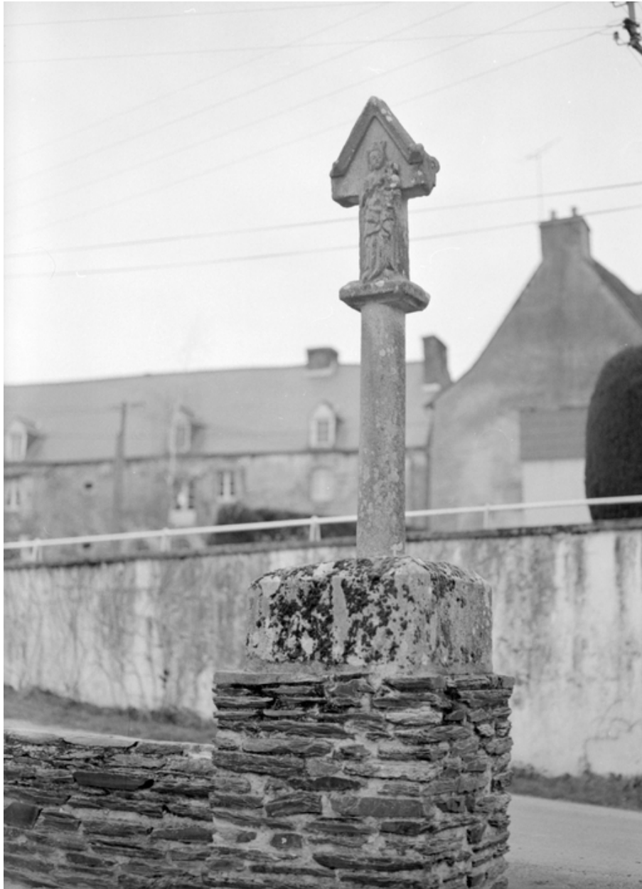
Croix de chemin : face portant la Vierge à l'Enfant (état en 1985)