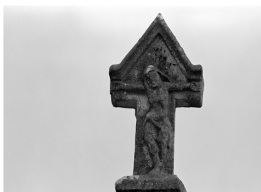
Croix de chemin : Christ en croix (état en 1985)