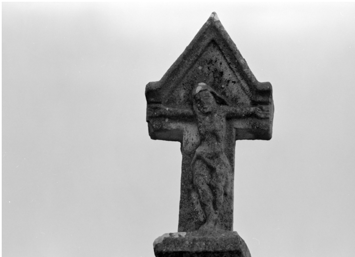
Croix de chemin : Christ en croix (état en 1985)