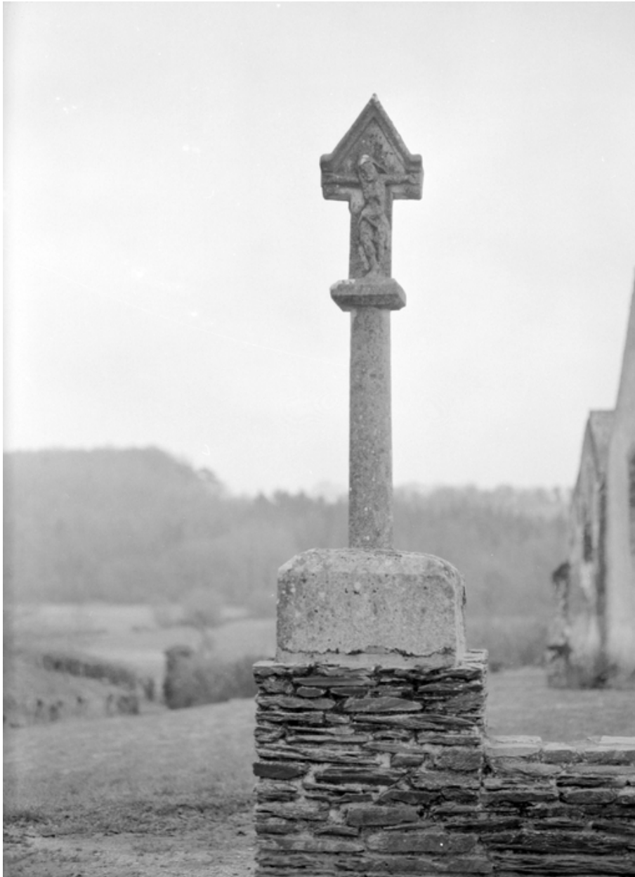
Croix de chemin : face portant le Christ en croix (état en 1985)