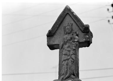
Croix de chemin : Vierge à l'Enfant (état en 1985) IVR53_19855600236X