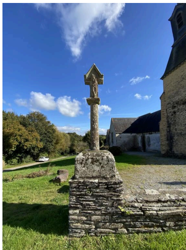
Face ouest, vue générale IVR53_20265610896NUCA