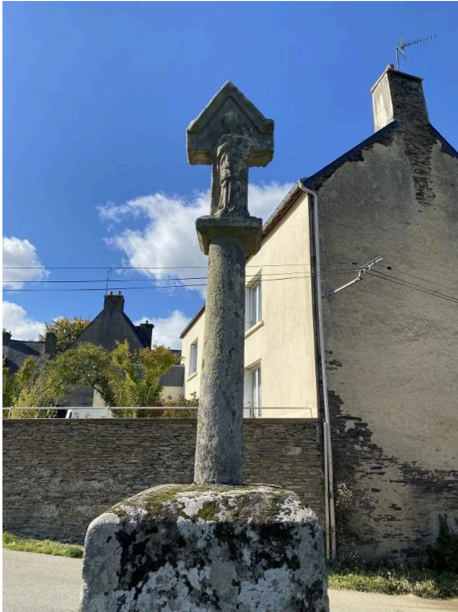
Face est, détail