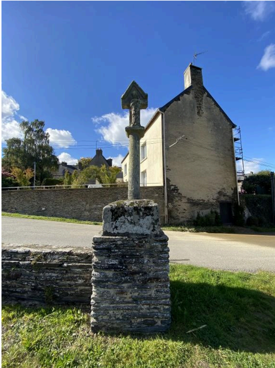
Face est, vue générale