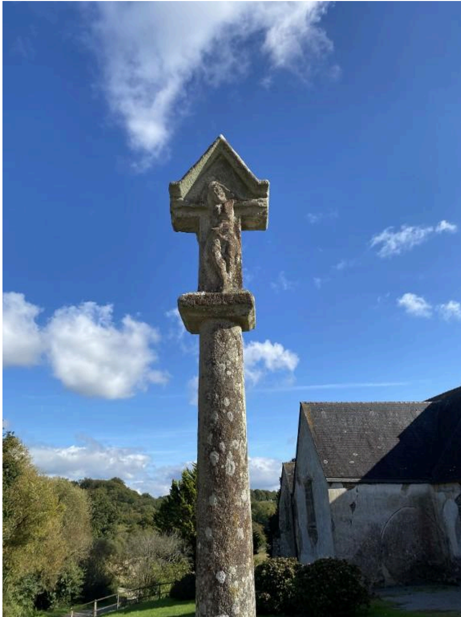
Face ouest, détail