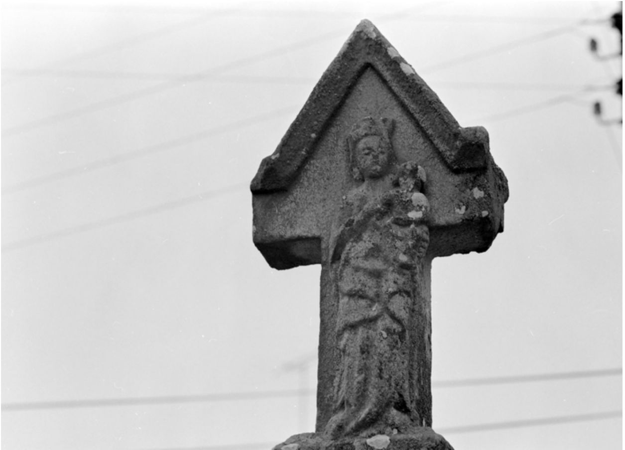
Croix de chemin : Vierge à l'Enfant (état en 1985)