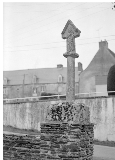
Croix de chemin : face portant la Vierge à l'Enfant (état en 1985)