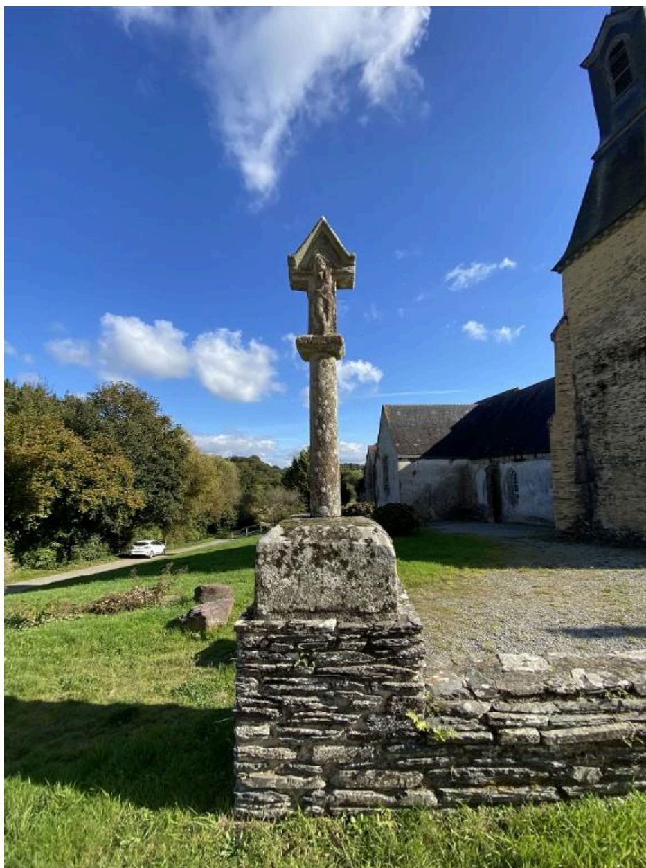
Face ouest, vue générale