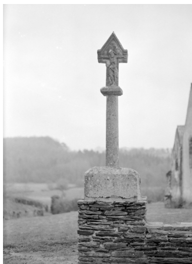
Croix de chemin : face portant le Christ en croix (état en 1985)