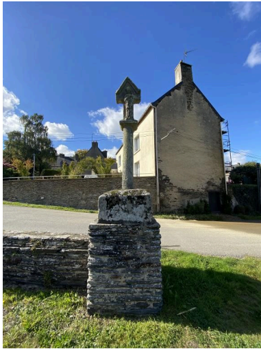
Face est, vue générale IVR53_20265610898NUCA