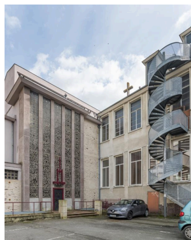
Bâtiment de 1951 et chœur de la chapelle vus du nord IVR53_20183500103NUCA