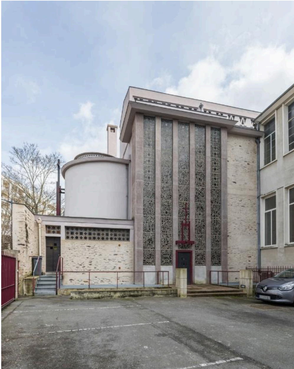
Choeur de la chapelle