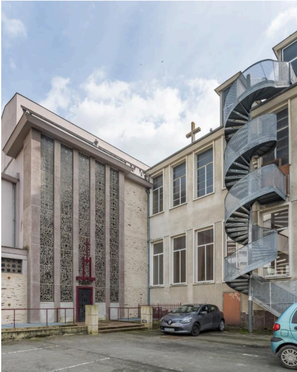
Bâtiment de 1951 et chœur de la chapelle vus du nord