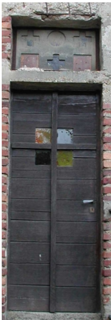
Détail sur la porte de la sacristie