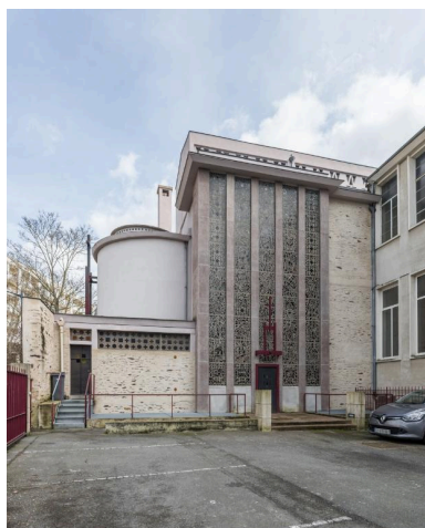
Chœur de la chapelle IVR53_20183500104NUCA