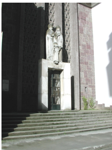
Détail du portail IVR53_20013520765NUCA