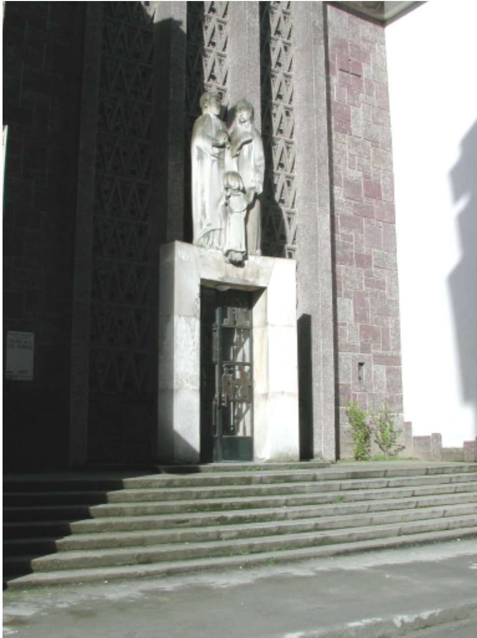
Détail du portail