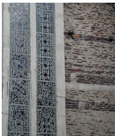
Détail sur le mur ouest