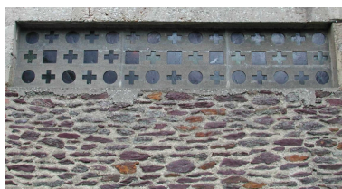
Détail du vitrail de la sacristie