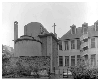
Vue du chevet