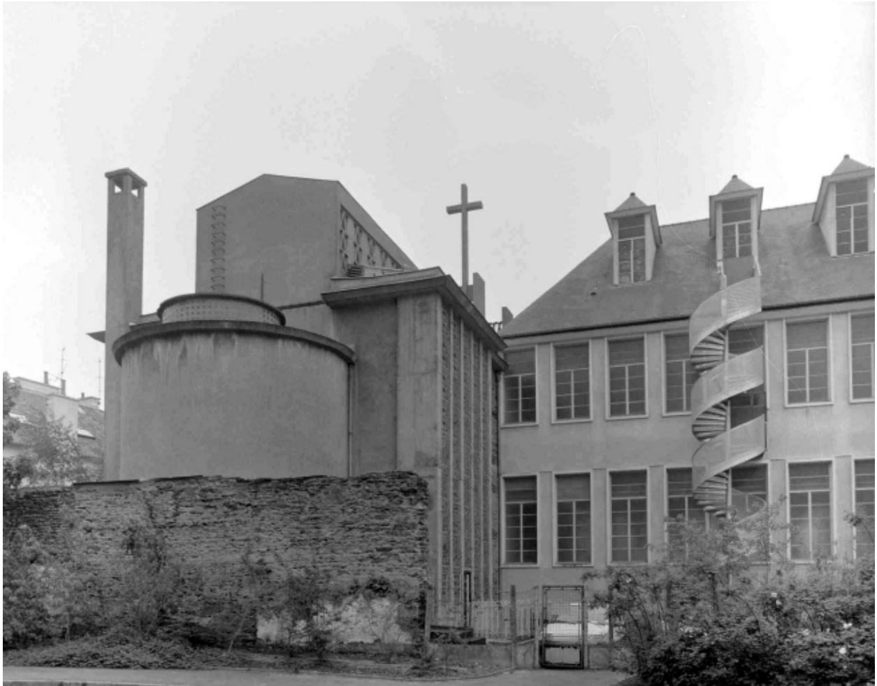
Vue du chevet