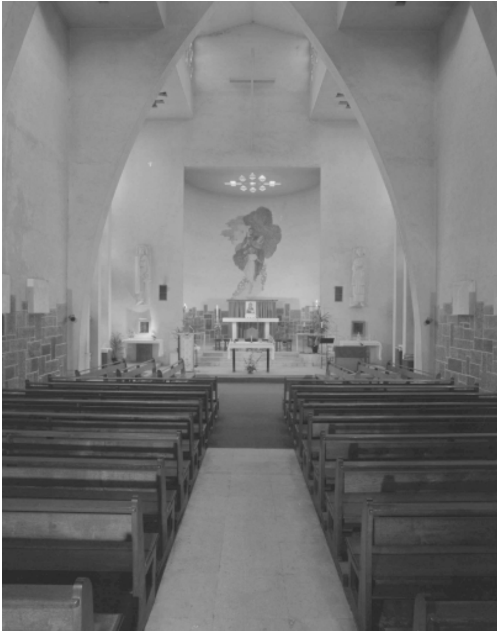
Vue intérieure vers le choeur