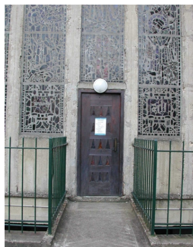
Détail sur la porte ouvrant sur le chœur