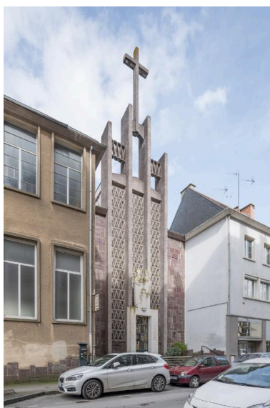
La façade de la chapelle IVR53_20183500100NUCA