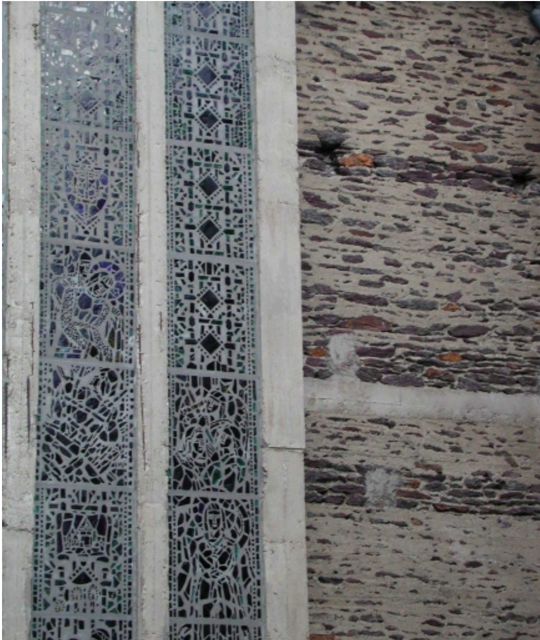
Détail sur le mur ouest