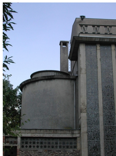
Détail sur la niche à éclairage zénithal