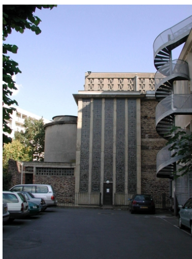
Vue du mur ouest du chœur IVR53_20013522292NUCA