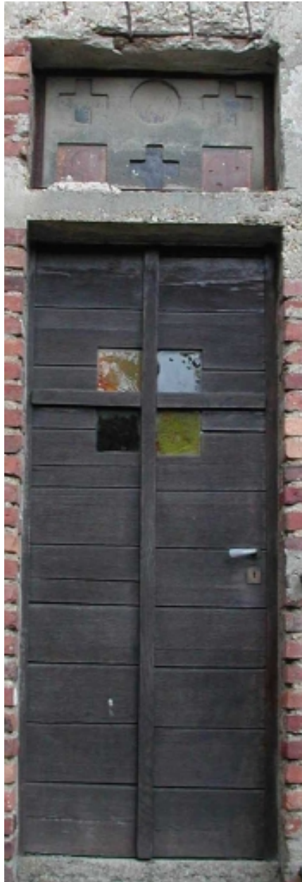
Détail sur la porte de la sacristie