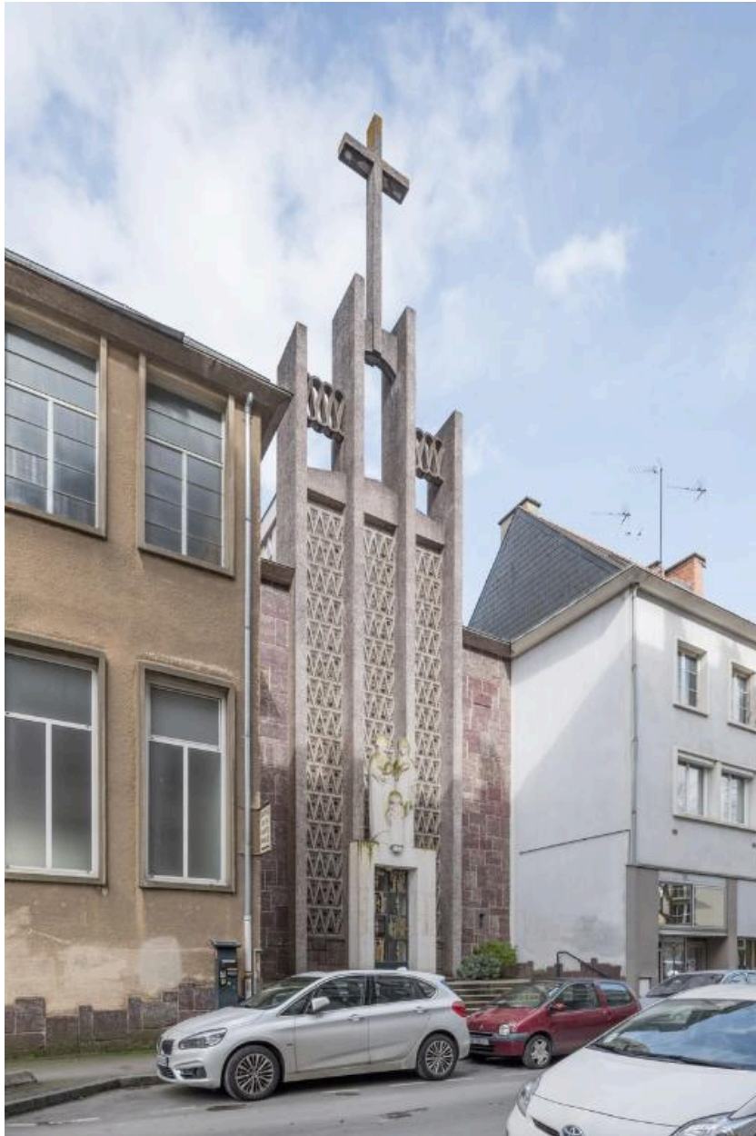
La façade de la chapelle