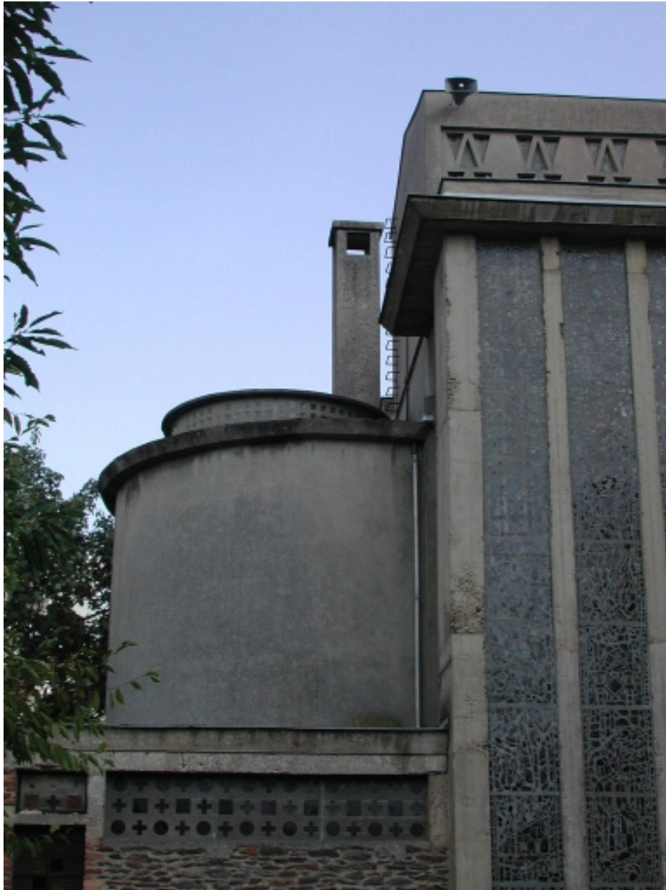
Détail sur la niche à éclairage zénithal