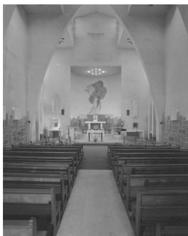
Vue intérieure vers le chœur IVR53_19933500397X