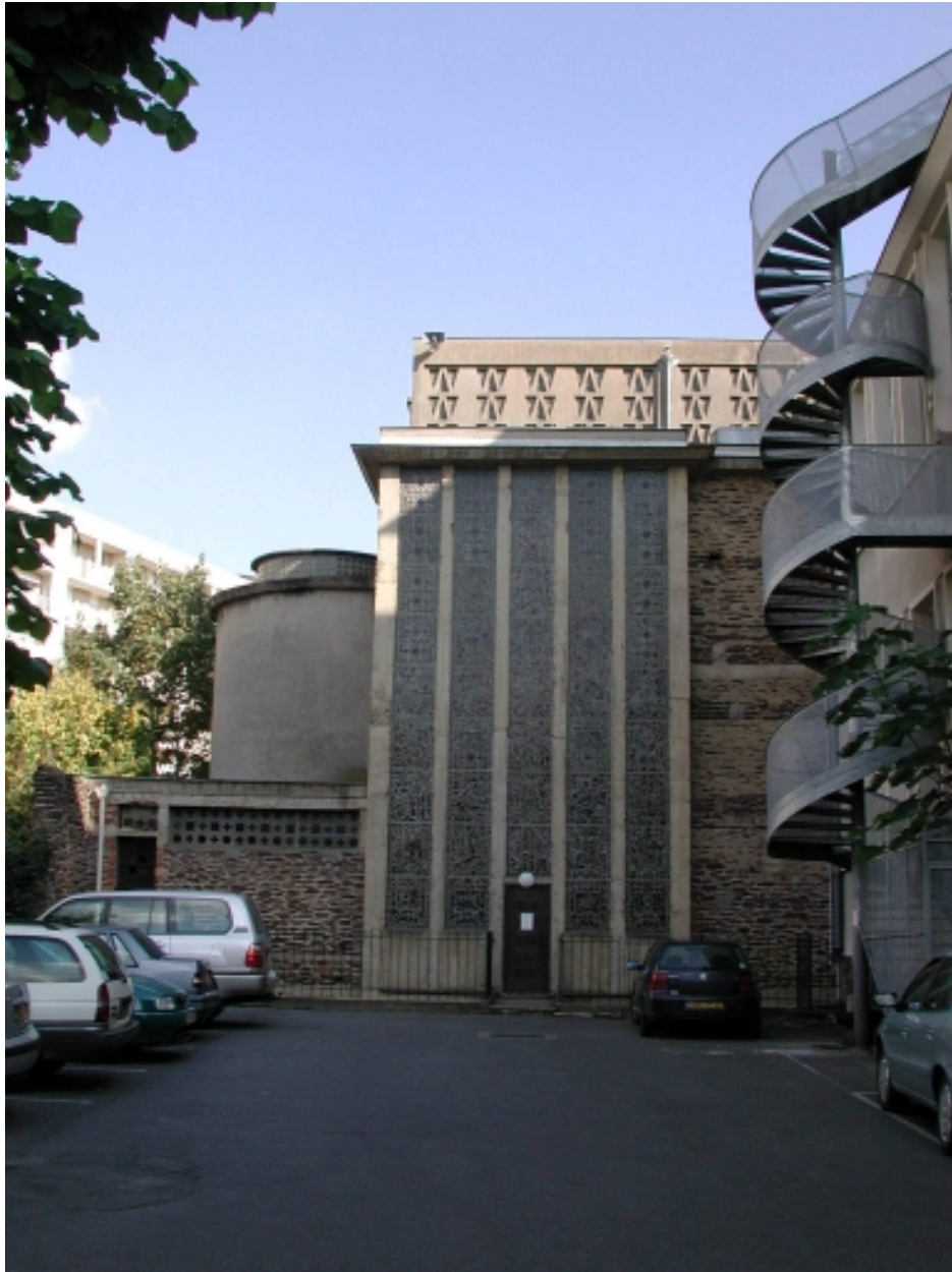
Vue du mur ouest du chœur