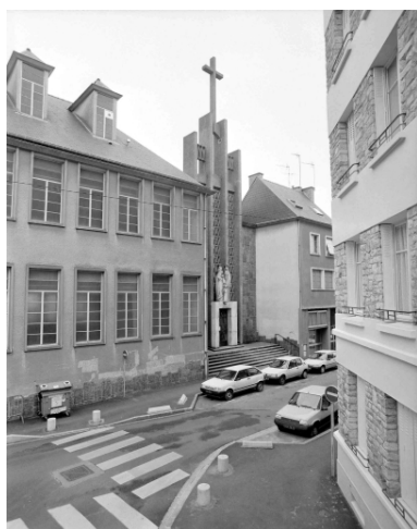
Vue de situation IVR53_19953500062X