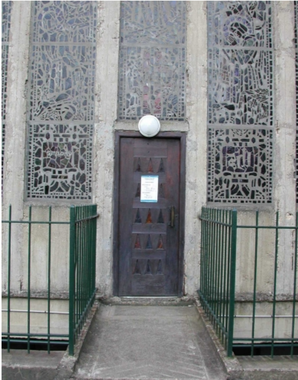
Détail sur la porte ouvrant sur le chœur