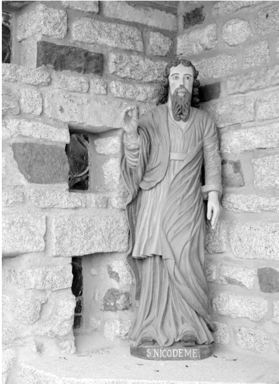
Statue : Saint Nicodème (état en 1984)