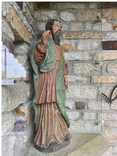
Vue générale IVR53_20265610967NUCA