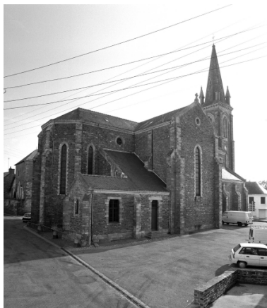
Le chœur : vue générale sud-ouest IVR53_19943505131X