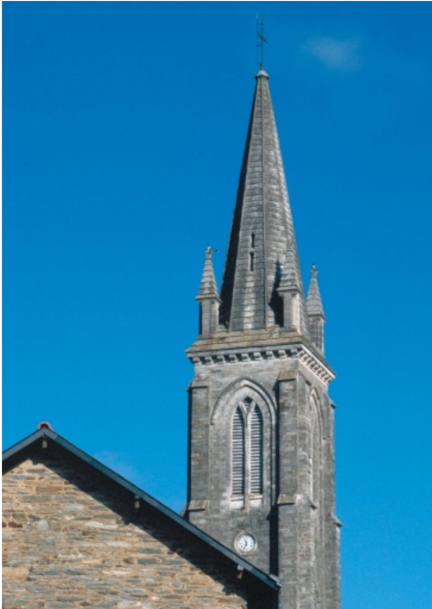
Le clocher : vue générale est