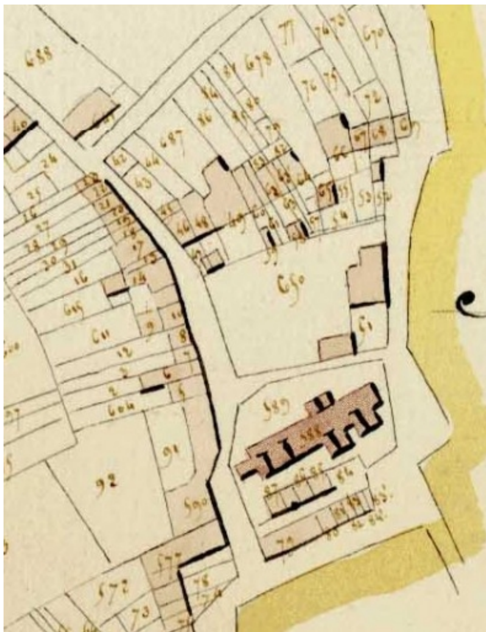
L'ancienne église sur le cadastre de 1818