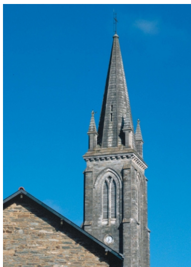
Le clocher : vue générale est