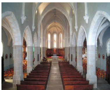
Vue intérieure prise de la nef vers le chœur IVR53_20013501352XA