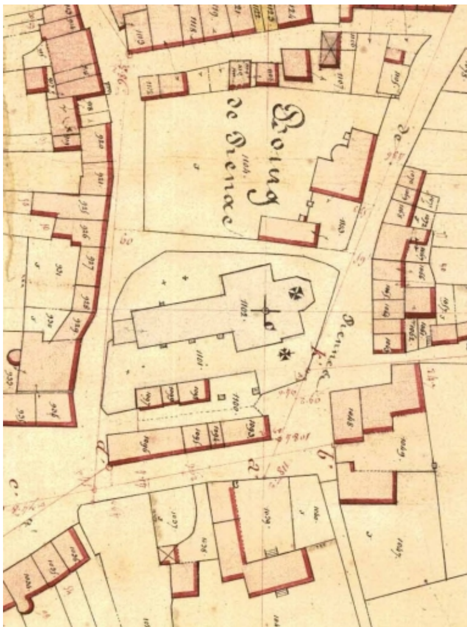
L'ancienne église sur le cadastre de 1843