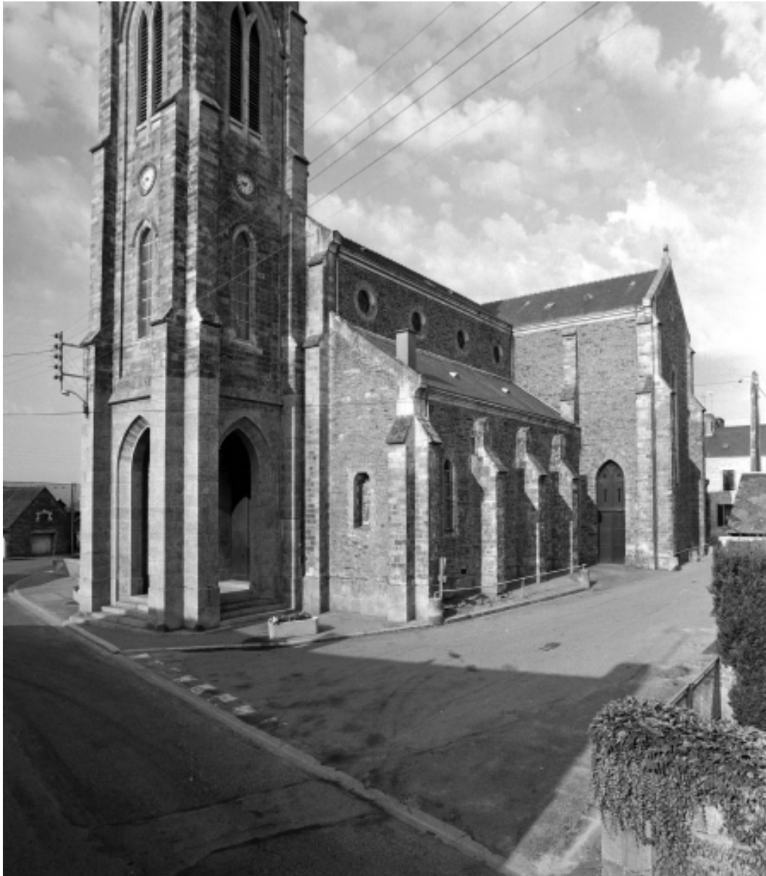
Le clocher-porche : vue générale nord-est