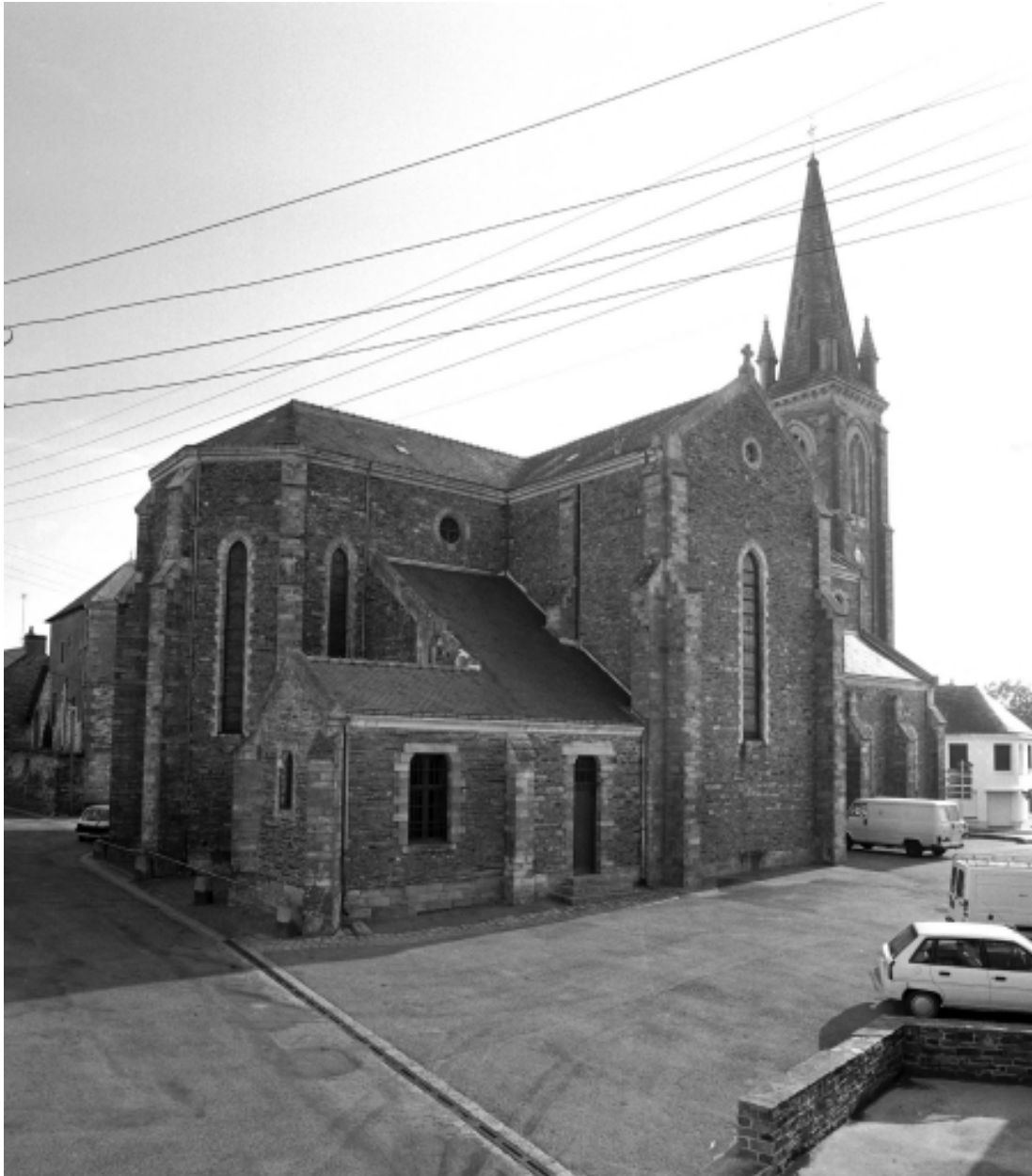
Le choeur : vue générale sud-ouest