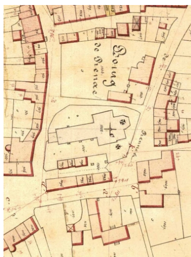
L'ancienne église sur le cadastre de 1843 IVR53_20013512108NUC