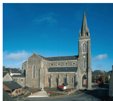
Vue générale sud IVR53_20013523961XA