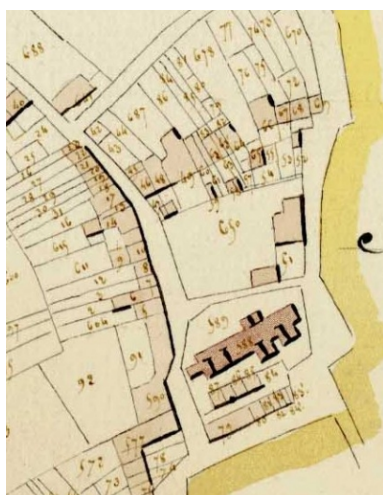
L'ancienne église sur le cadastre de 1818 IVR53_20013512107NUC